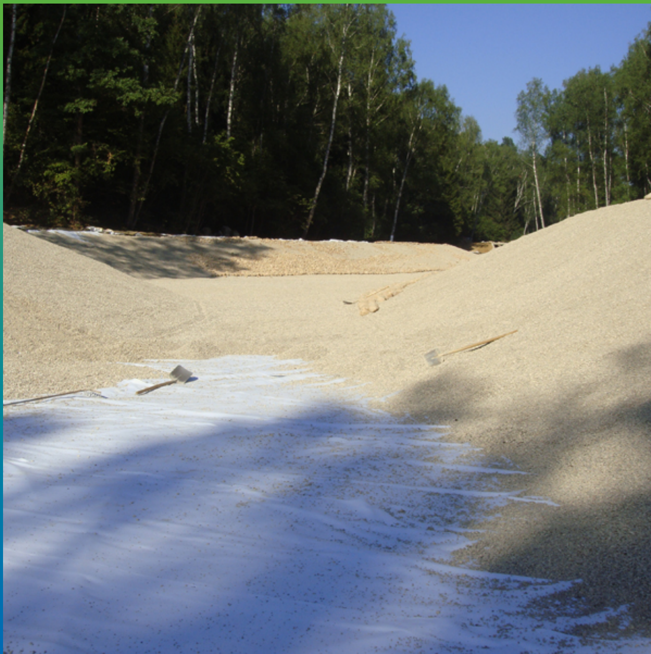
Укладка защитного слоя геотектиля перед засыпкой щебнем