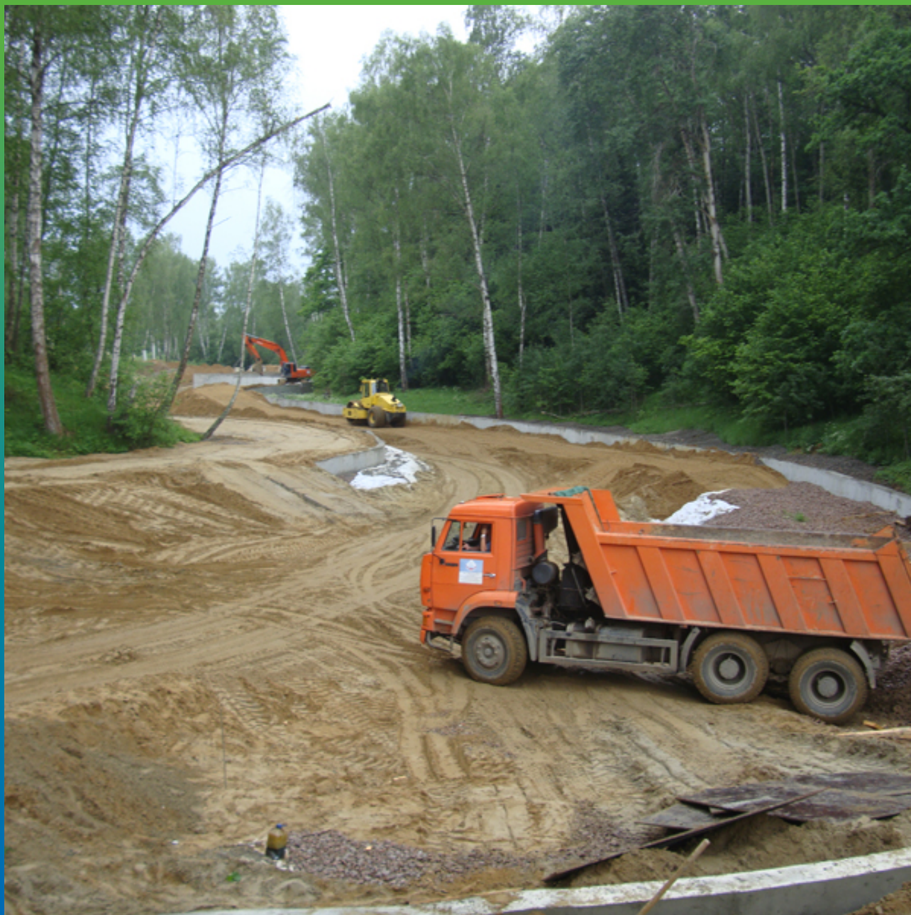
Устройство котлована и укрепление опорных стен