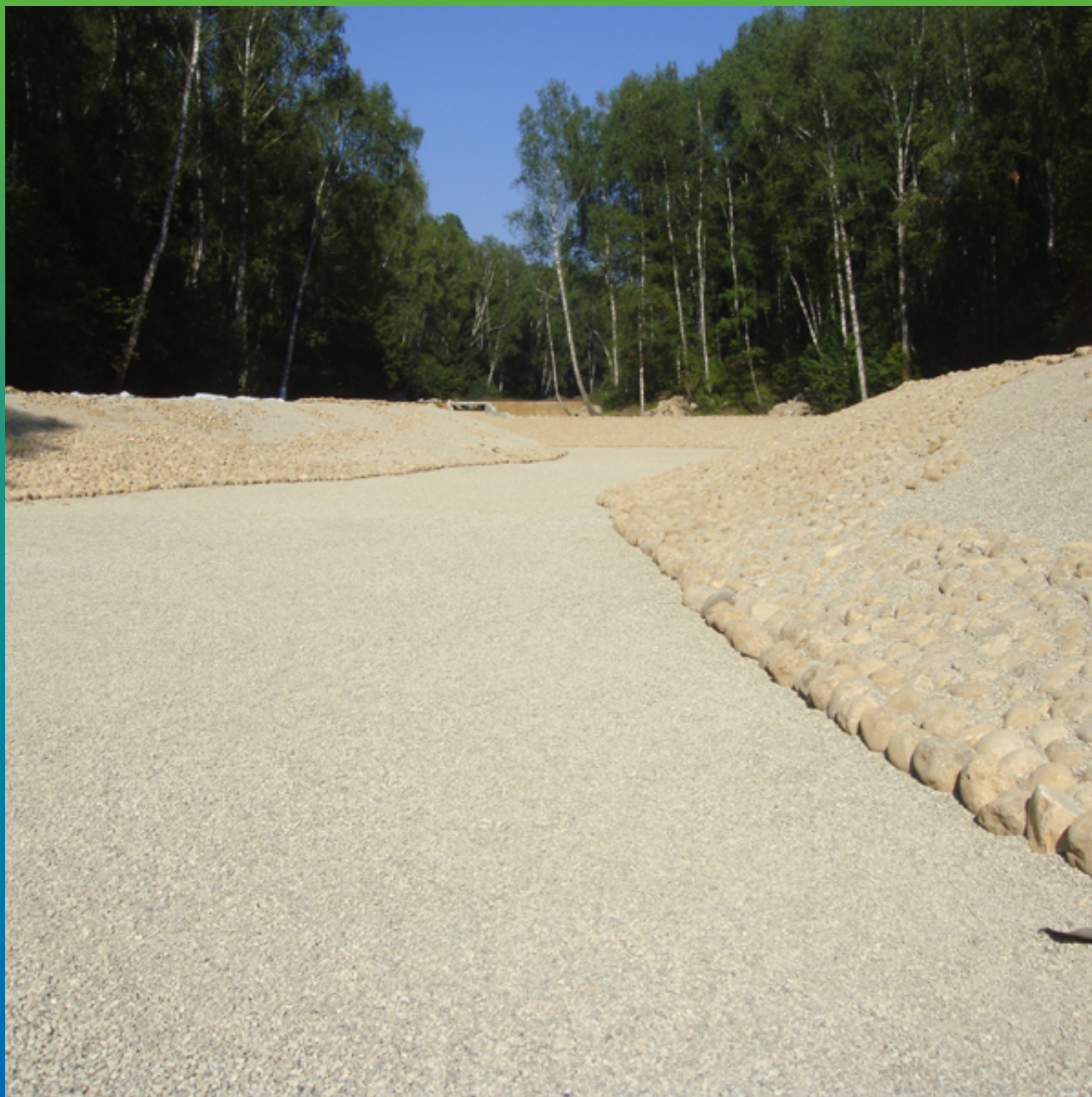
Устройство слоя с декоративным камнем