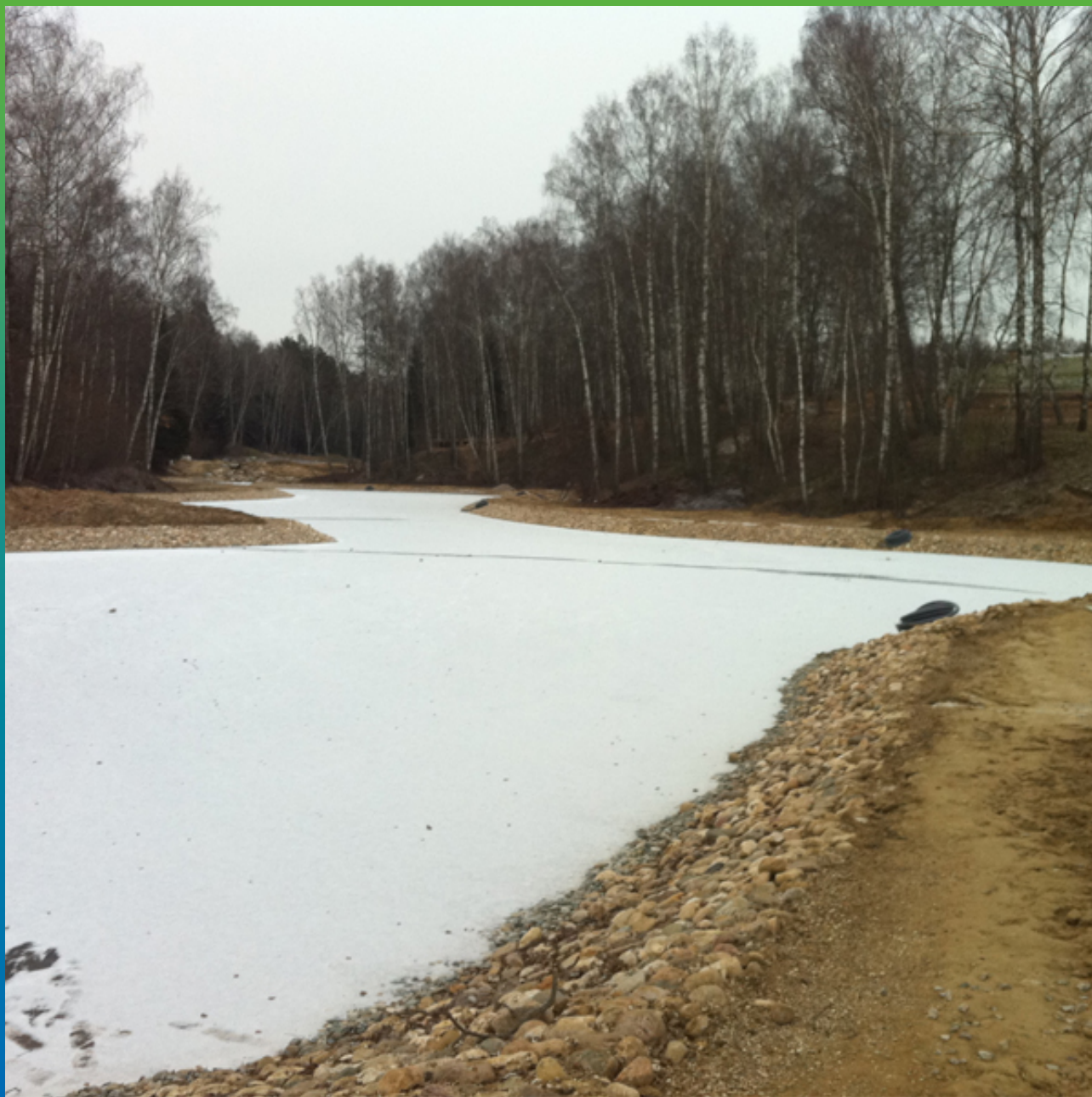
Общий вид водоема, Декабрь, 2011