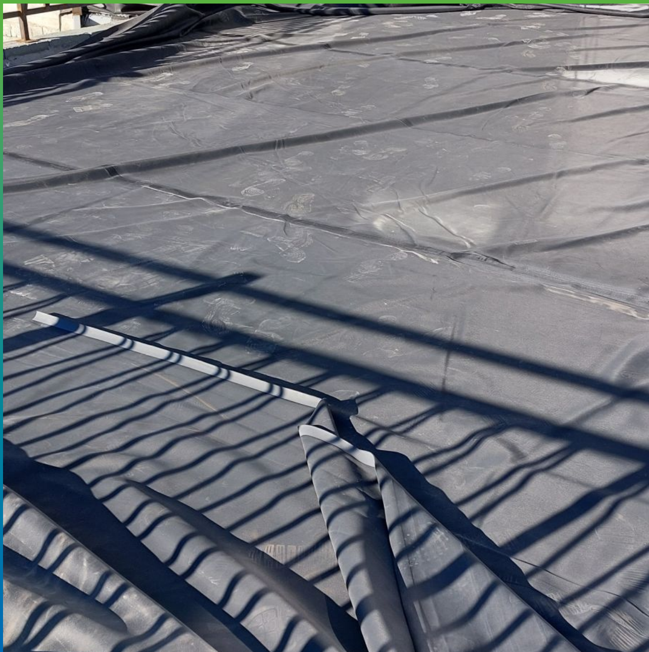
Укладка ЭПДМ мембраны Прелести СТ 1.2мм