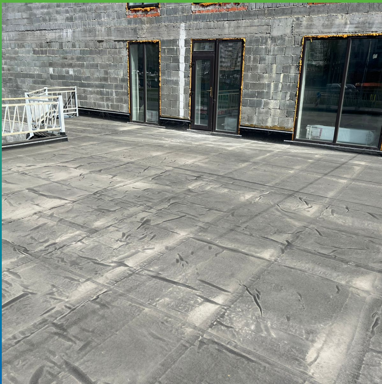
Финальный вид кровли