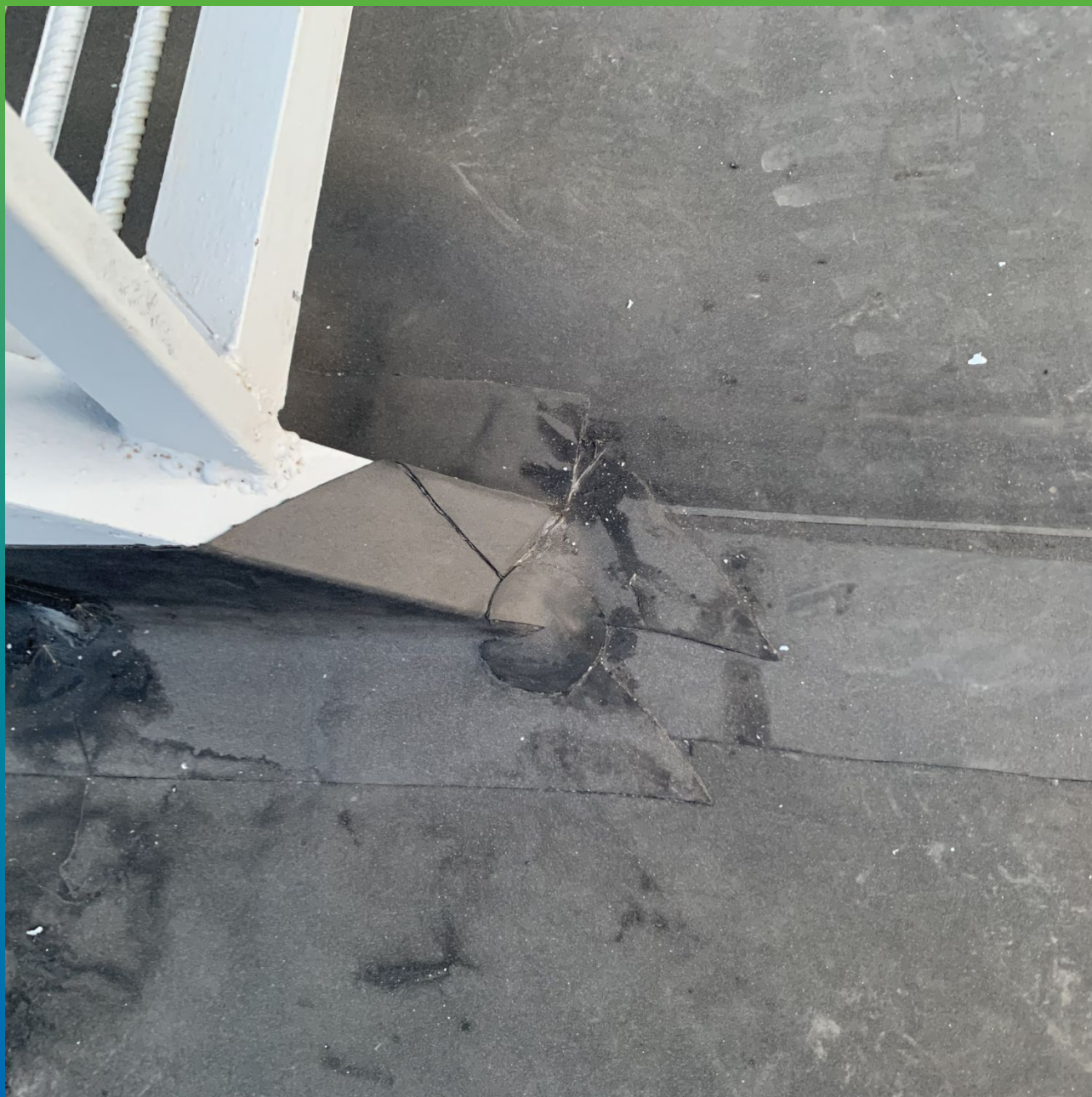
Сложные примыкания к лестнице, выполнены с помощью Термобонд