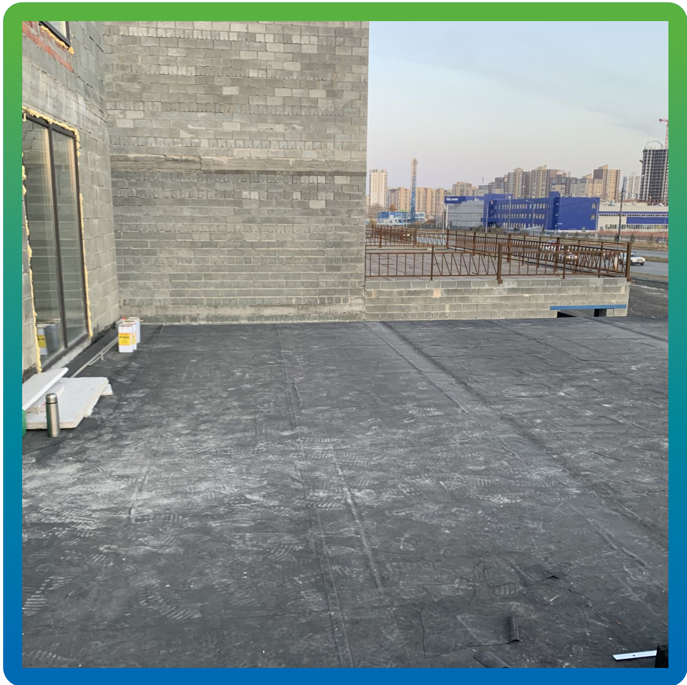
Вид смонтированной ЭПДМ мембраны