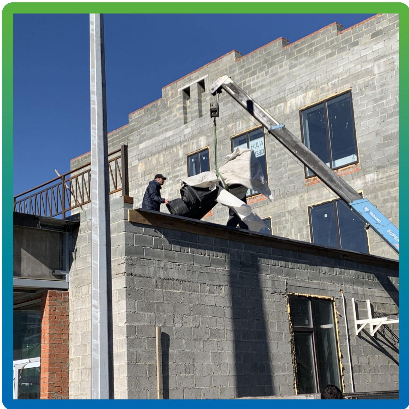
Подъем полотен из ЭПДМ мембраны на кровлю