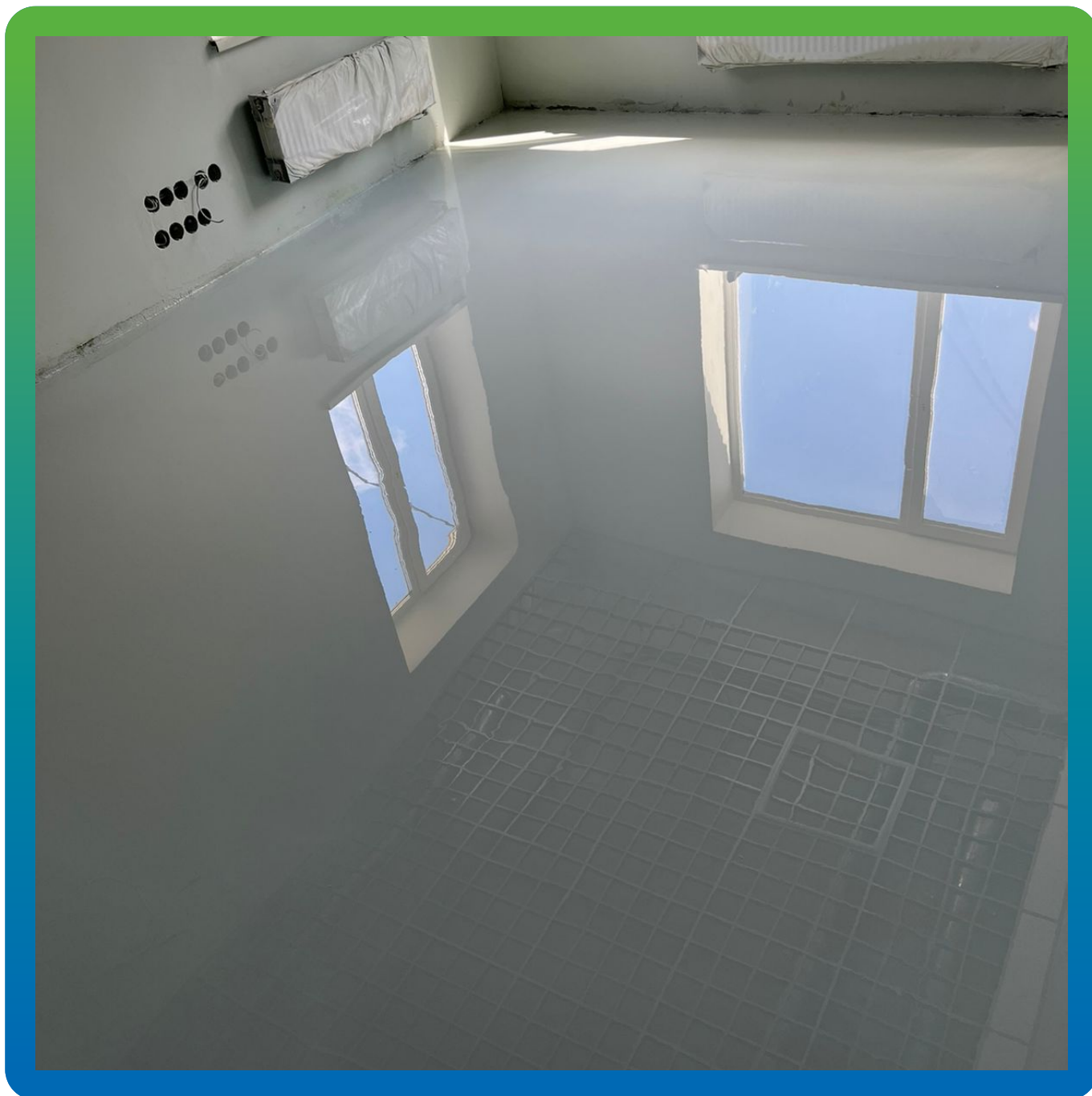
Финишное покрытие ДенТоп ЭП 500