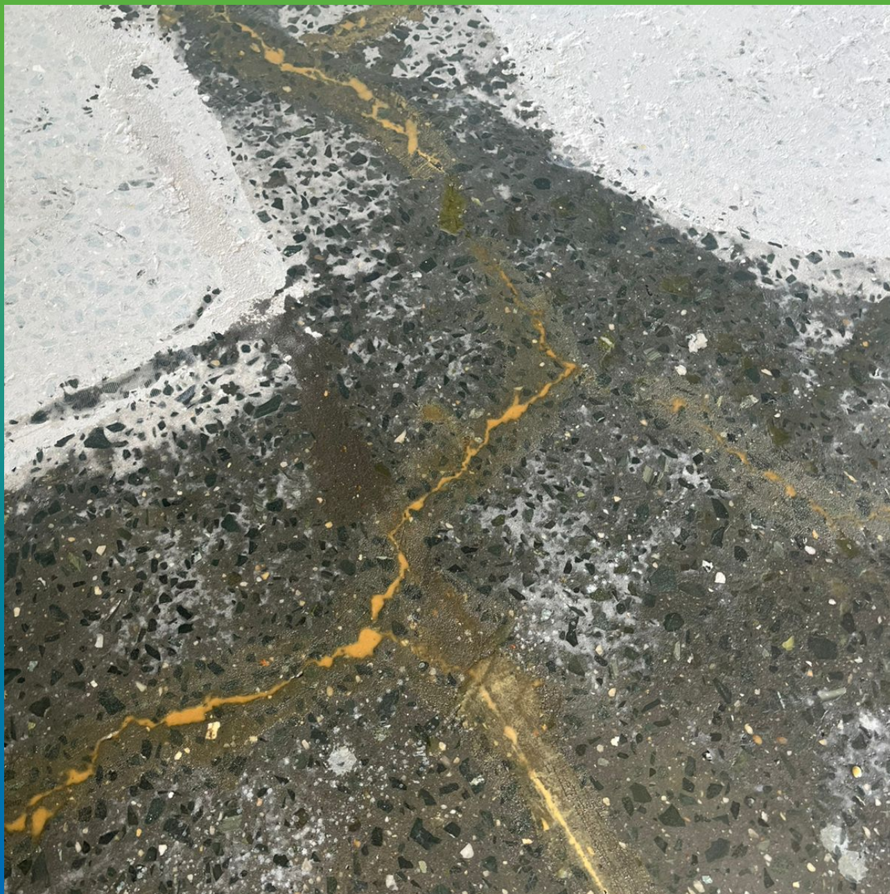
Трещины отремонтированные грунтовкой Денстоп ЭП 106 с добавлением песка