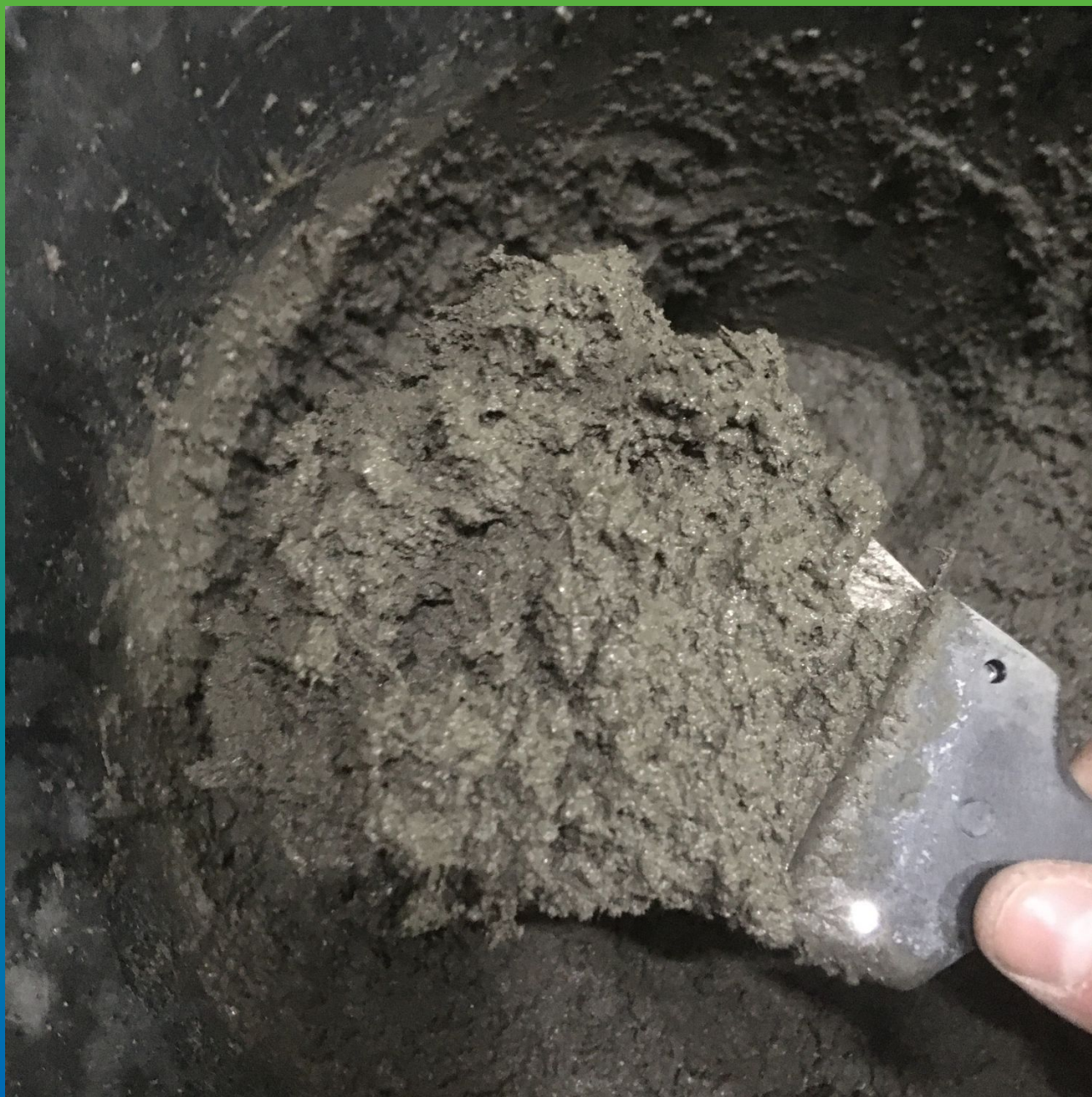
Готовый к нанесению Стармекс РМЗ