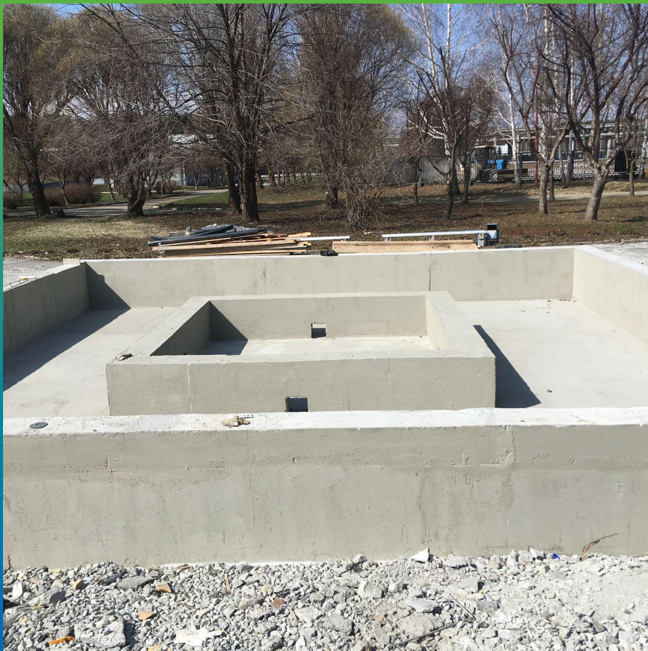
Чаша фонтана с нанесенной гидроизоляцией Стармекс Сил