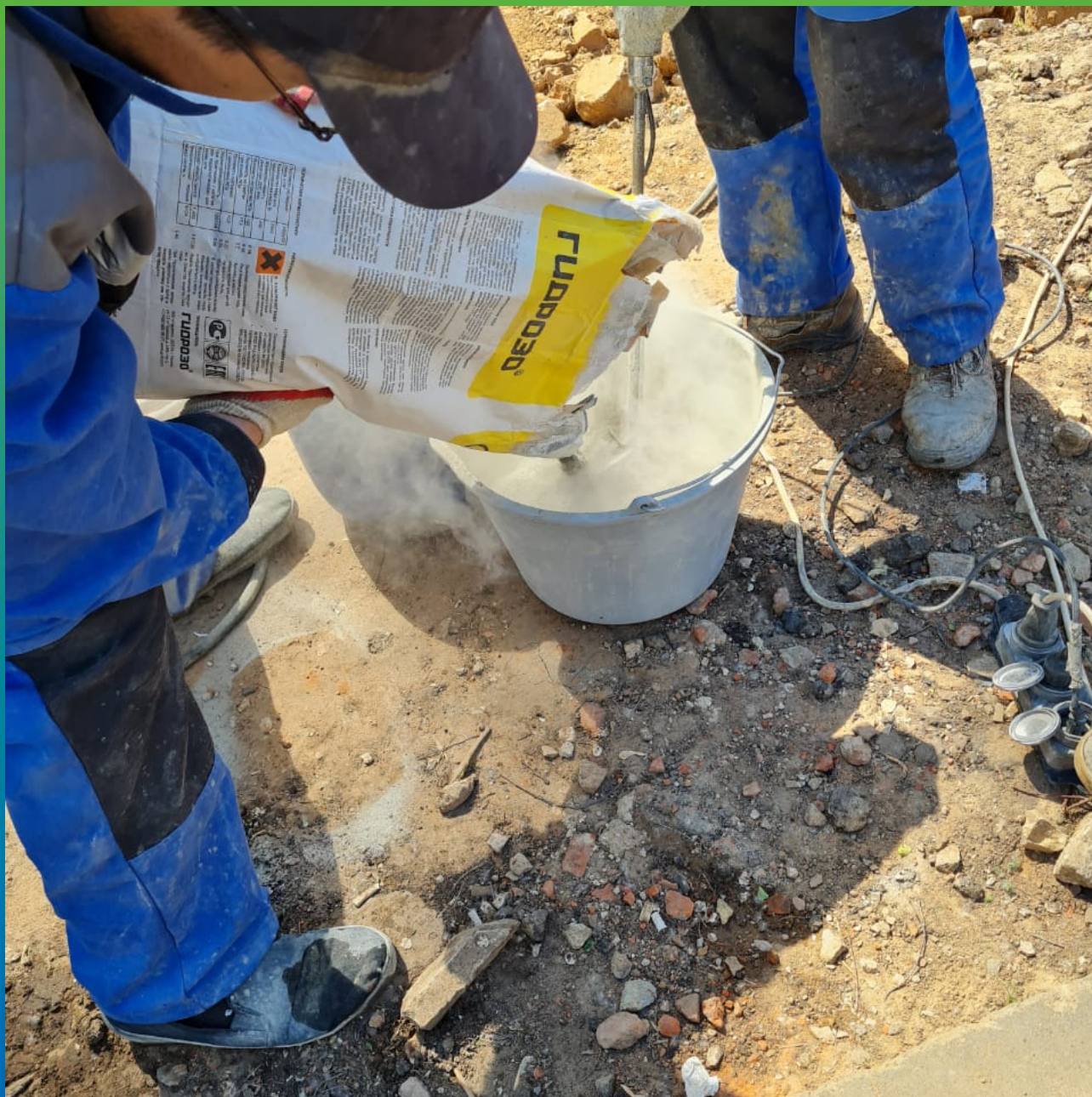
Затворение гидроизоляции Стармекс Сил