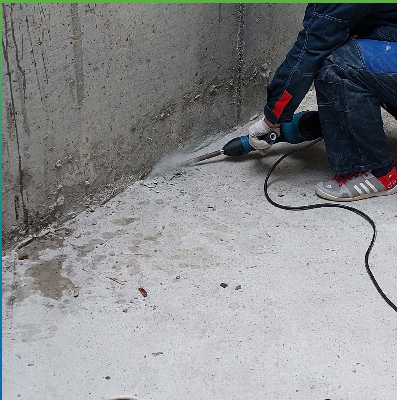
Расшивка холодного шва