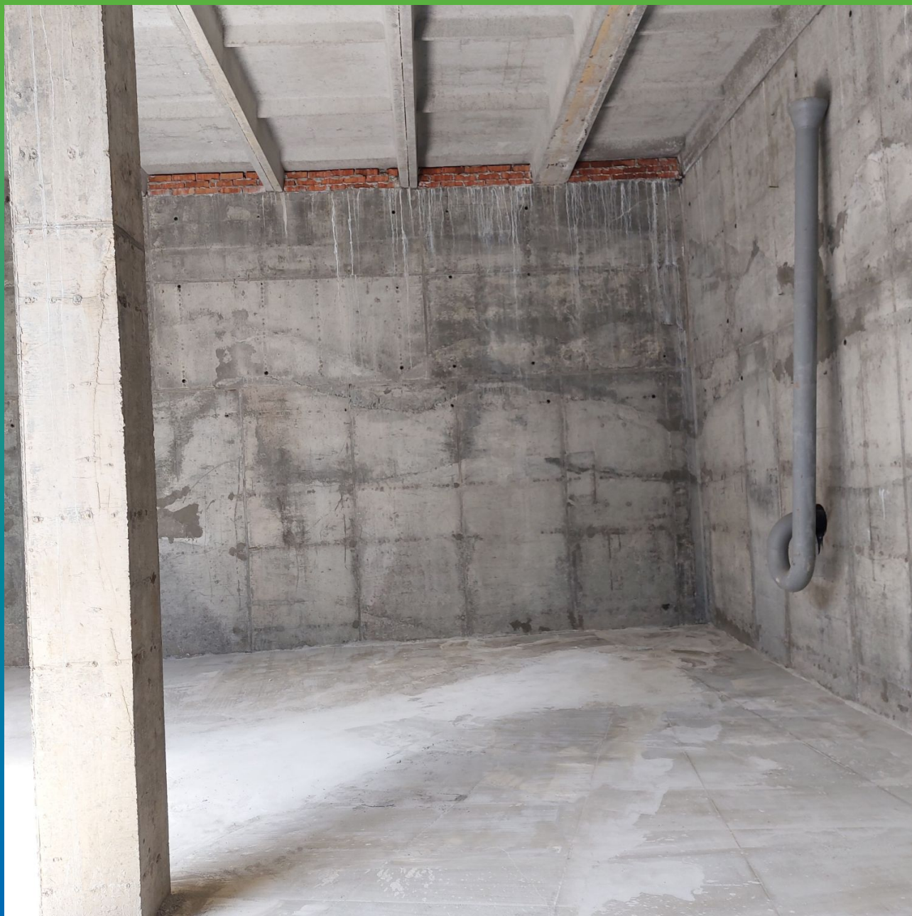
Вид внутри резервуара