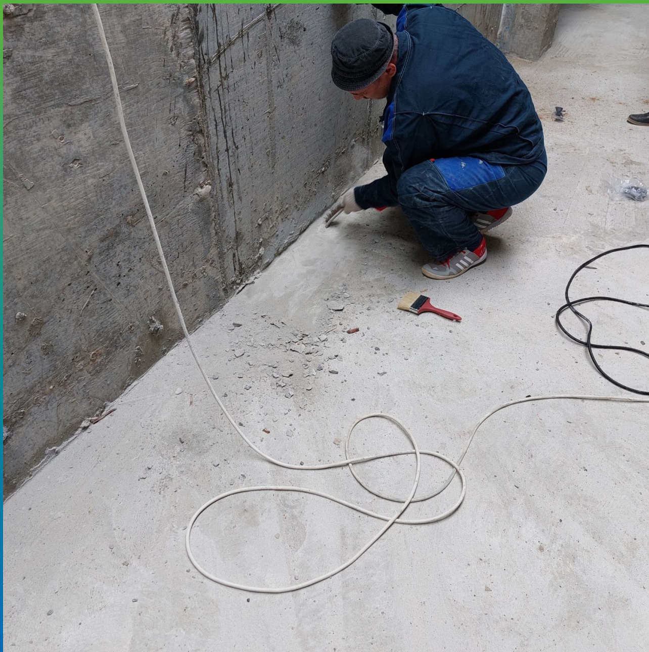
Зачистка ветошью от слабого бетона и пыли