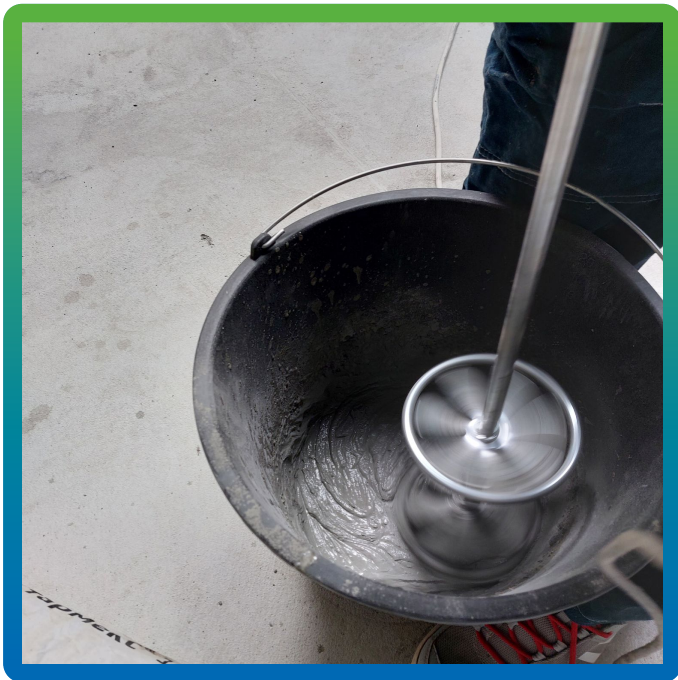
Замешивание гидроизоляции осмотического действия Стармекс Сил