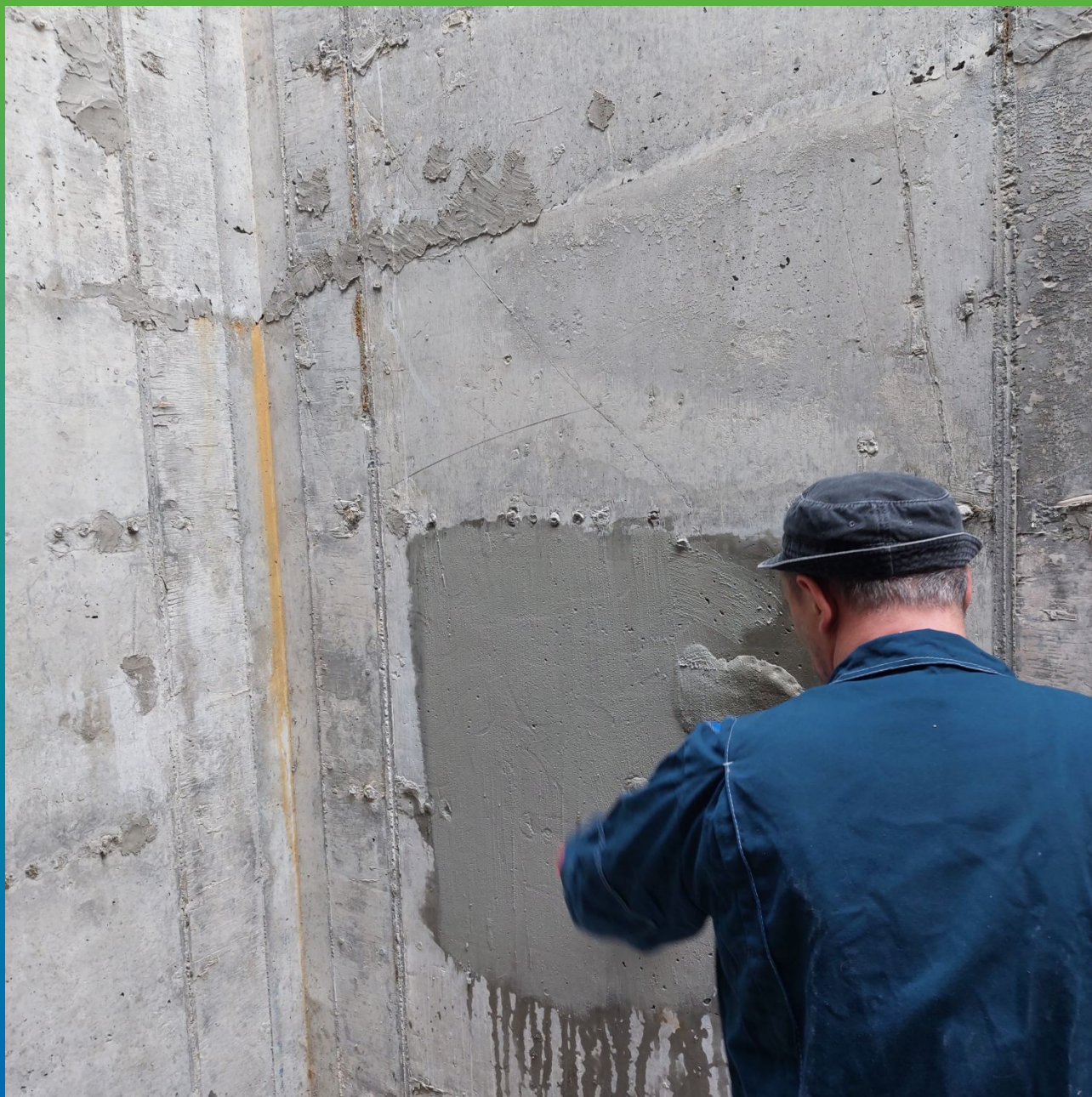
Нанесение Стармекс Сил на увлажненную поверхность бетона