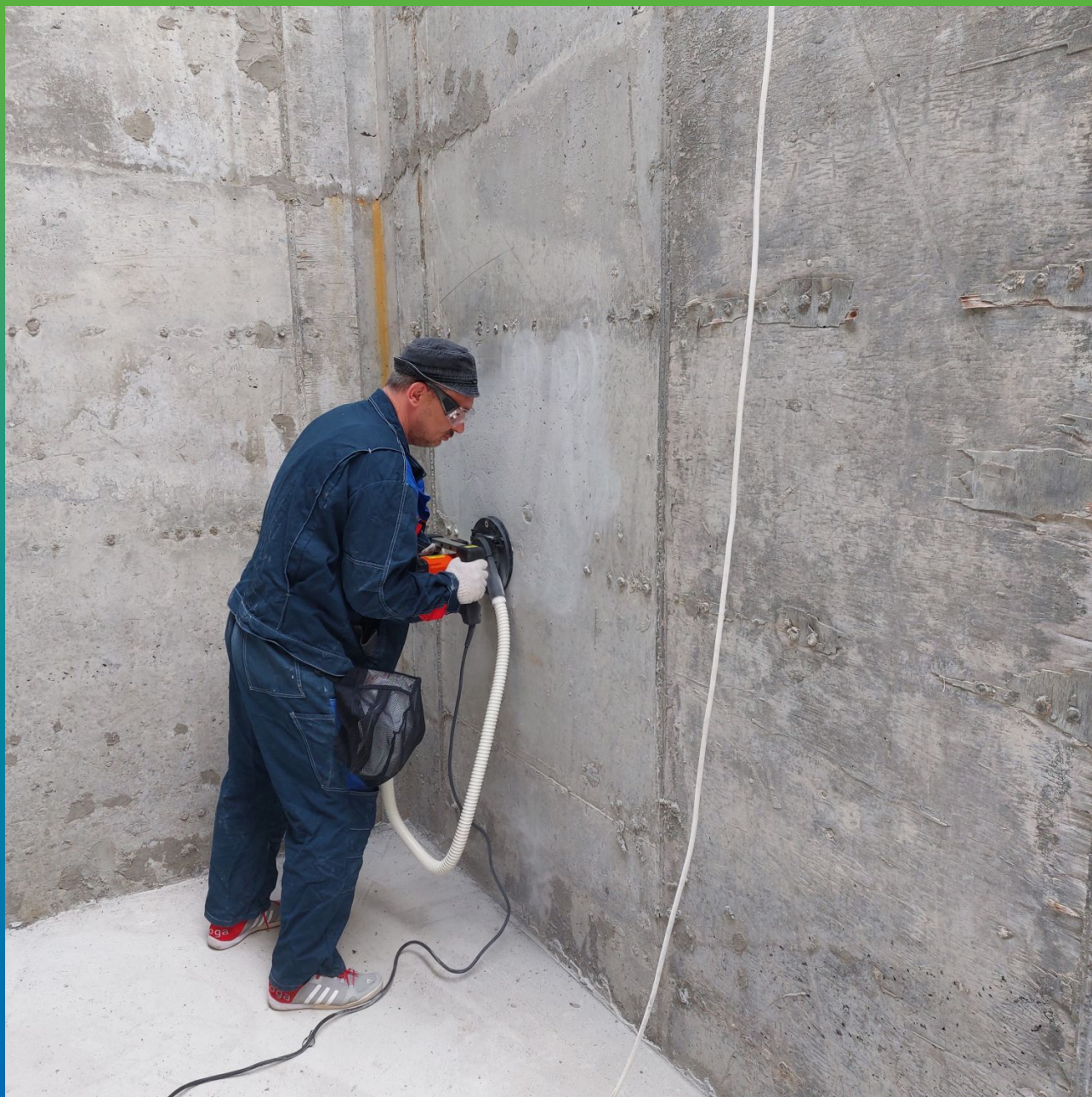
Шлифование бетона перед нанесением гидроизоляции