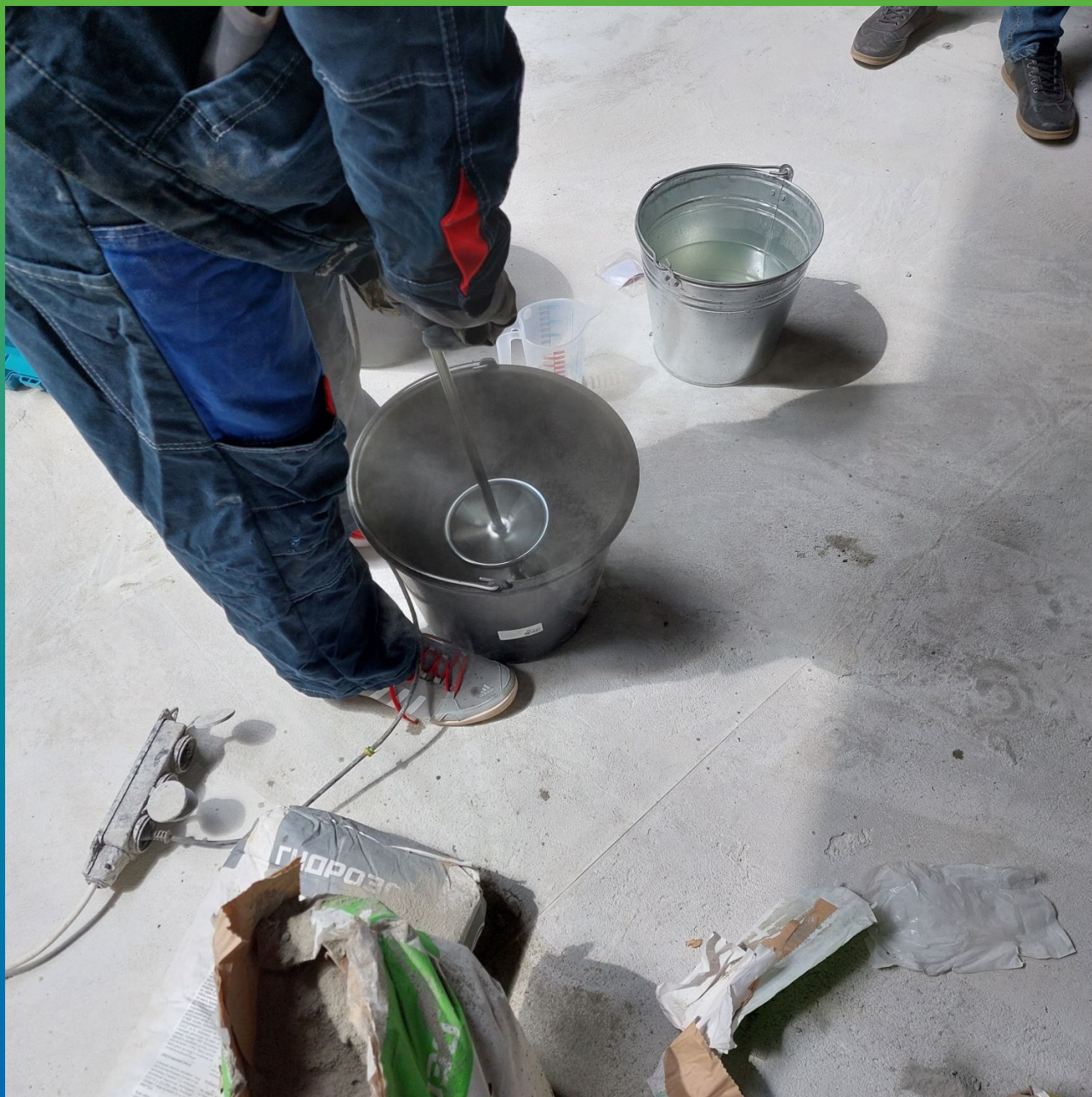
Замешивание Стармекс РМЗ