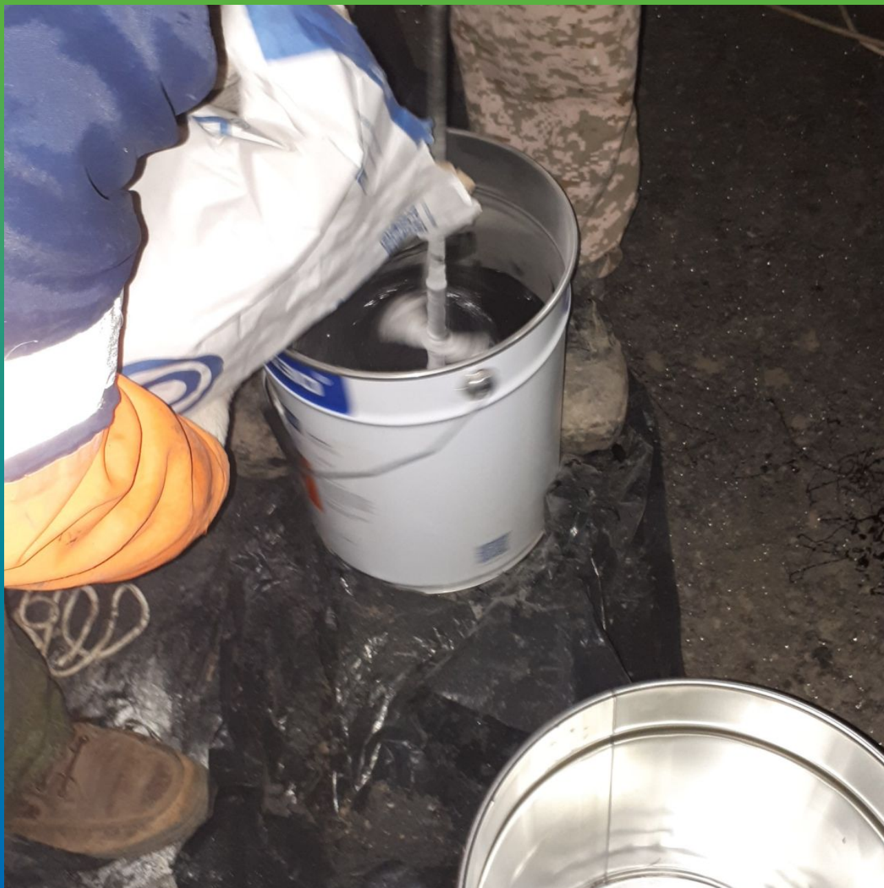
Перемешивание Манопур 336