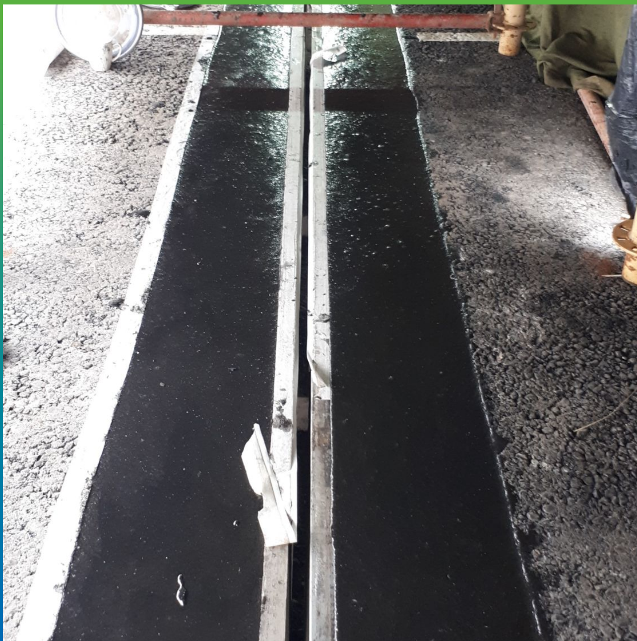
Готовый шов. Прогрев тепловыми пушками в зимний период