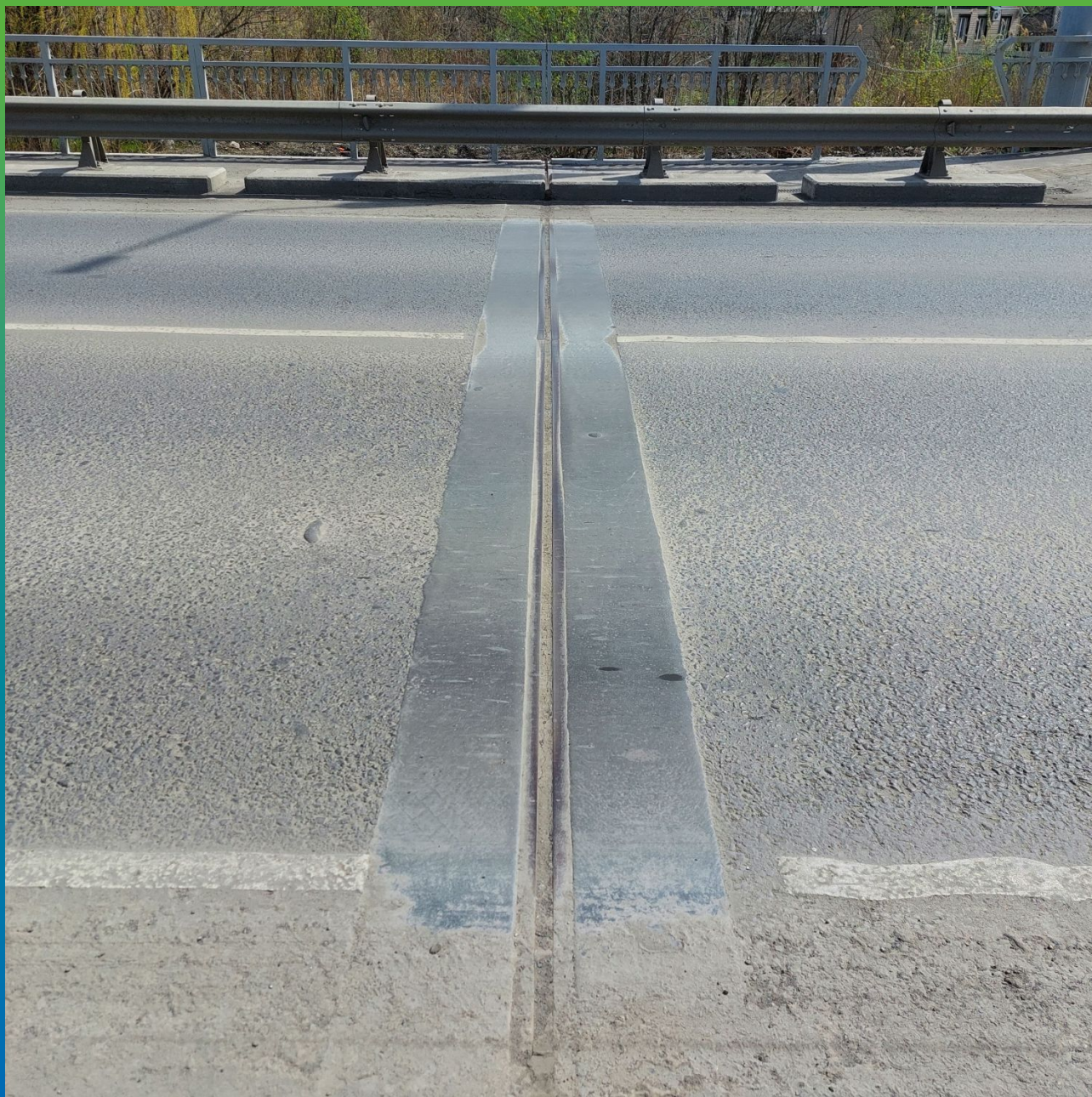
Шов в процессе эксплуатации