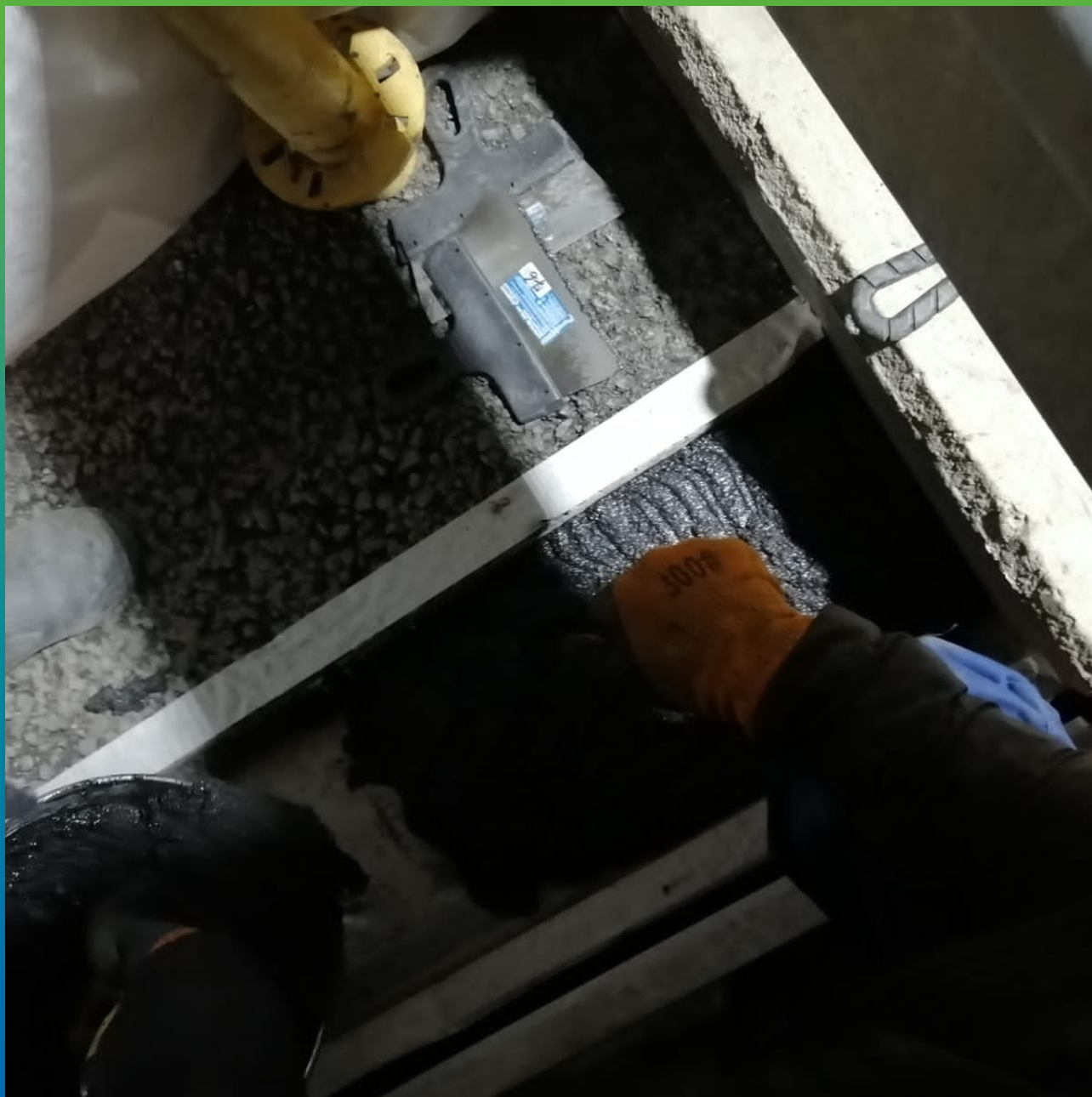
Начало укладки состава для пришовной зоны Манопур 336