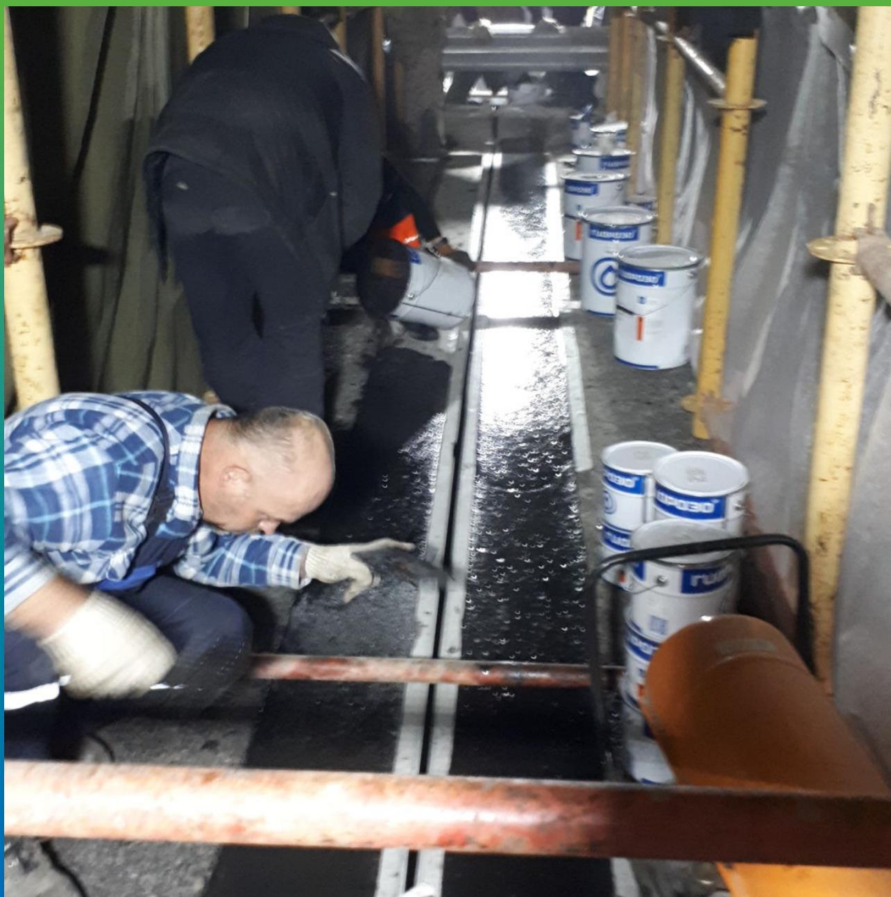
Процесс заполнения пришовной зоны