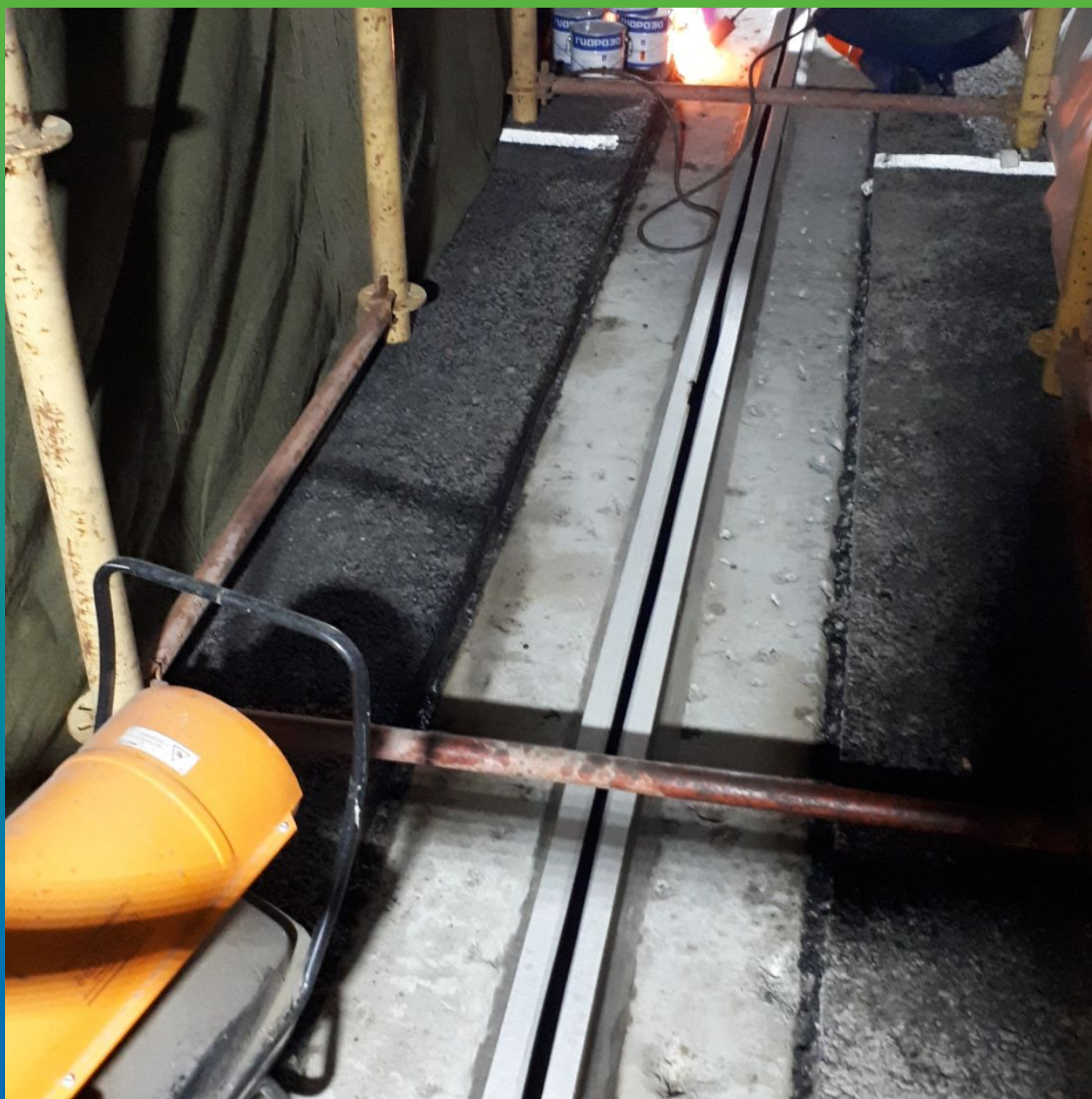
Подготовка шва (зачистка, прогрев)