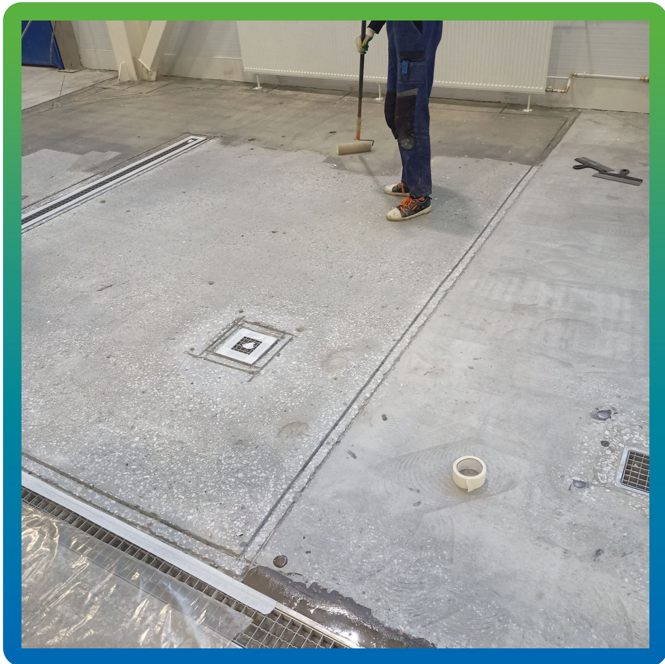
Нанесение грунтовки ДенТоп ПМ 600