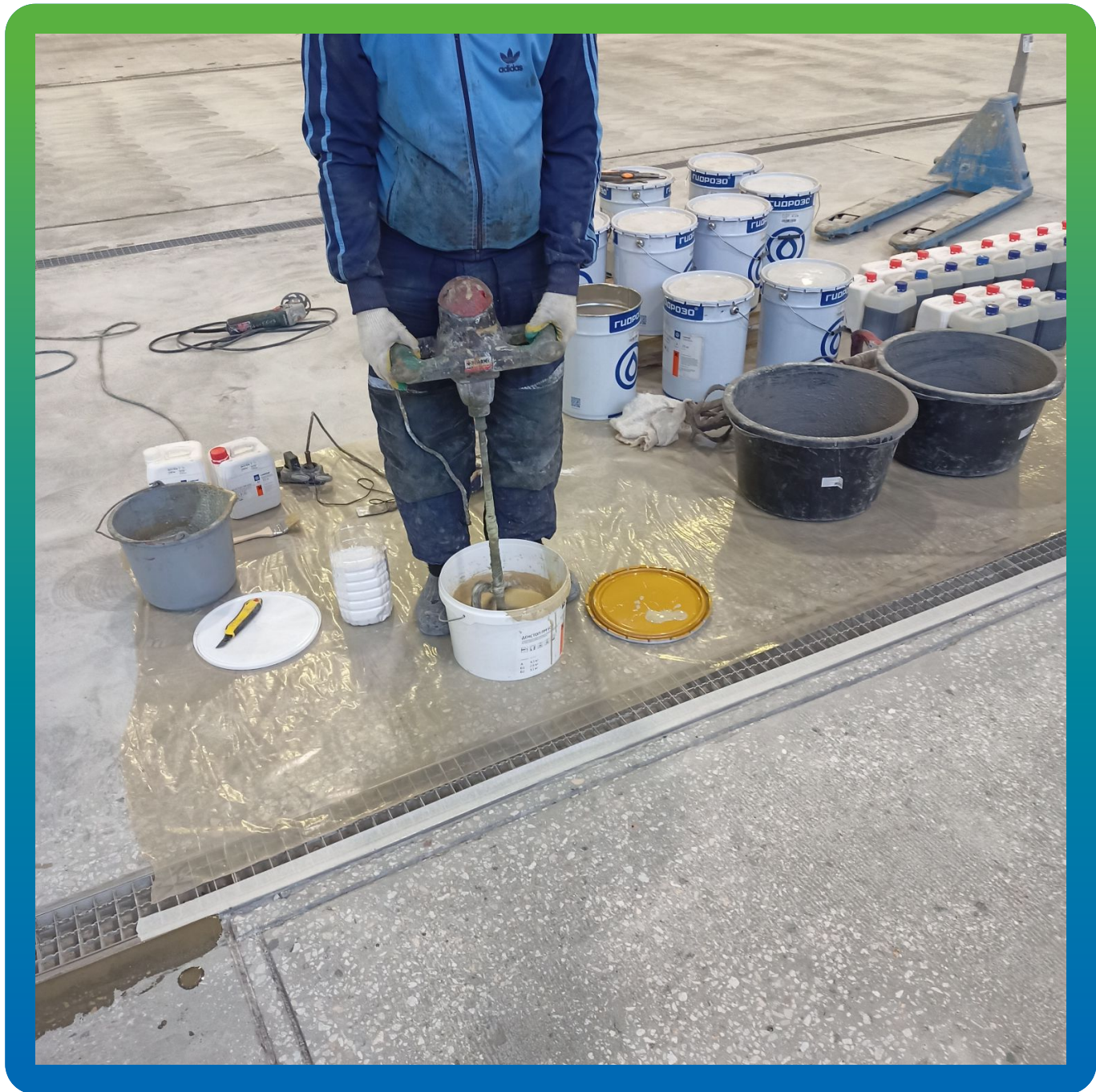
Приготовление грунтовки ДенТоп ПМ 600 под химстойкую систему