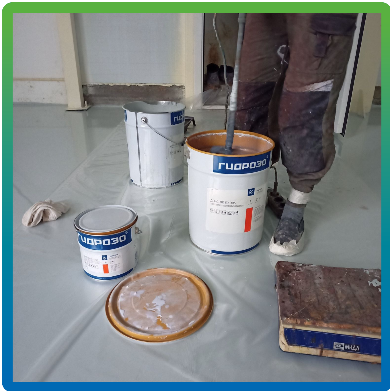
Приготовление защитного полиуретанового лака ДенСтон ПУ 305