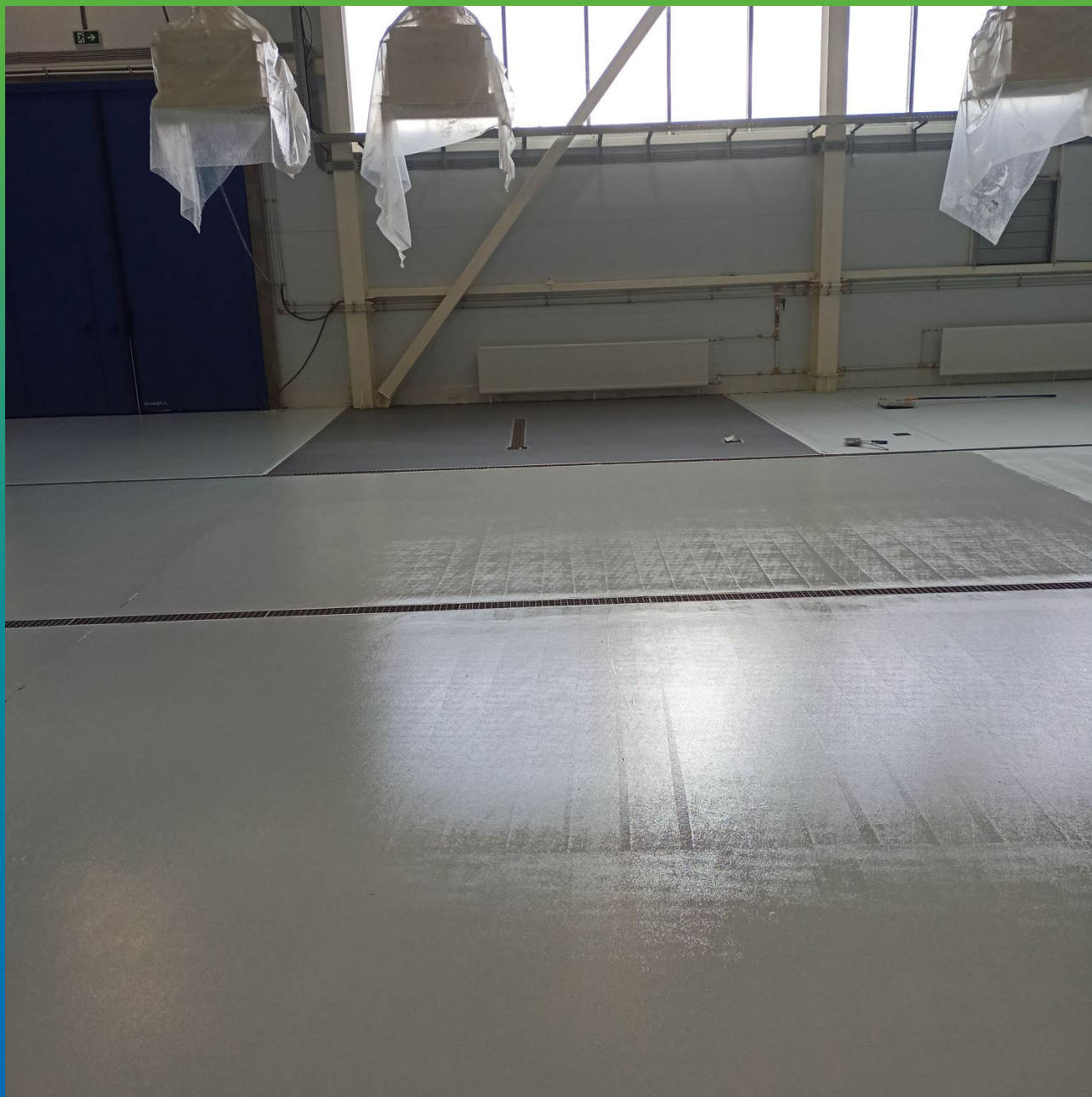
Выполненные полы в цеху розлива