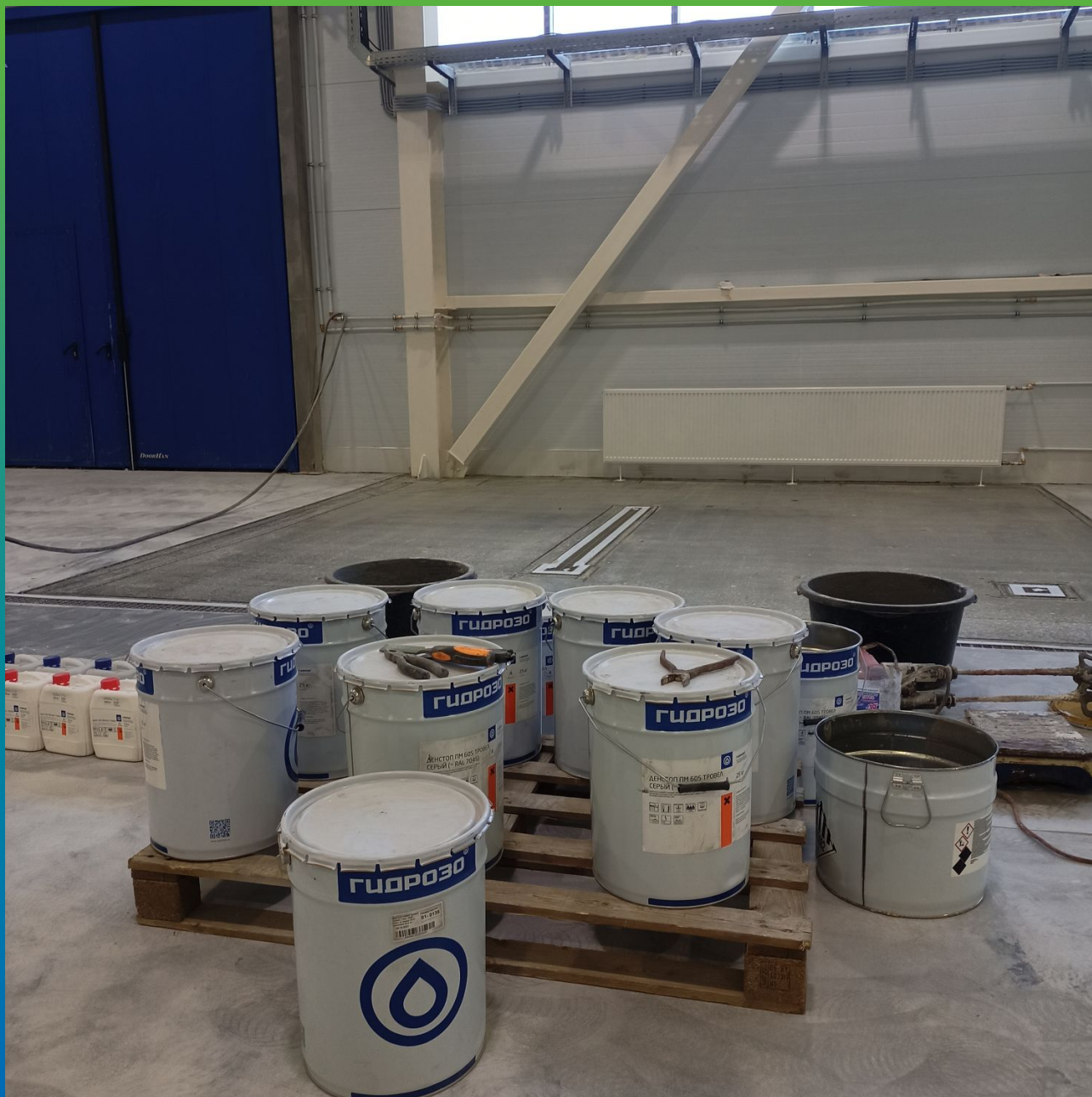
Химстойкий полиуретанцементный состав ДенТоп ПМ 605 Трвел для лаборатории