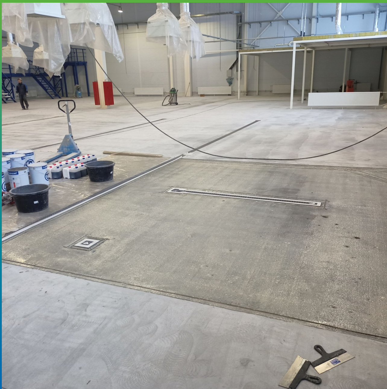
Загрунтованный часток грунтовкой ДенТоп ПМ 600