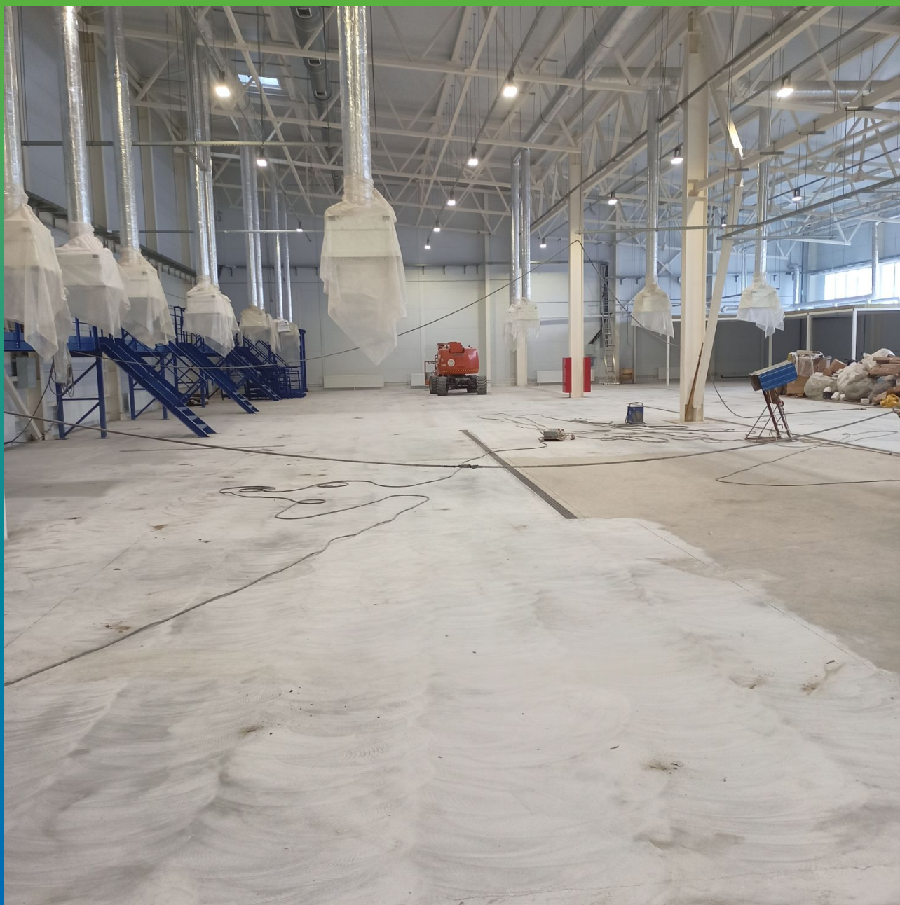
Подготовленный под нанесени покрытия ДенсТоп ЭП 205 цех розлива