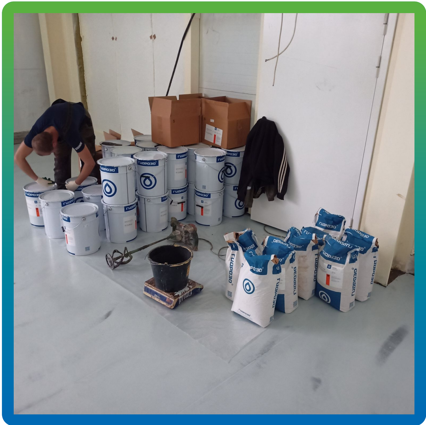
Материалы системы ДенТоп ЭП 501 для помещения погрузки-выгрузки