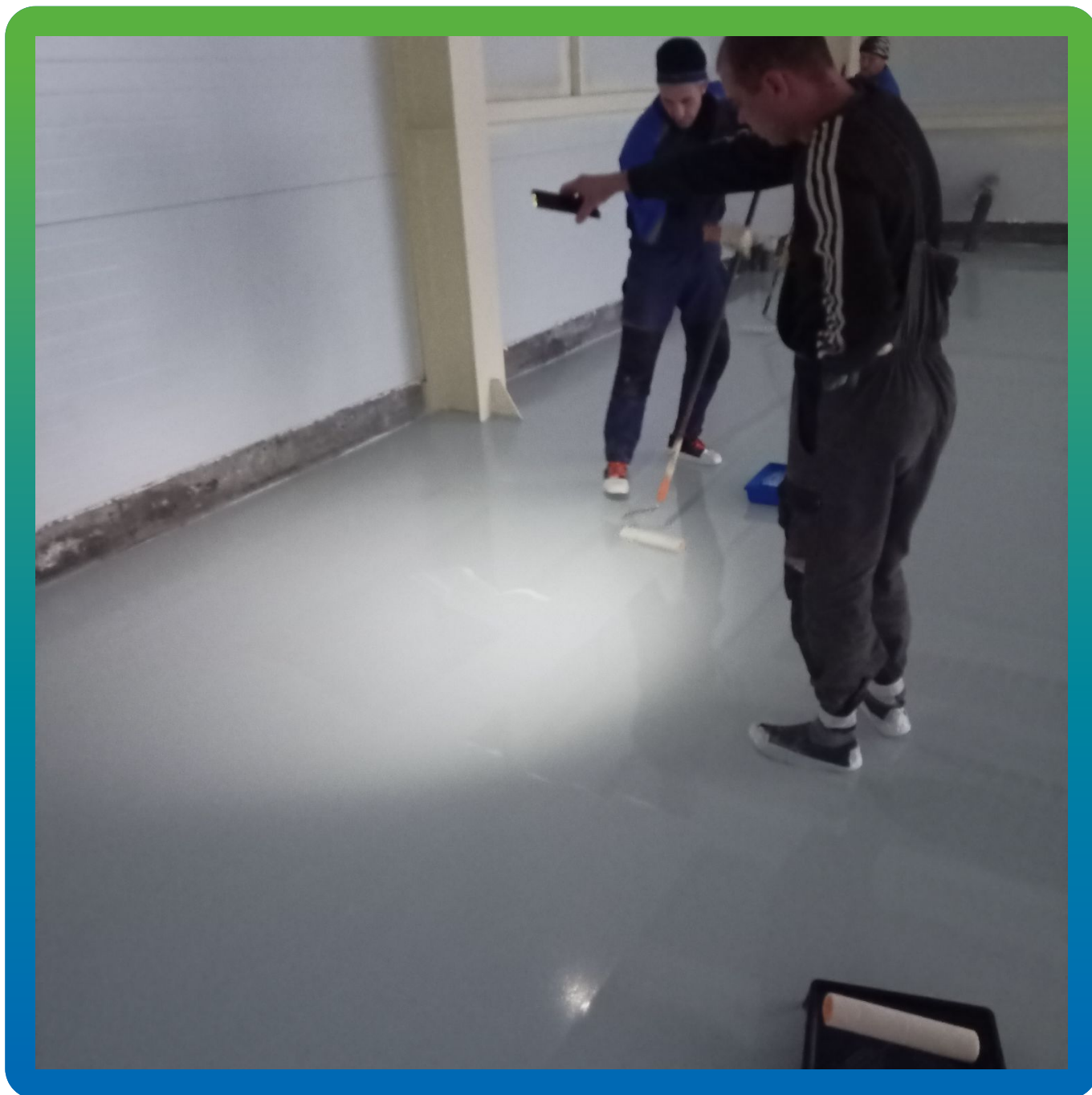
Нанесение валиками лака ДенсТоп ПУ 305