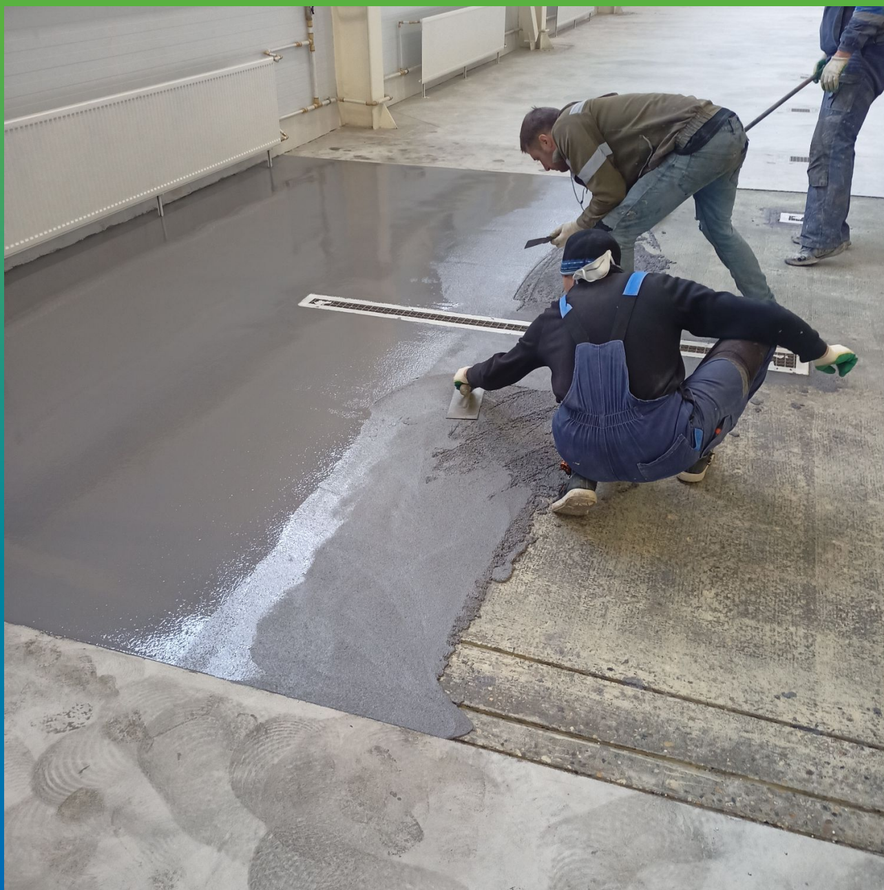
ДенсТоп ПМ 605 Тровел в процессе нанесения