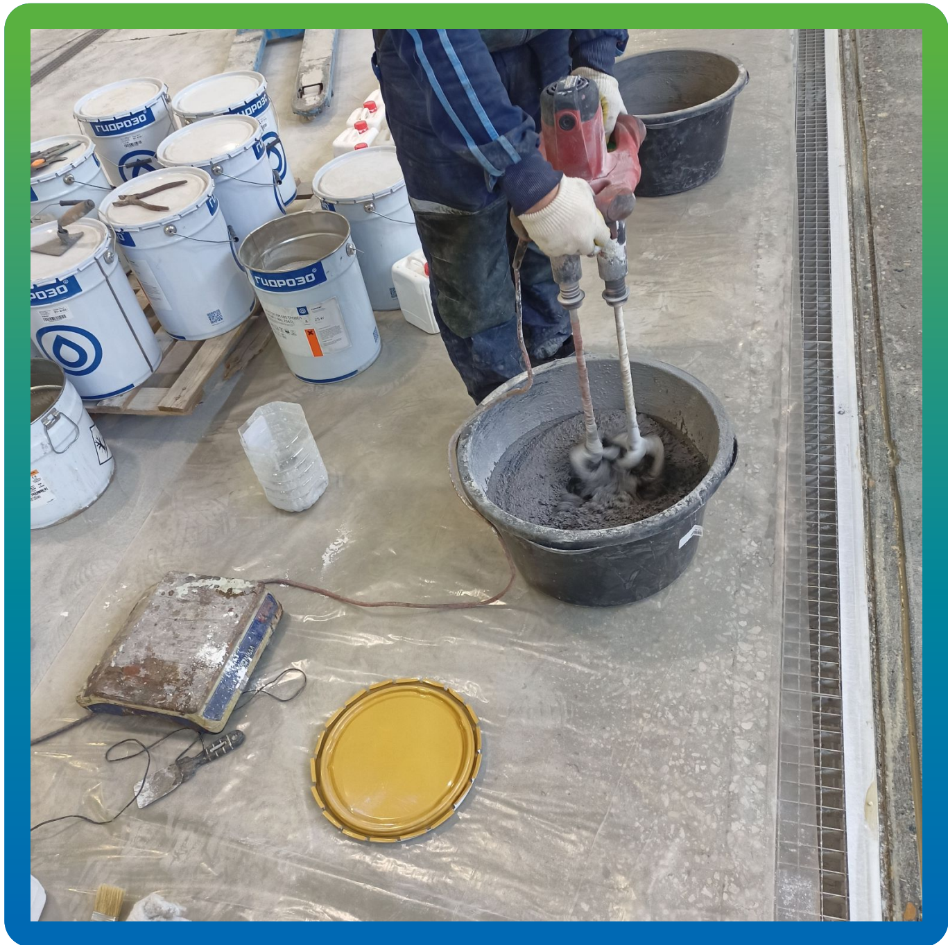
Приготовление ДенТоп ПМ 605 Тровел