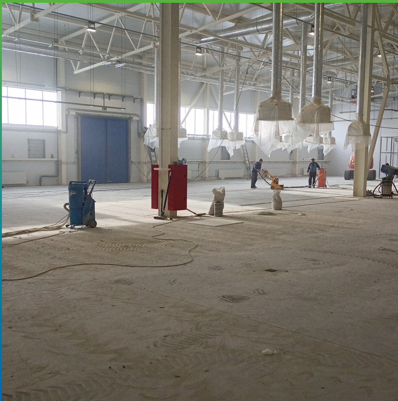
Шлифование бетона в цехе розлива