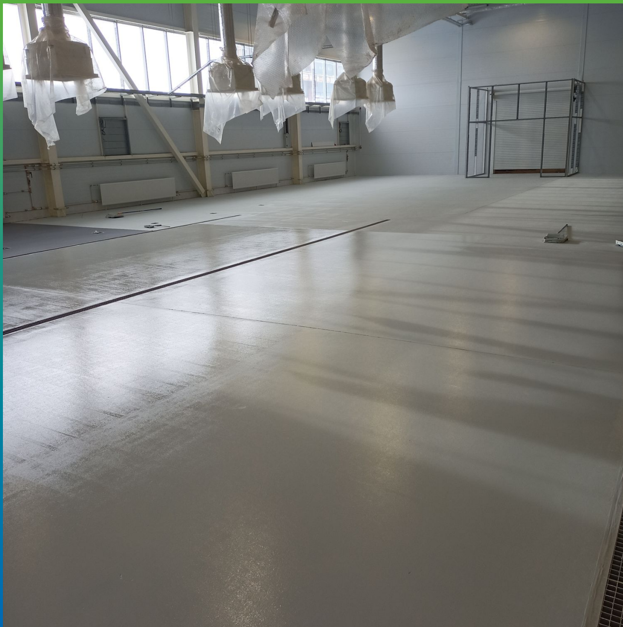
Финишный вид помещения