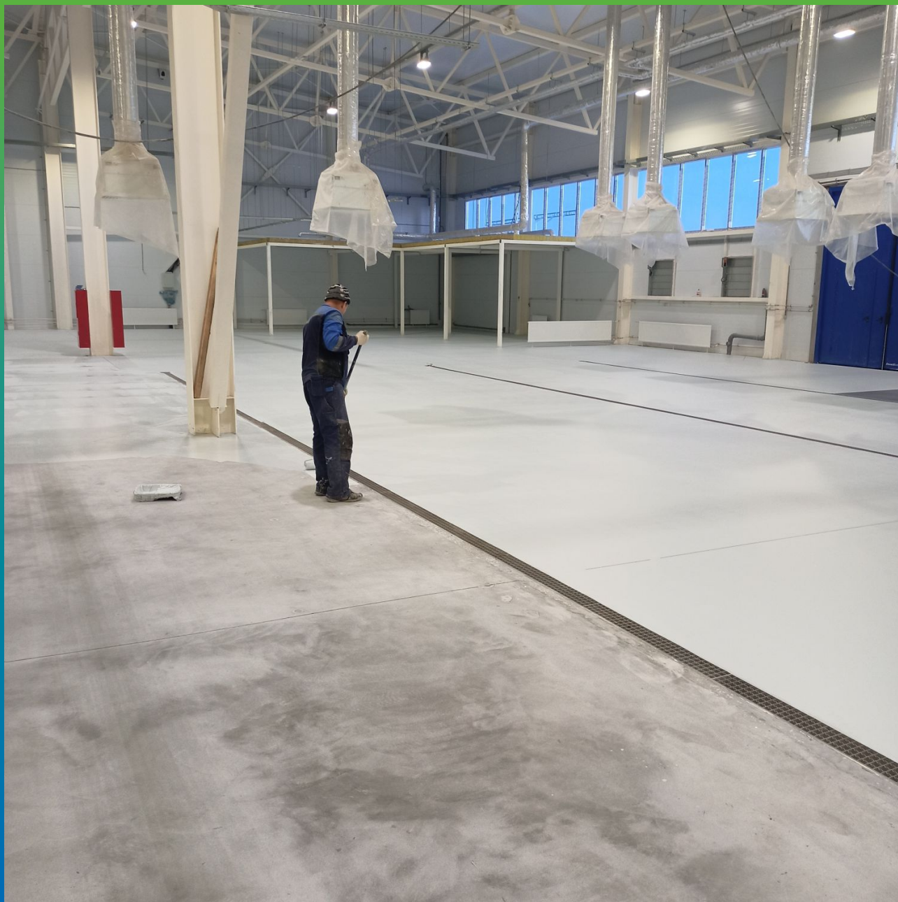
Накатка валиков слоев эпоксида на водной основе ДенТоп ЭП 205