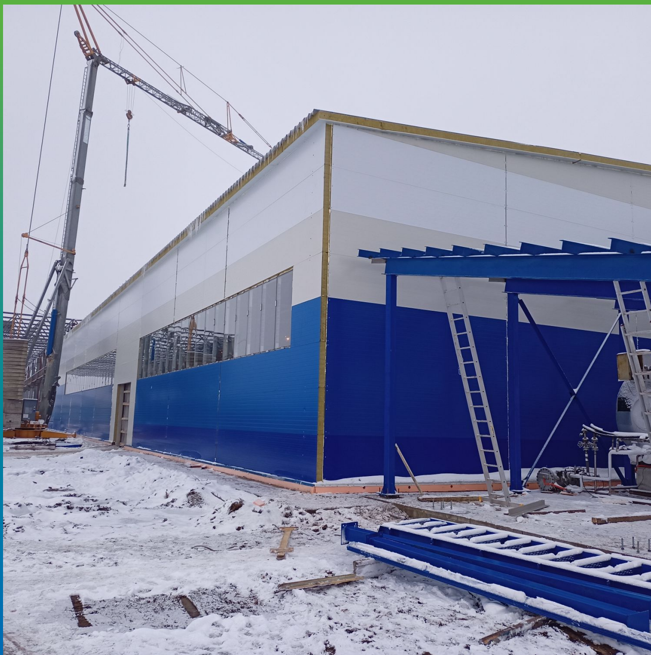
Общий вид цеха по производству воды