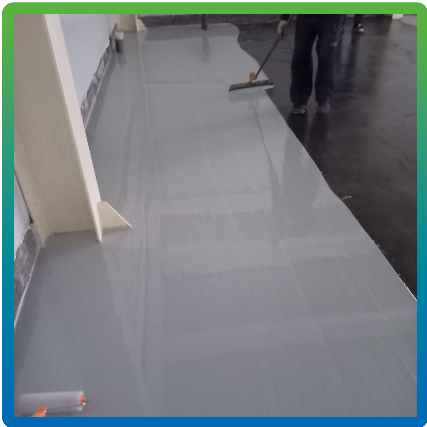
Распределение базового цветного эпоксидного состава ДенсТоп ЭП 501 при помощи ракеля