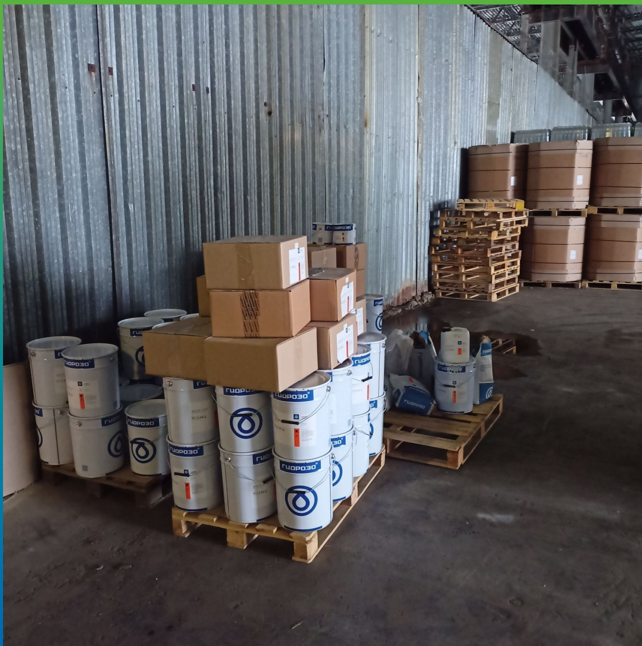
Материалы системы ДенТоп ЭП 205 для цеха розлива