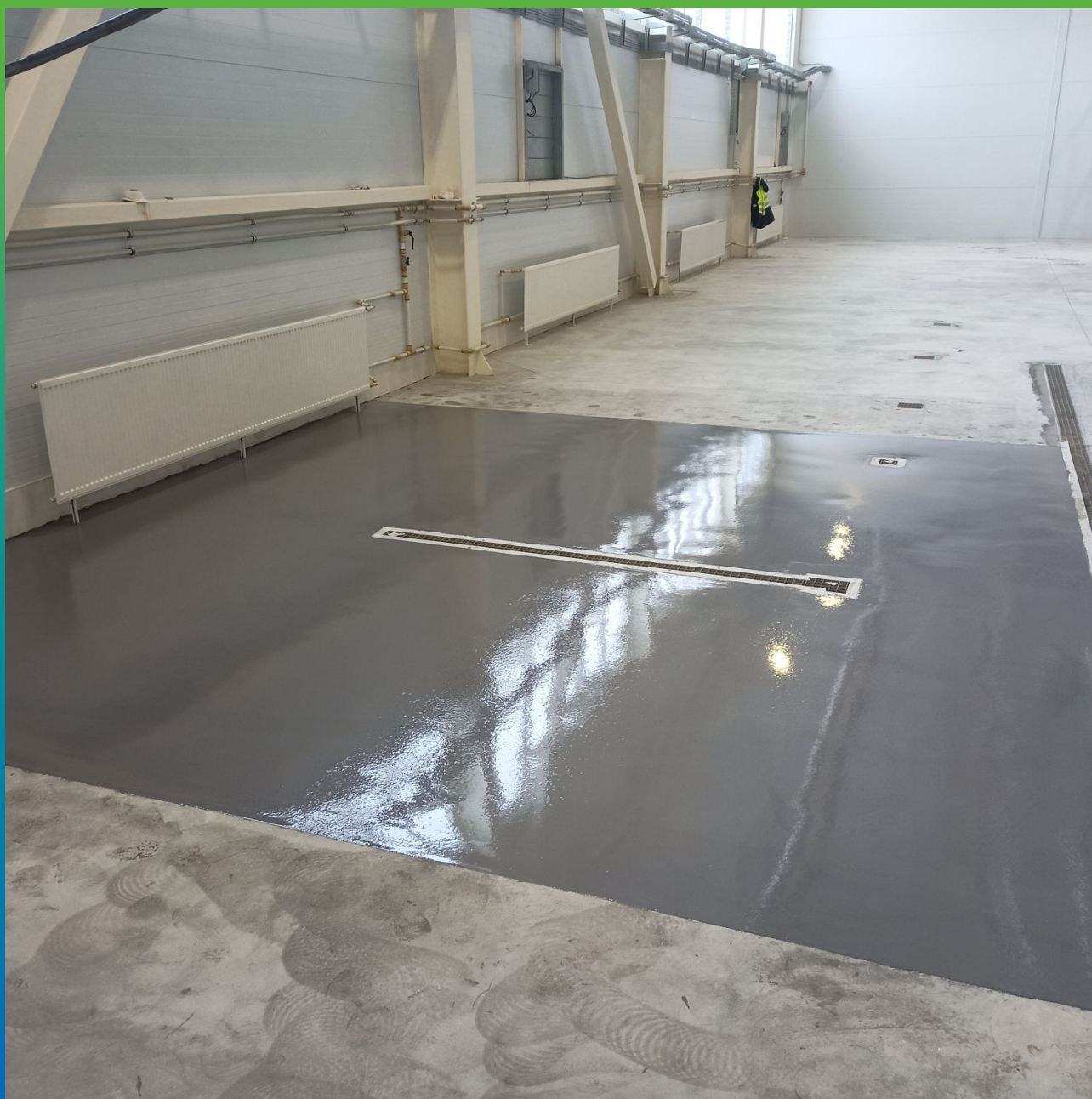
Участок под лабораторию с химстойким покрытием ДенсТоп ПМ 605 Тровел