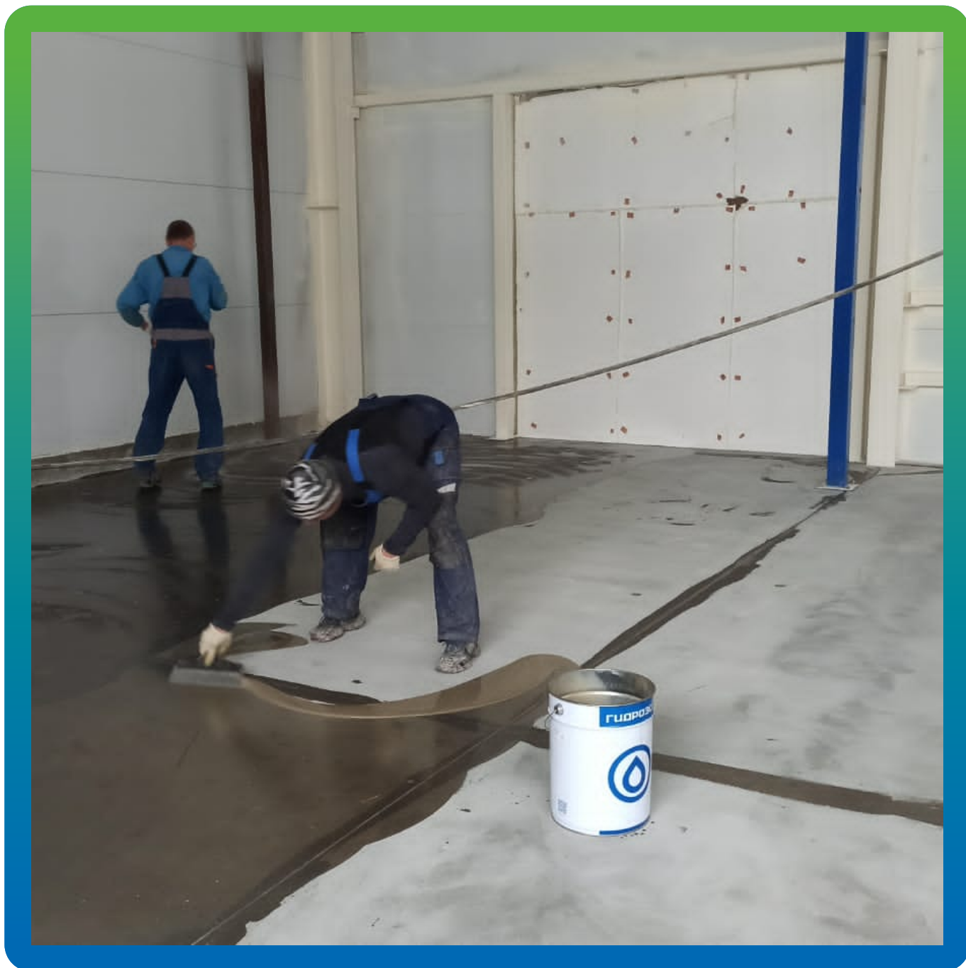
Грунтование помещения составом ДенТоп ЭП 104