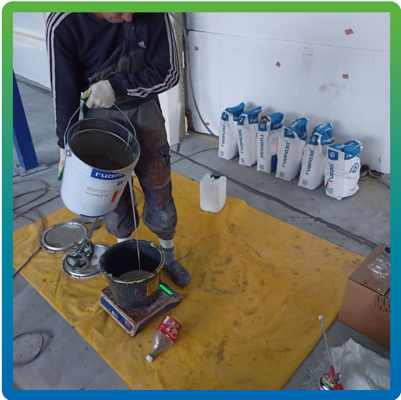
Приготовление грунтовки ДенсТоп ЭП 104