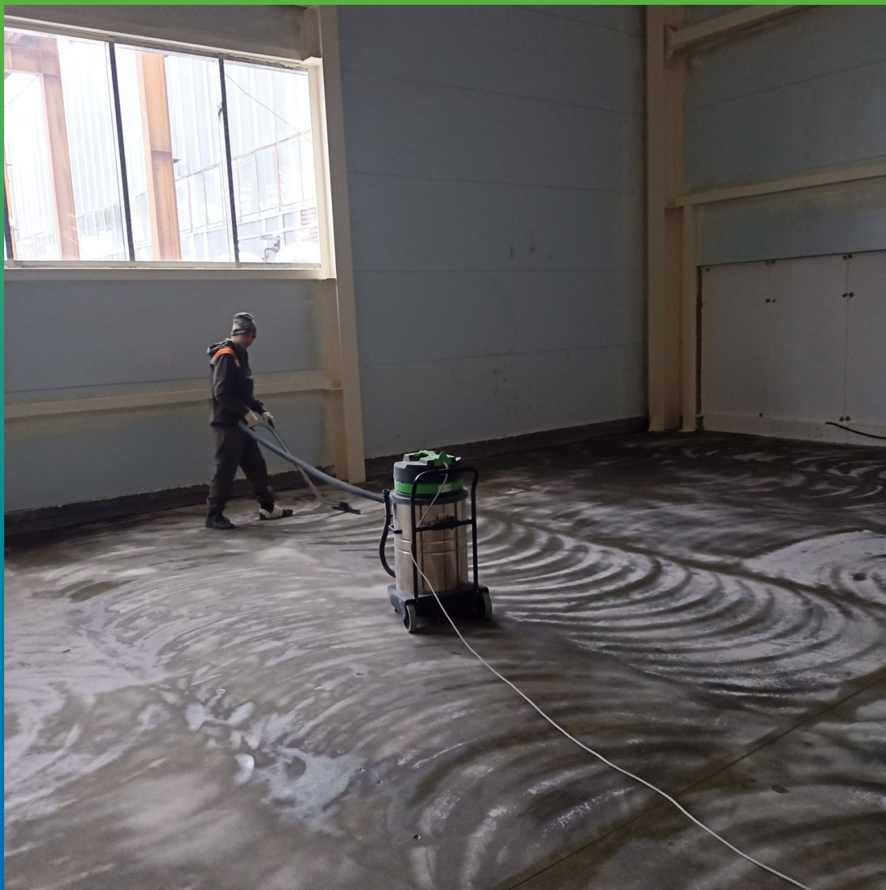
Обеспыливание перед нанесением полимерного покрытия