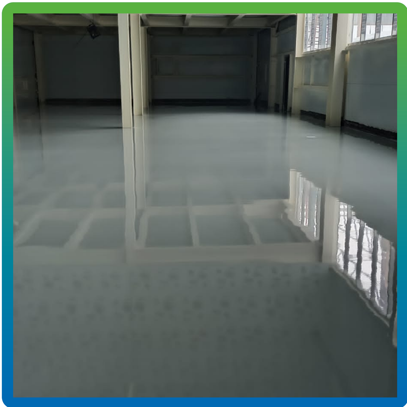
Нанесенное наливное полимерное покрытие ДенТоп ЭП 501