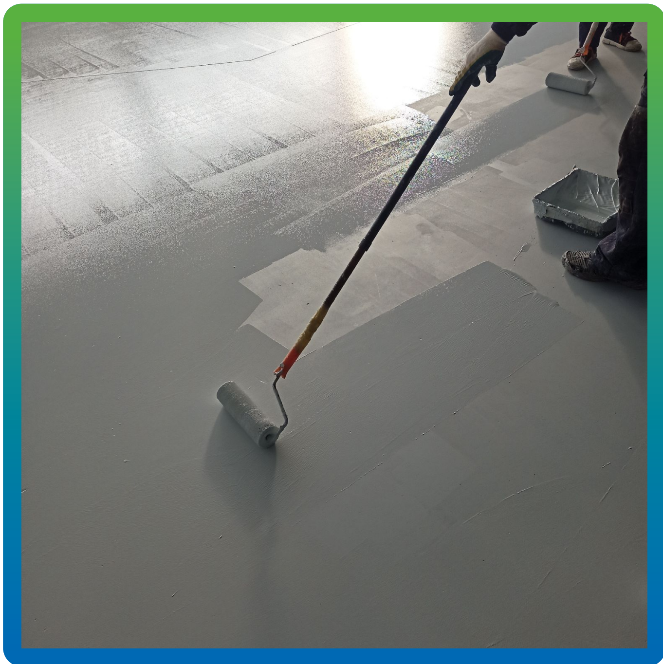
В процессе нанесения ДенсТоп ЭП 205