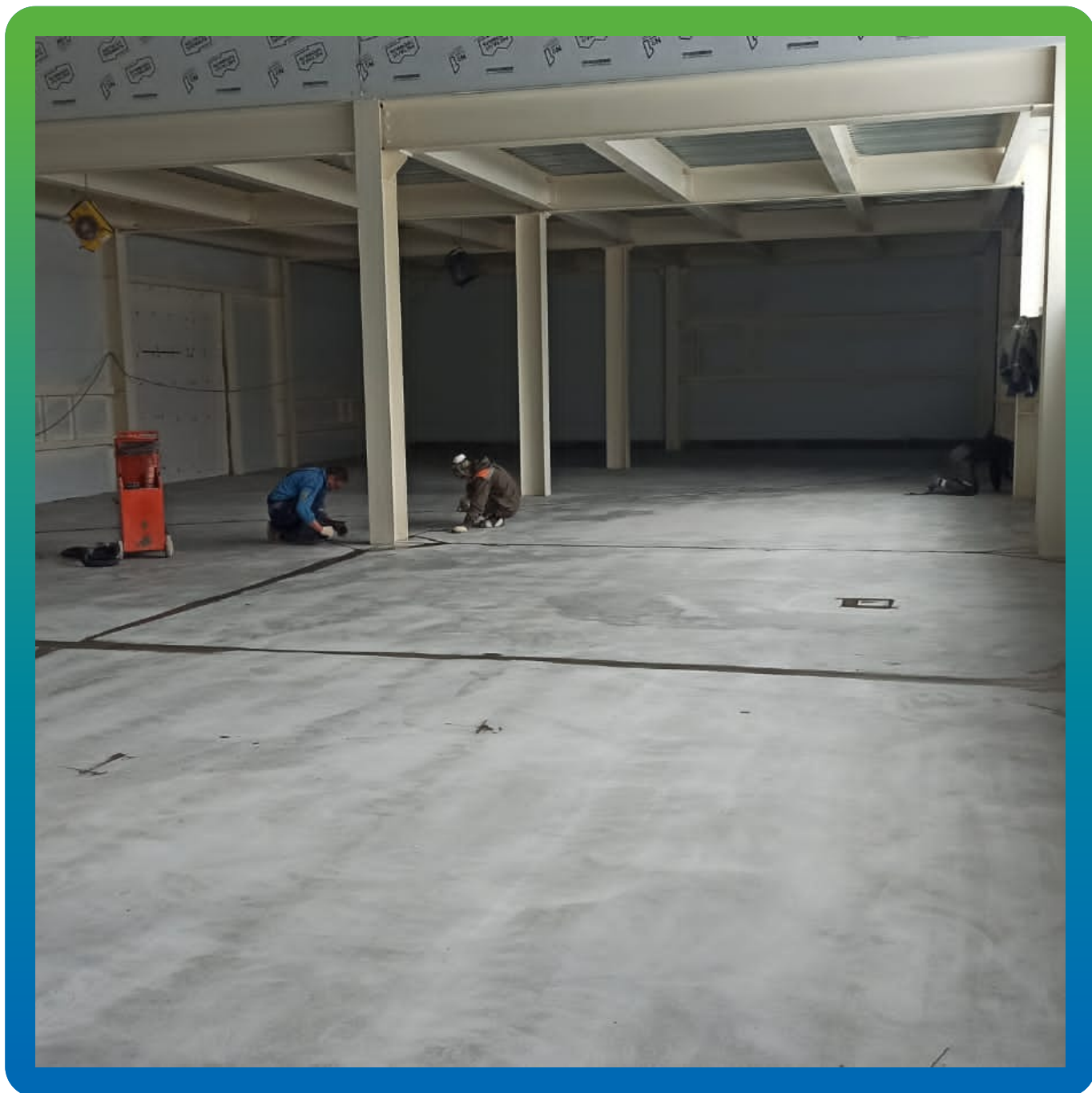
Шпаклевание усадочных швов смеси ДенсТоп ЭП 104 и ДенсТоп Филлер