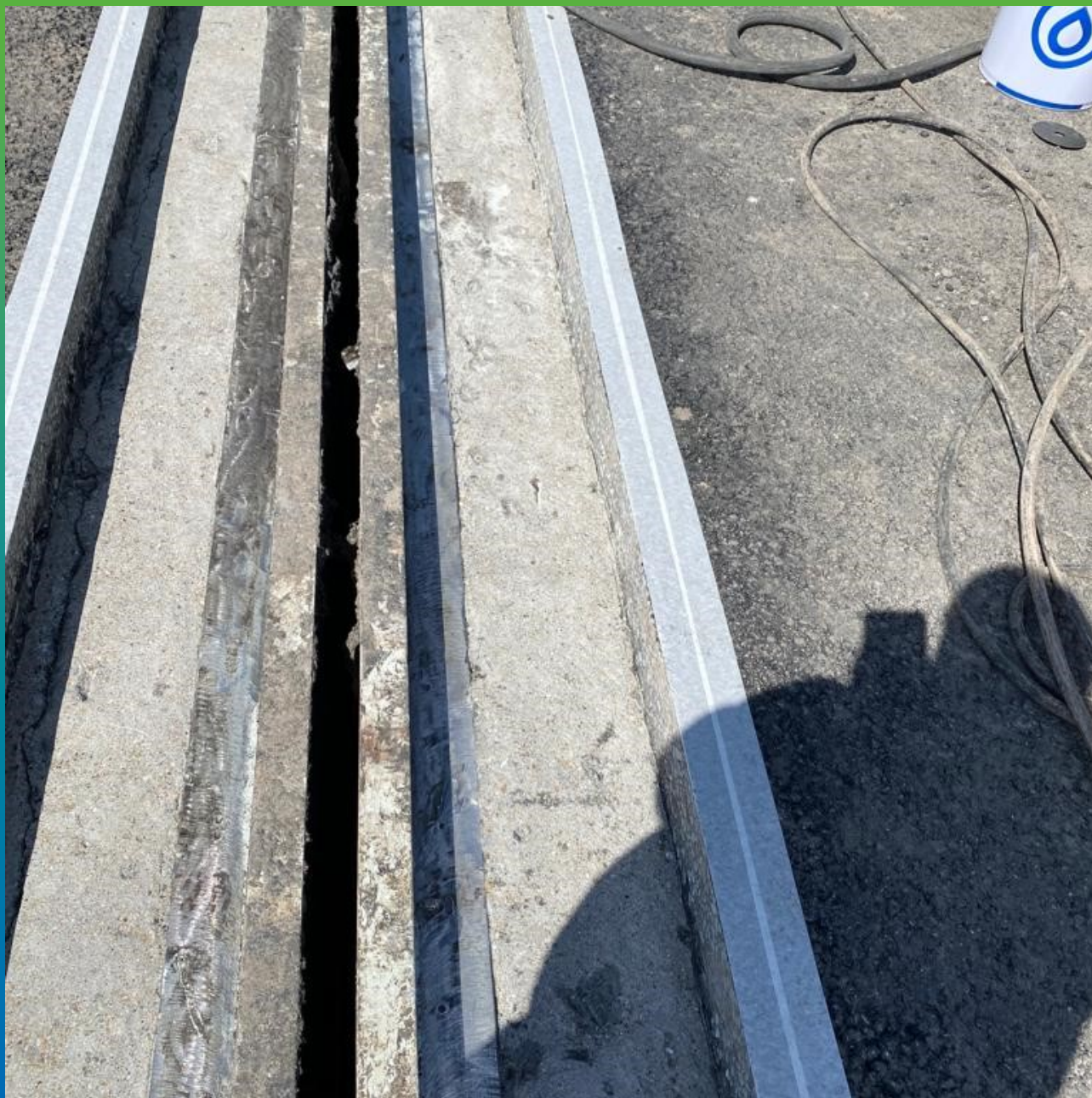
Штроба, подготовленная к заливке материала Манопур 336