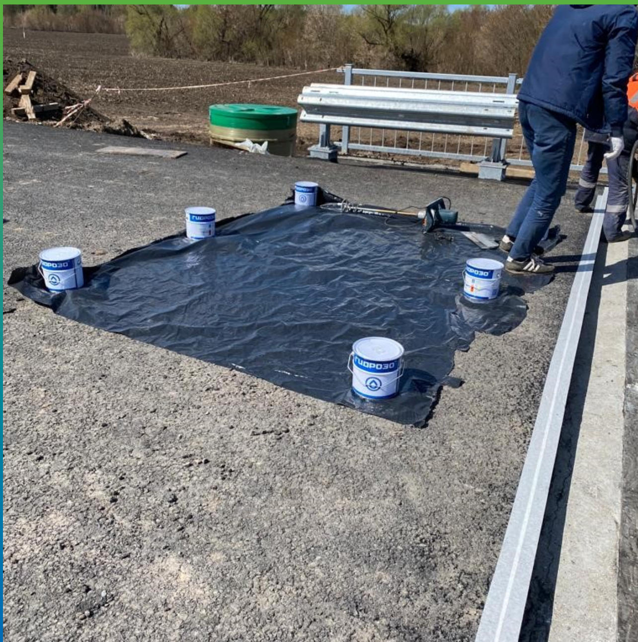
Подготовленное рабочее место