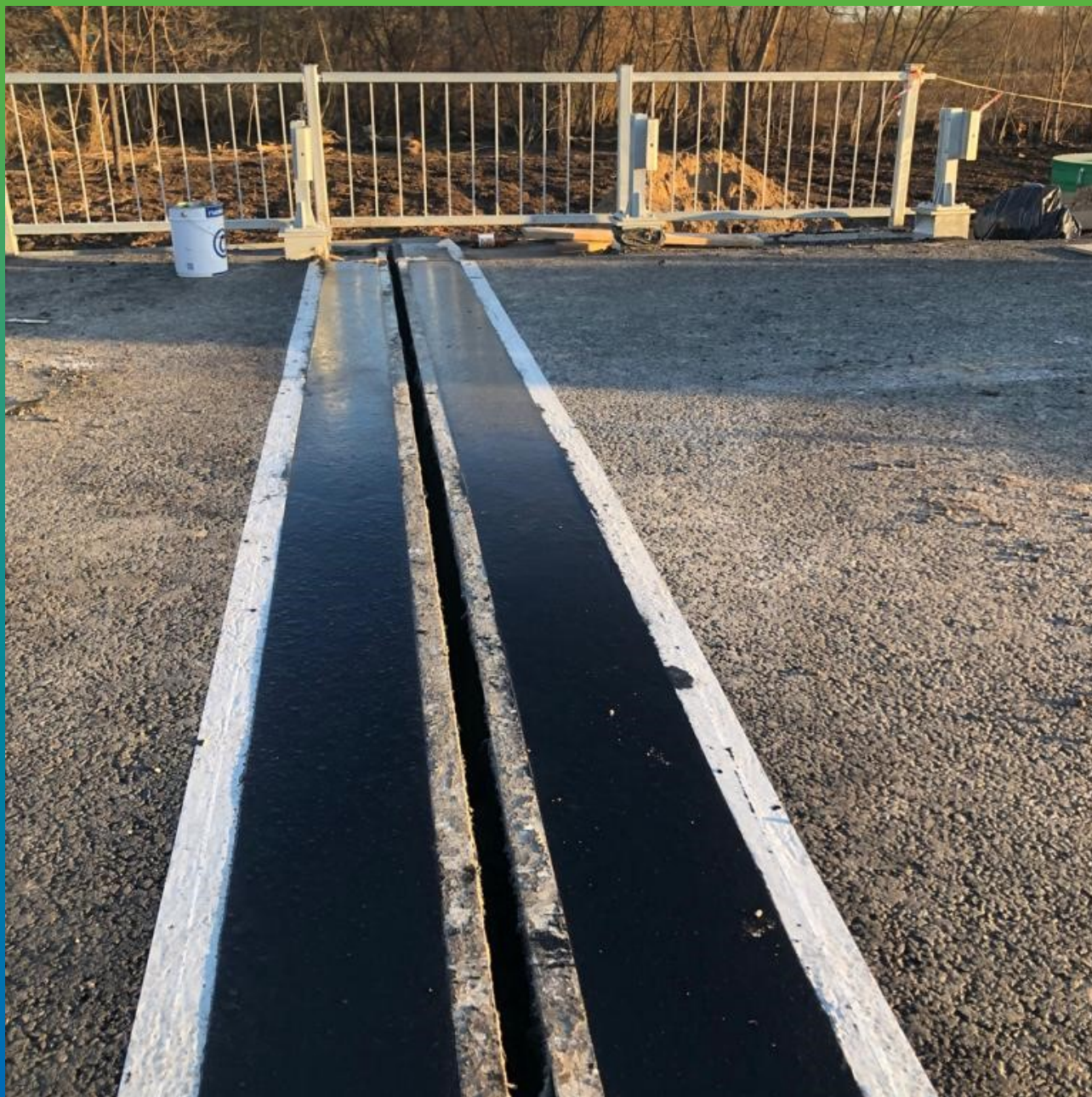
Внешний вид готового шва