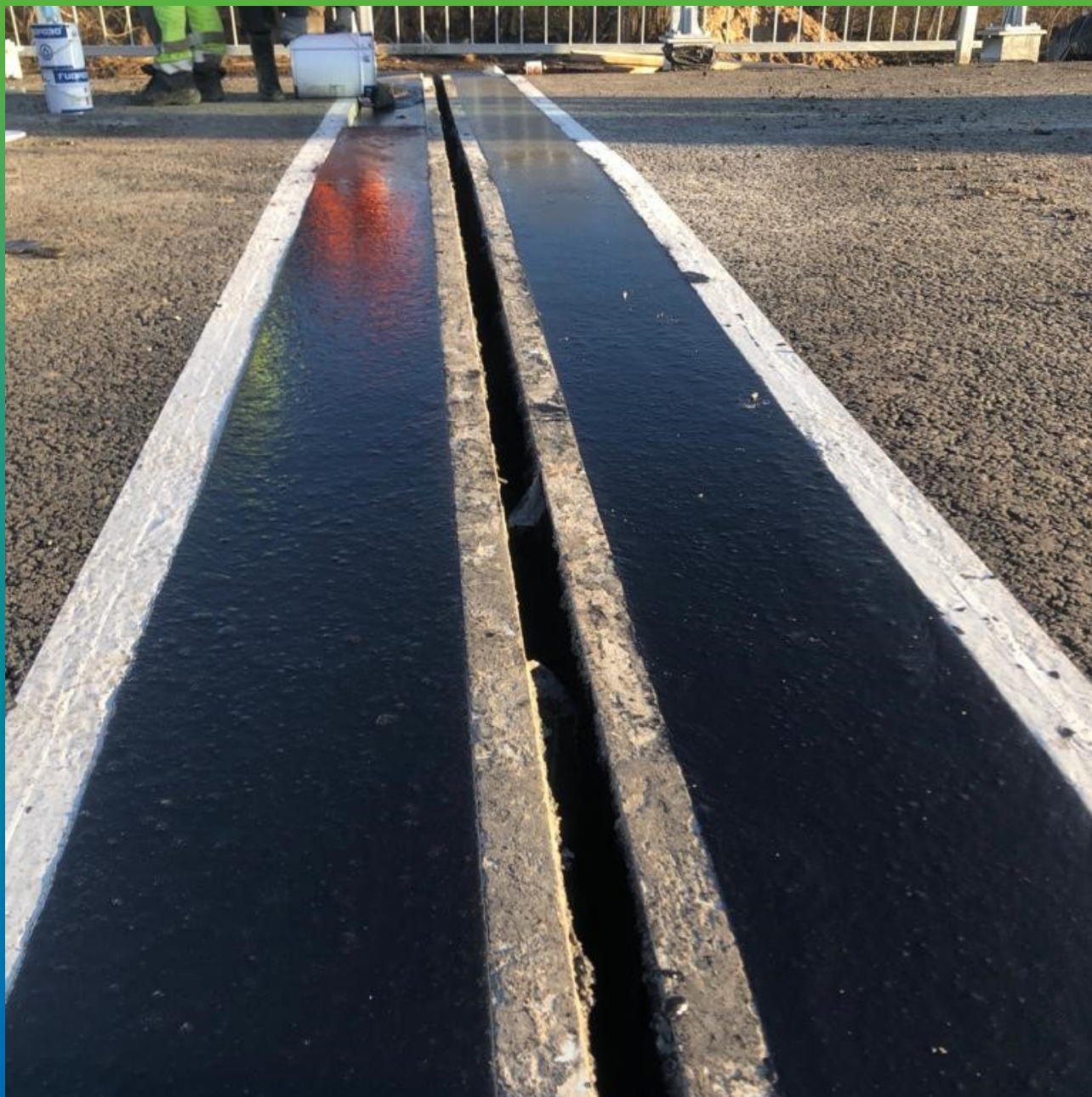
Внешний вид готового шва