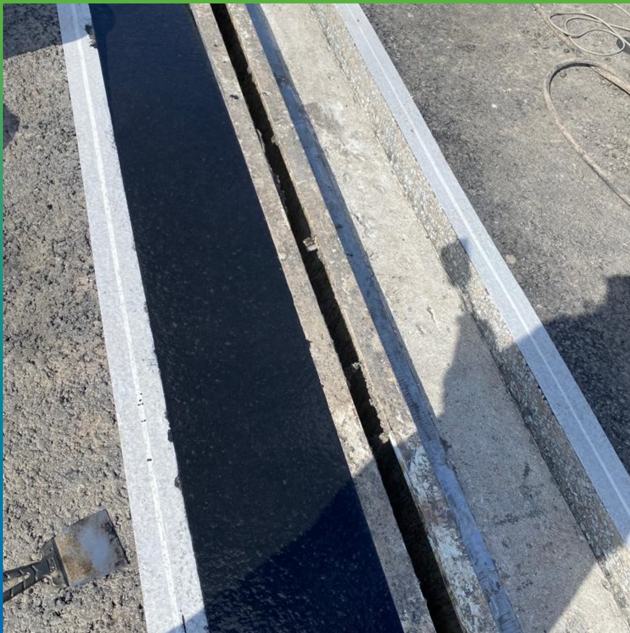
Заполнение штрабы Манопур 336