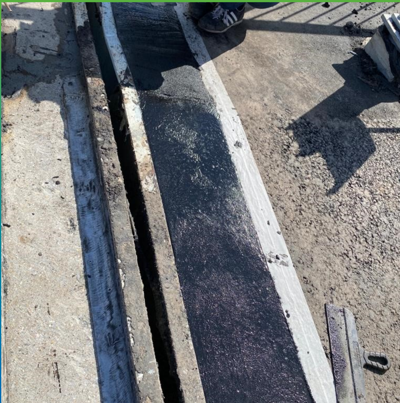
Заполнение штробы Манопур 336