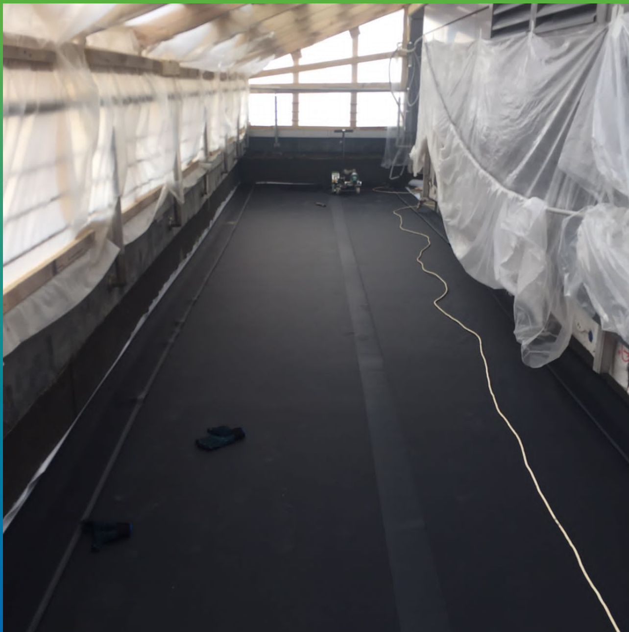
Сваренные полотна мембраны Прелести СТ