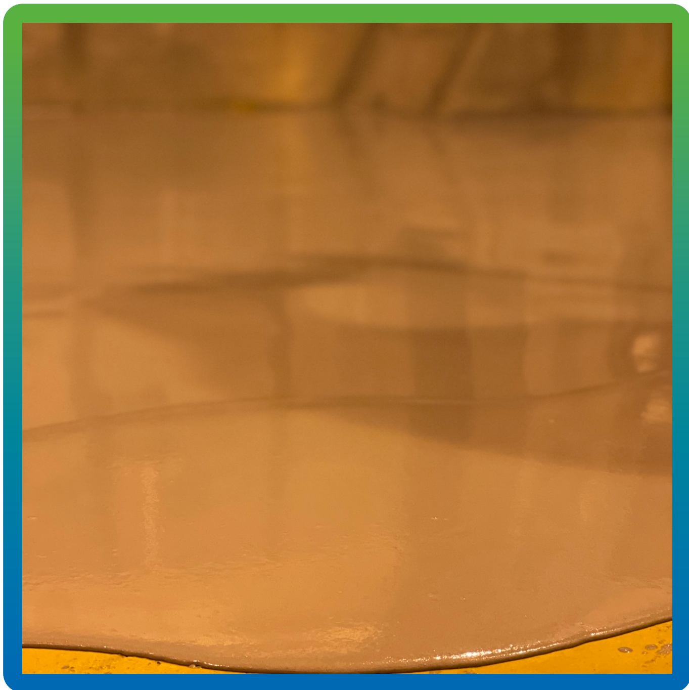
Укладка ДенТоп ПМ 605 Флоу