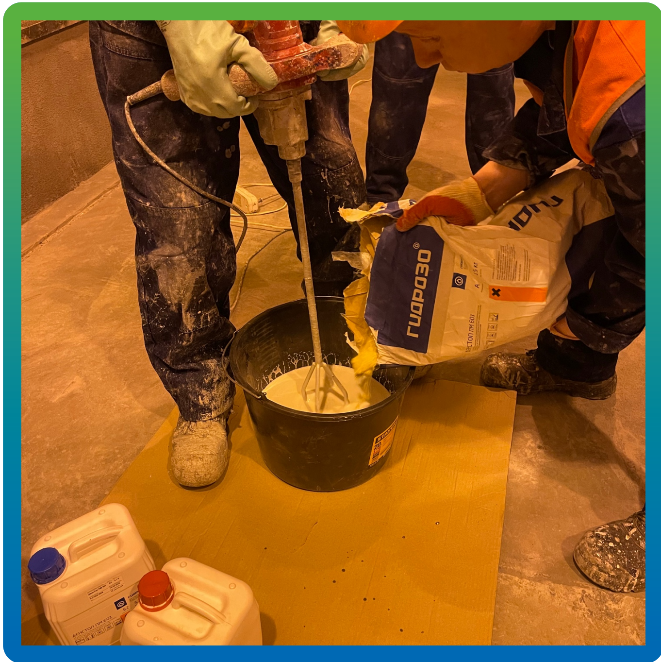
Приготовление грунтового состава