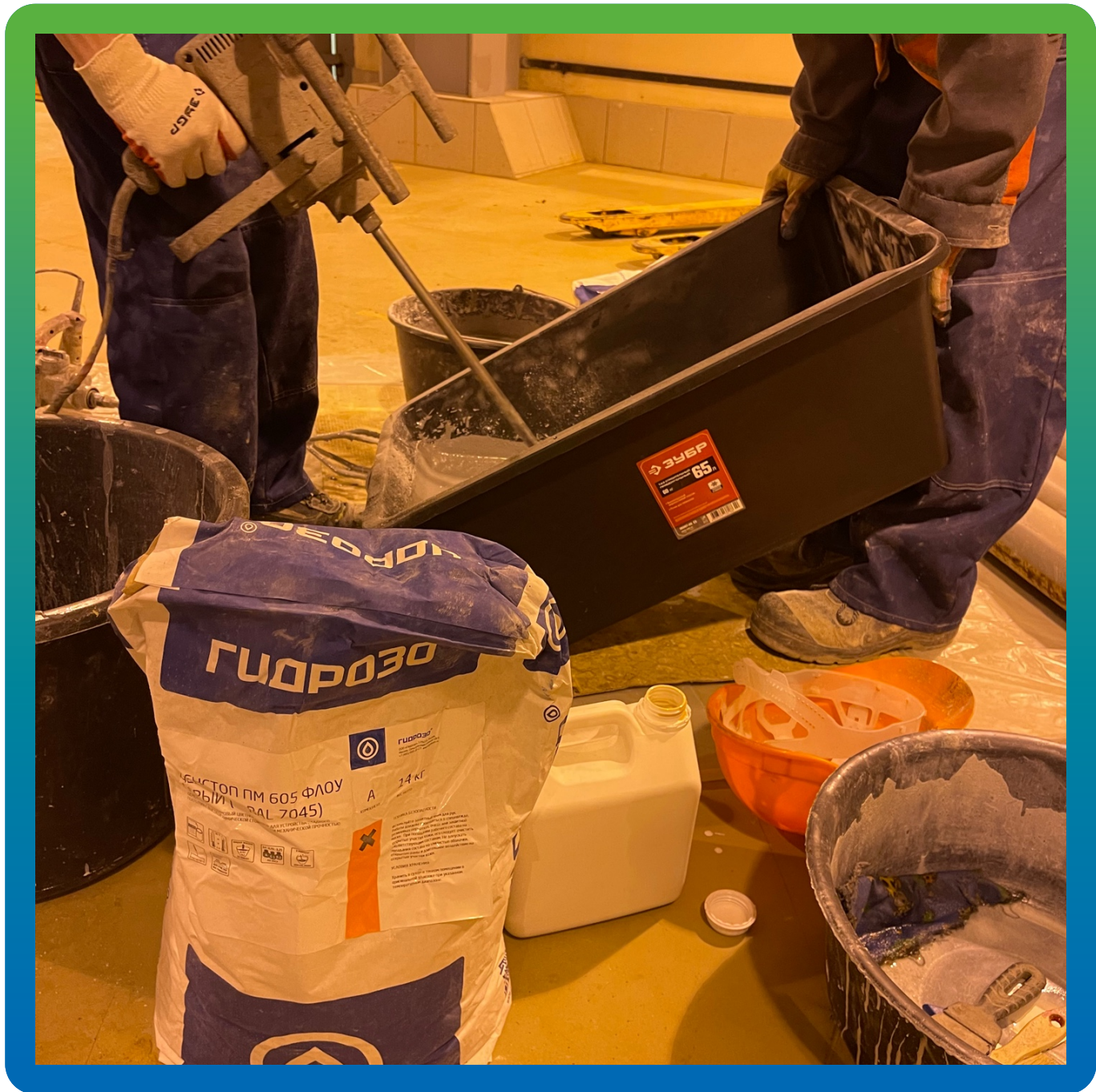
Замешивание ДенСтон ПМ 605 Флоу