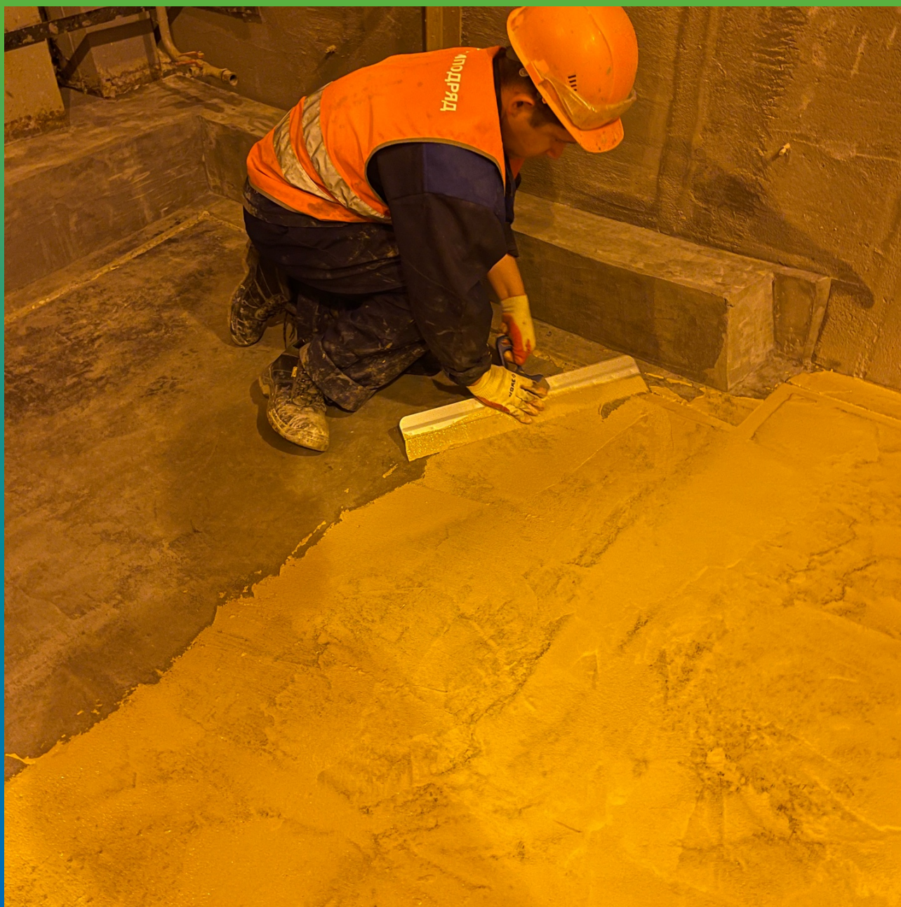
Нанесение грунтовочного состава