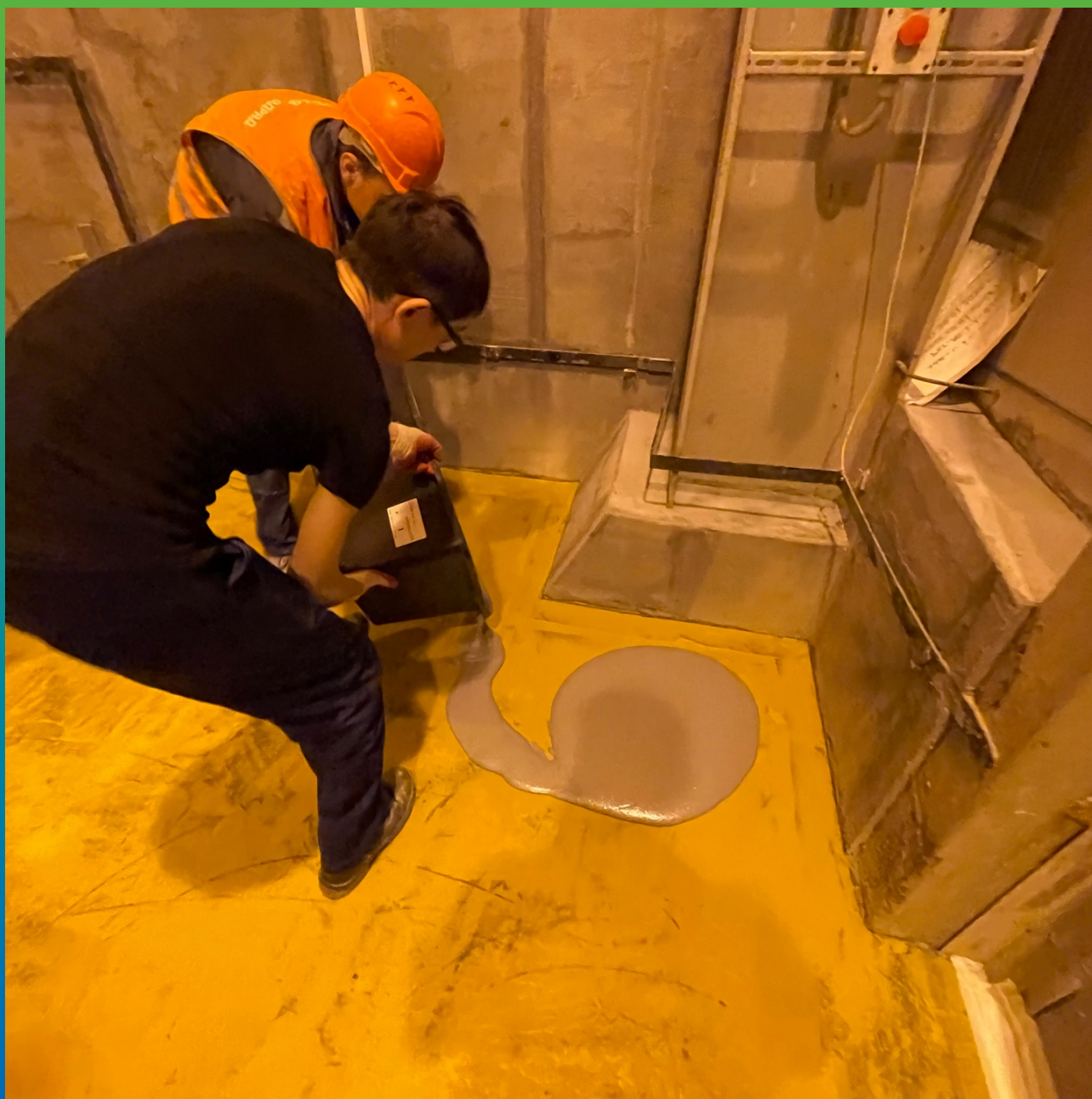
Укладка ДенТоп ПМ 605 Флоу