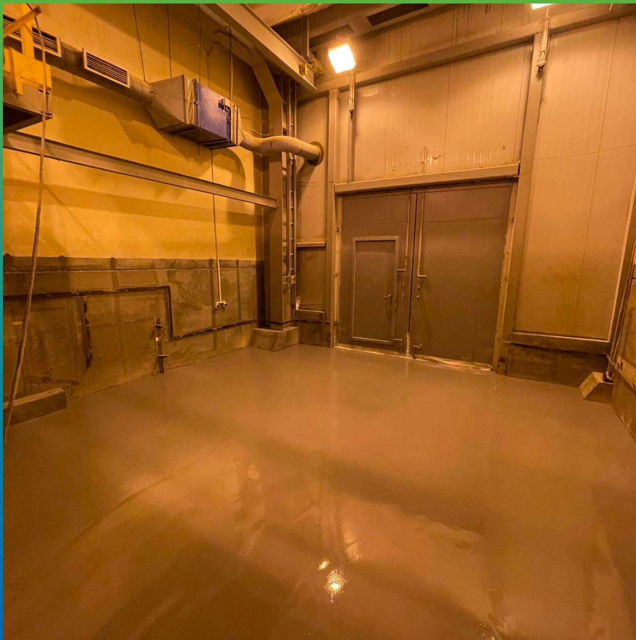
Финишный вид уложенного покрытия