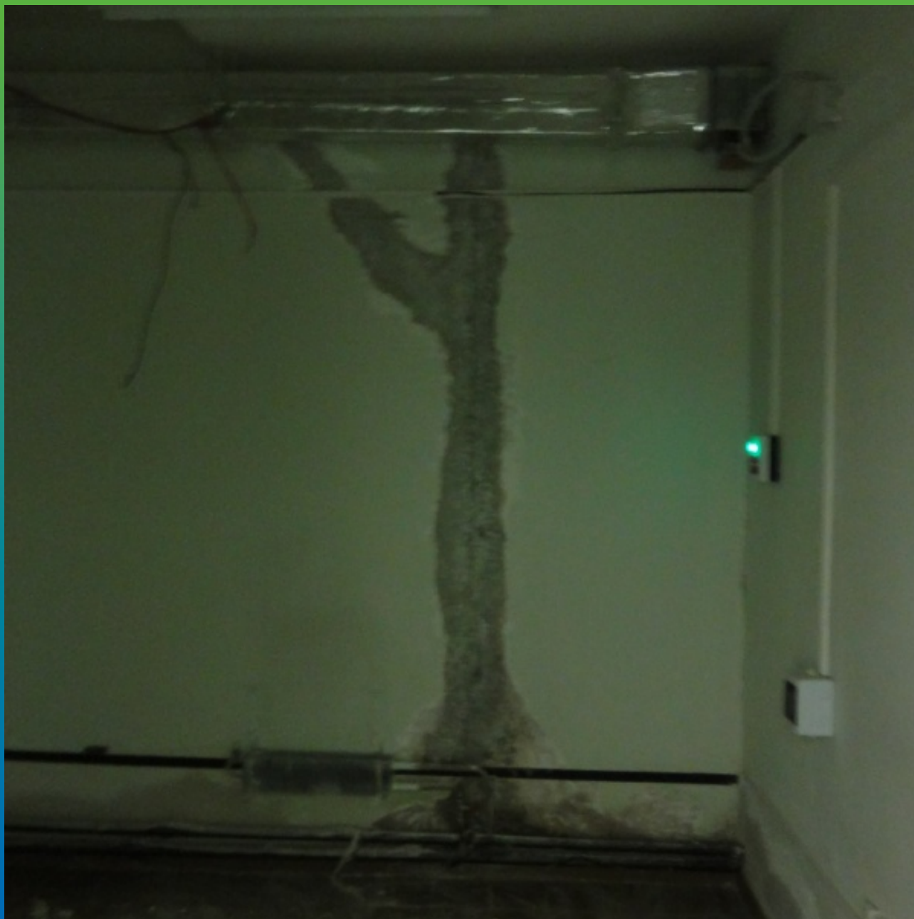
Шов перед началом производства работ