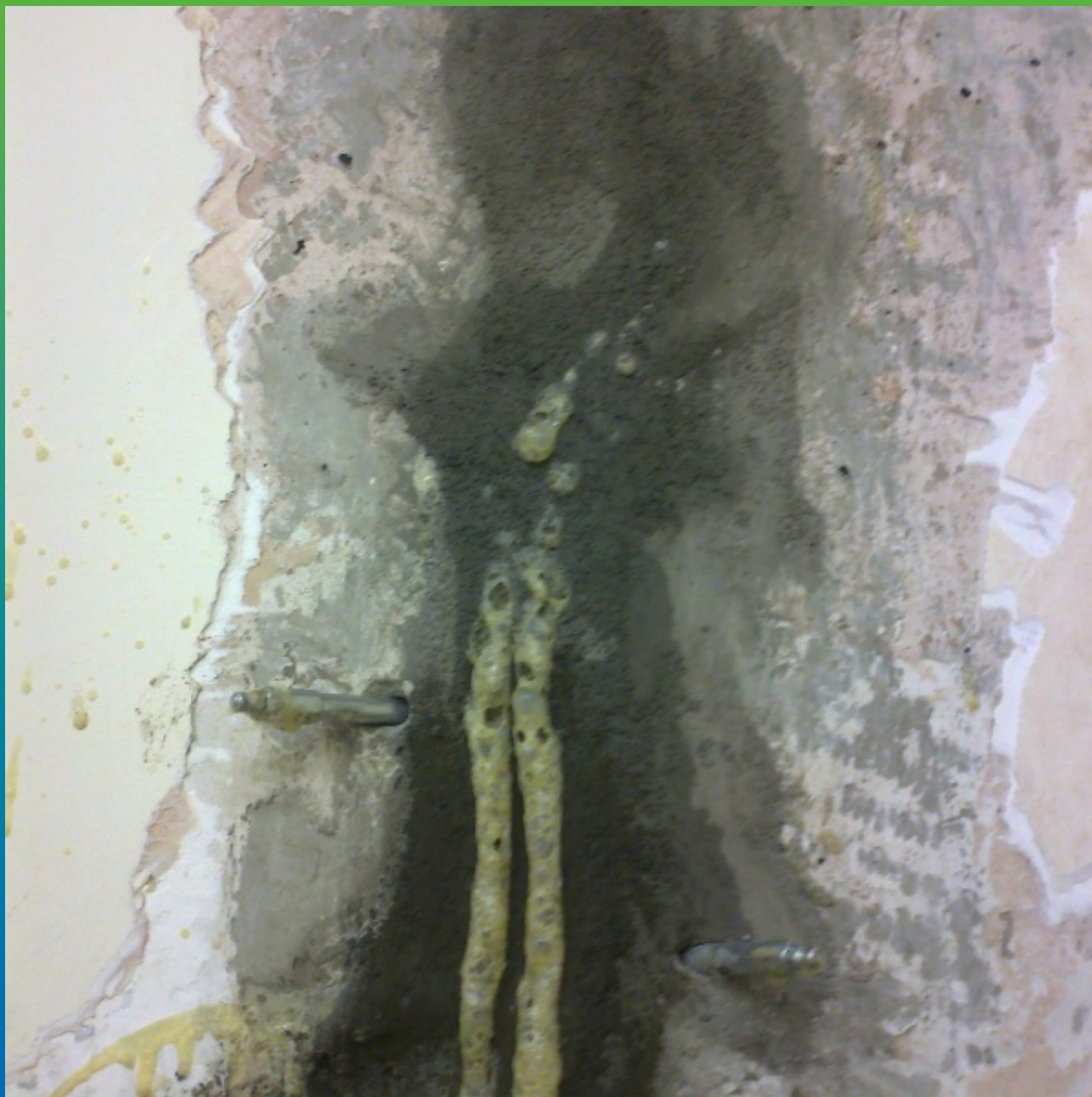
Иъектирование гидроактивной полиуретановой смолы Манопур 11