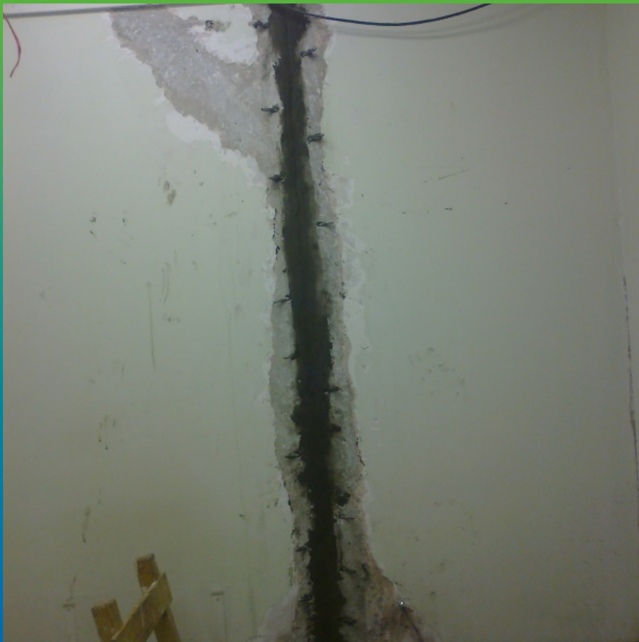
Заполнение штрабы ремонтным раствором Максрест