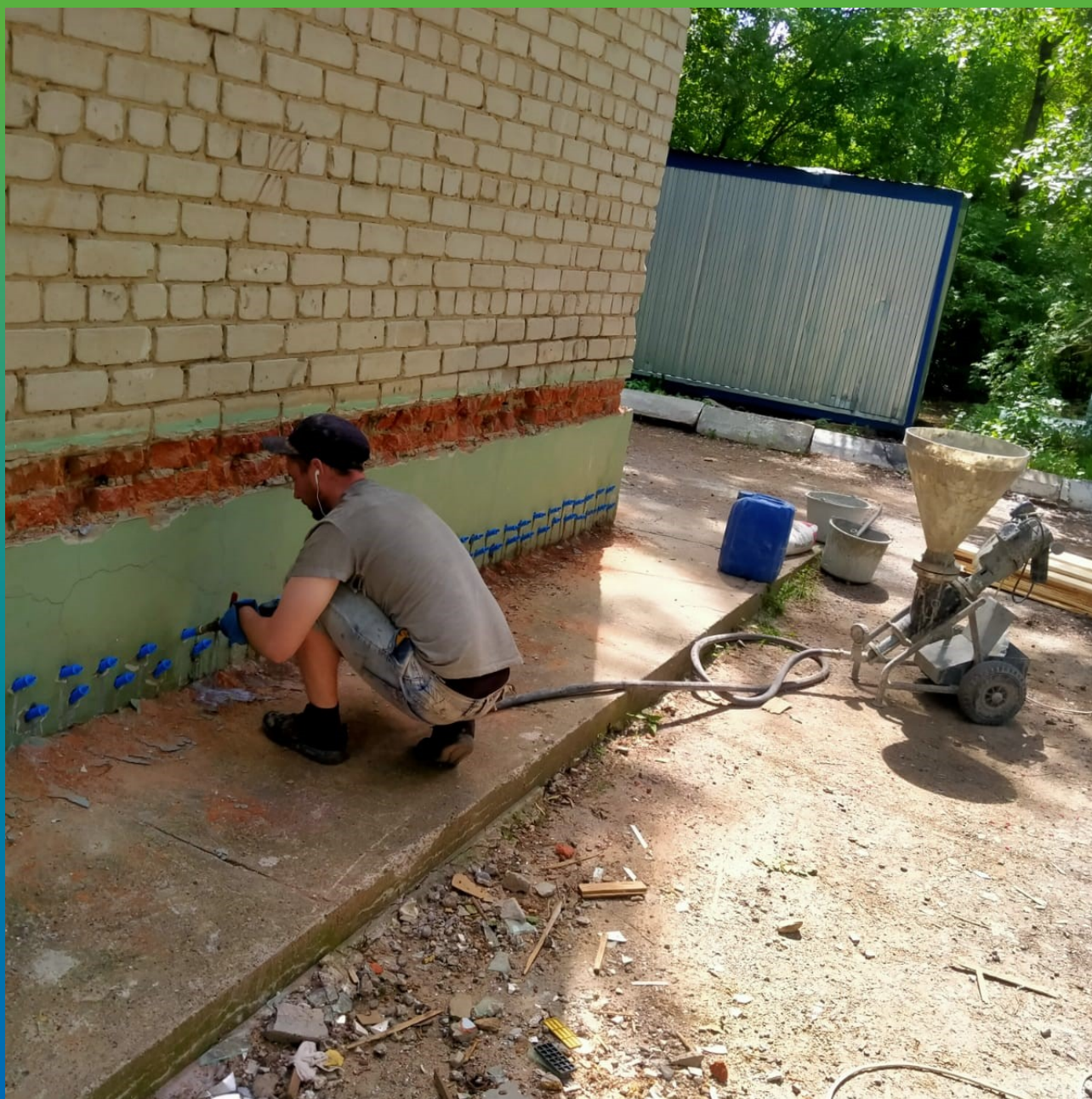
Устройство отсечной гидроизоляции