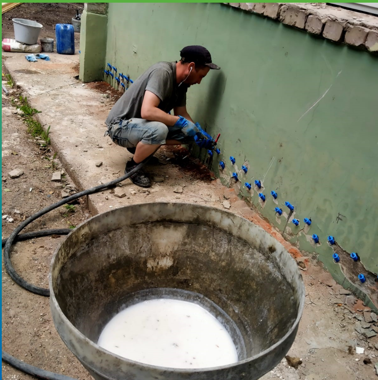
Инъектирование состава по контуру здания