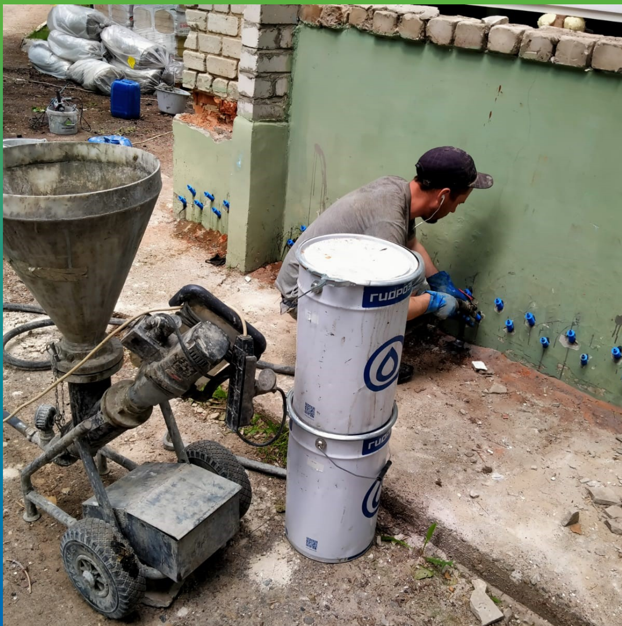
Подача подготовленного раствора Маноксан 149 Эко