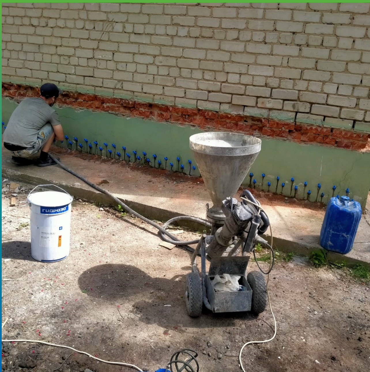
Инъектирование состава по контуру здания