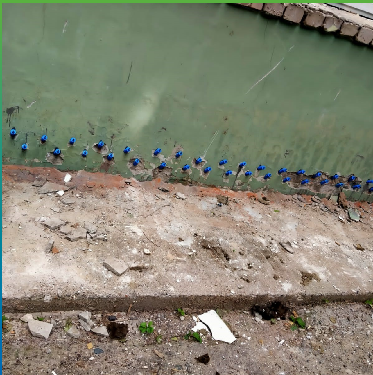
Бурение шпуров и монтаж пакеров для проведения работ по инъектированию