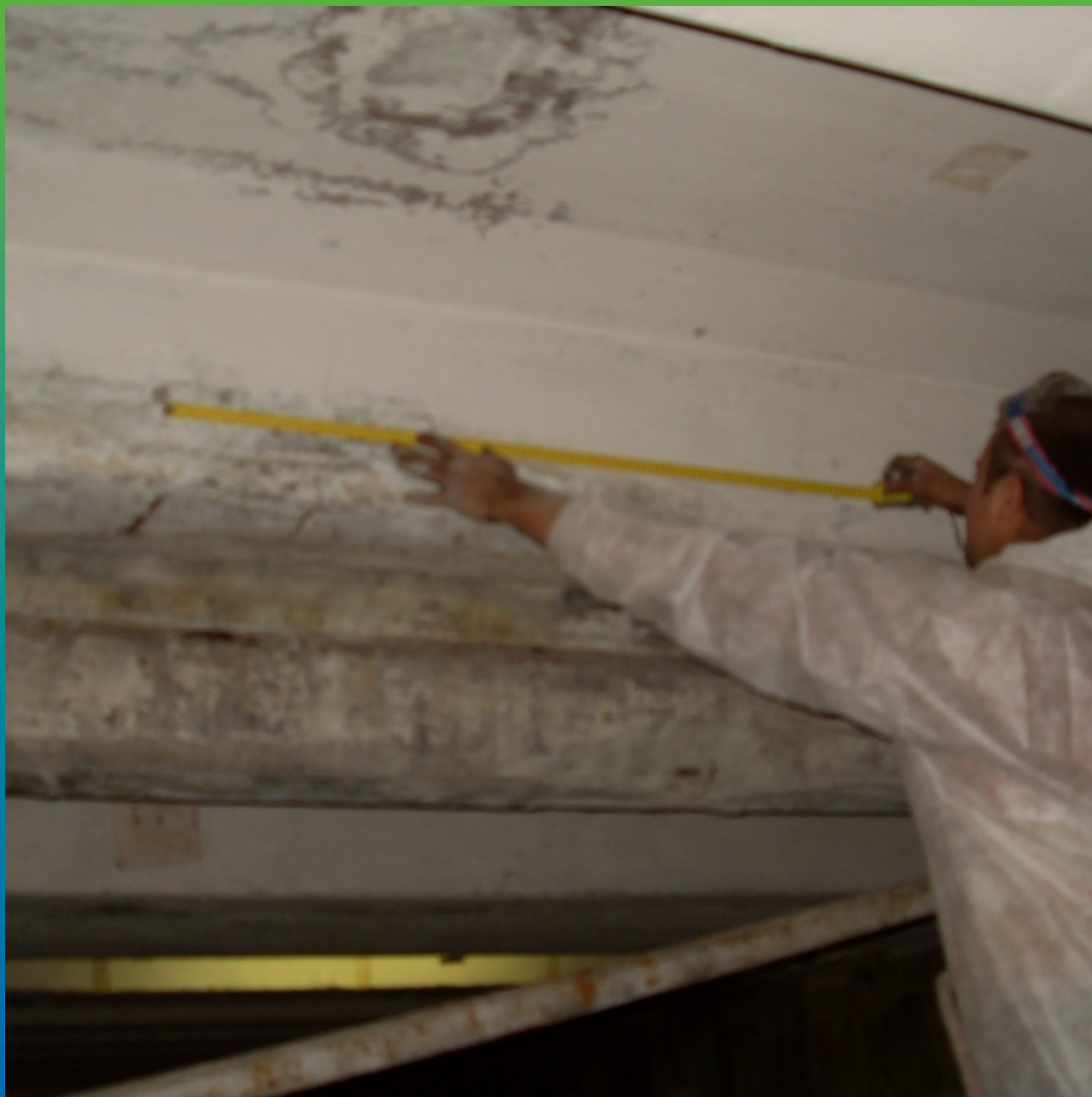
Разметка инъекционных центров