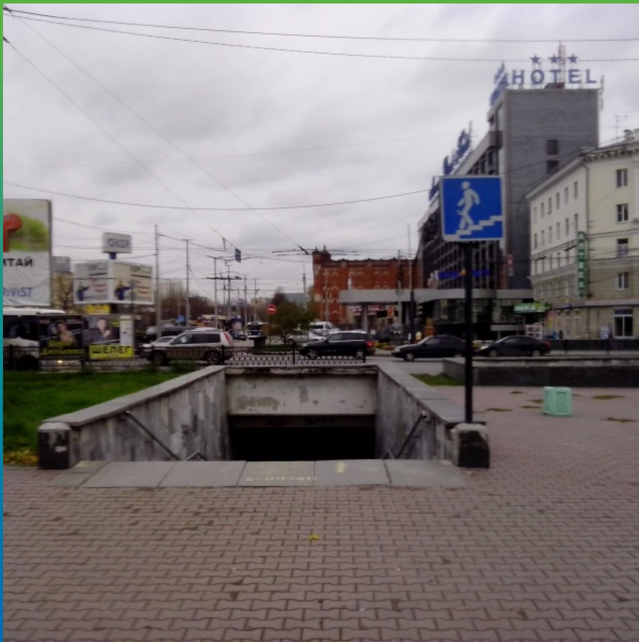
ПОДЗЕМНЫЙ ПЕРЕХОД ПО УЛ. ЧЕЛЮСКИНЦЕВ