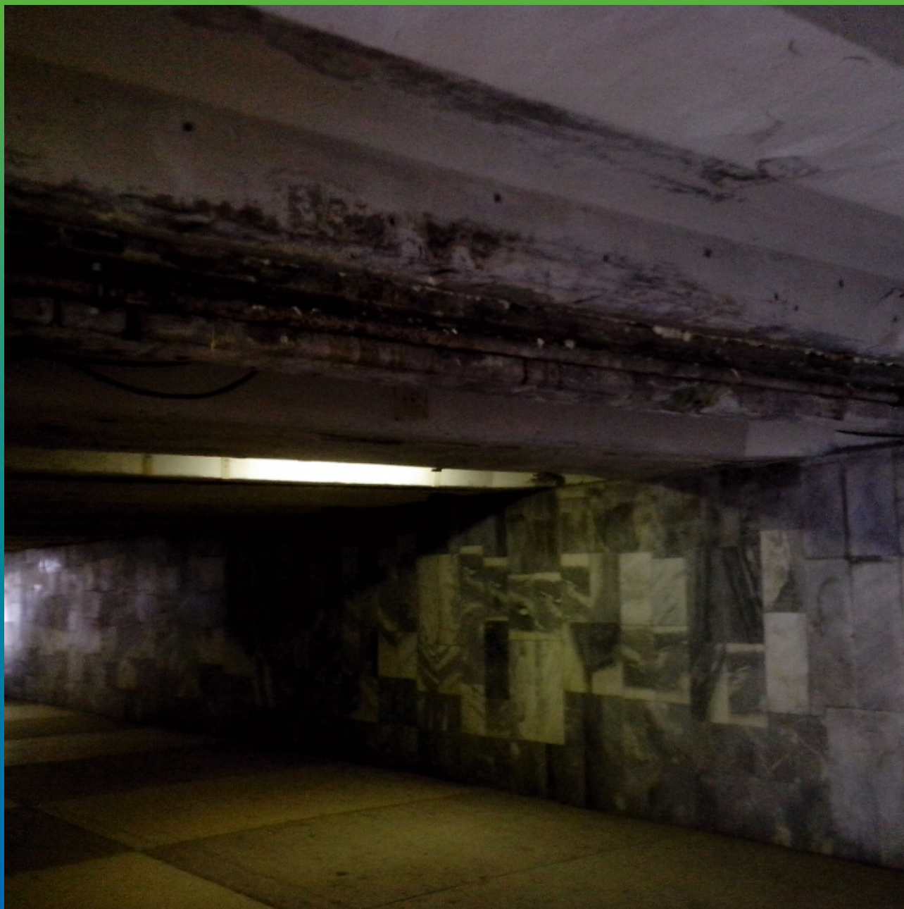
Внешний вид до производства работ