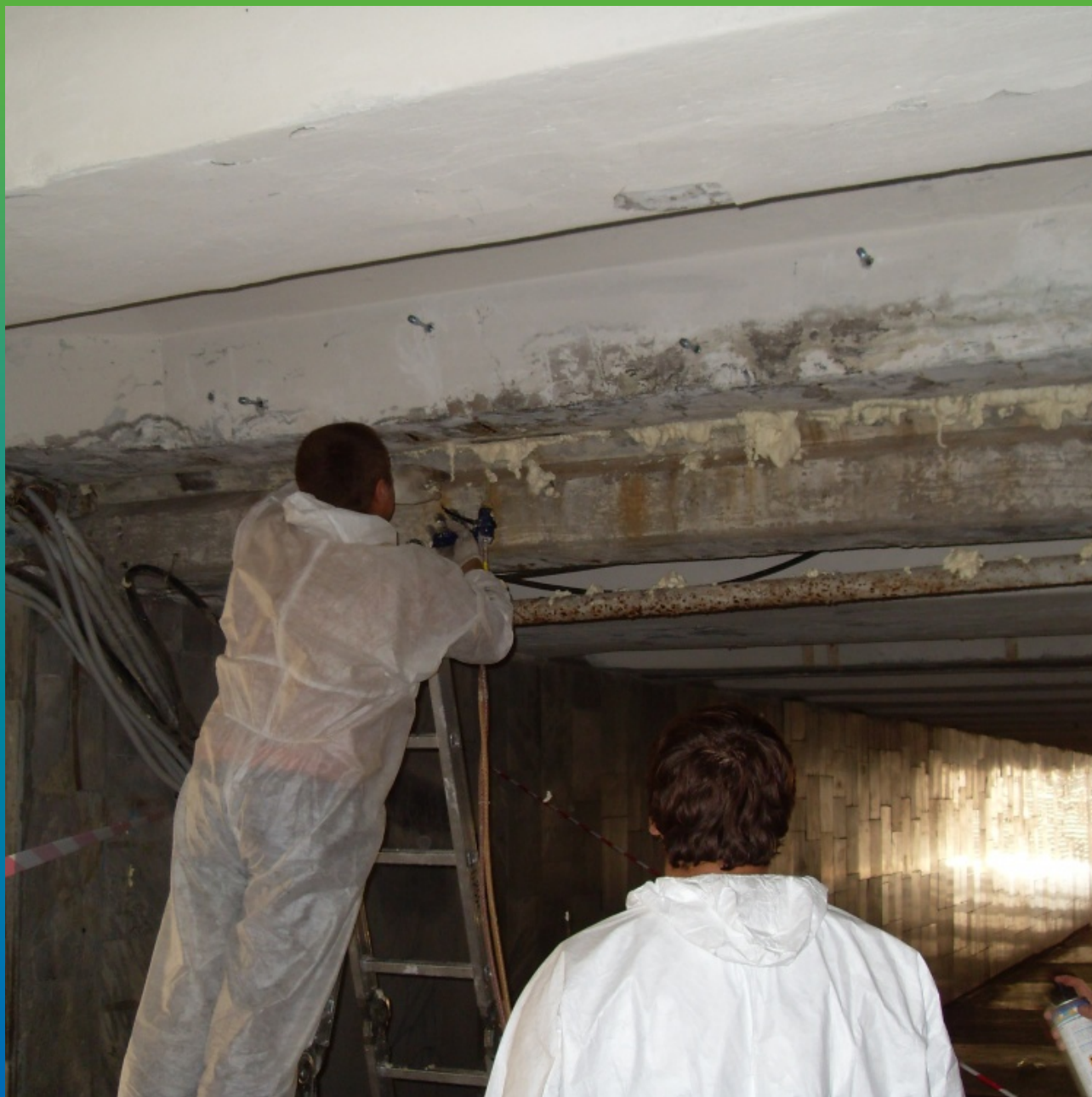
Тампонирование шва перед инъекцией