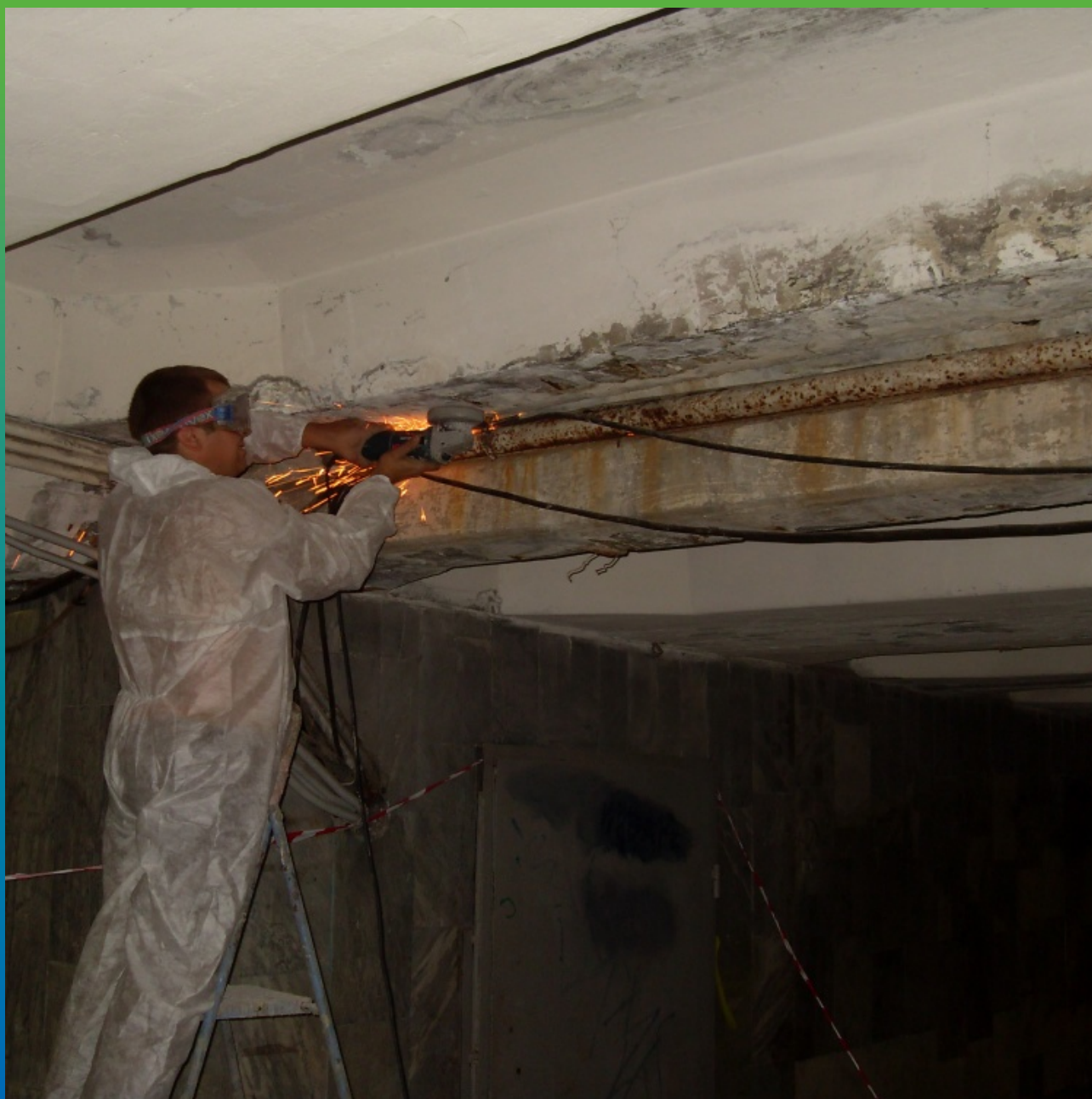
Демонтаж трубы, мешающей производству работ