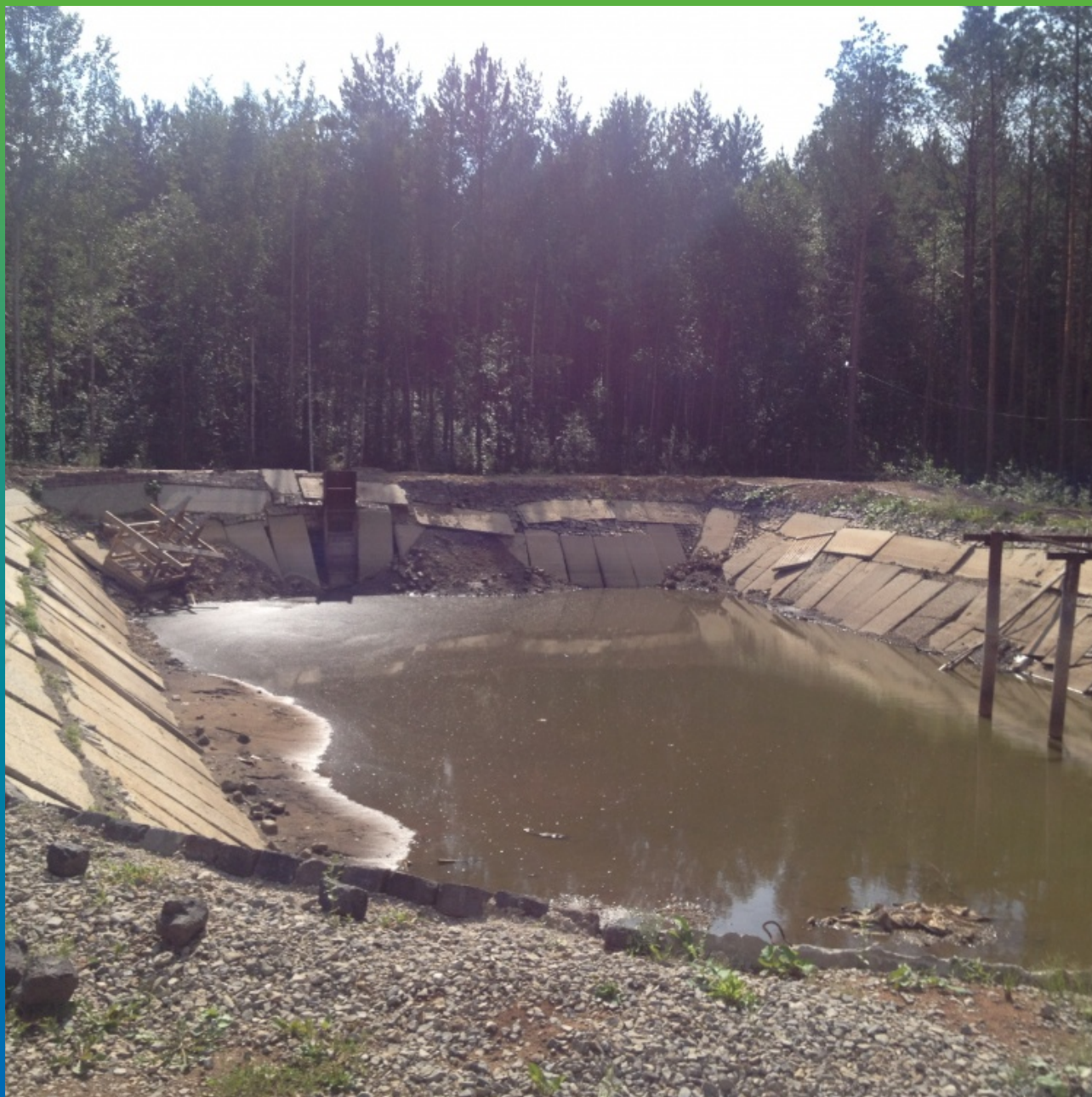
Техническое состояние объекта до выполнения работ