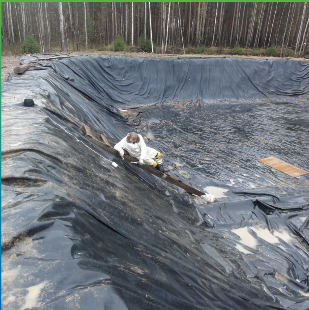
Процесс сварки двух карт в единое полотно