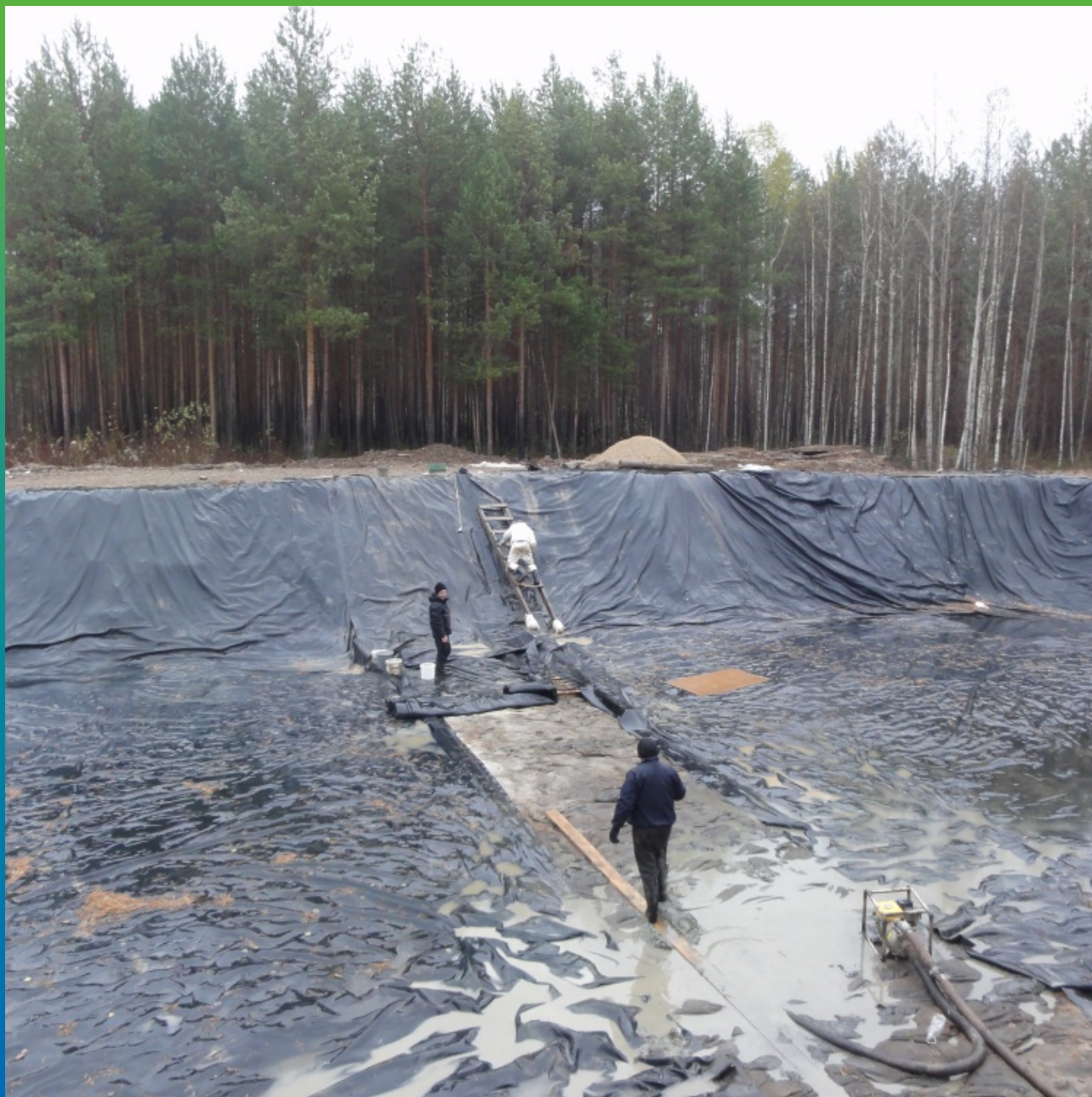
Укладка мембраны на бетонное основание