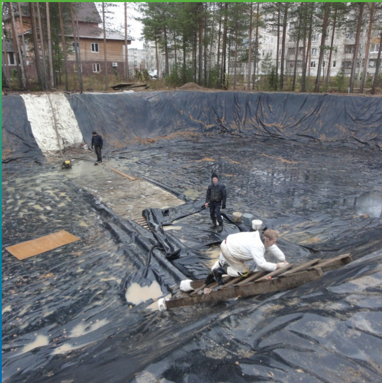
Выравнивание и укладка ЭПДМ-мембраны Эластосил Т перед сваркой