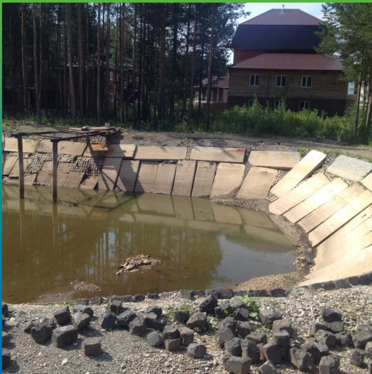
Замер площади пруда