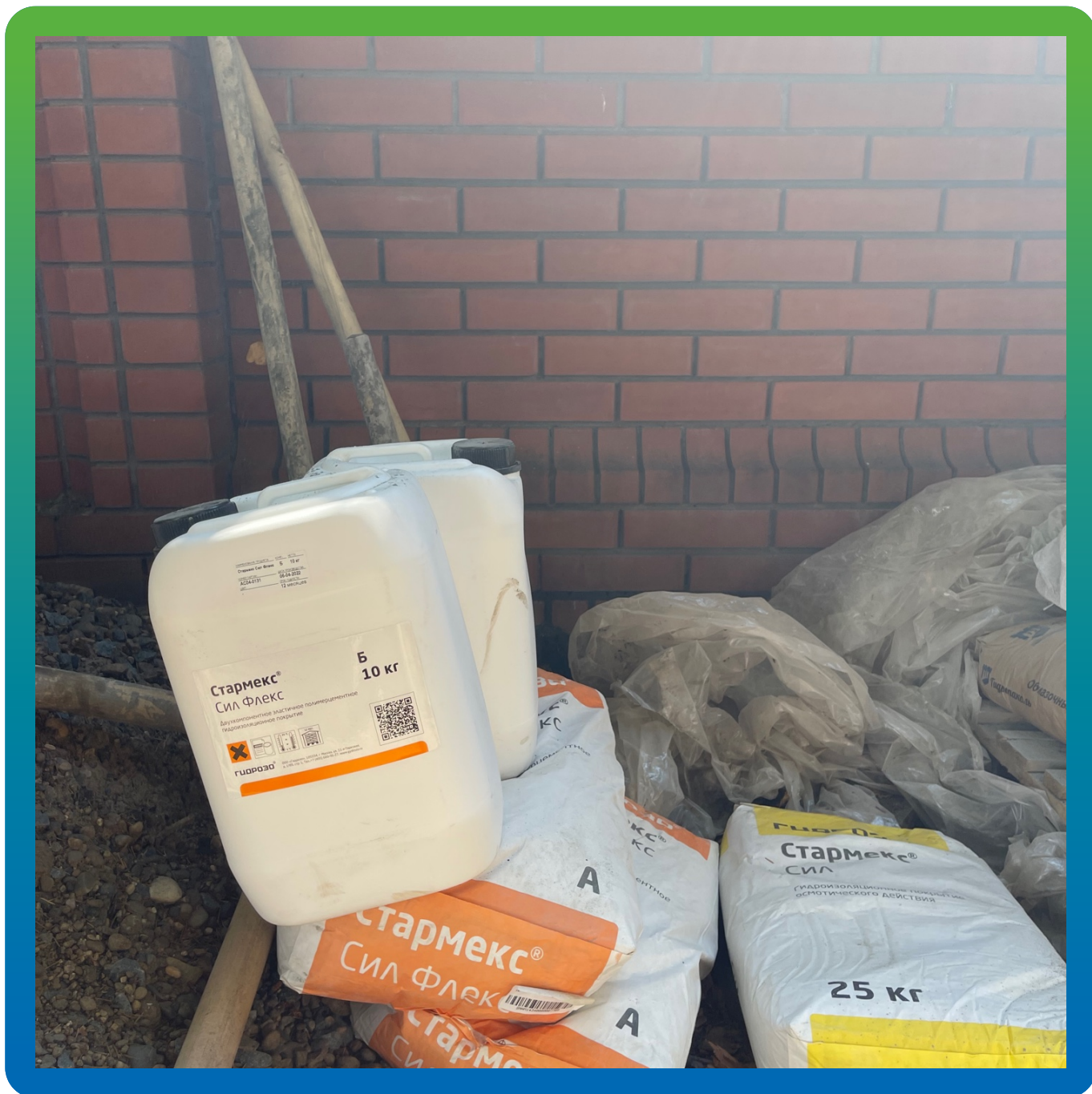
Материал на объекте