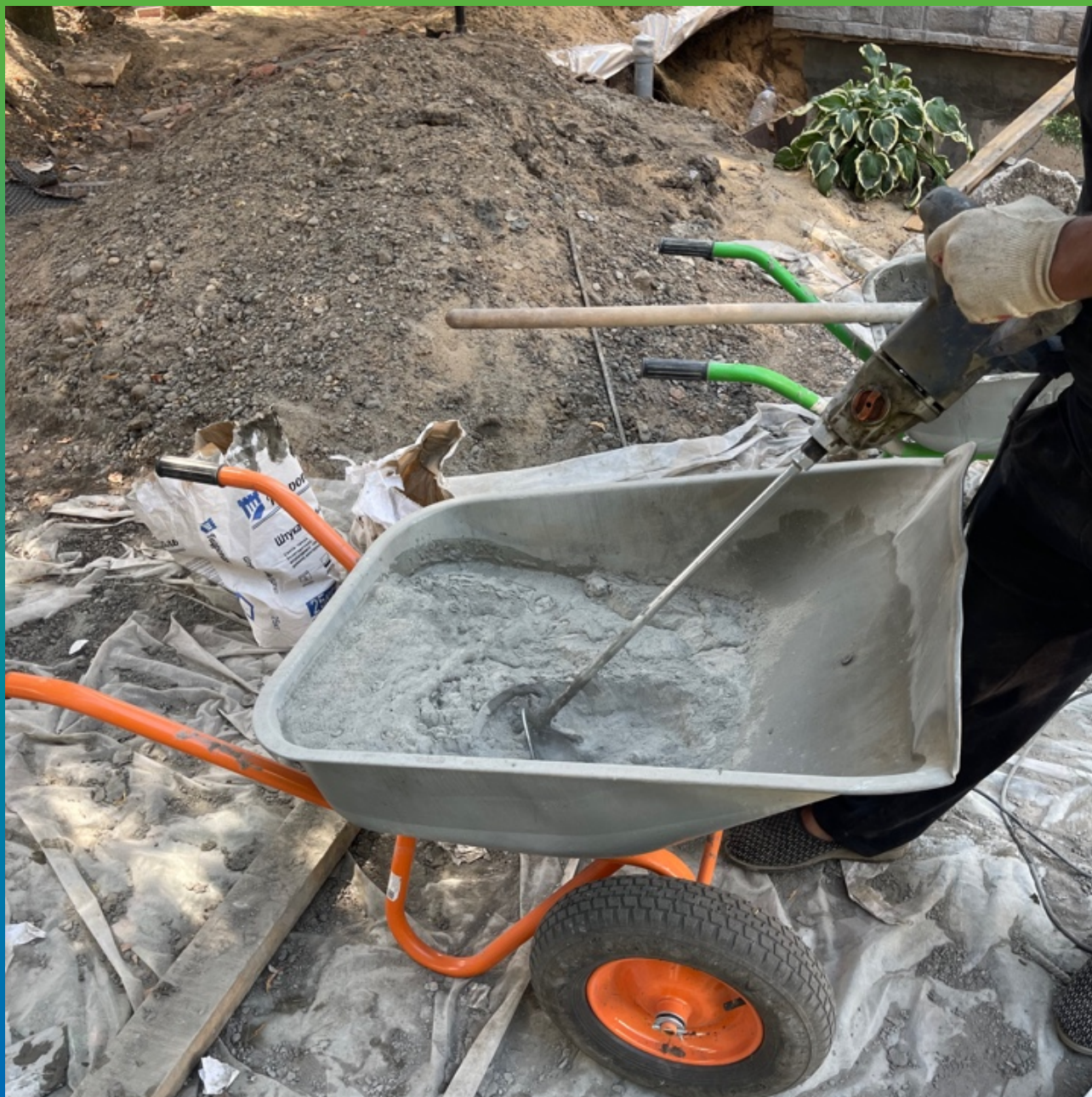
Затворение Стармекс Сил водой