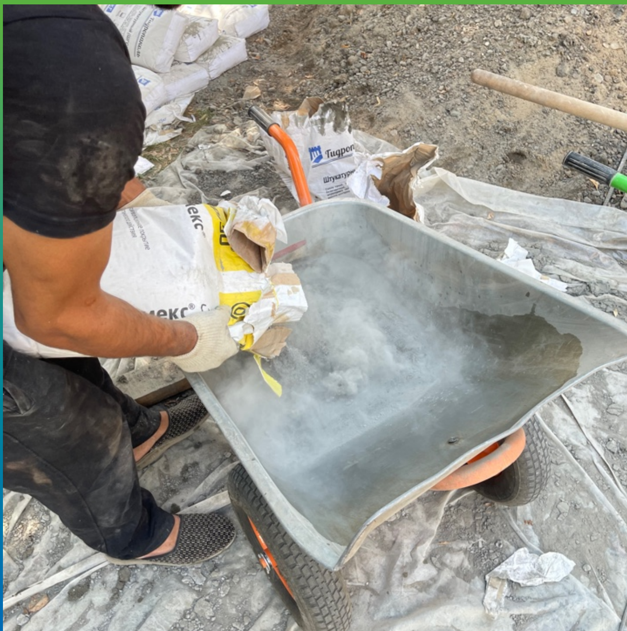
Затворение Стармекс Сил водой