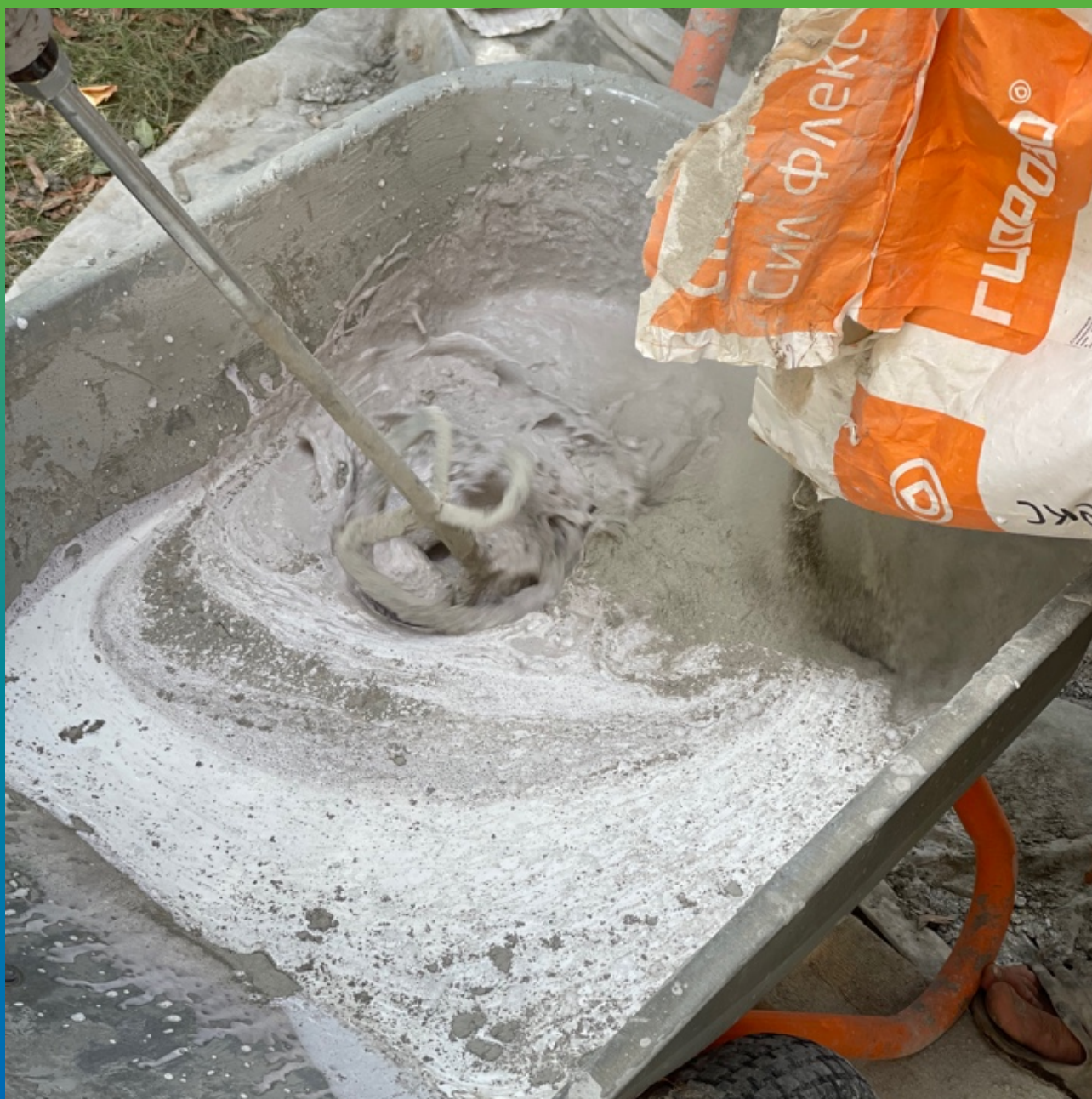
Замешивание Стармекс Сил Флекс