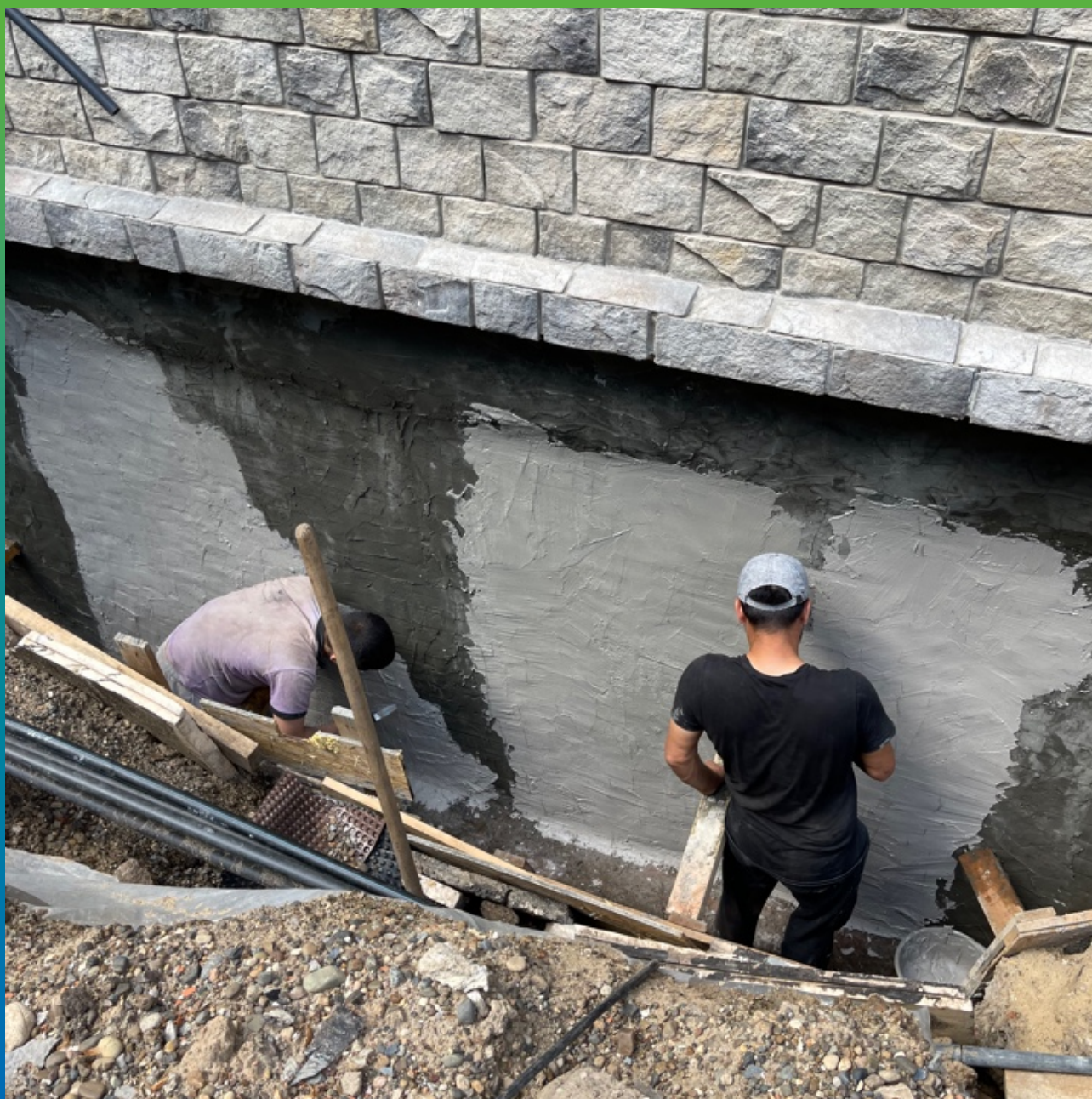
Нанесение Стармекс Сил Флекс