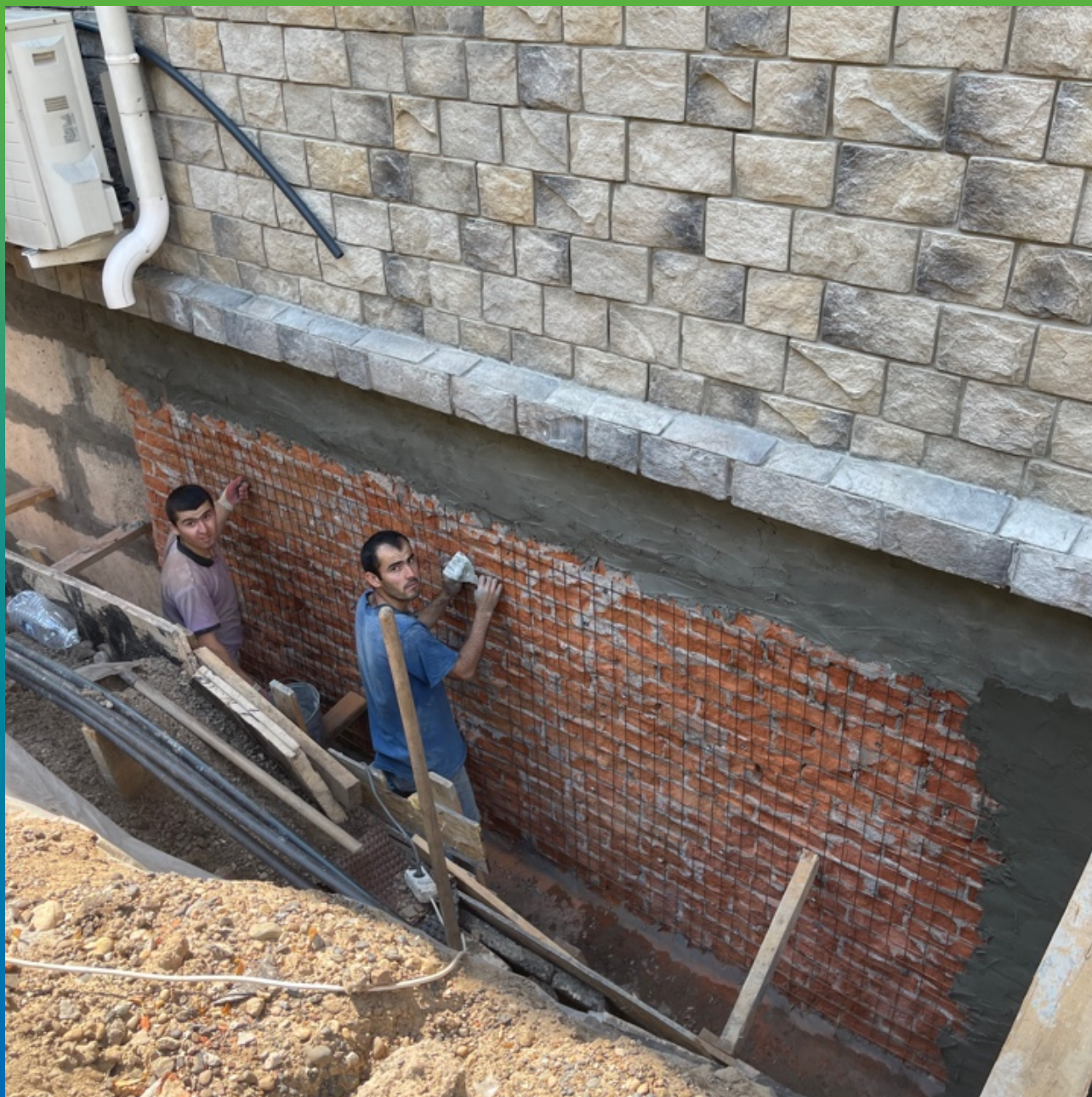
Шлифовка и демонтаж старой рулонной гидроизоляции