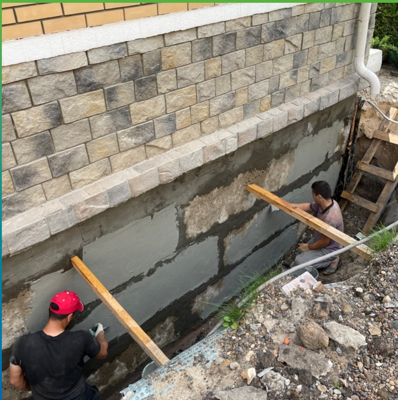
Нанесение Стармекс Сил по блокам