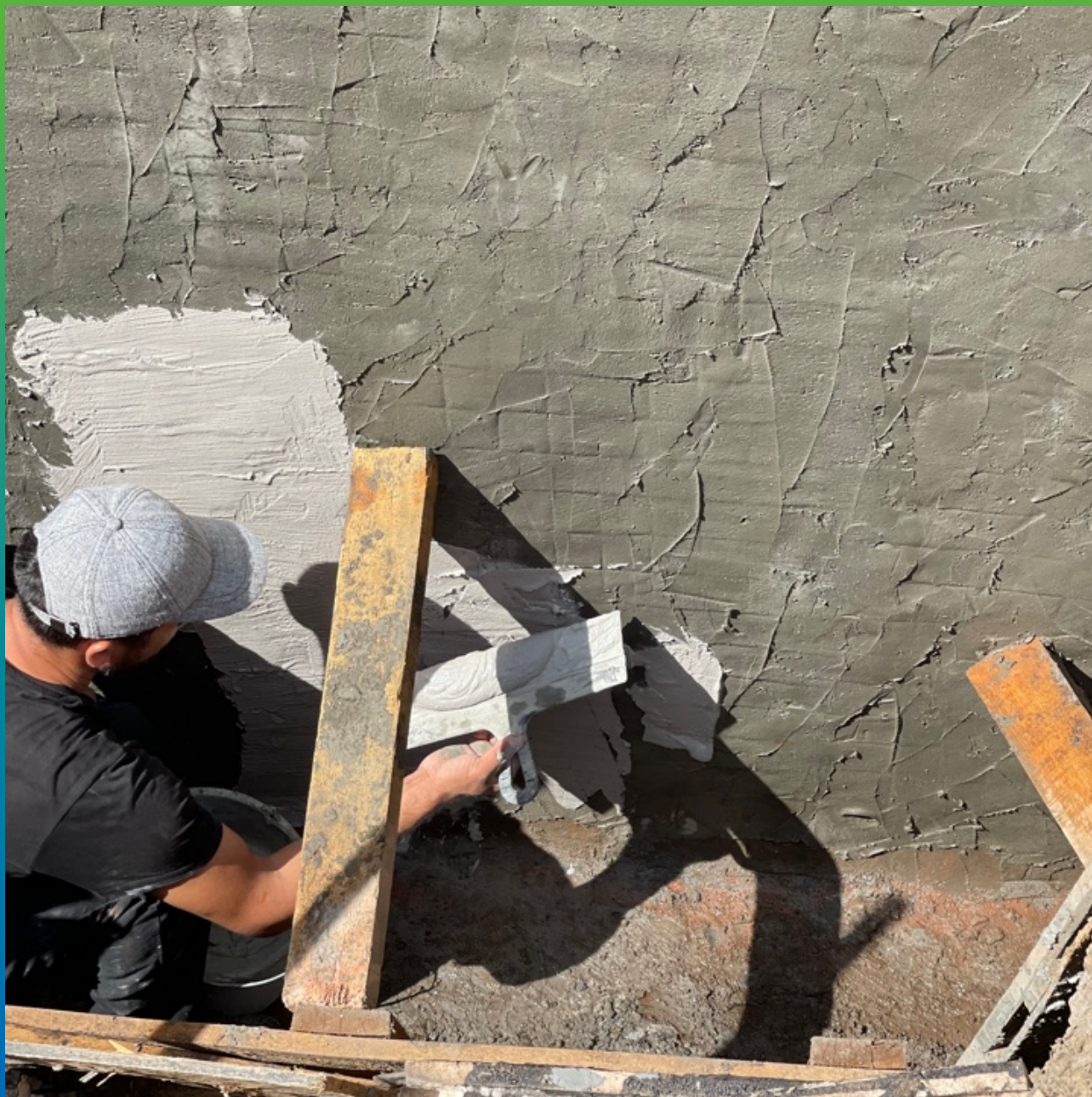
Нанесение Стармекс Сил Флекс