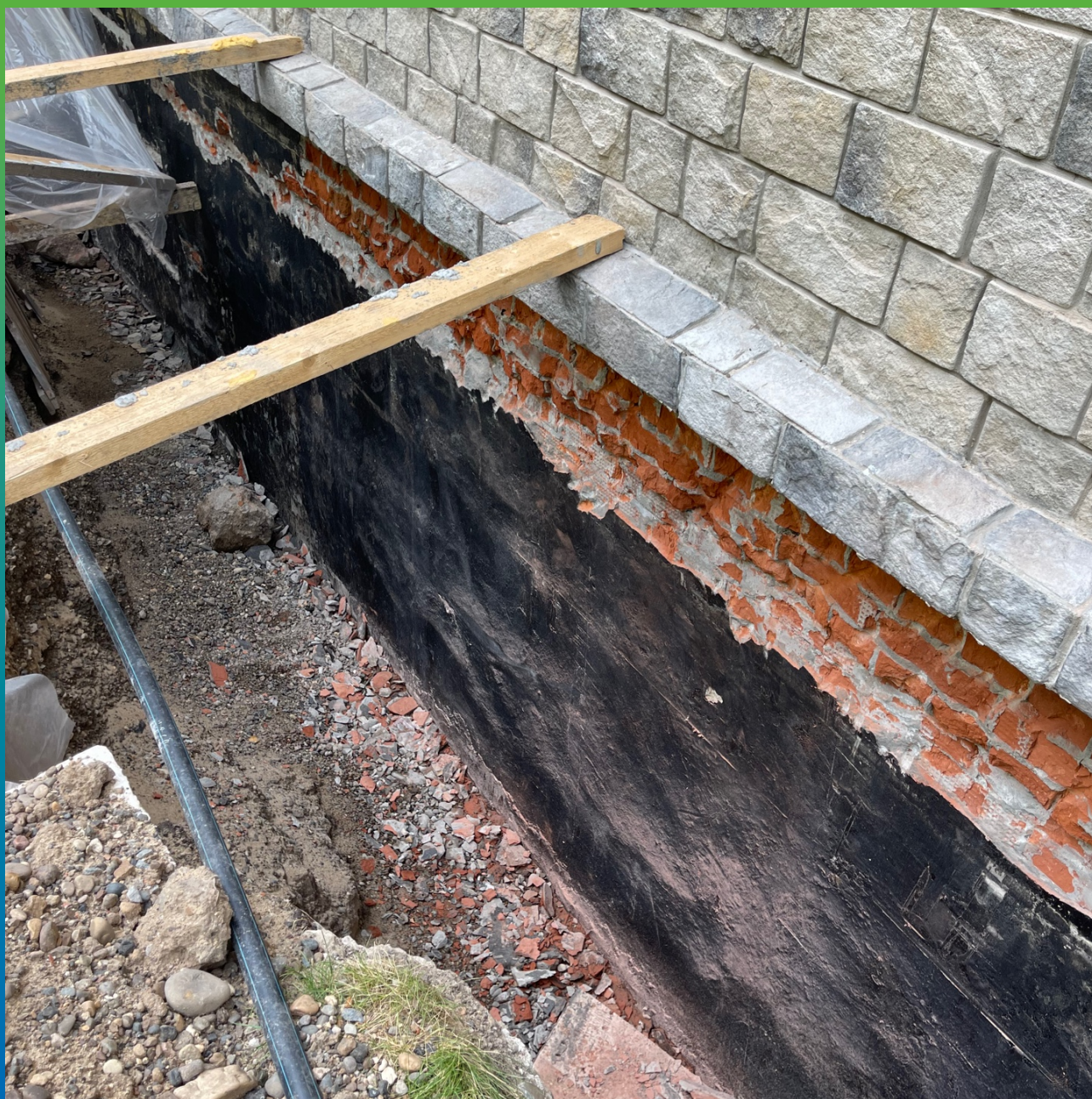
Шлифовка и демонтаж старой рулонной гидроизоляции