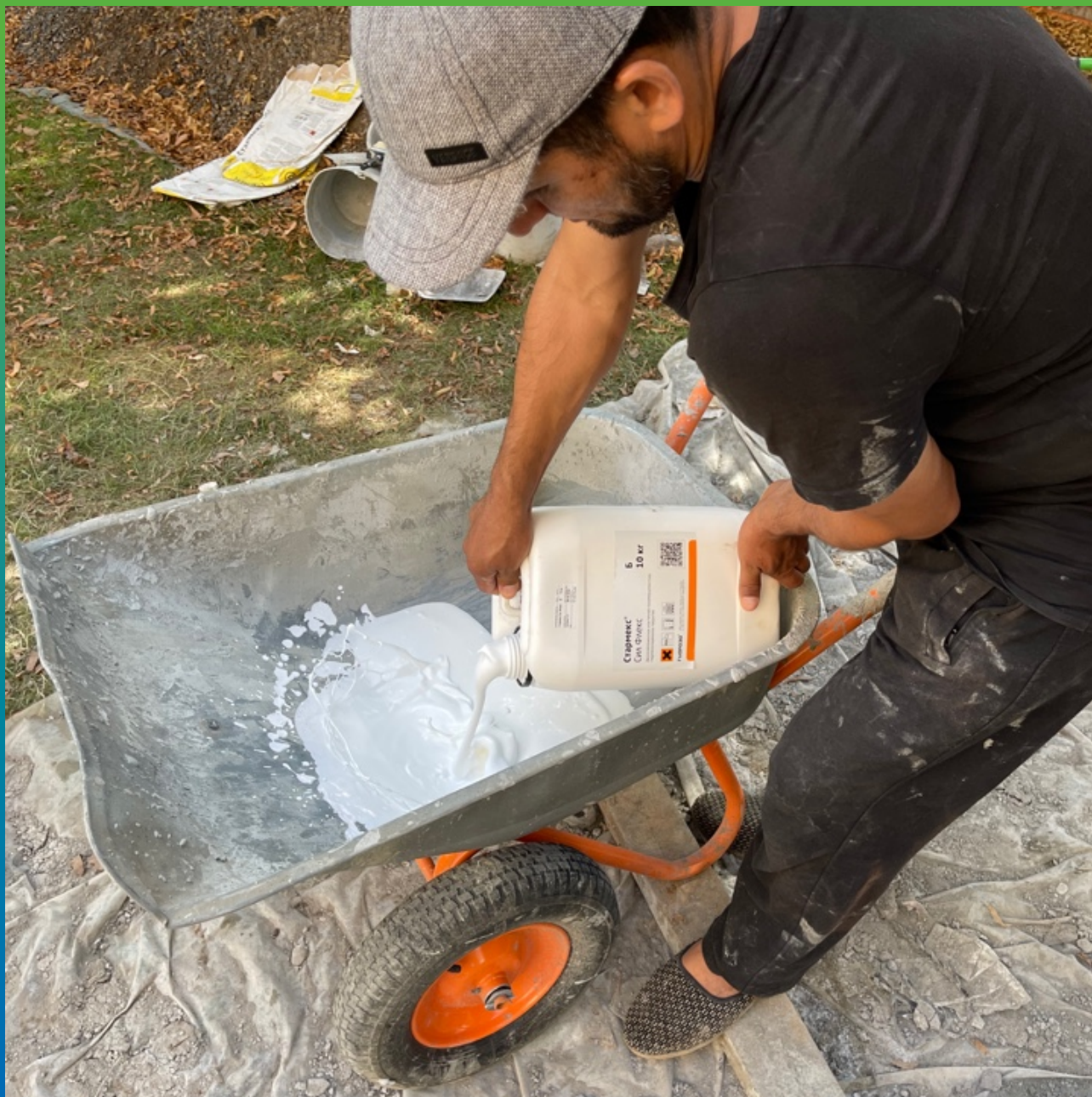
Замешивание Стармекс Сил Флекс