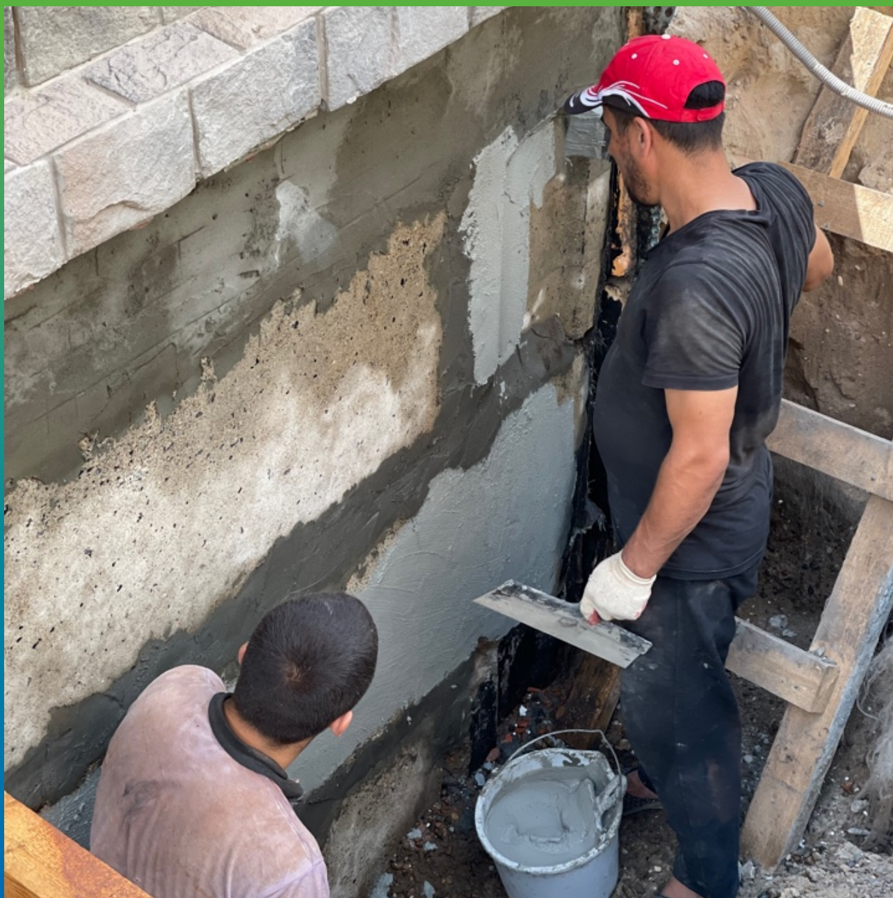
Нанесение Стармекс Сил по блокам