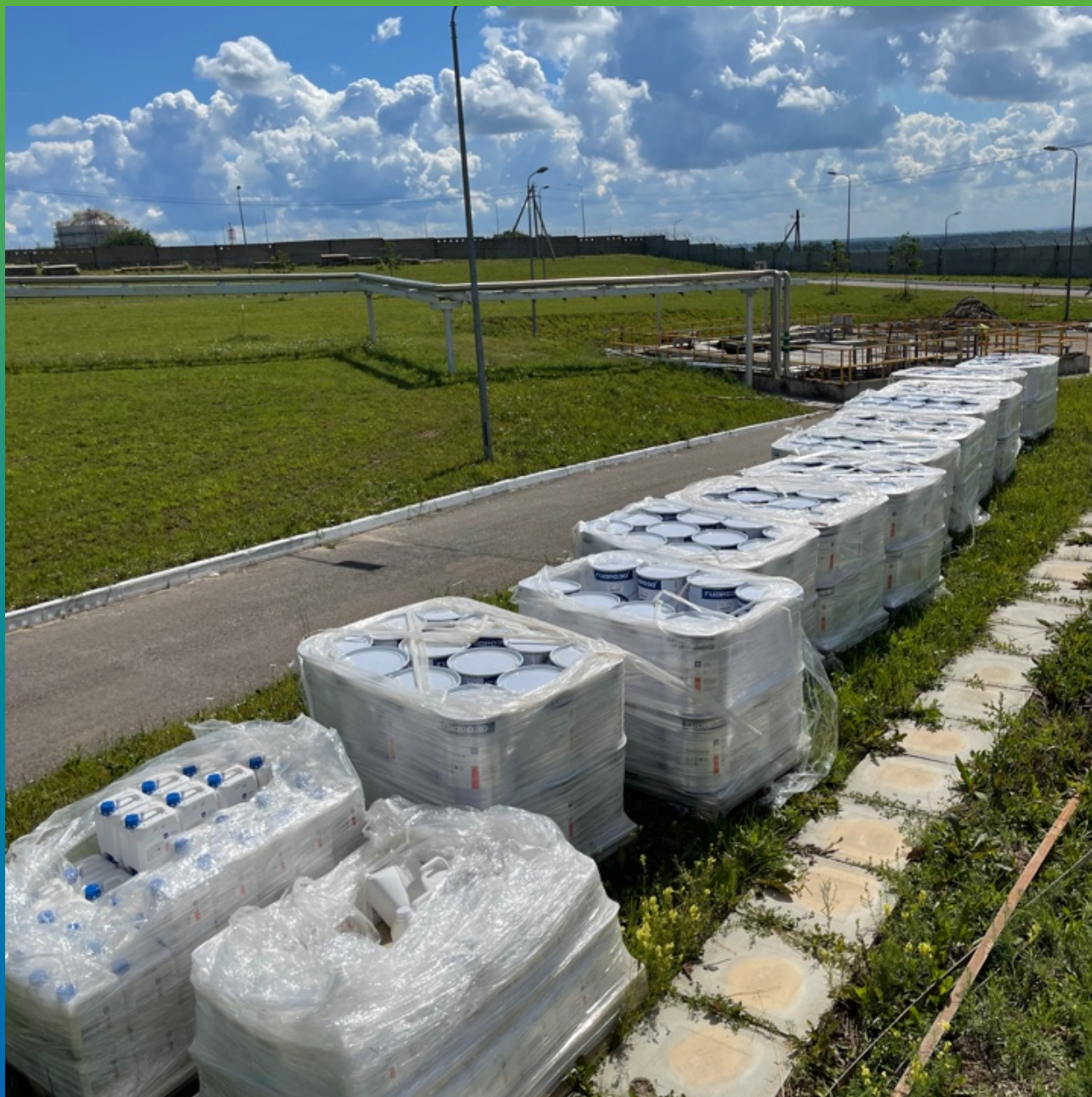
Материал на объекте