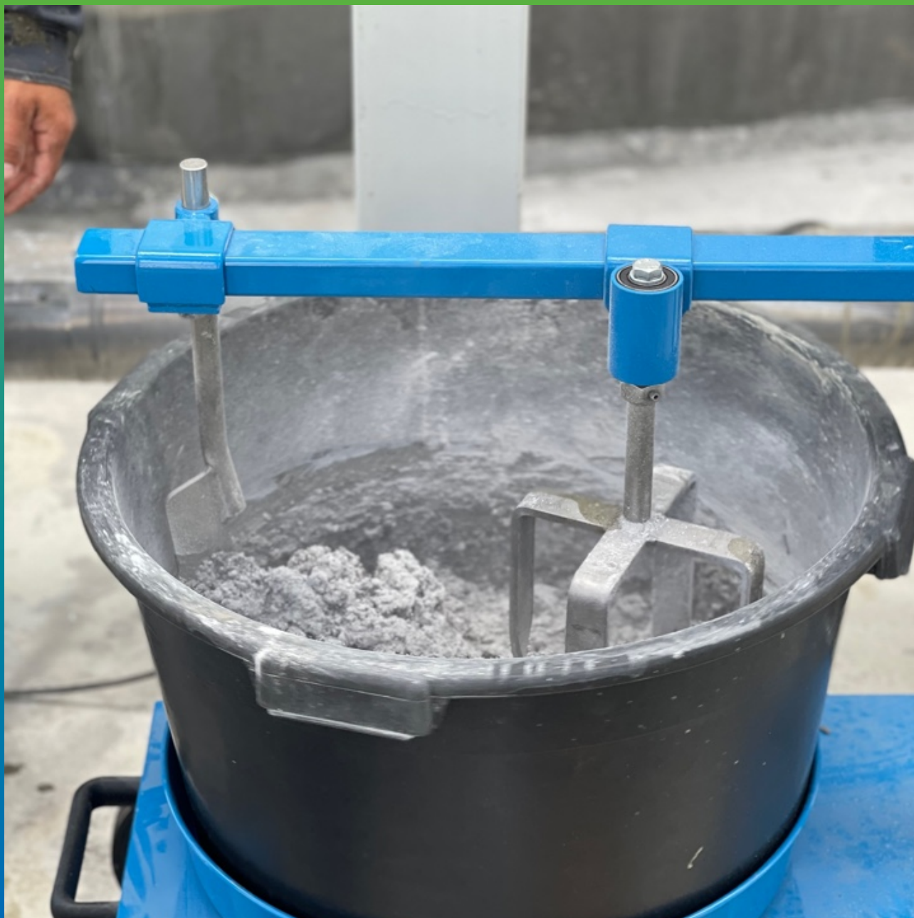
Смешивание компонентов ДенТоп ПМ 605 ФК