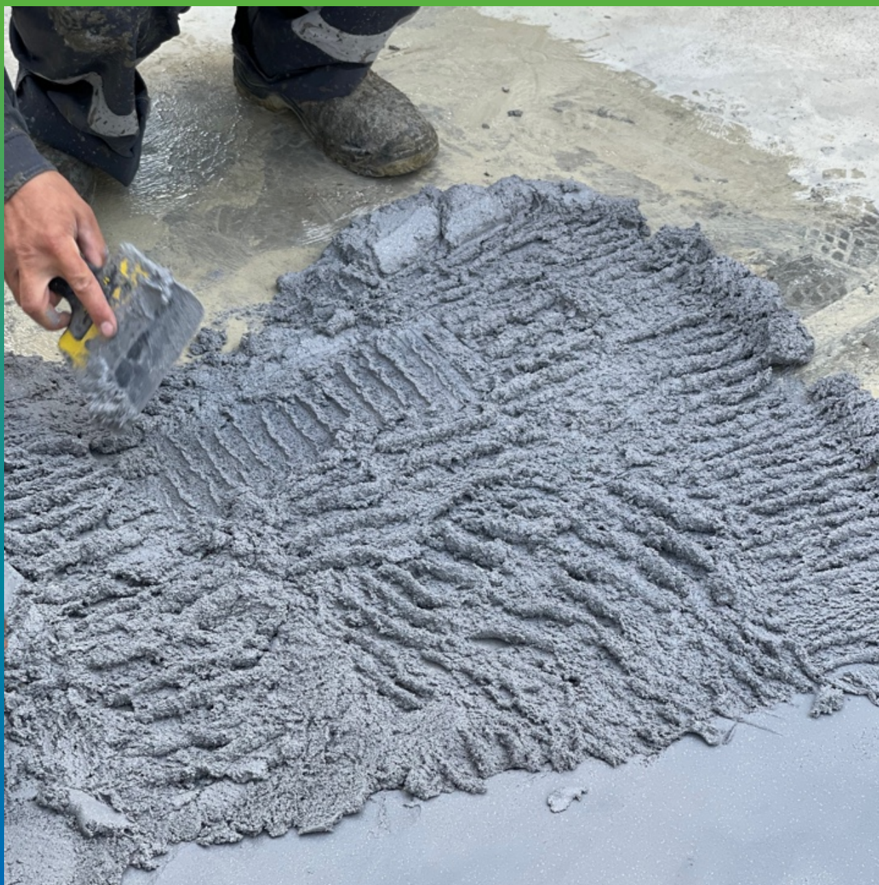
Нанесение ДенсТоп ПМ 605 ФК