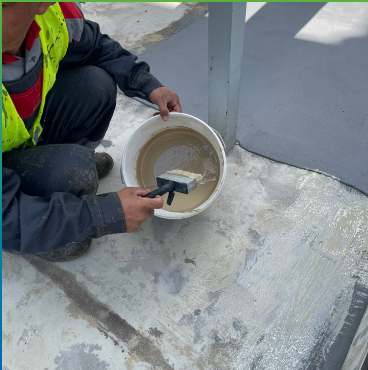
Нанесение грунтовочного состава ДенсТоп ПМ 600