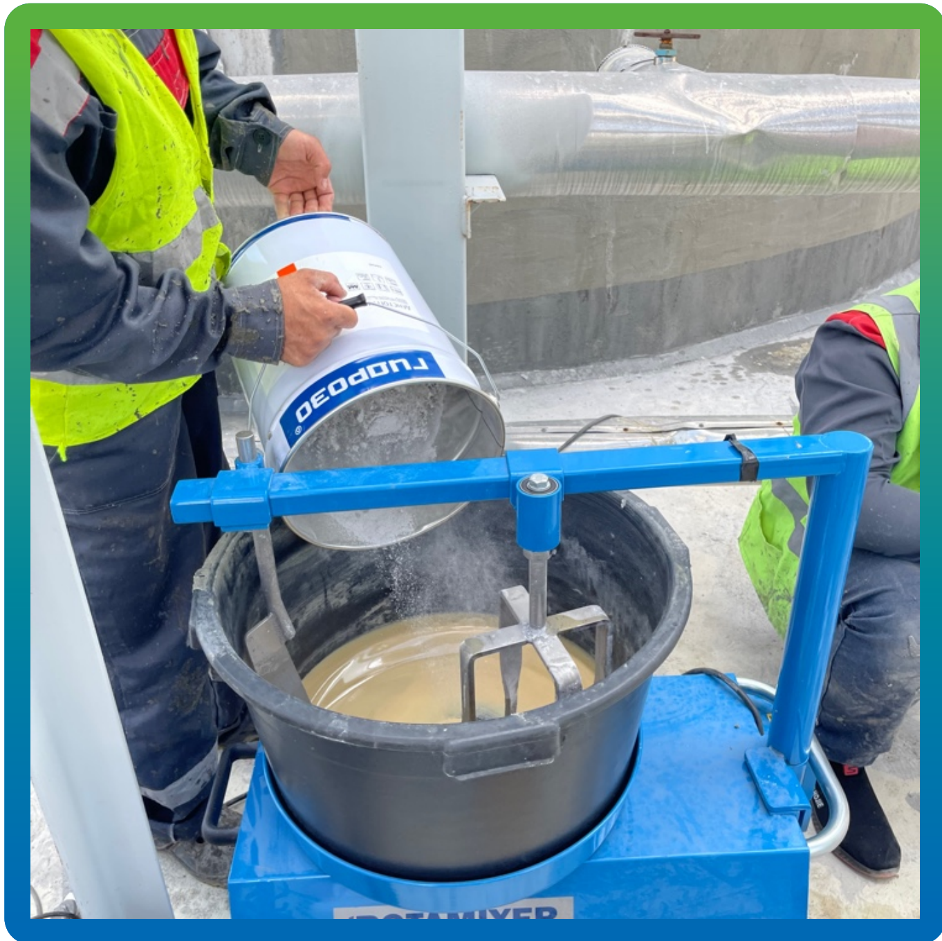
Смешивание компонентов ДенТоп ПМ 605 ФК