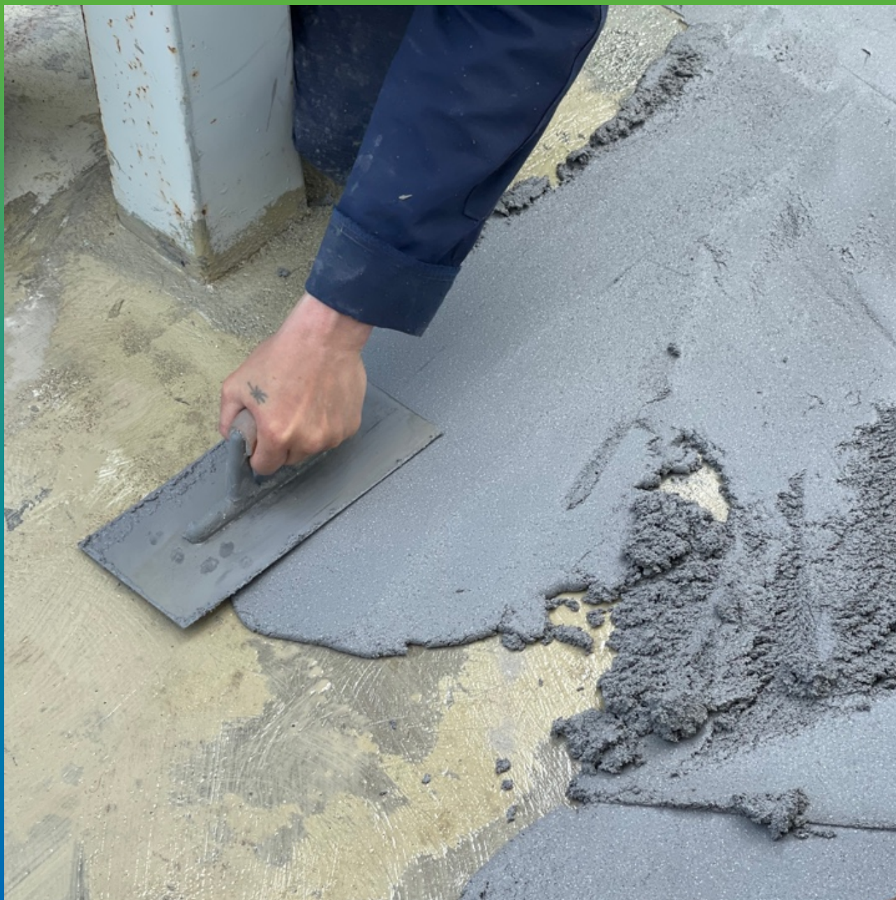
Нанесение ДенсТоп ПМ 605 ФК