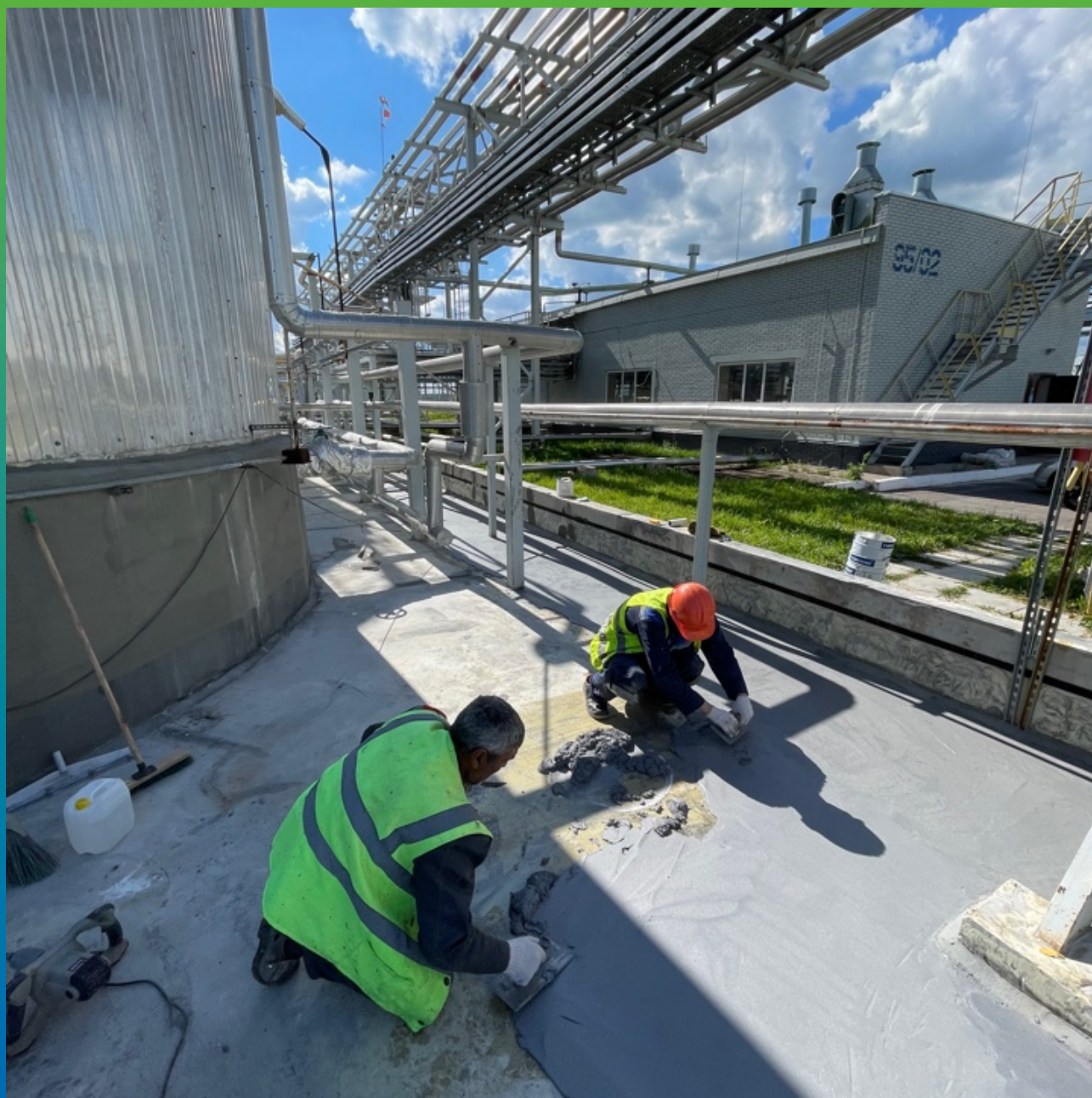
Нанесение ДенсТоп ПМ 605 ФК