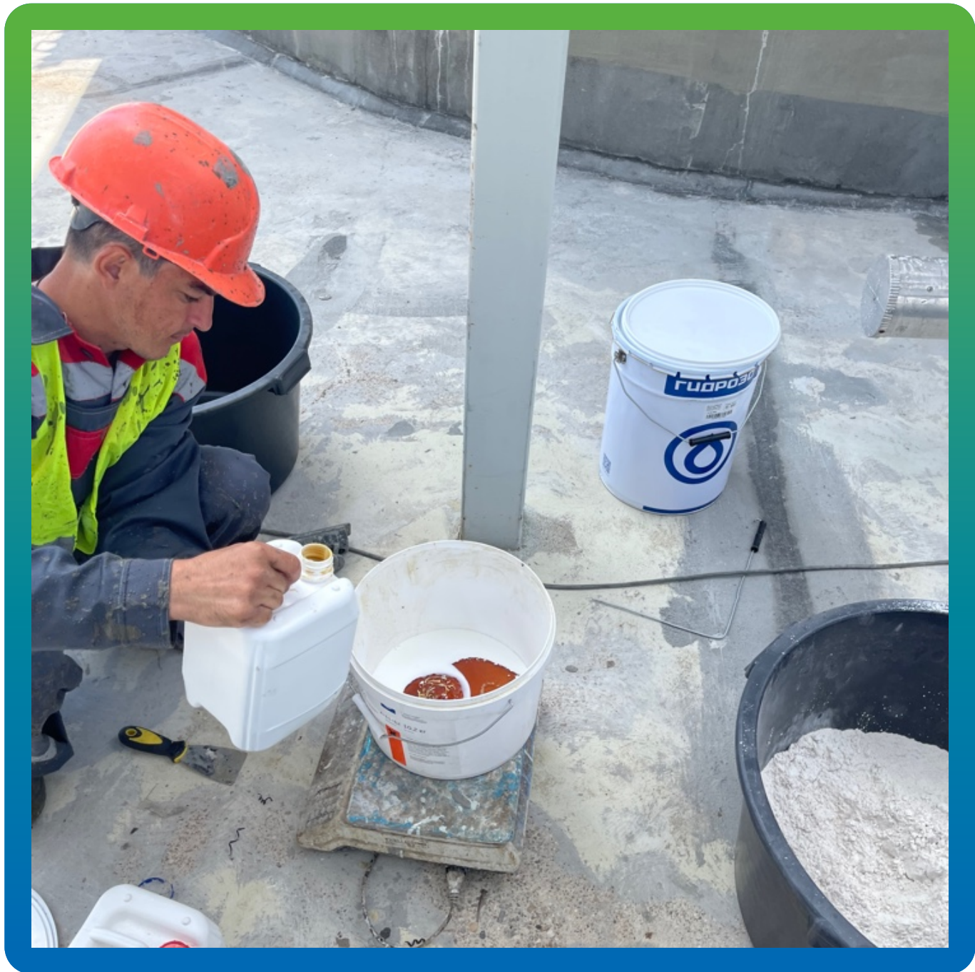
Смешивание компонентов грунтовочного состава ДенТоп ПМ 600