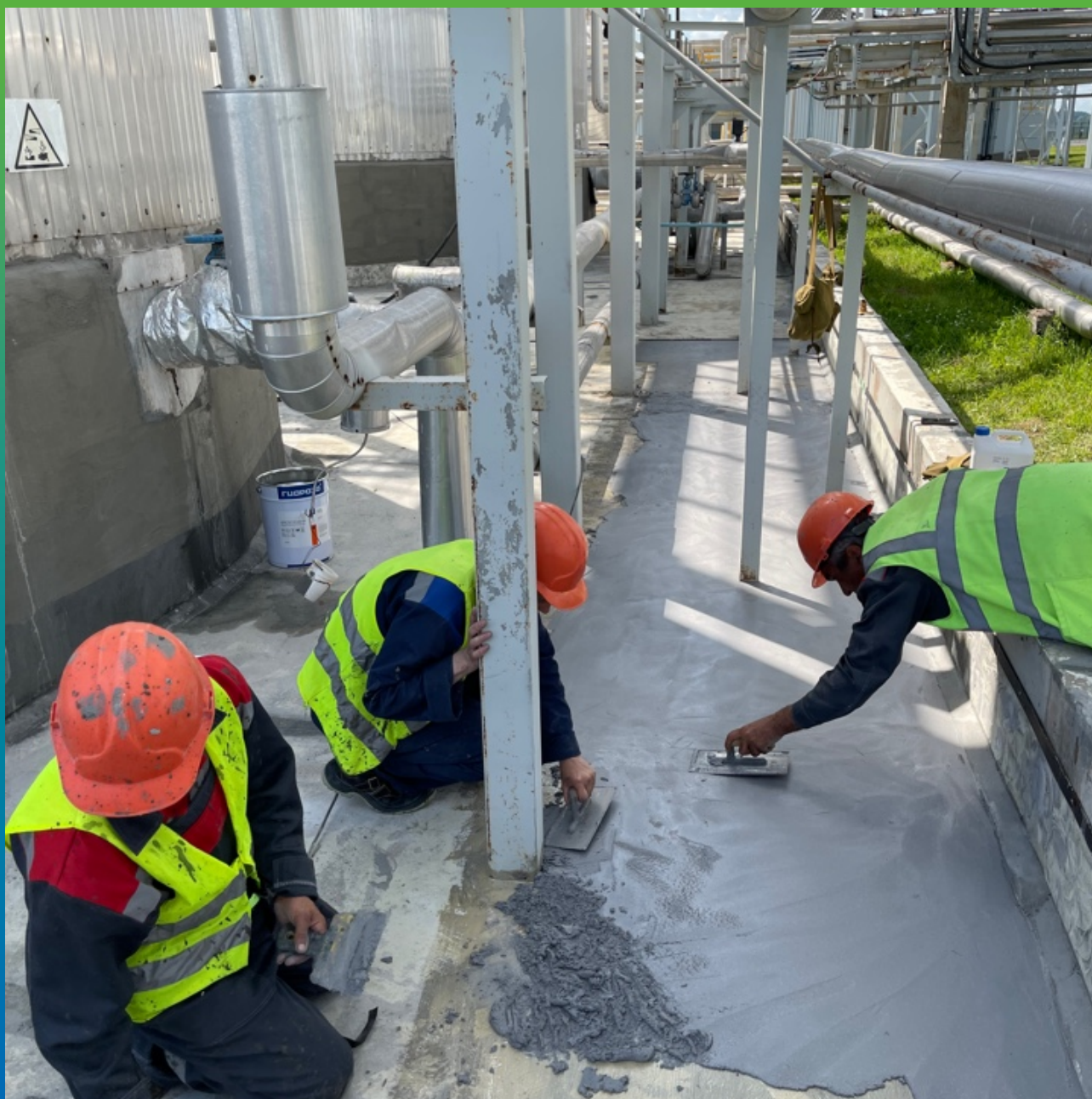
Нанесение ДенсТоп ПМ 605 ФК