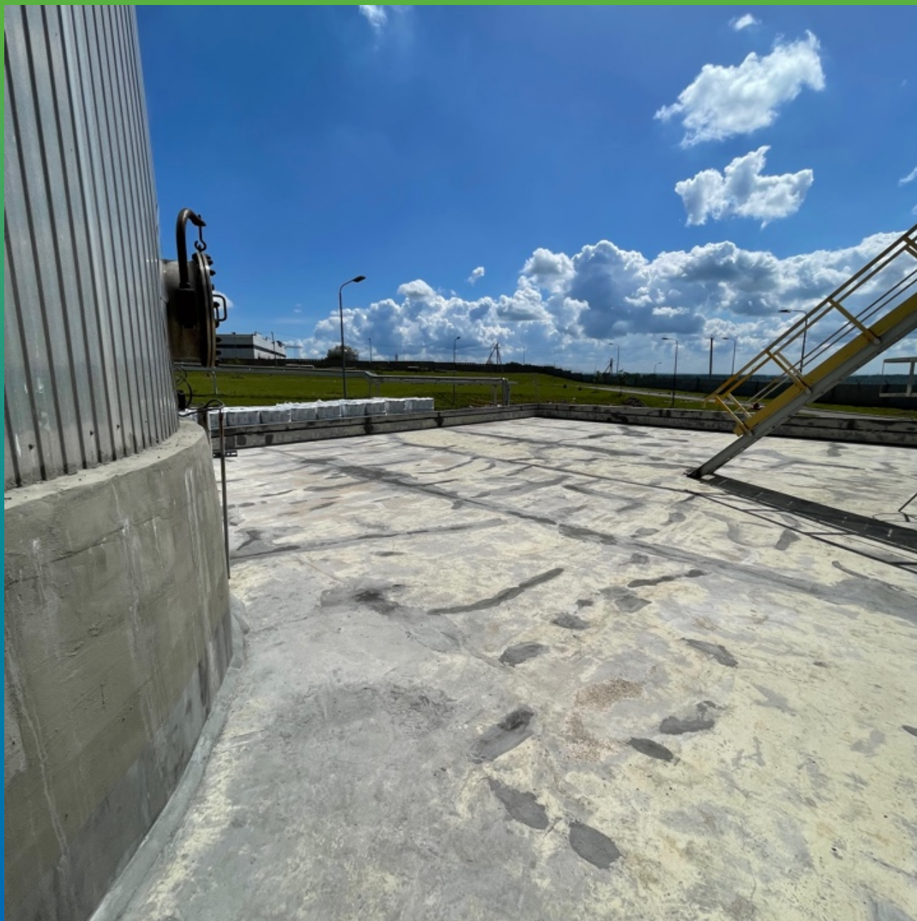
Поверхность, подготовленная к нанесению ДенсТоп ПМ 605 ФК