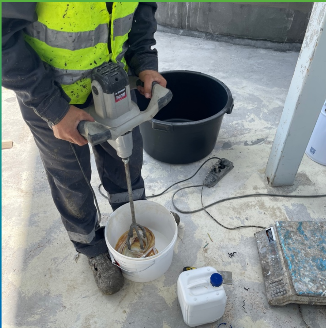
Смешивание компонентов грунтовочного состава ДенТоп ПМ 600