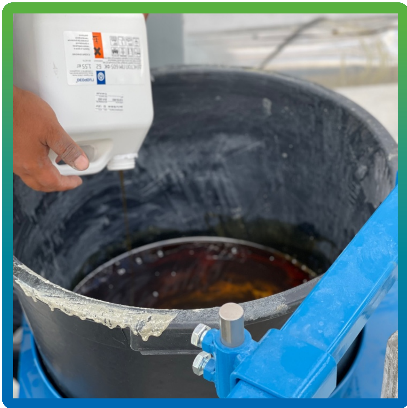
Смешивание компонентов ДенТоп ПМ 605 ФК