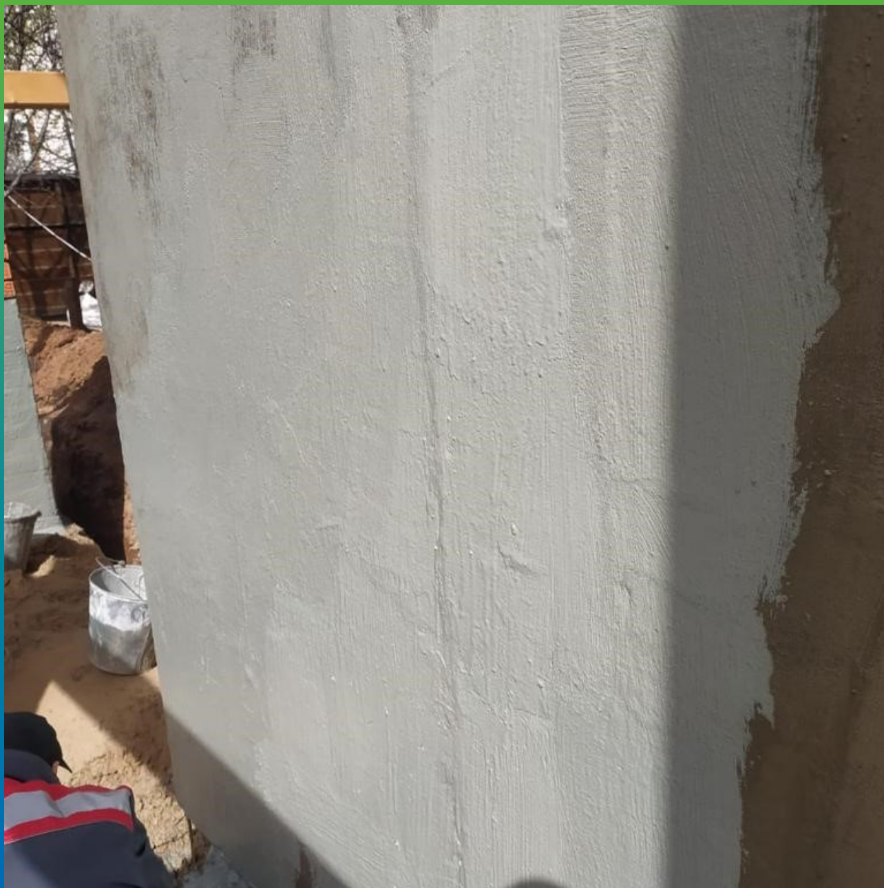
Нанесение эластичной гидроизоляции Стармекс Эласт