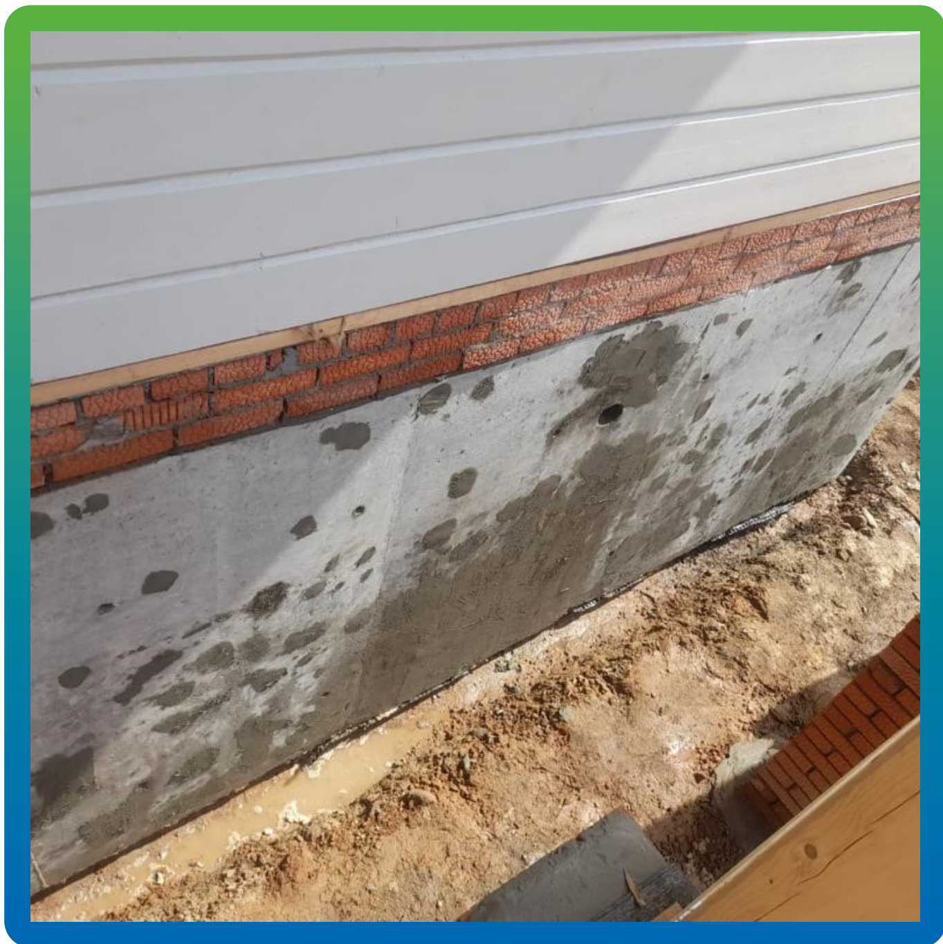
Ремонт дефектов перед нанесением гидроизоляции