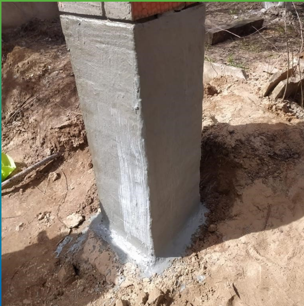
Оштукатуривание кирпичных колонн