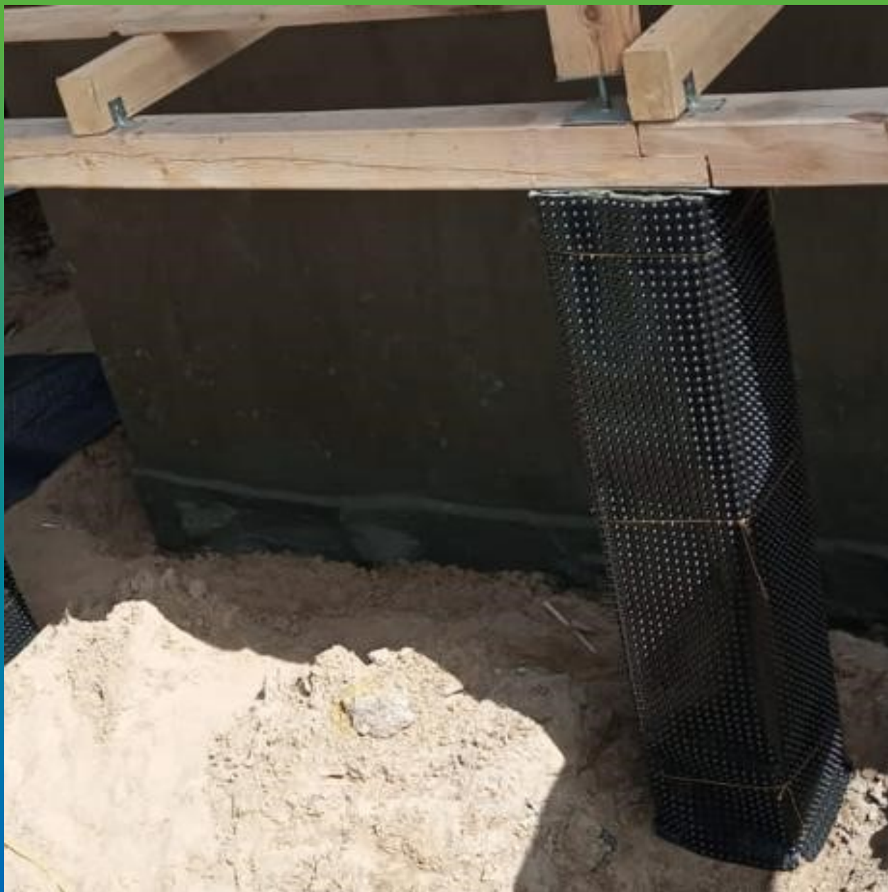
Защита изоляции перед засыпкой