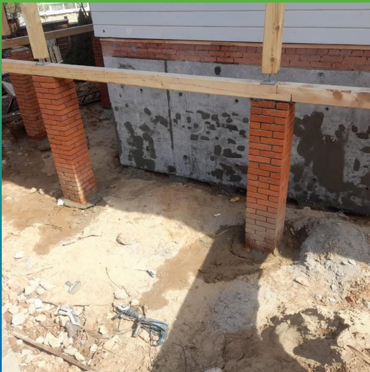
Ремонт дефектов перед нанесением гидроизоляции