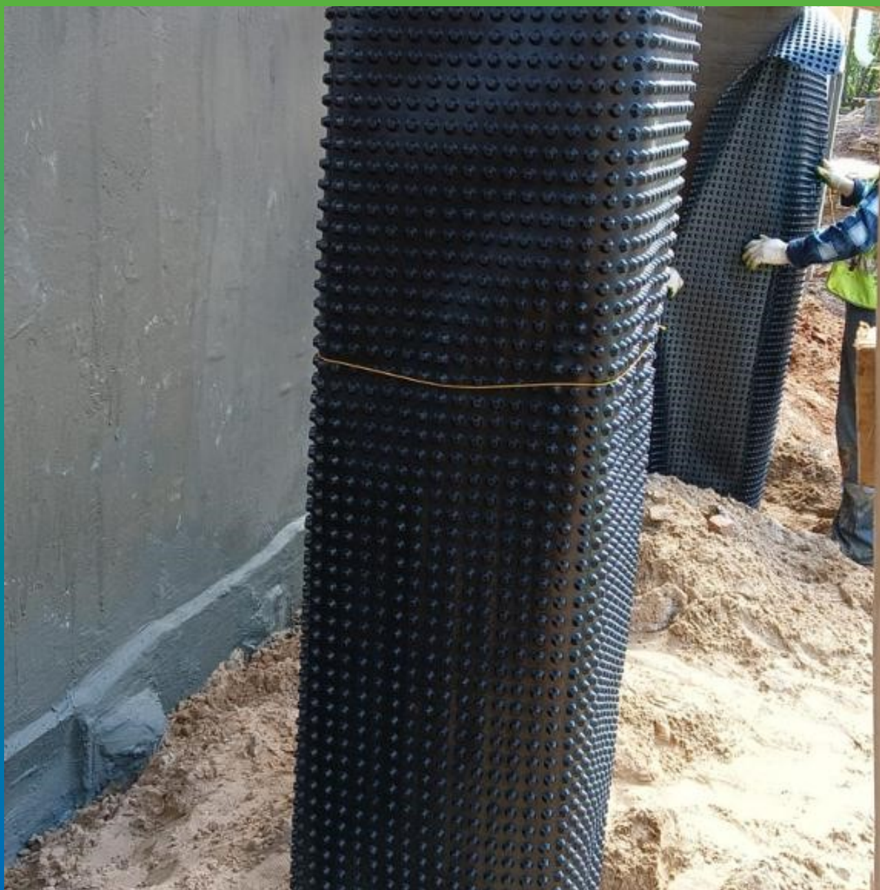
Защита изоляции перед засыпкой