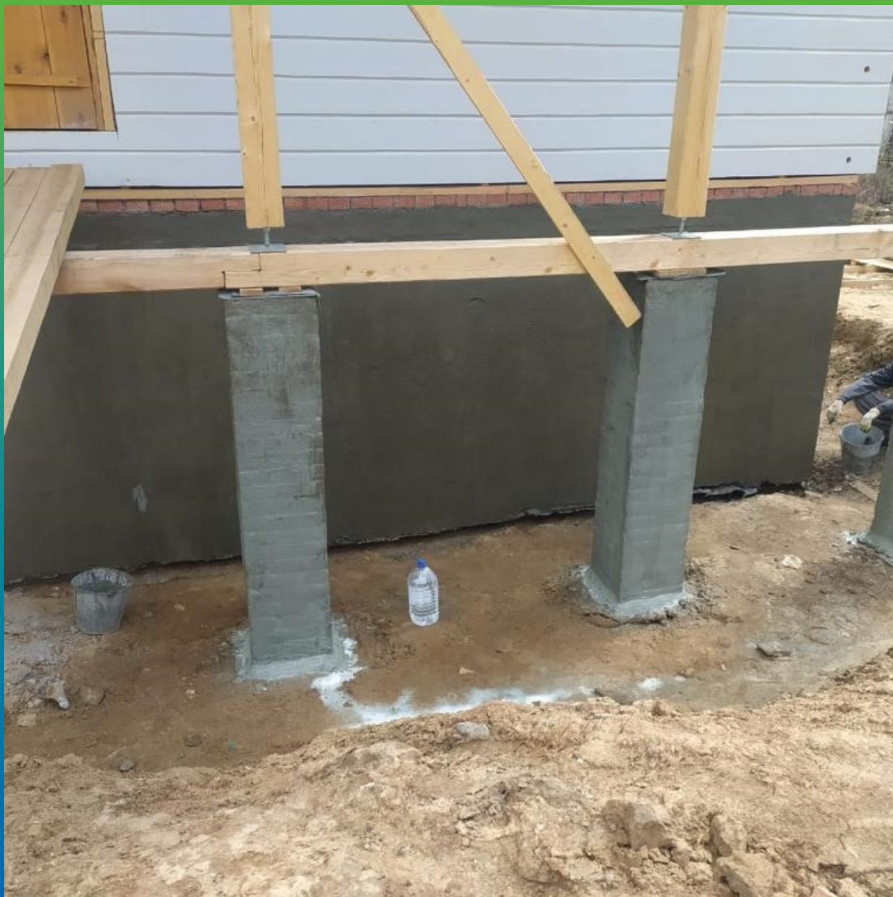
Нанесение эластичной гидроизоляции Стармекс Эласт