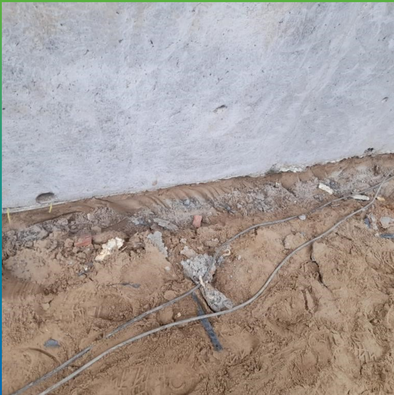
Подготовленное основание с дефектами