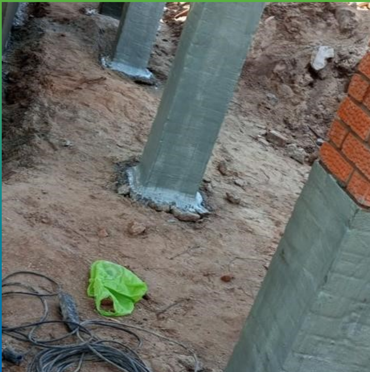
Нанесение эластичной гидроизоляции Стармекс Эласт