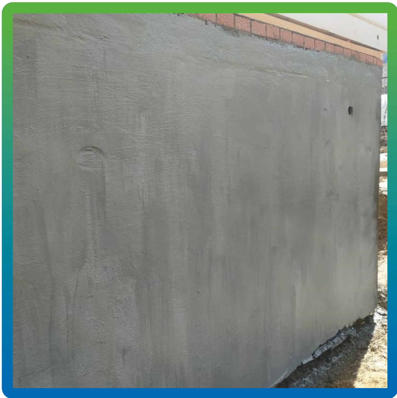
Нанесение эластичной гидроизоляции Стармекс Эласт