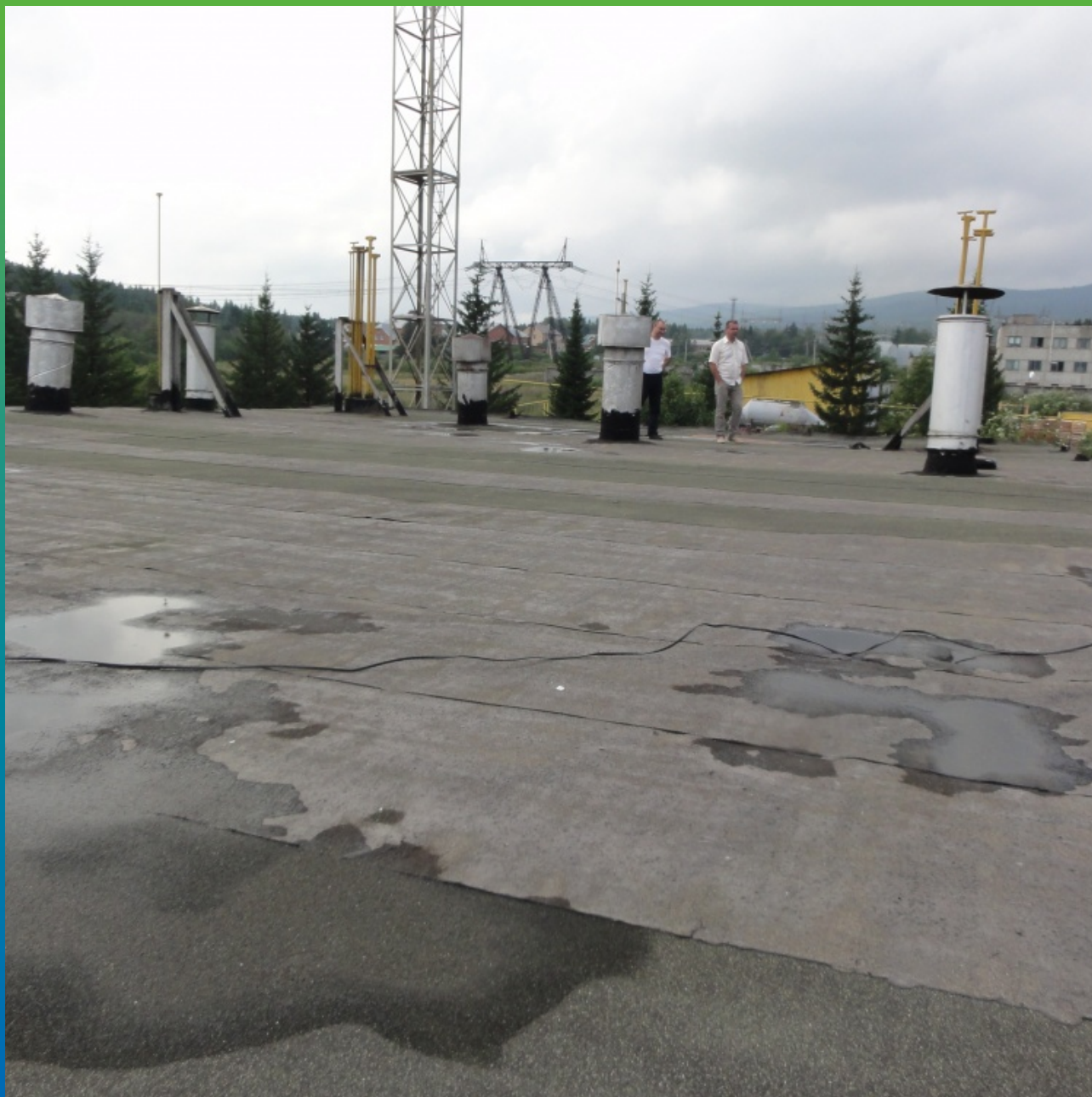
Общий вид кровли 2