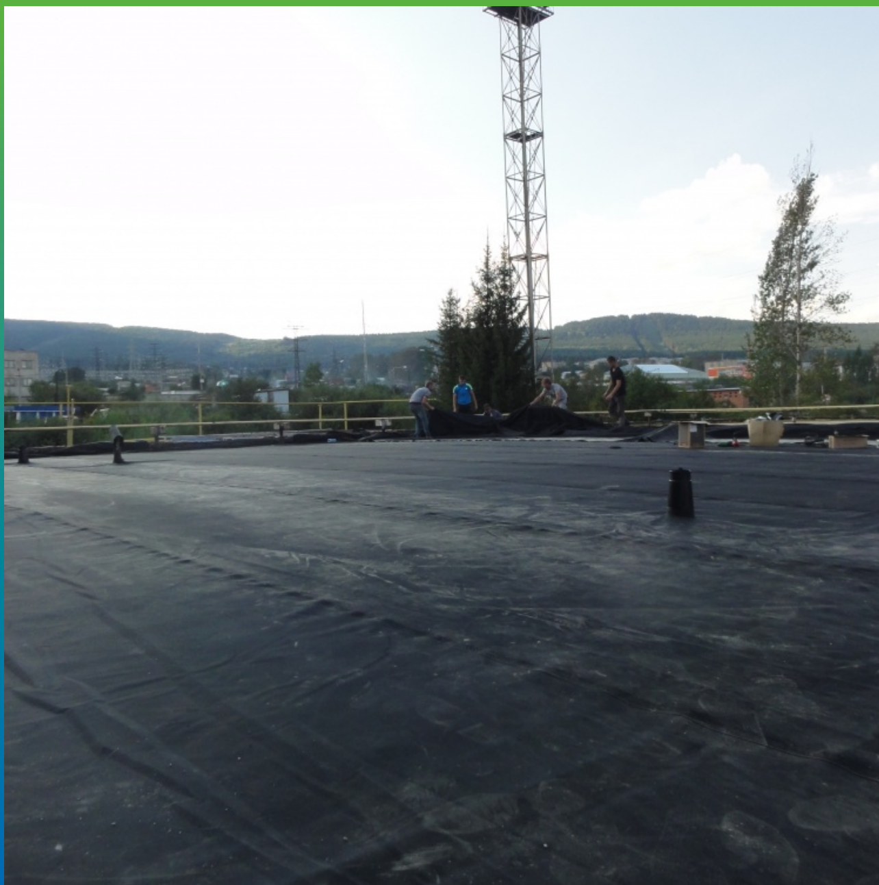
Укладка ЭПДМ мембраны Прелести 1.2 мм