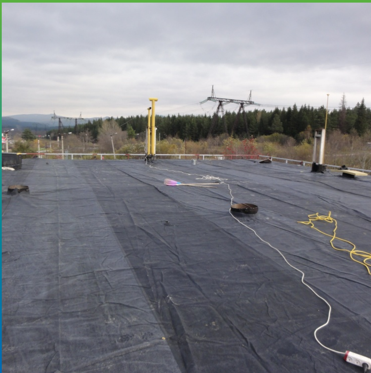
Вид разложенного полотна, кровля 2