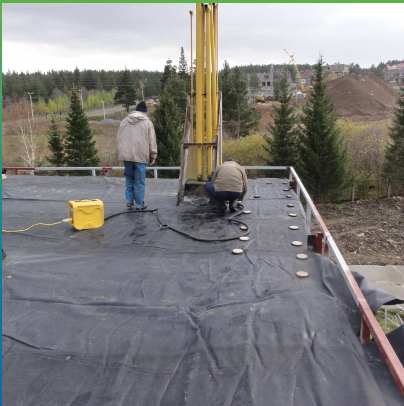
Крепление ЭПДМ мембраны по системе Центрикс кровля 2