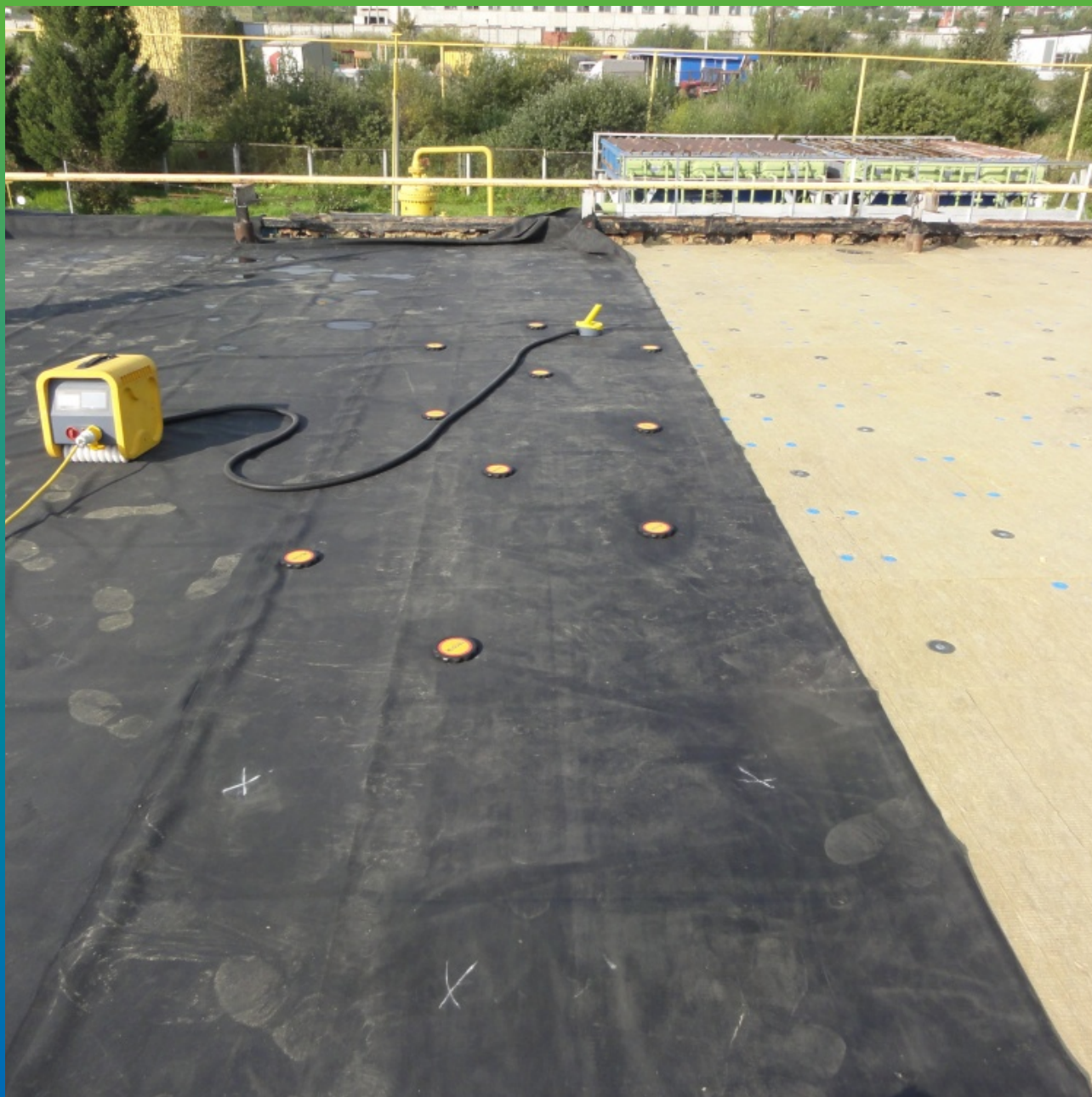
Крепление ЭПДМ мембраны по системе Центрикс кровля 1