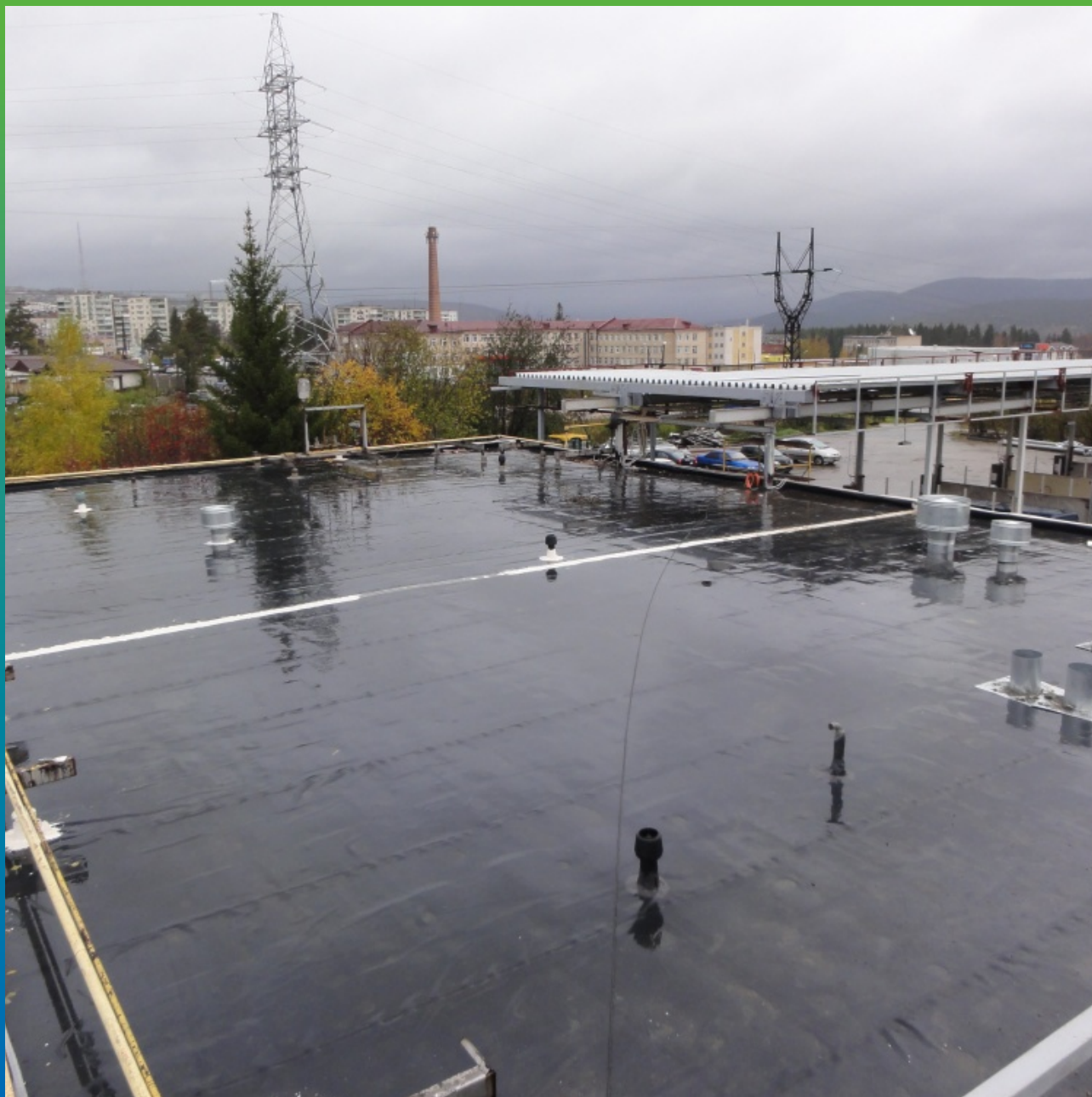
Кровля 1 – монтаж выполнен