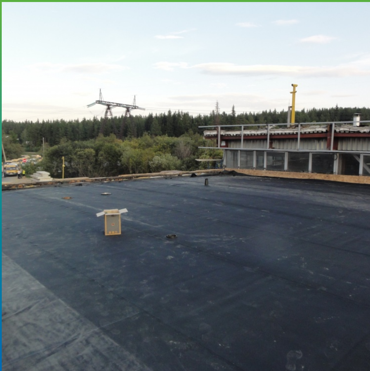
Вид разложенного полотна, кровля 1