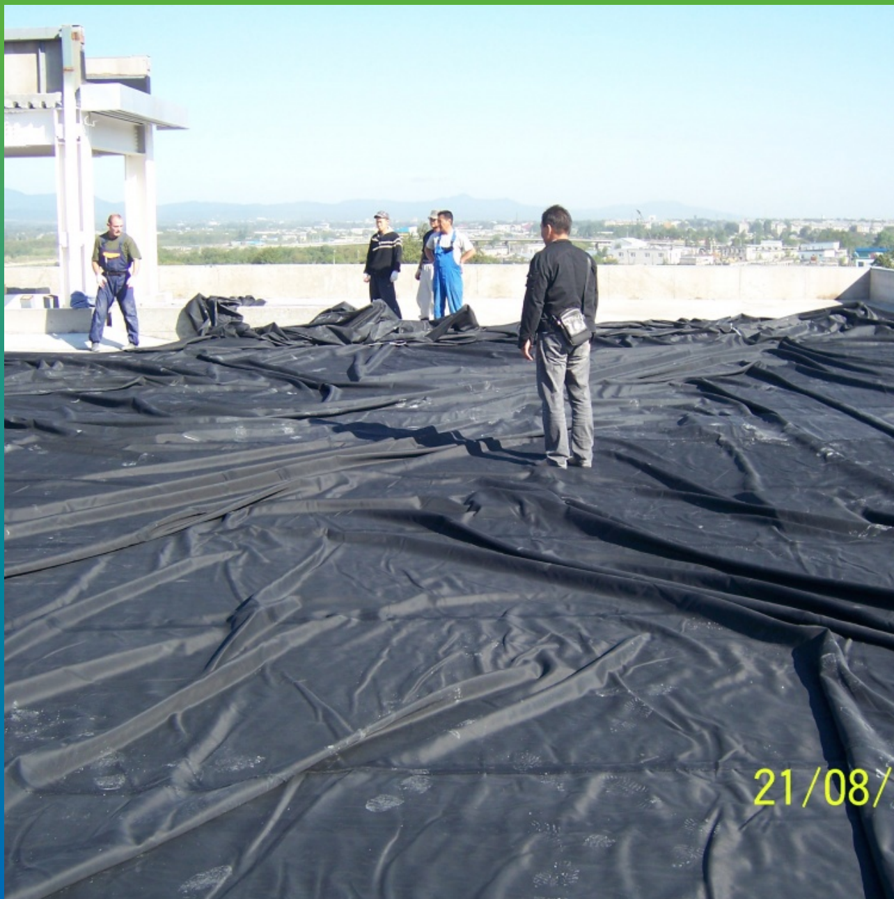
Раскладка вулканизированного полотна