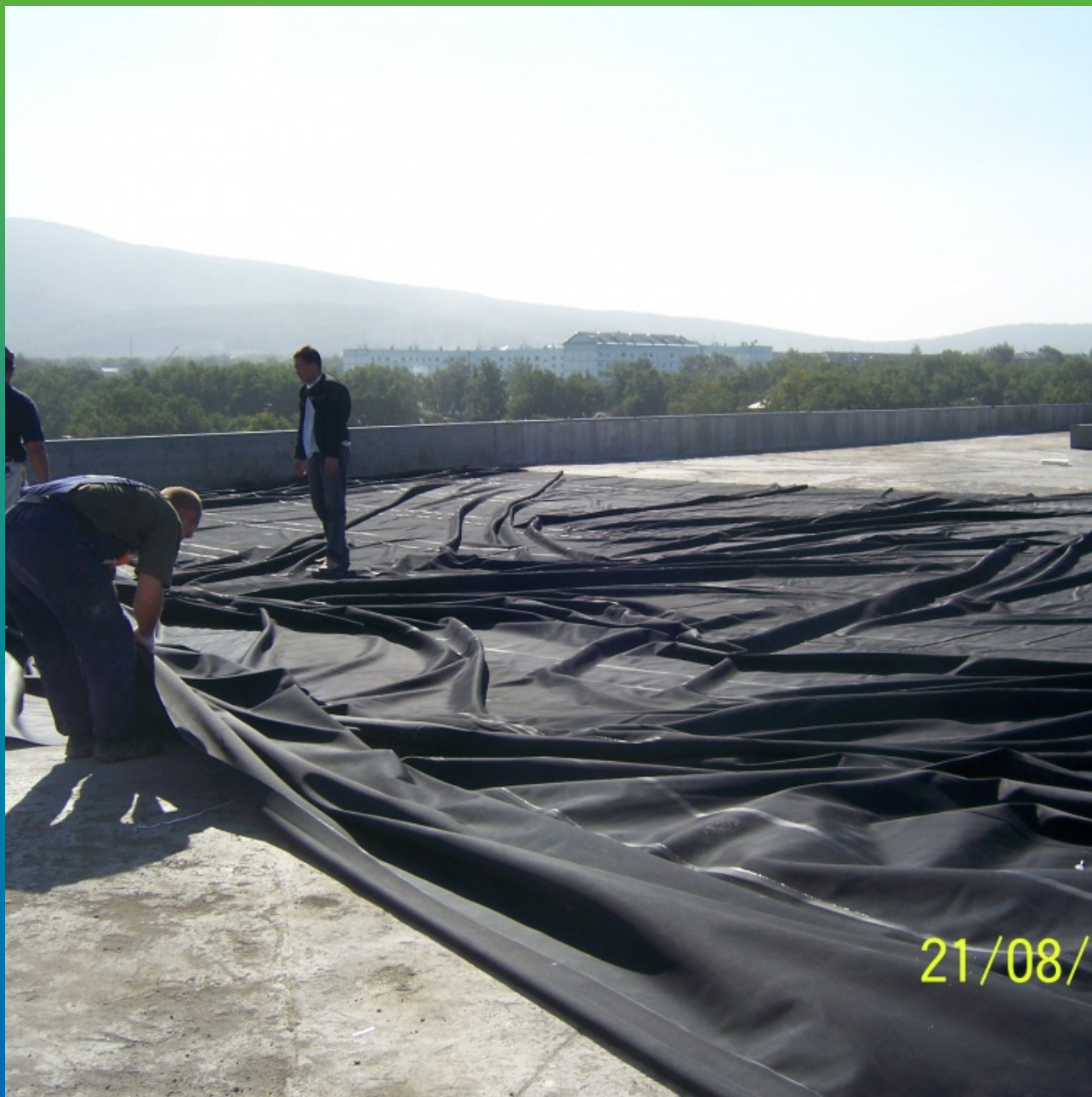
Раскладка вулканизированного полотна