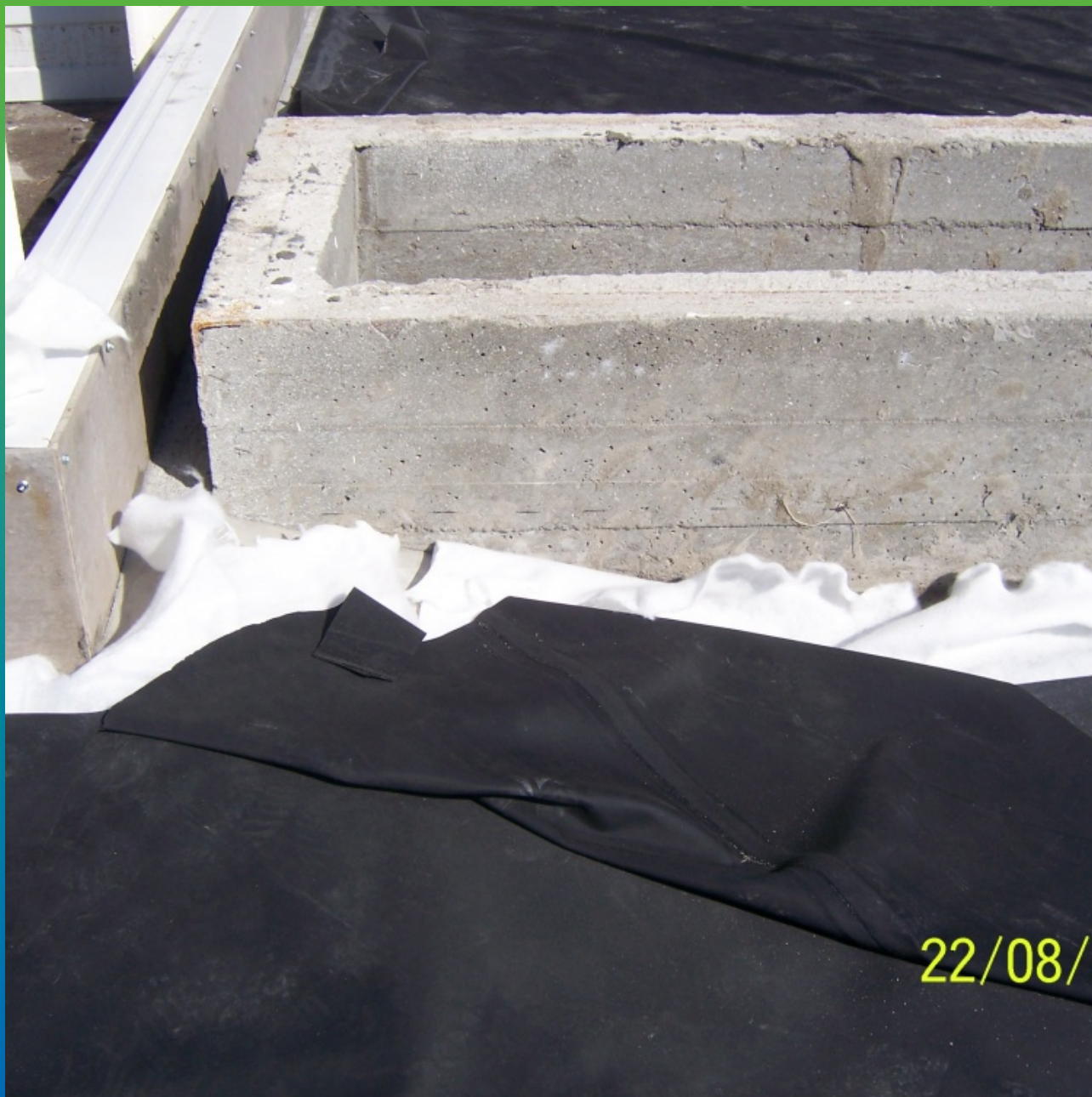
Участок кровли с геотекстильной подложкой