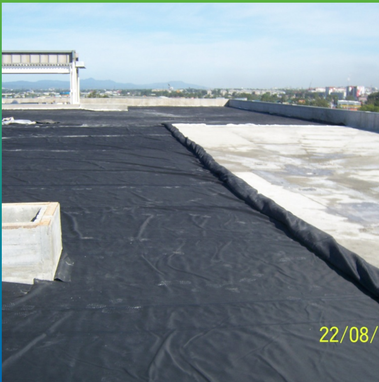
Раскладка вулканизированного полотна