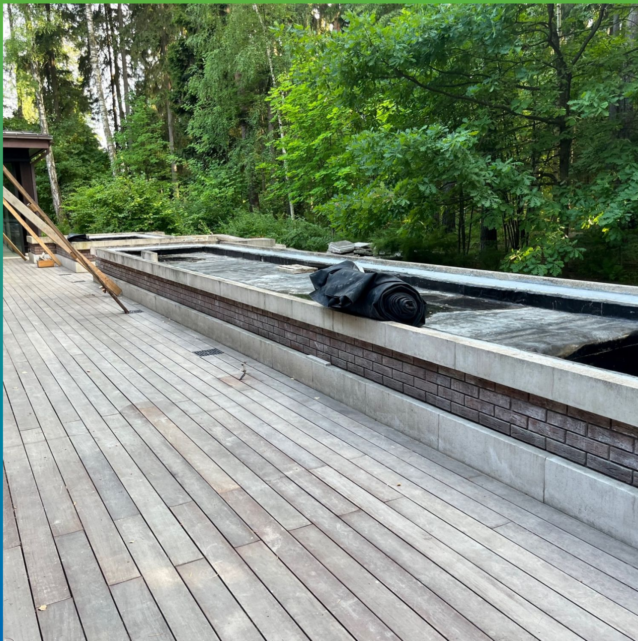
Готовое основание для последующего устройства ЭПДМ мембраны Преласты СТ 1,2