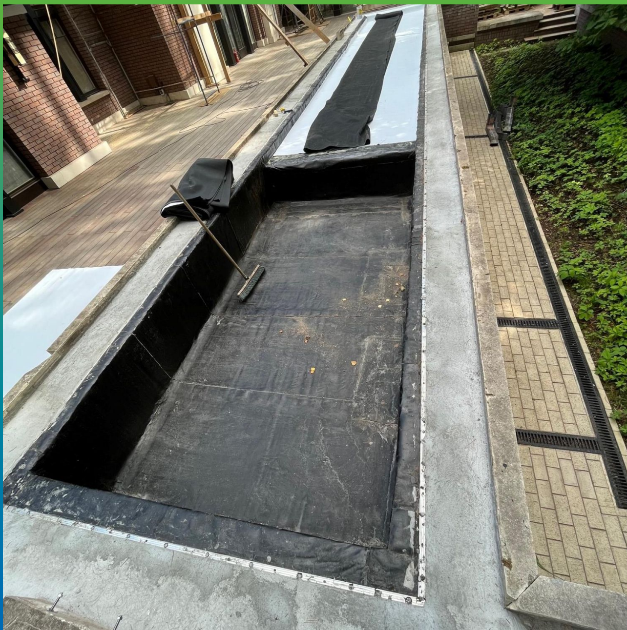
Укладка мембраны Прелести СТ 1,2