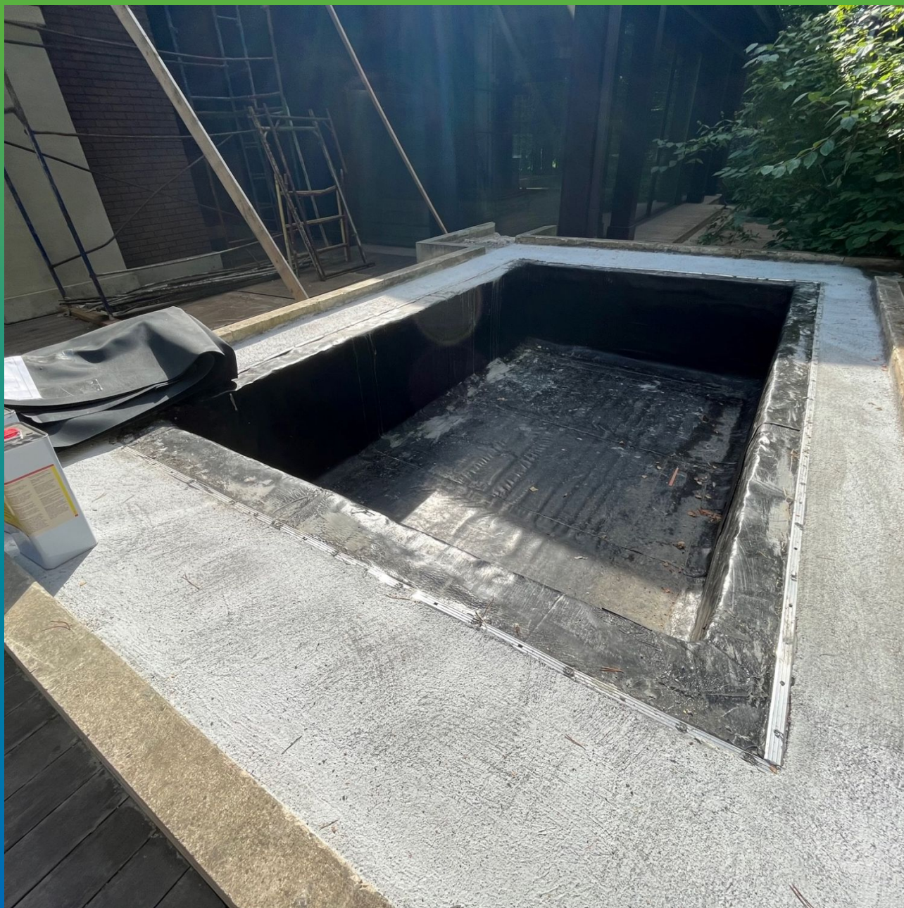
Готовое основание под устройство ЭПДМ Преласты СТ 1,2 на клумбы