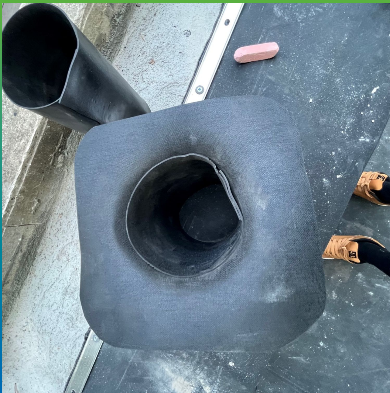
Устройство самодельных сапогов для гидроизоляции внутреннего диаметра сливных воронок