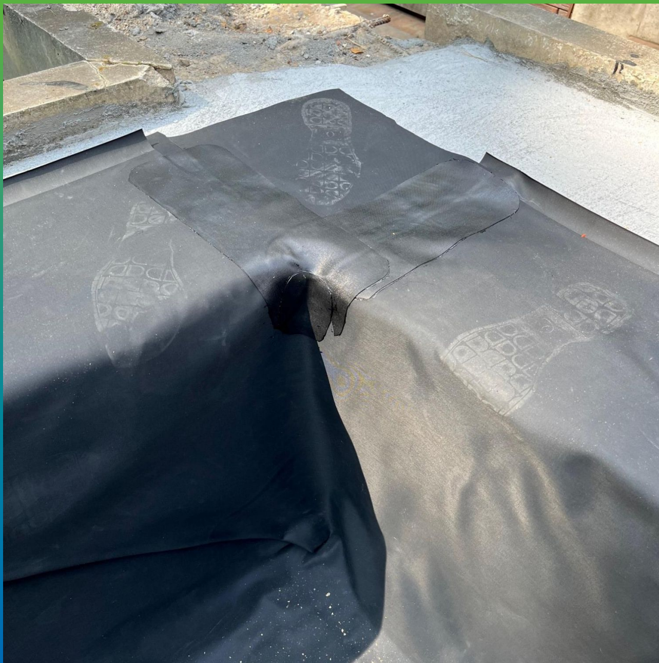
Обварка углов примыкания внутренних конвертов