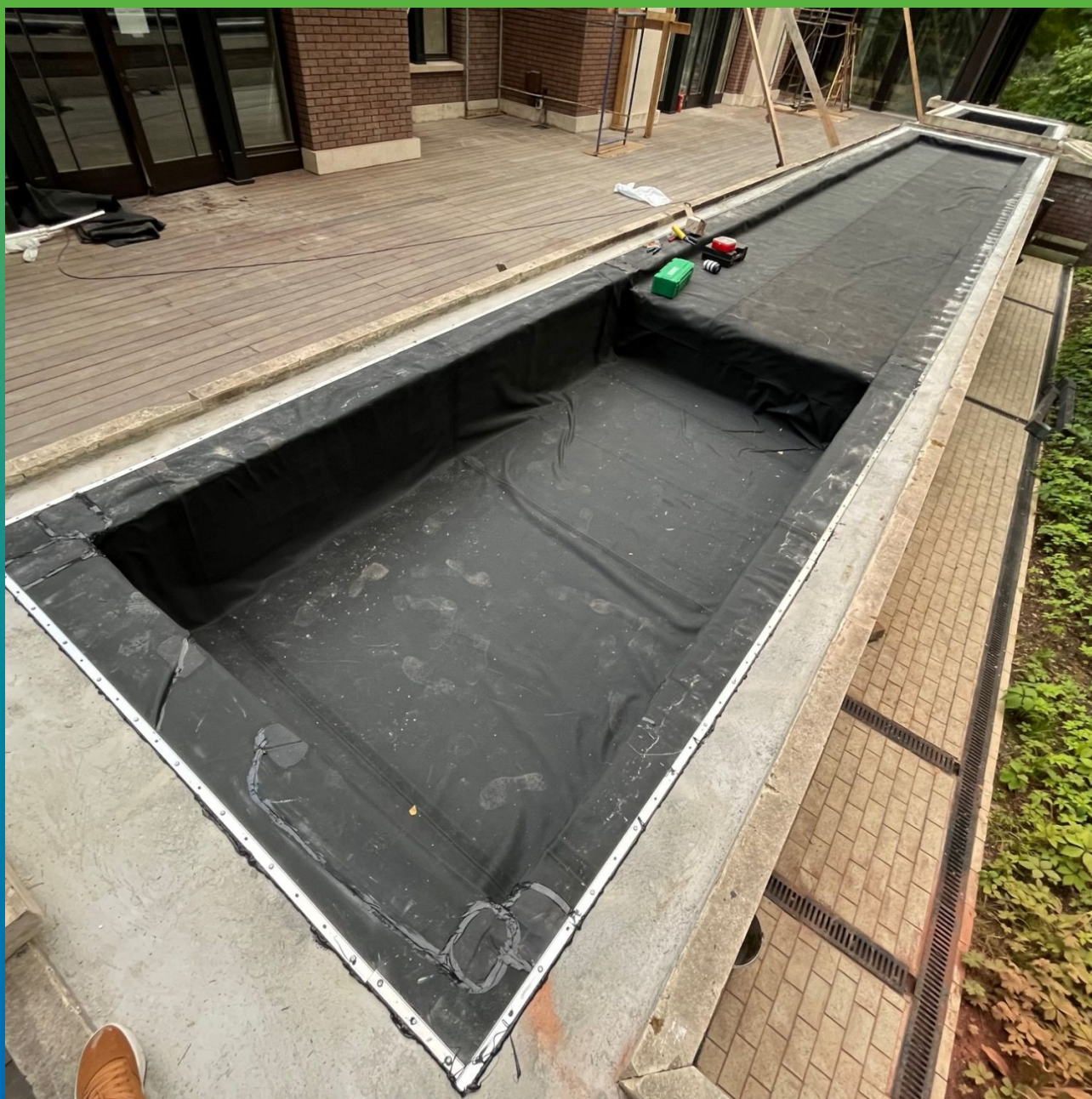
Финишный вид после устройства гидроизоляционного ковра Преласты СТ 1,2