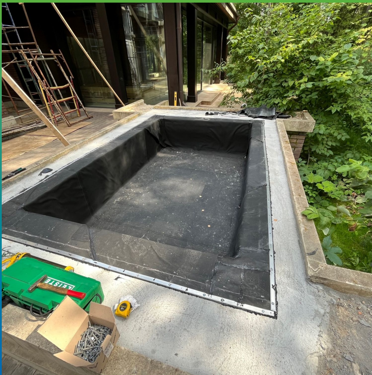
Финишный вид после устройства гидроизоляционного ковра Преласты СТ 1,2