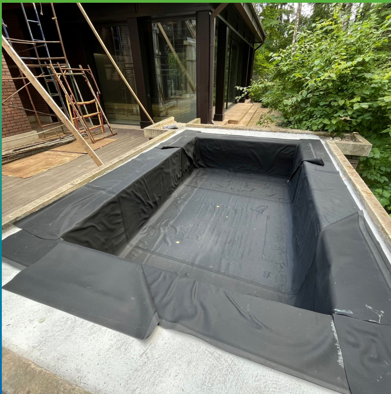
Укладка мембраны Преласты СТ 1,2