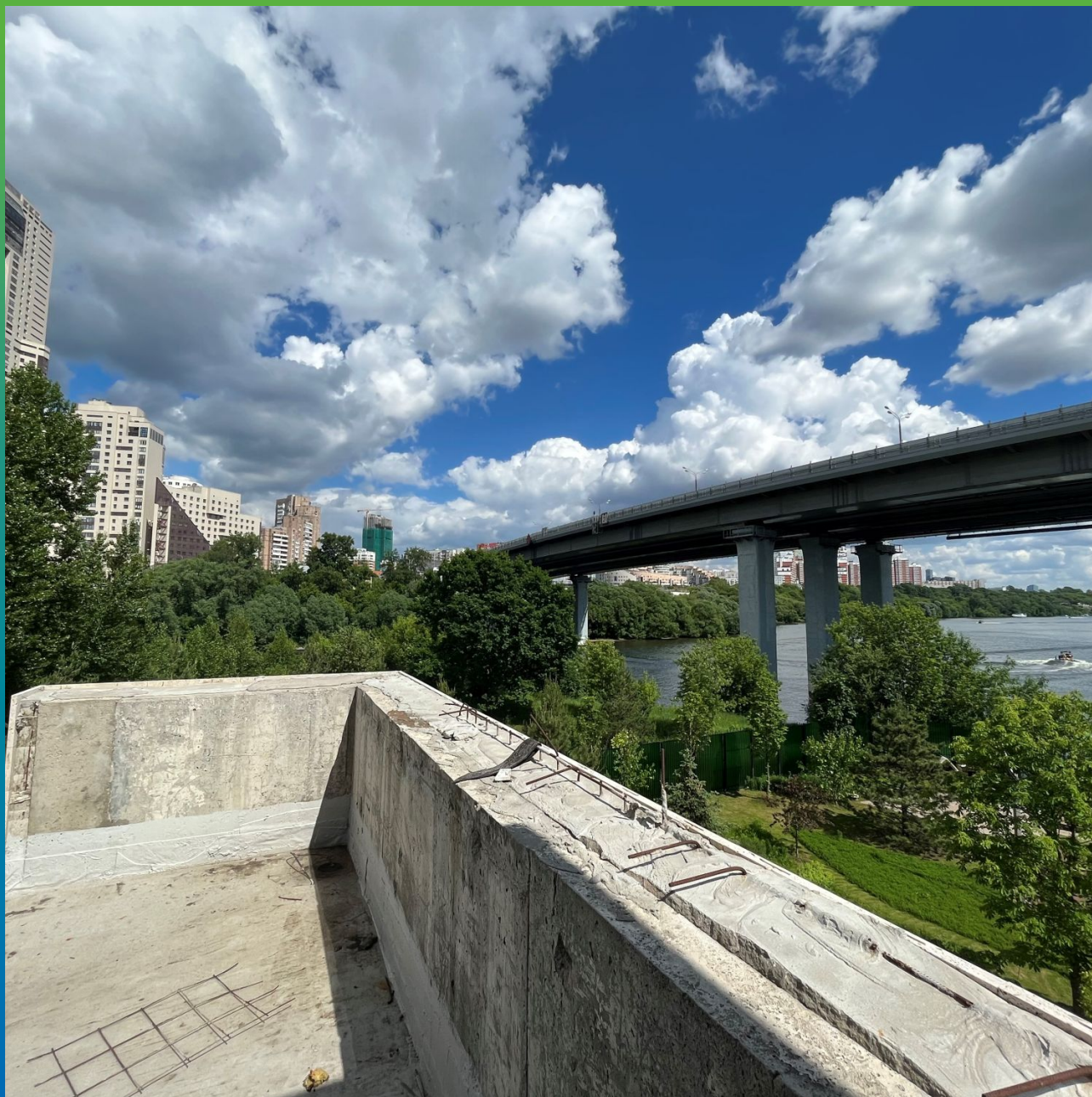
Вид подготовленного основания