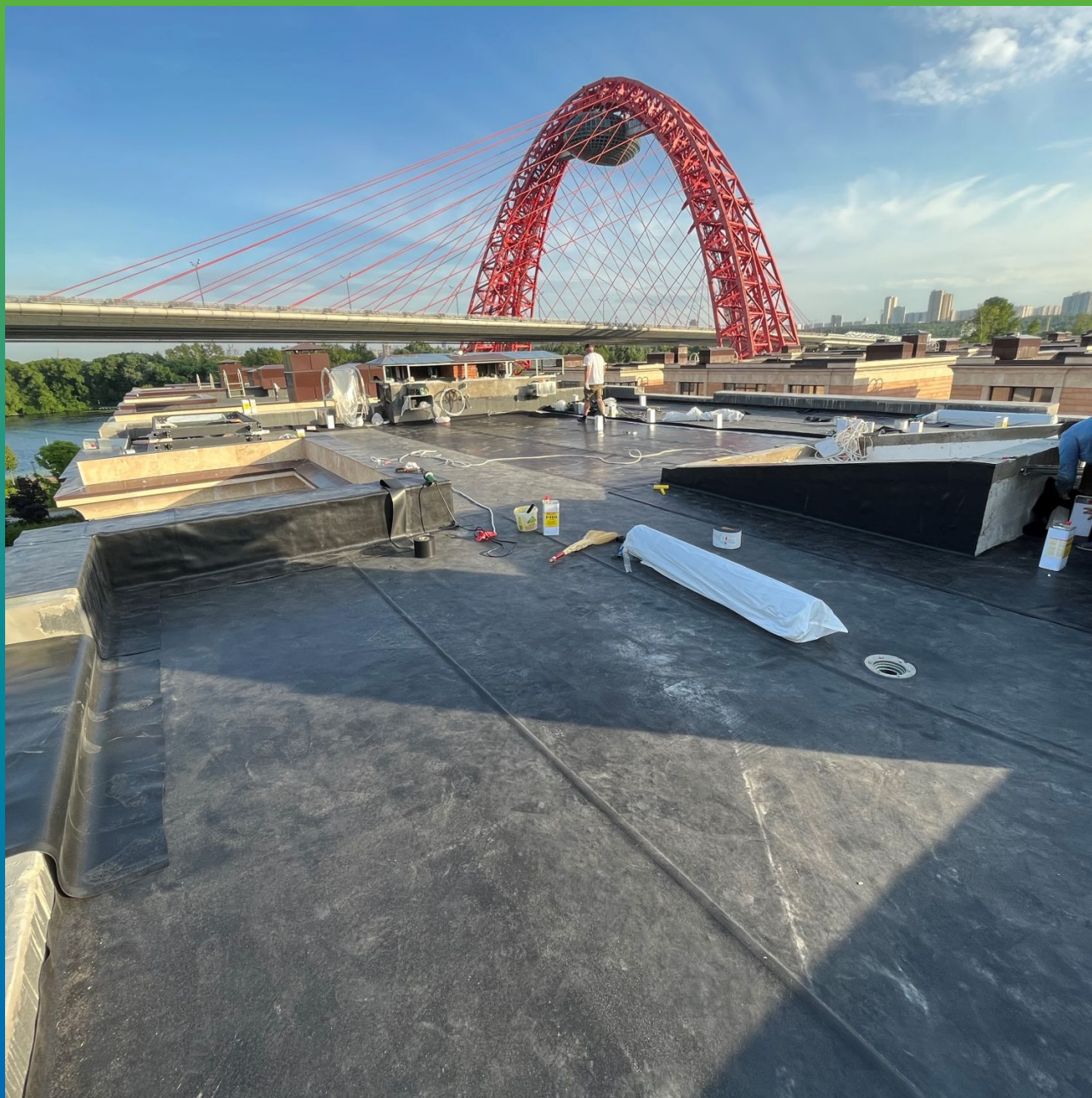
Общий вид объекта