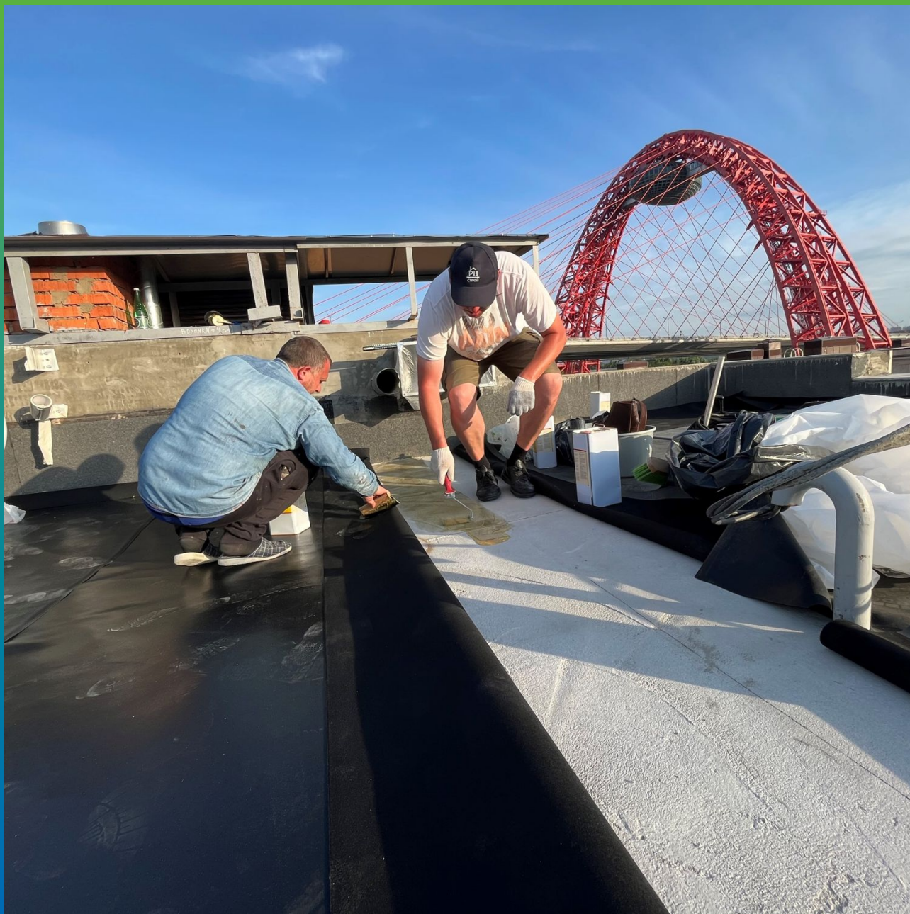
Укладка мембраны Преласты Флис СТ 2,3 клеевым методом на П400