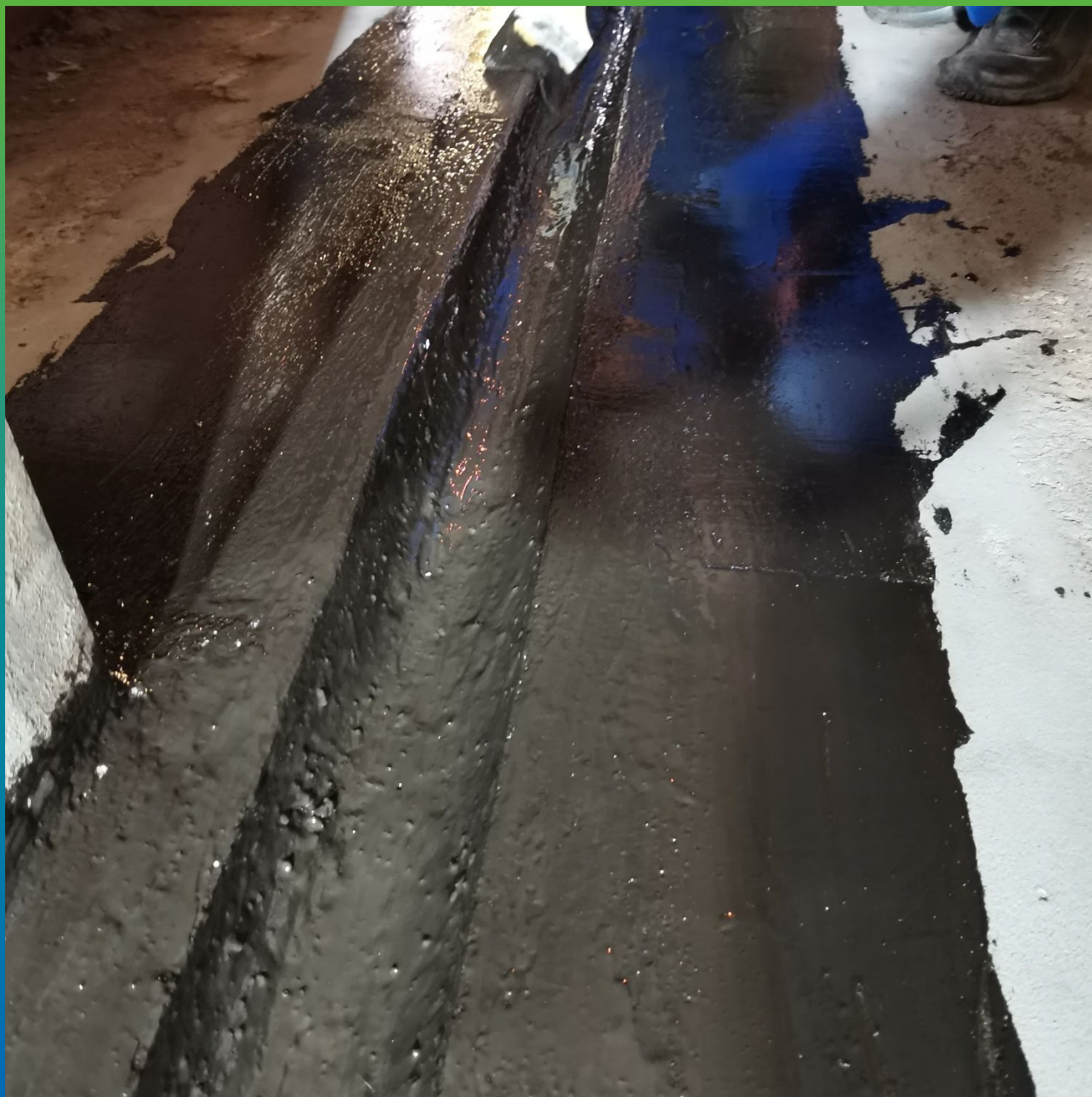
Нанесение второго слоя ДенсТоп ПС 391