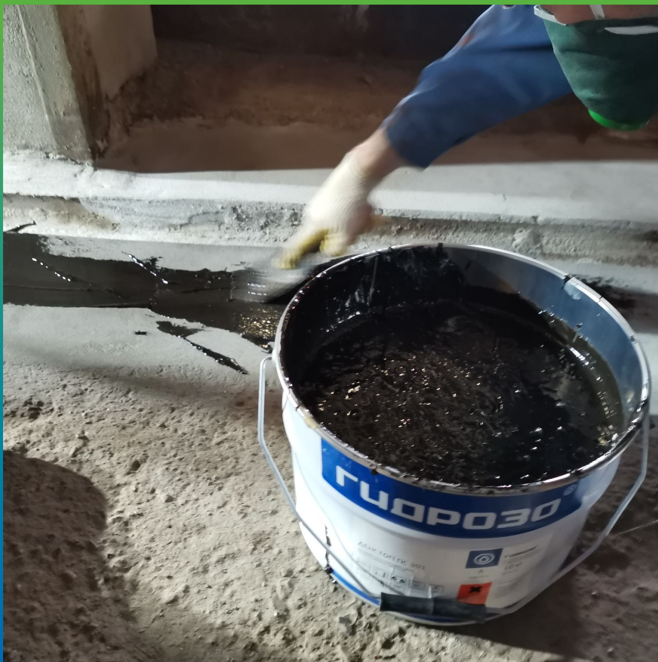
Нанесение первого слоя ДенТоп ПС 391