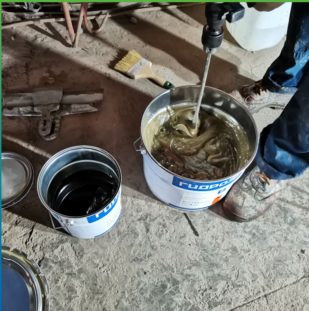
Получение готовой к нанесению массы, путем перемешивания компонентов А+Б