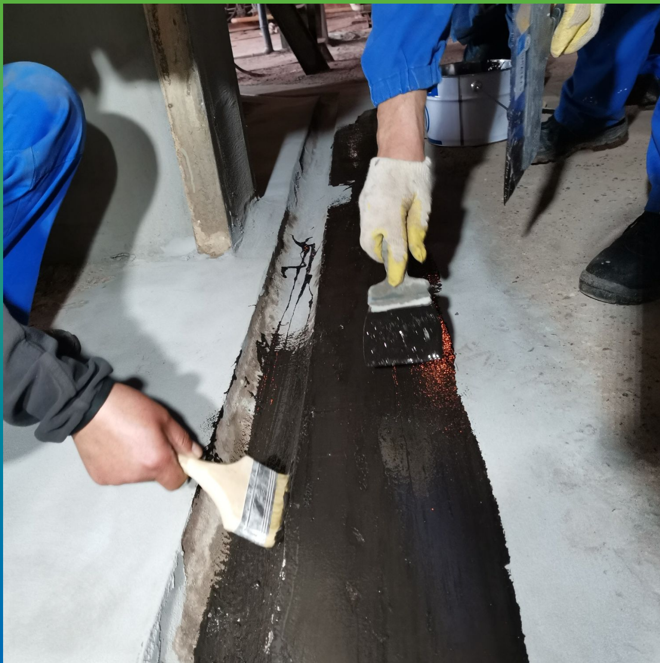
Нанесение первого слоя в сливной лоток