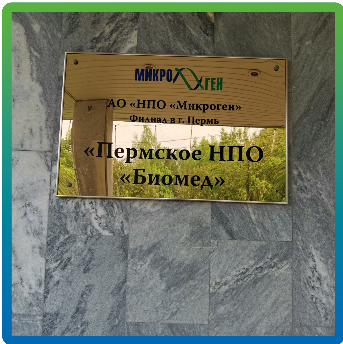
Проходная зона к объекту