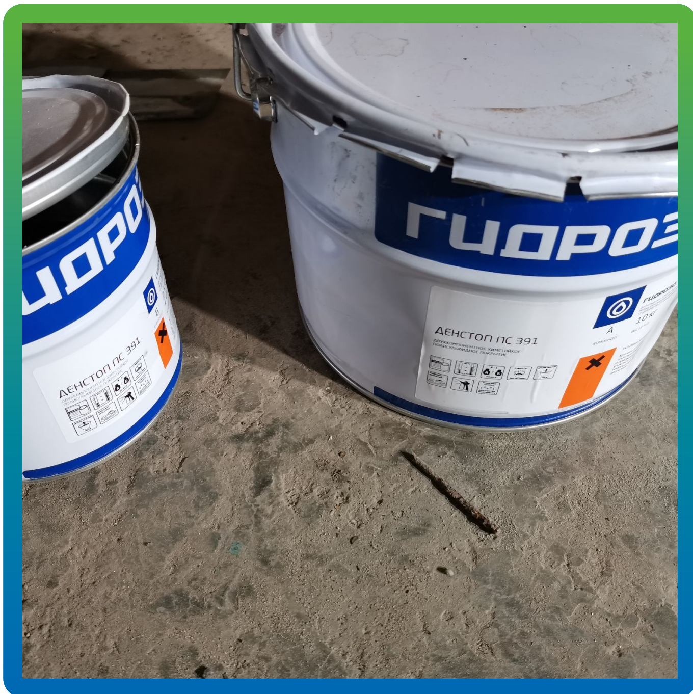
Материалы производства ООО "ГИДРОЗО" на объекте