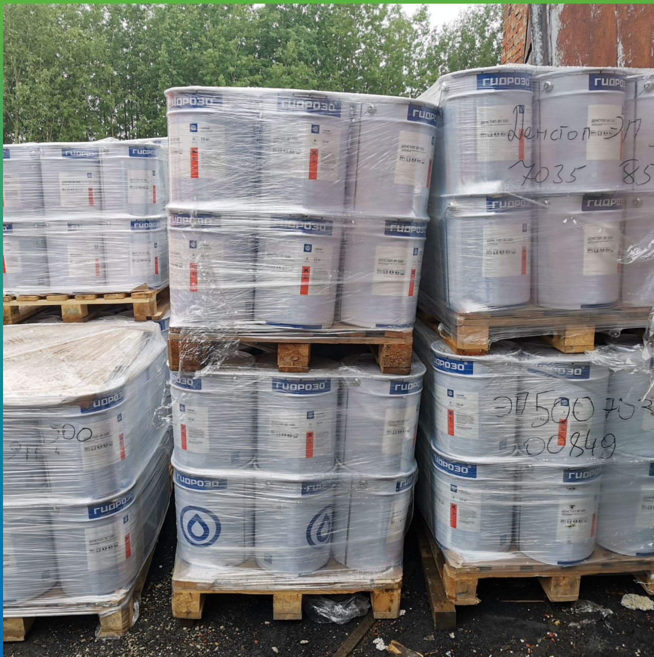
Материалы производства "Гидрозо" после транспортировки на производственную площадку