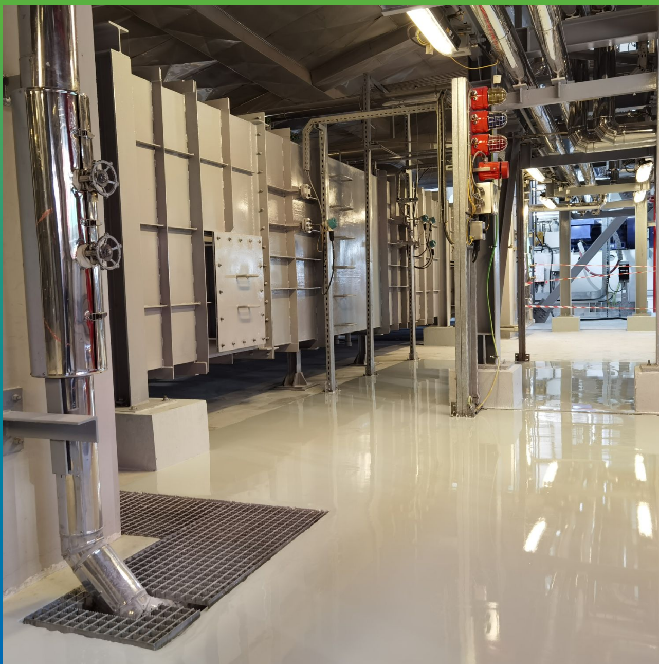
Покрытие после полимеризации