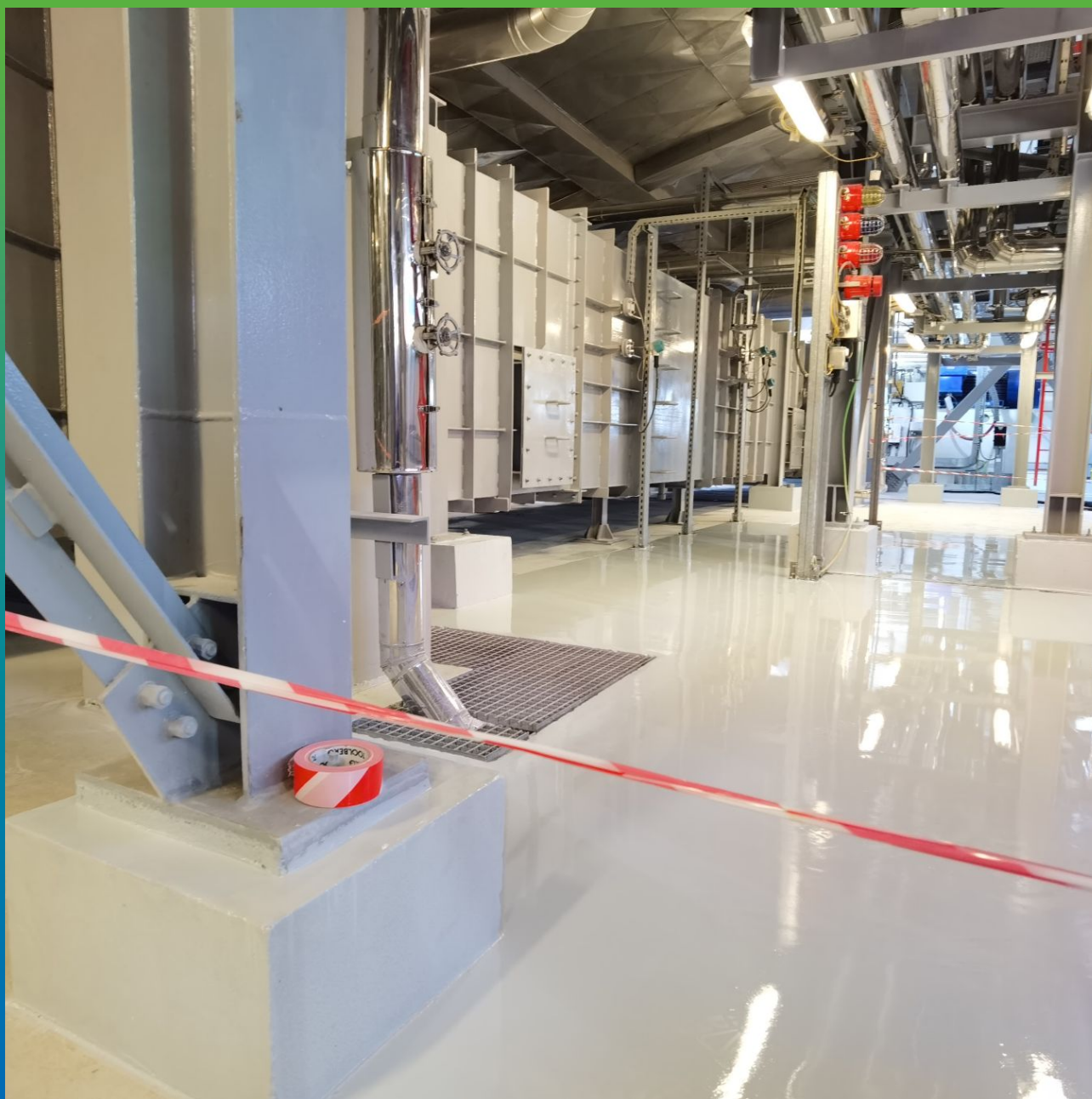
Вид покрытия после производства работ