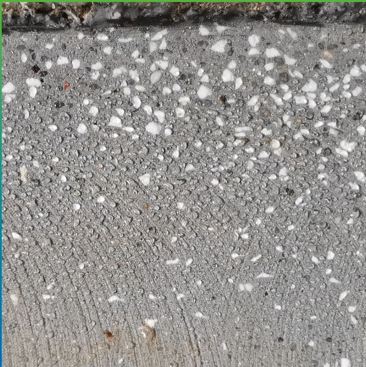
Поверхность подготовленная к укладке полимерных покрытий