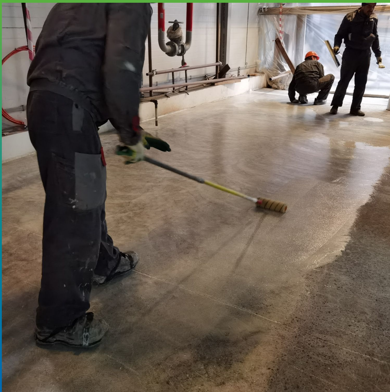
Грунтование основания низковязким эпоксидным составом ДенсТоп ЭП 100