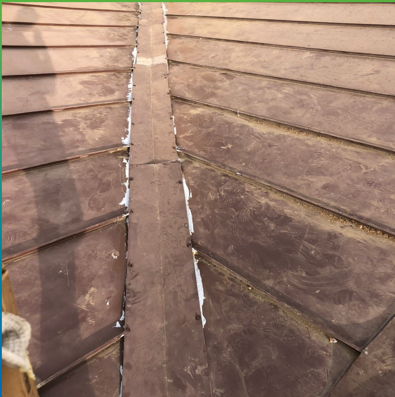
Защита мембраны металлическим листом от механических повреждений

Офисное здание на ул. Нурсултана Назарбаева, 13