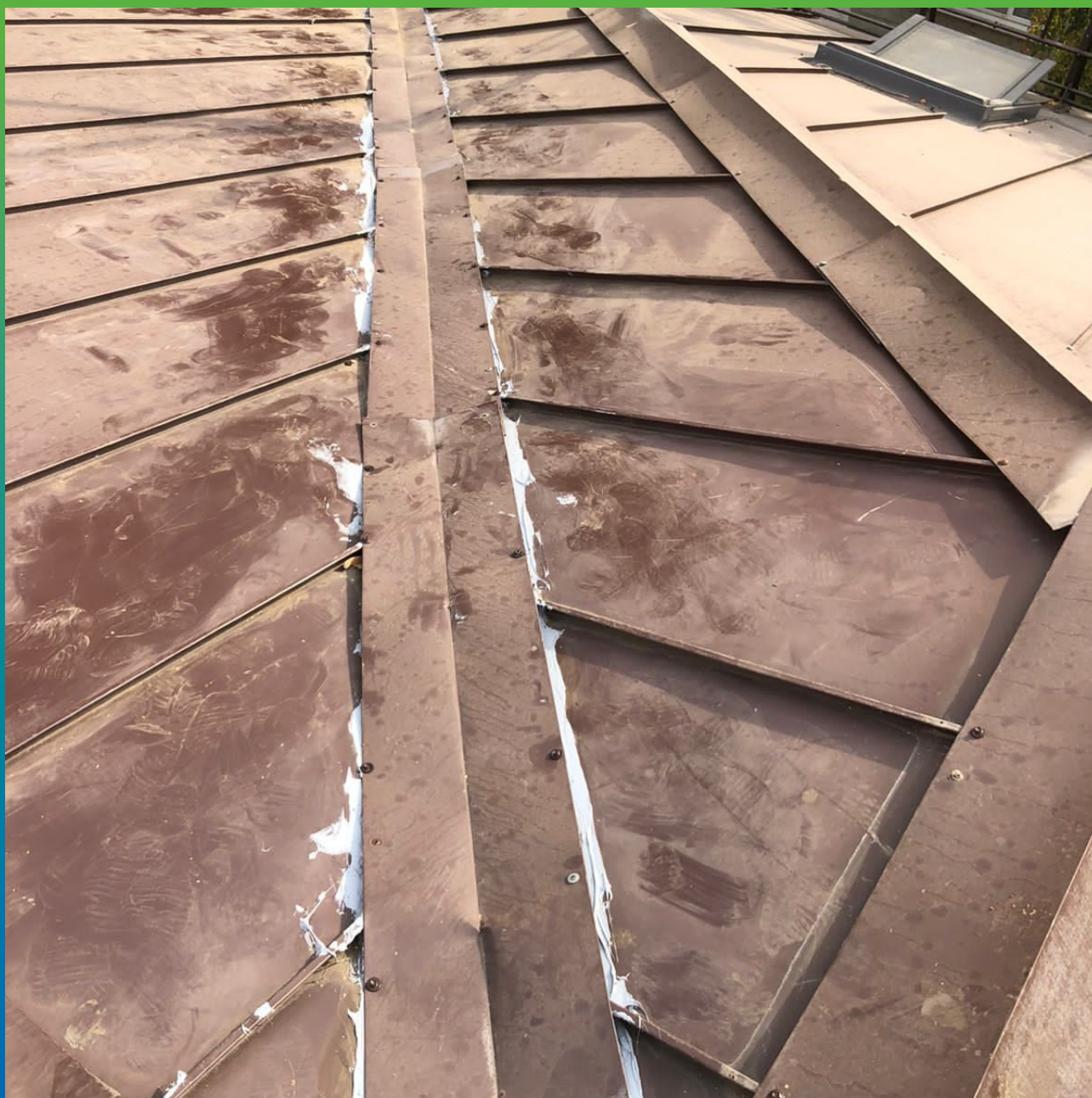
Вид на гидроизолированное примыкание

Офисное здание на ул. Нурсултана Назарбаева, 13