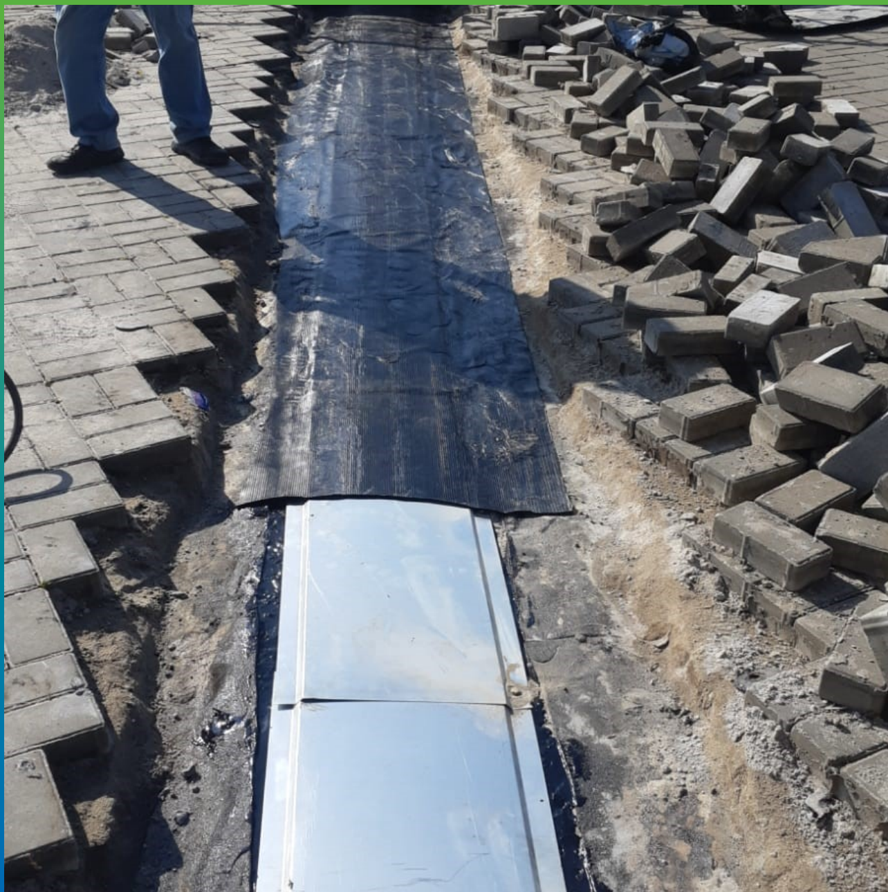
Восстановление существующей рулонной гидроизоляции