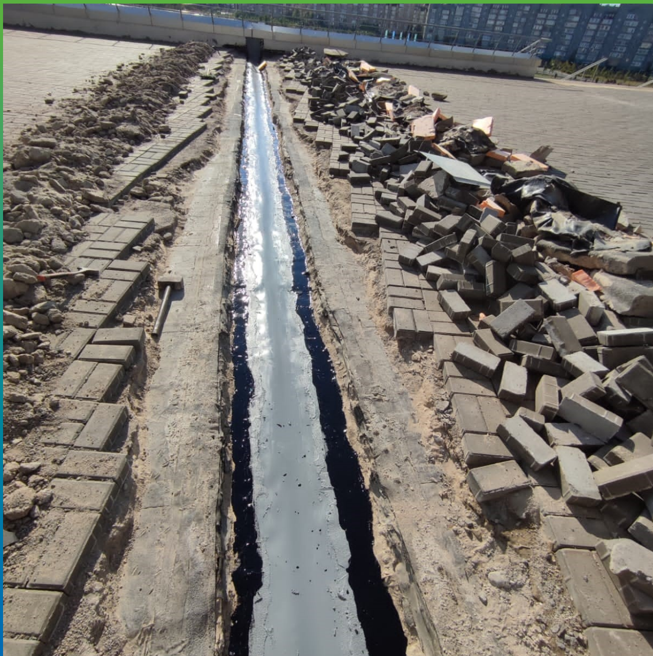
Восстановление существующей рулонной гидроизоляции