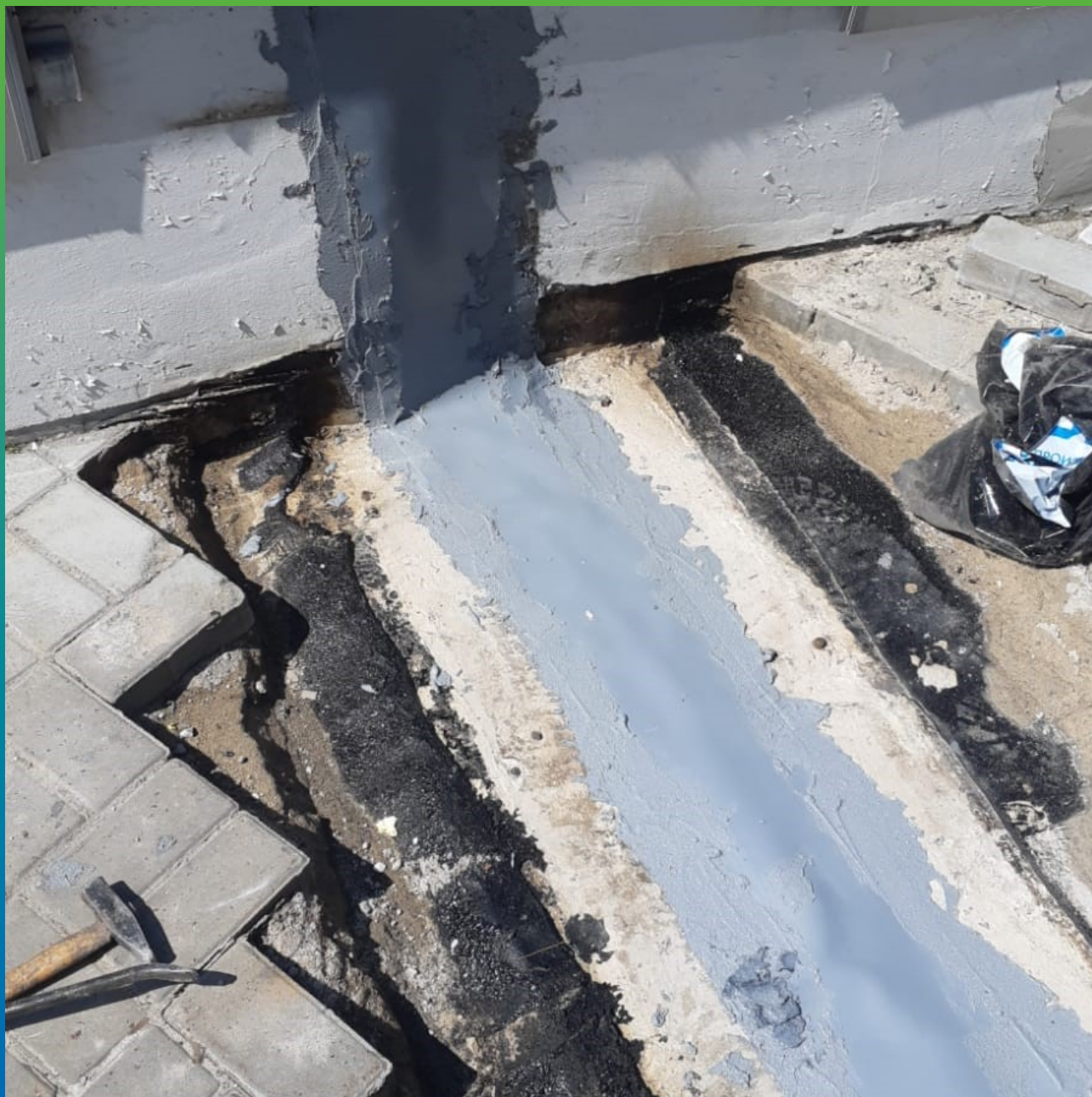
Монтаж ленты Манодил Про на эпоксидный клей Манопокс 331