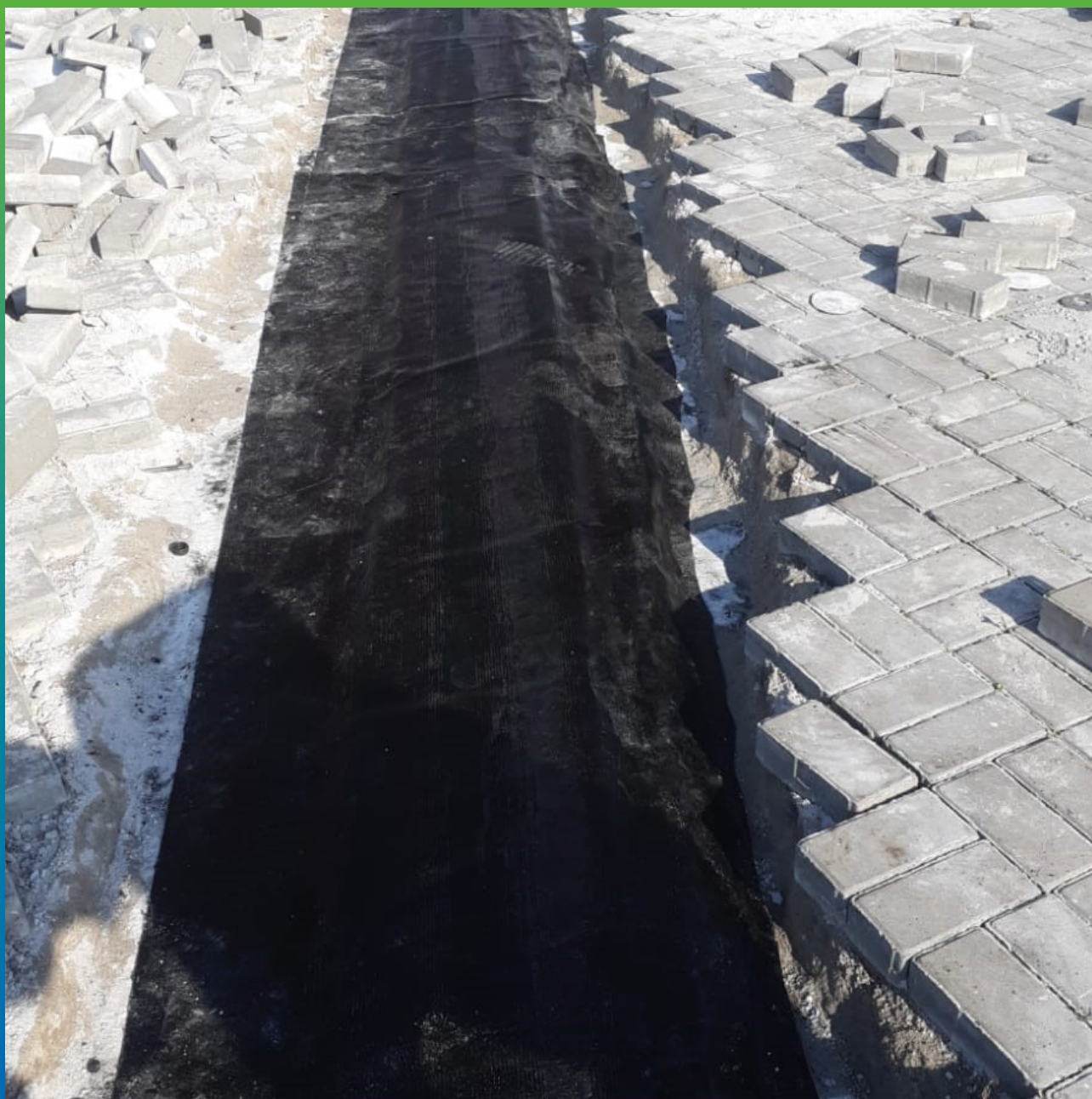
Шов, готовый к восстановлению брусчатки