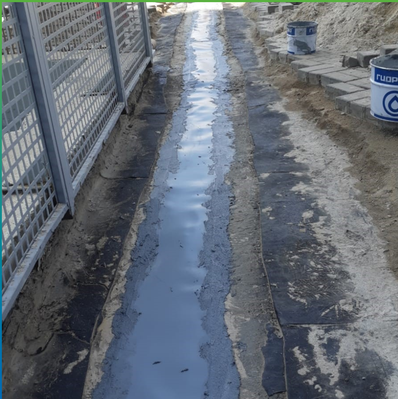
Монтаж ленты Манодил Про на эпоксидный клей Манопокс 331