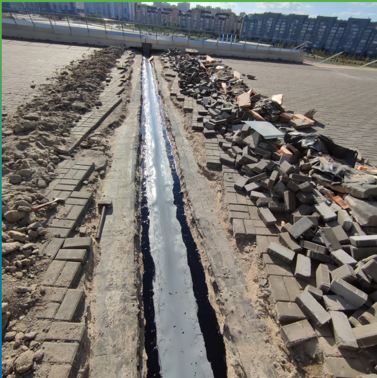
Восстановление существующей рулонной гидроизоляции