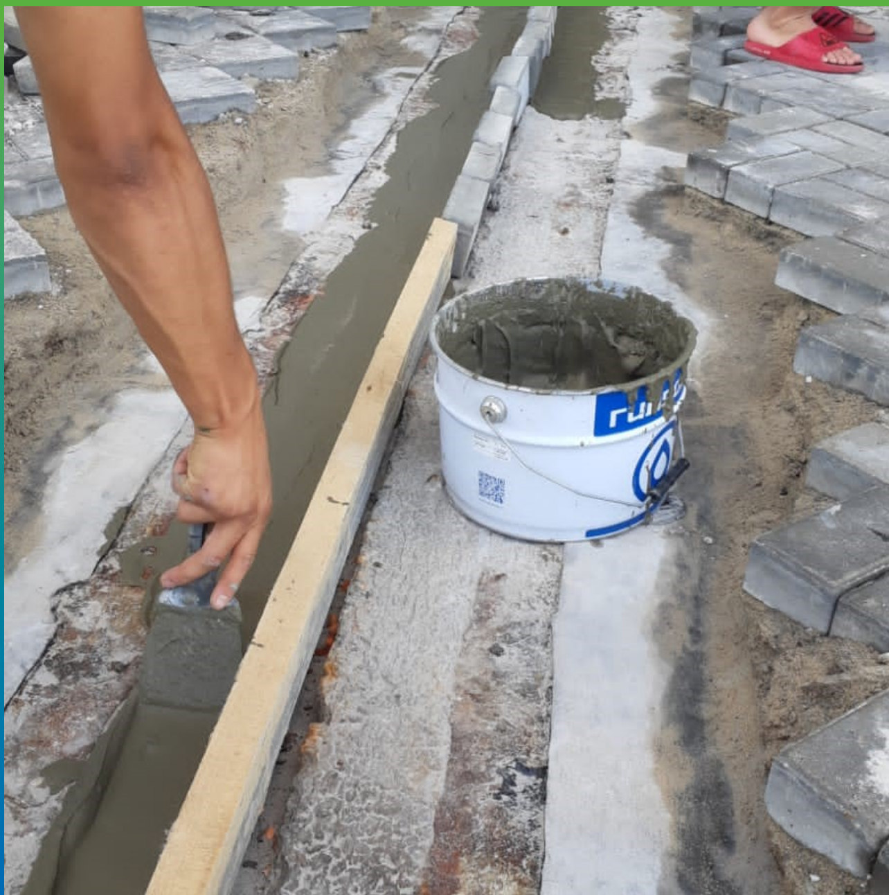
Ремонт основания составом Стармекс РМЗ перед монтажом ленты