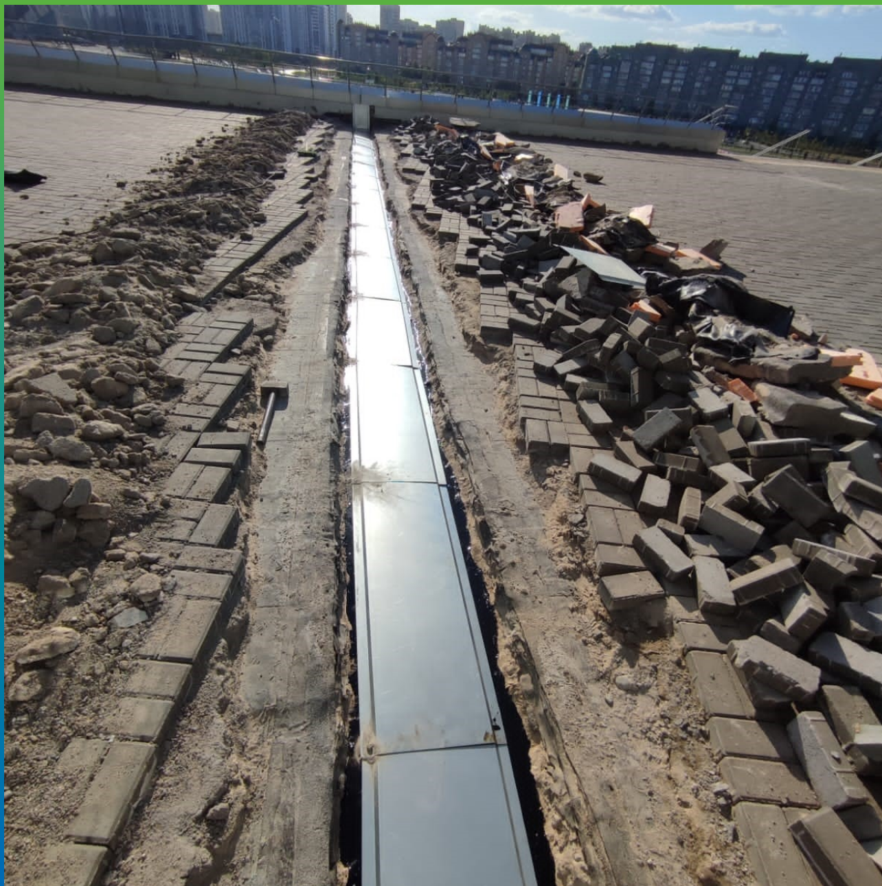
Защита лены от механических повреждений металлическим профилем