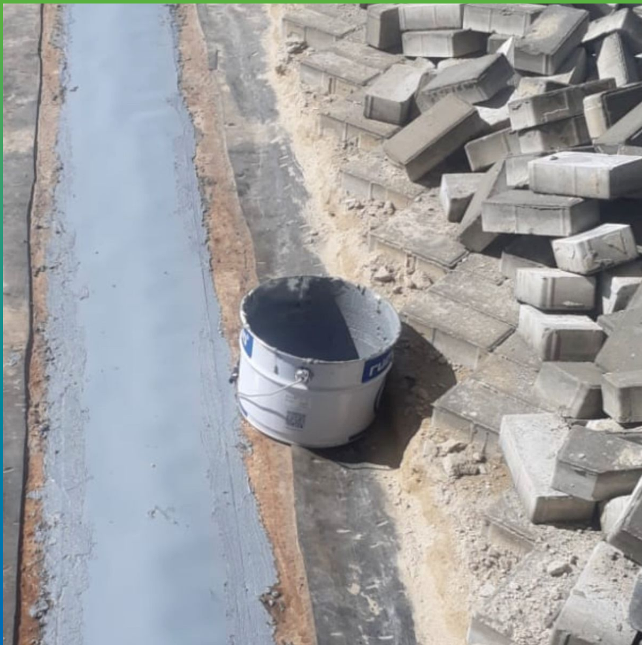
Монтаж ленты Манодил Про на эпоксидный клей Манопокс 331