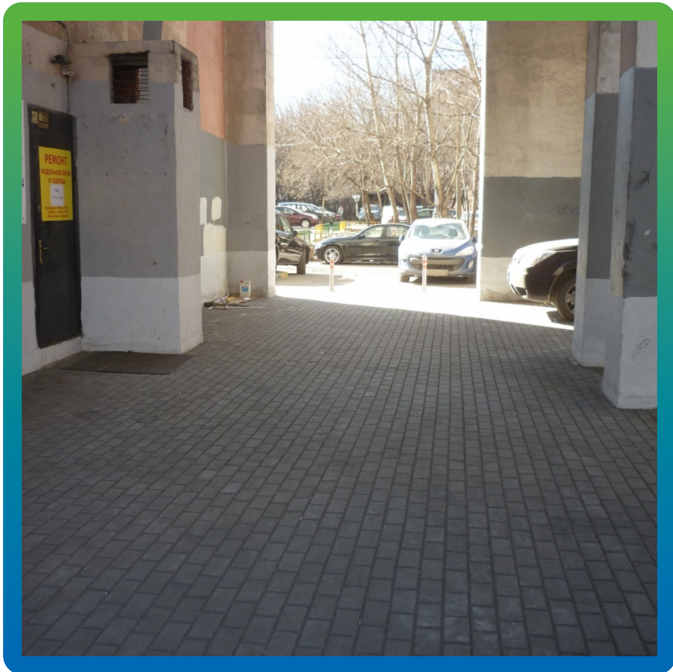
Конечный вид объект после укладки тротуарной плитки