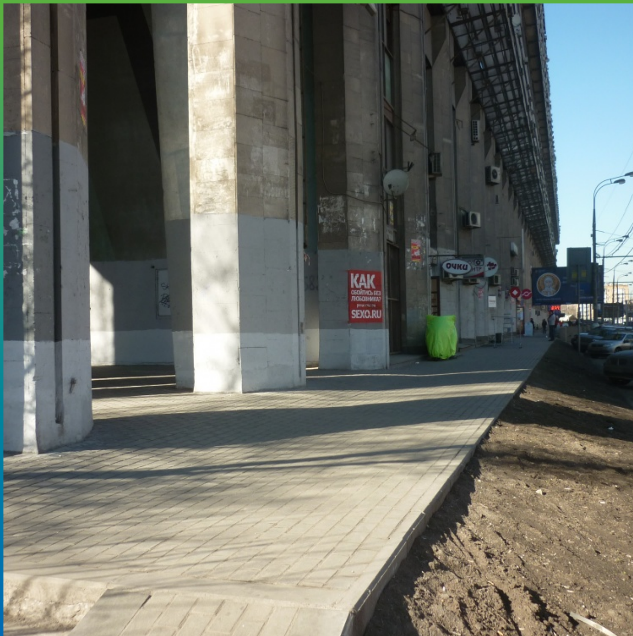
Конечный вид объект после укладки тротуарной плитки