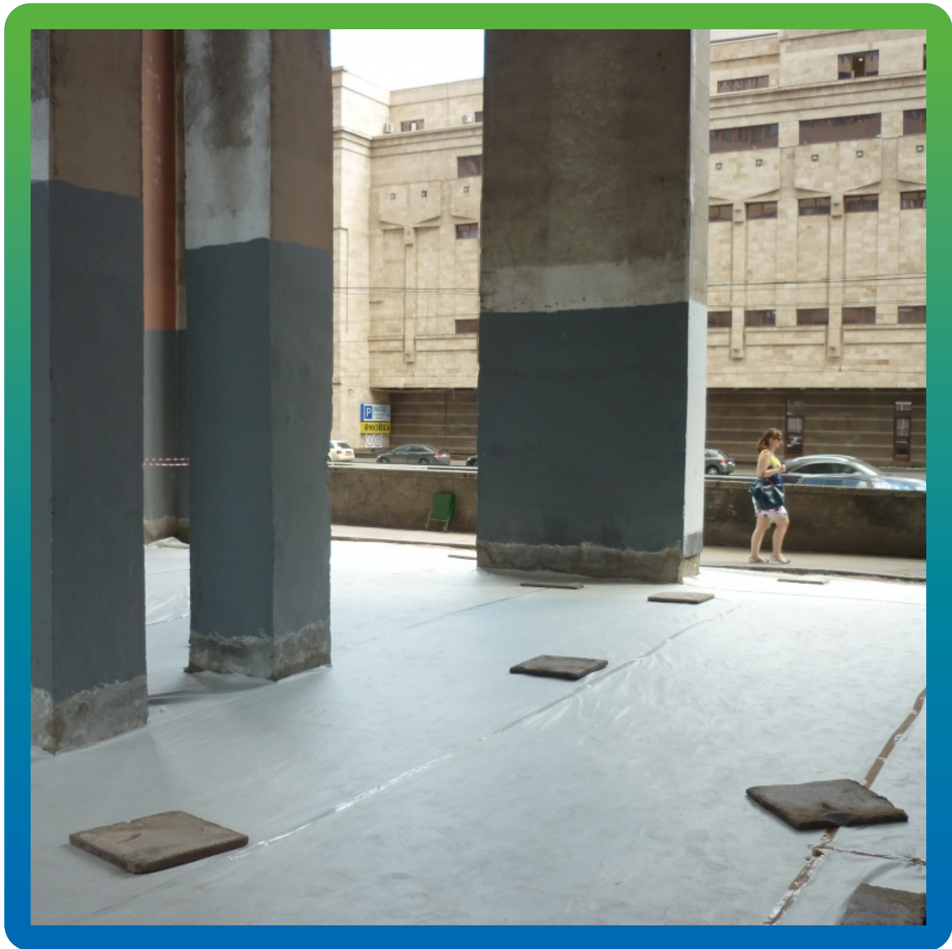
Вид подготовленного основания перед монтажом ЭПДМ мембраны