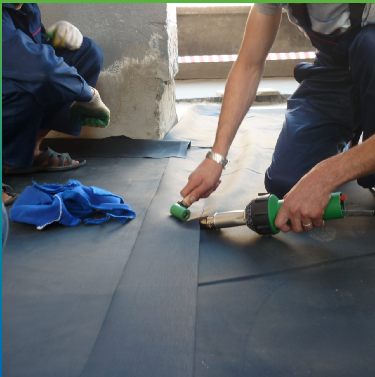
Соединение полотен через ленту Термобонд