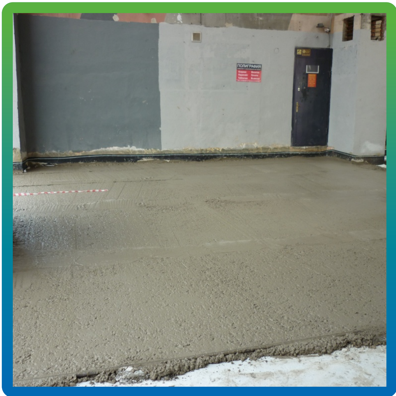
Устройство защитной стяжки