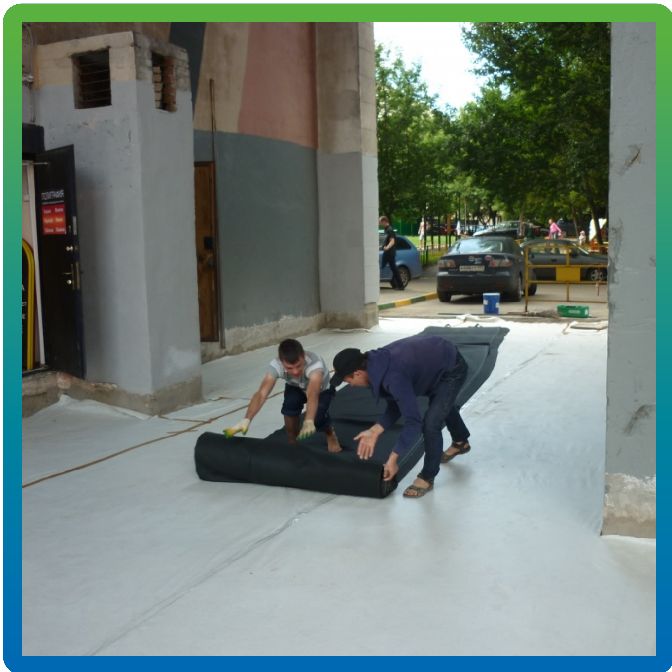
Раскатка мембраны перед ее монтажом