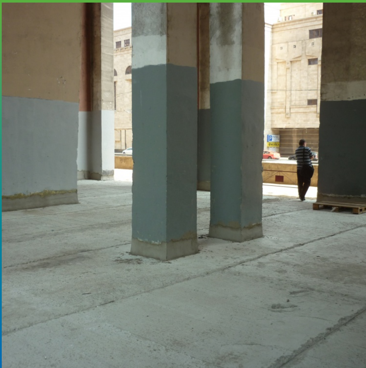
Основание под укладку тротуарной плитки