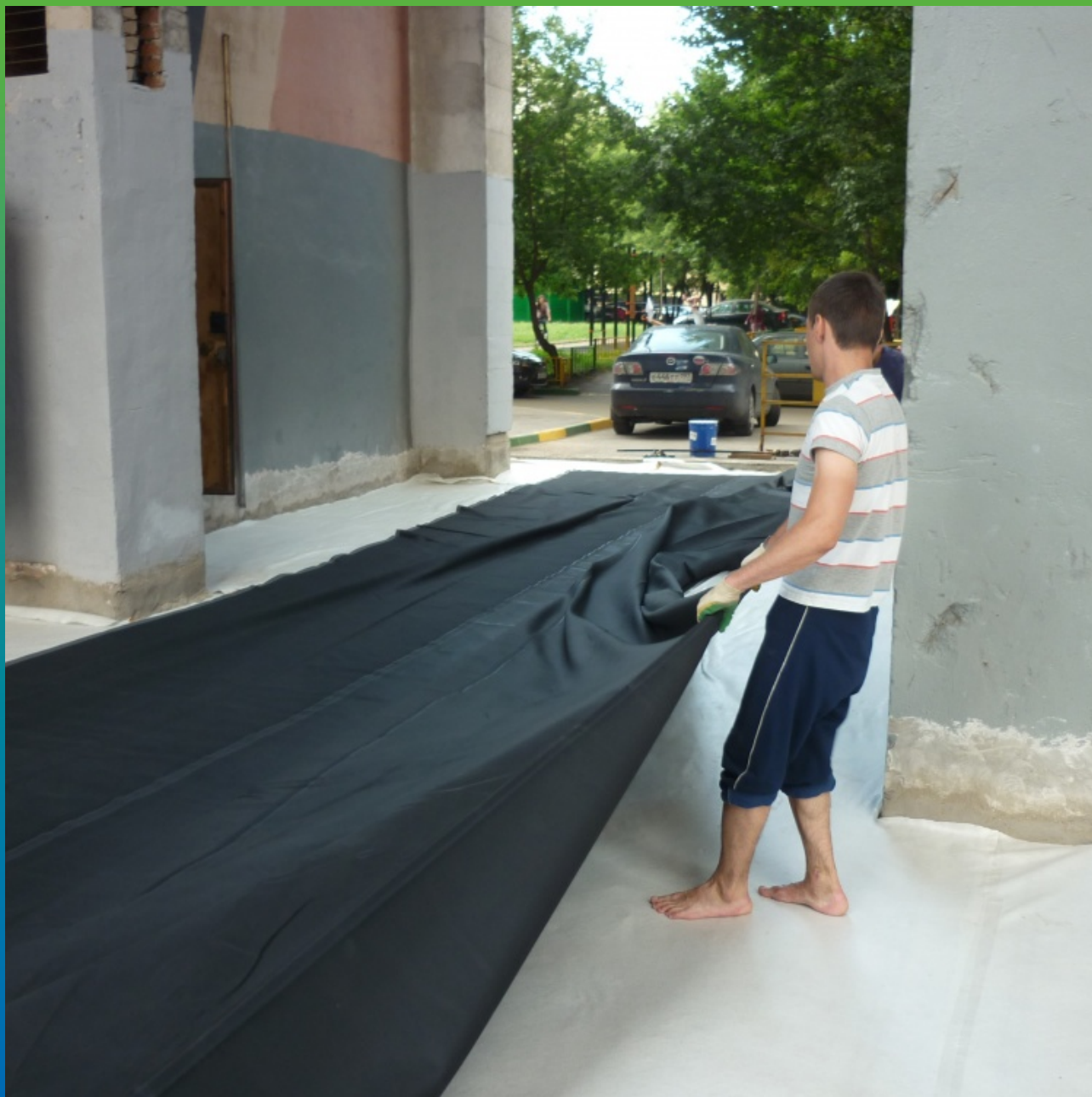
Раскатка мембраны перед ее монтажом