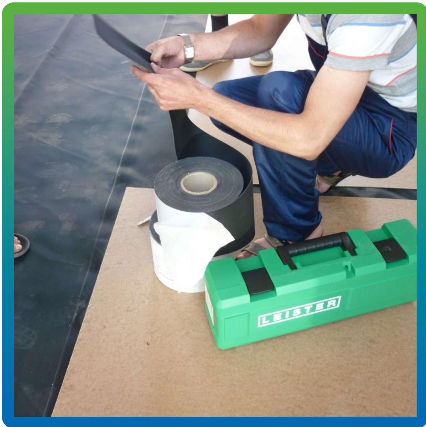
Соединение полотен через ленту Термобонд