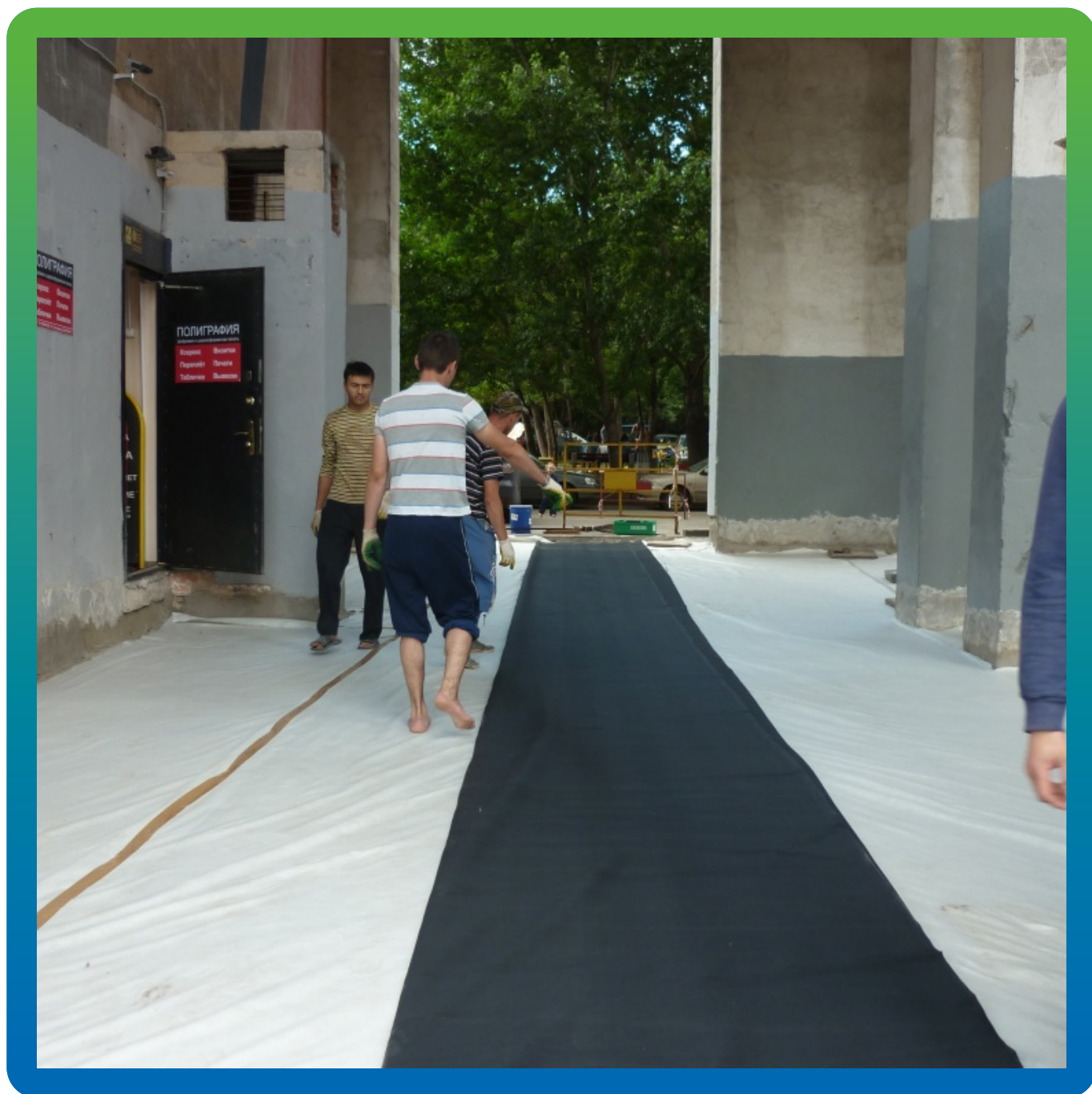
Раскатка мембраны перед ее монтажом