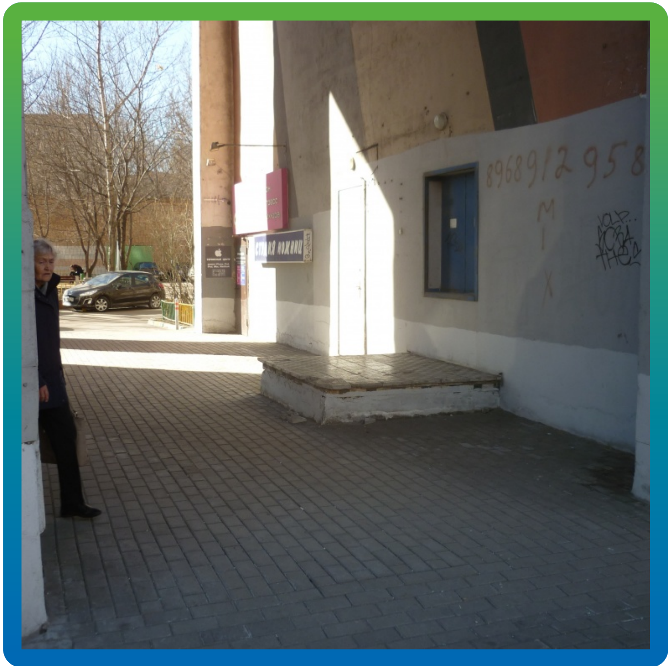
Конечный вид объект после укладки тротуарной плитки