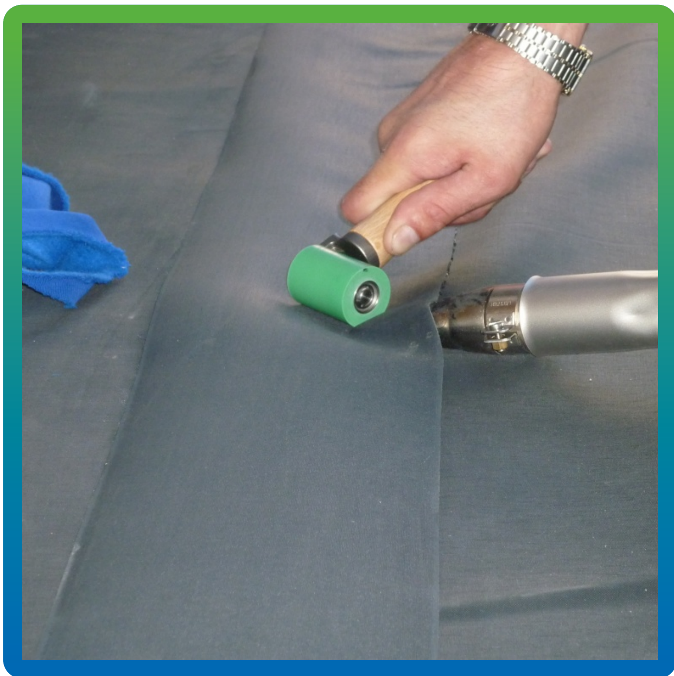
Соединение полотен через ленту Термобонд