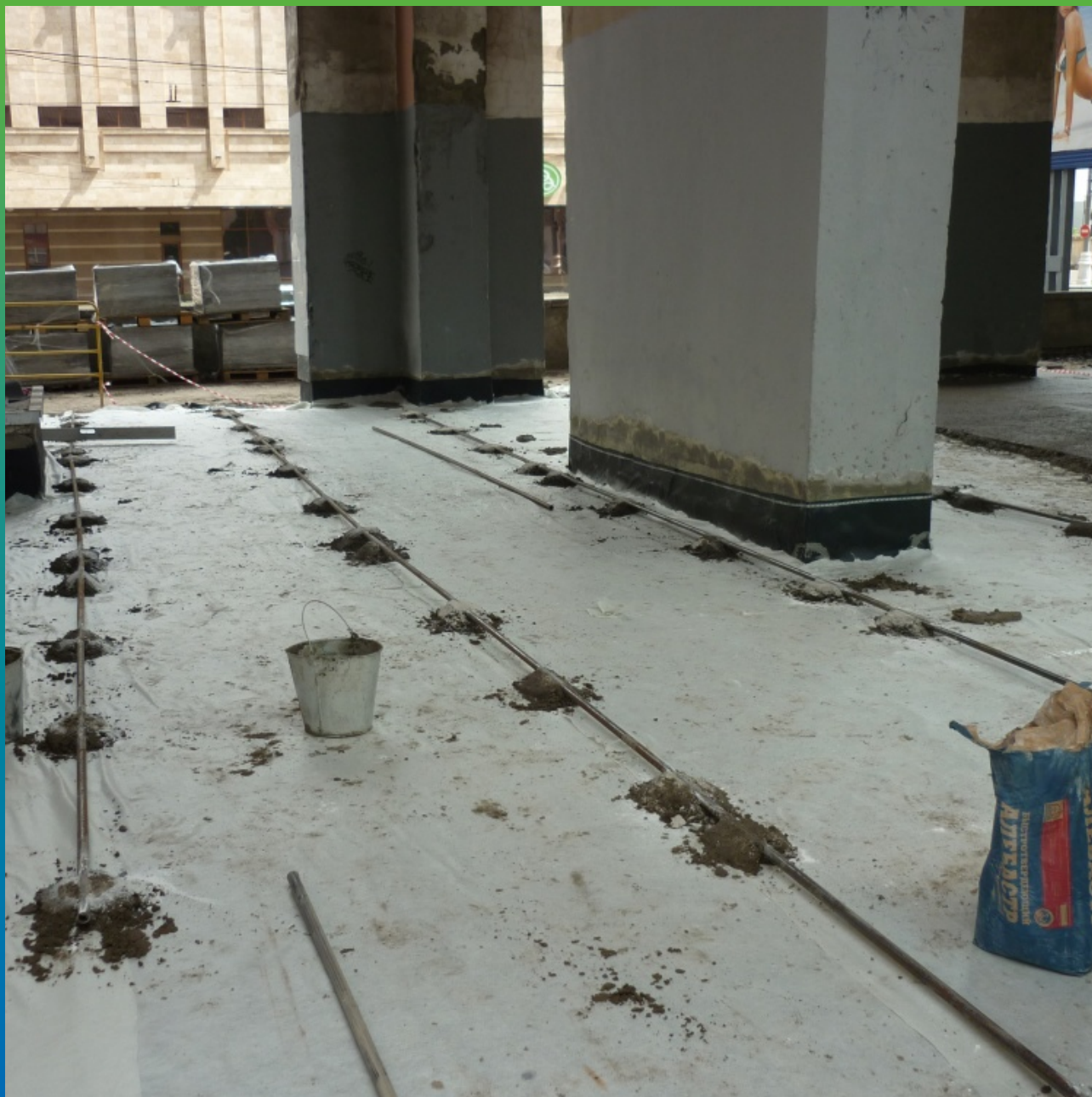
Монтаж маяков для устройства защитной стяжки