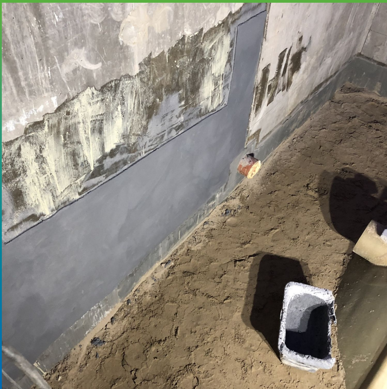
Другой вид нанесения