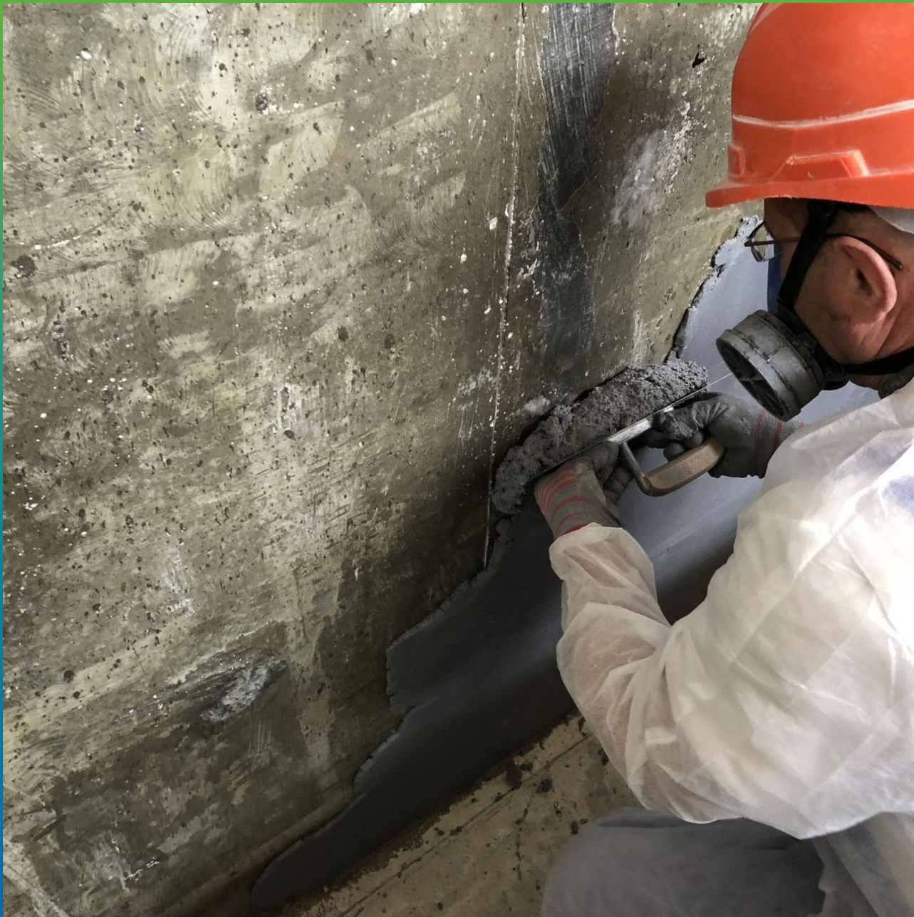
Нанесение состава на вертикальный участок