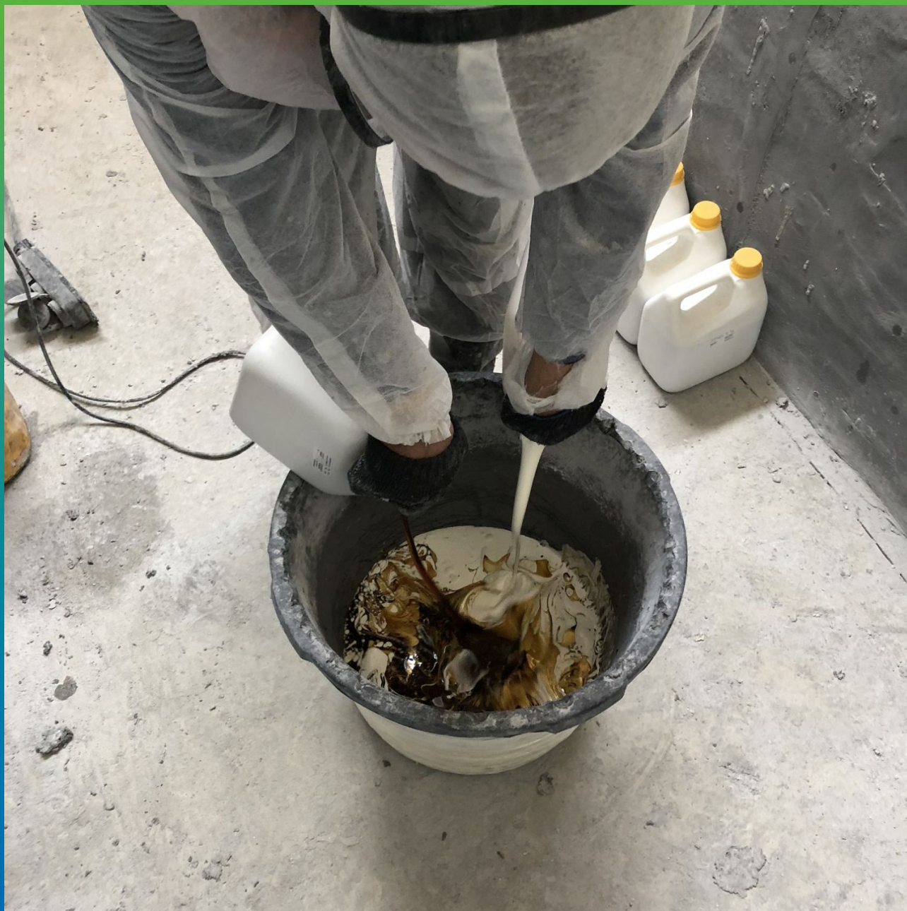
Смешение жидких компонентов ДенсТоп ПМ 605 ФК