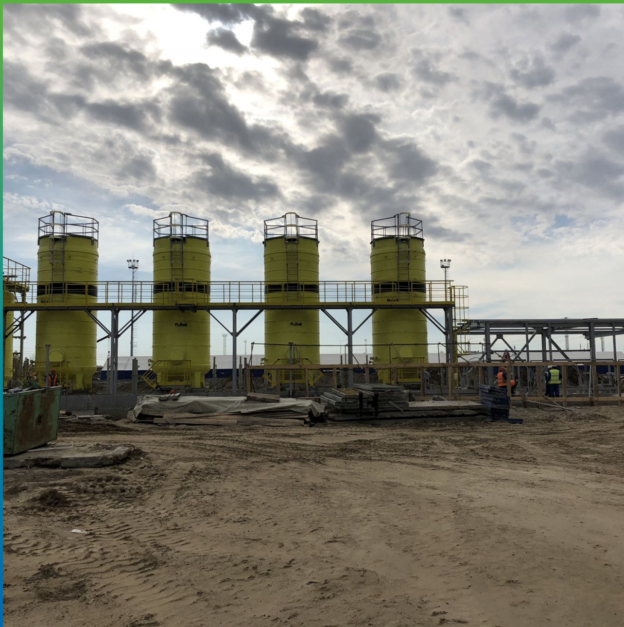
Частный вид объекта. Площадка строительства