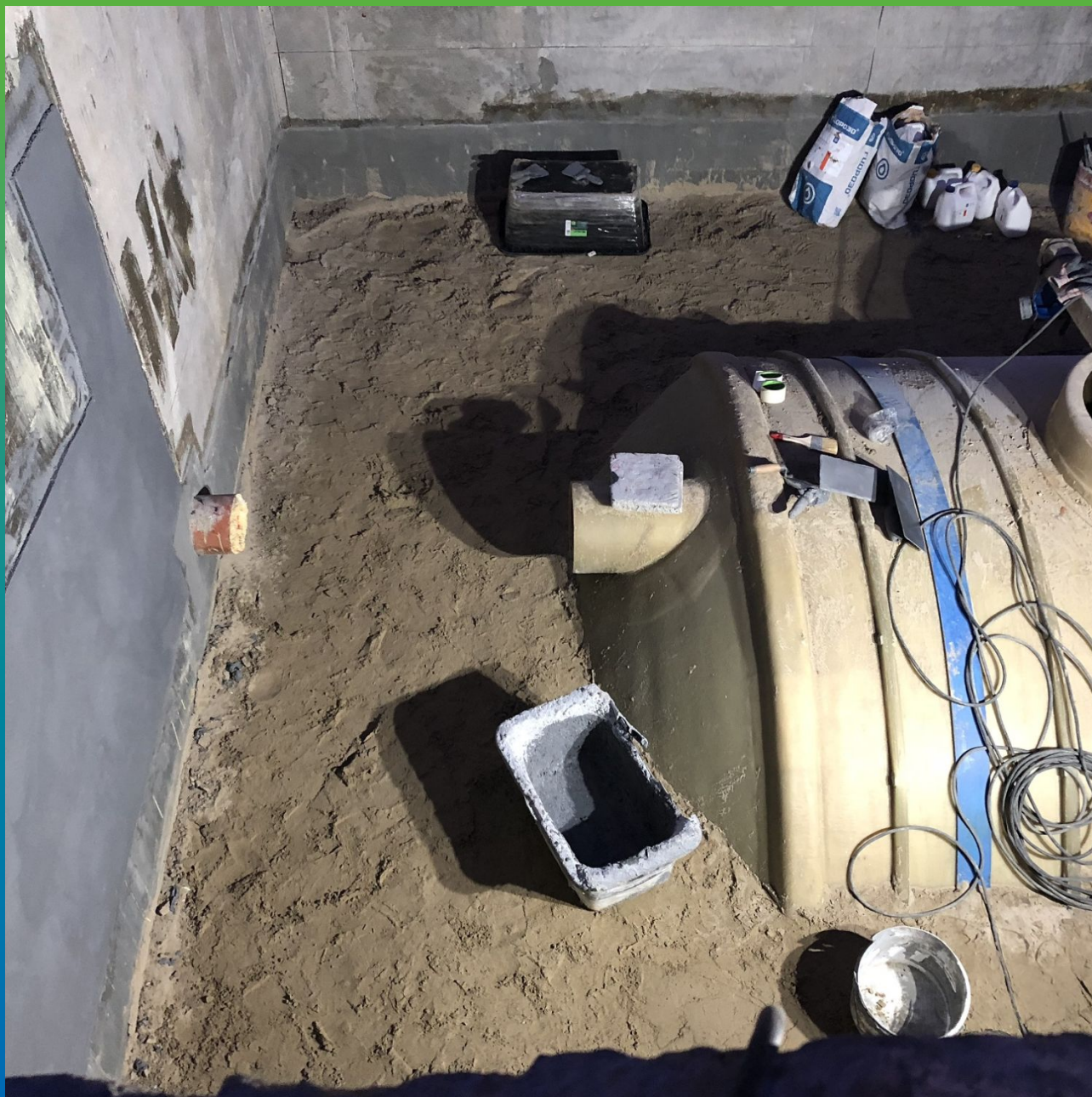
Засыпка резервуара песком и продолжение нанесения