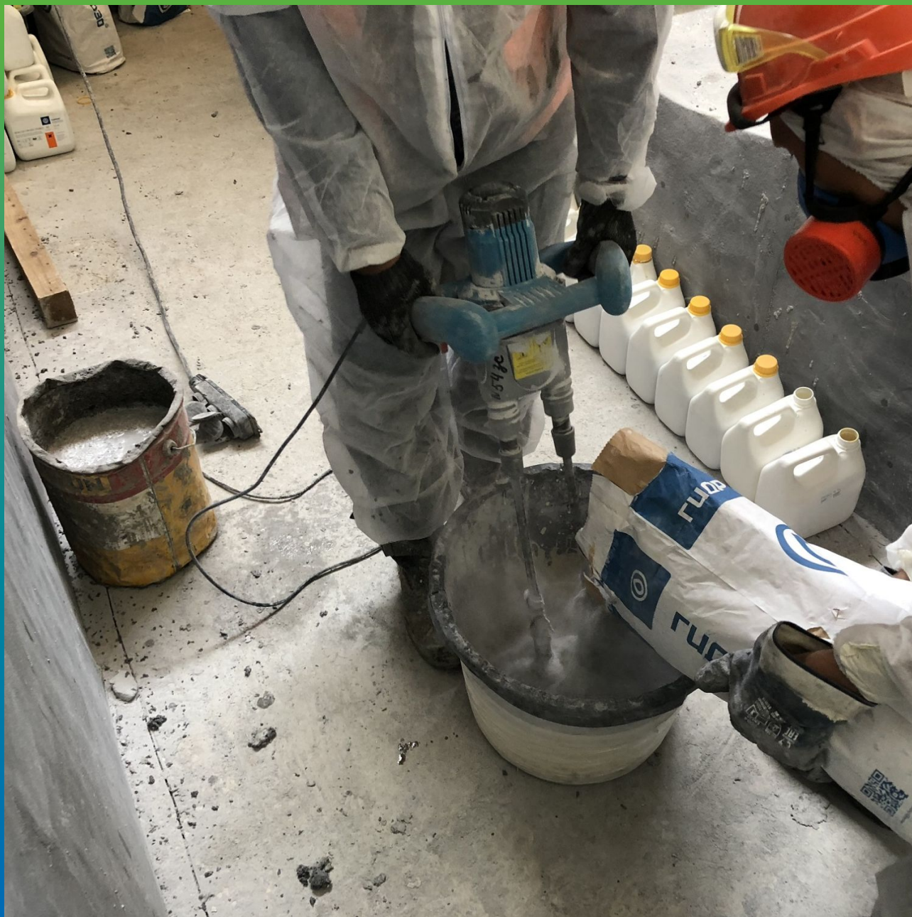
Добавление сухого компонента ДенсТоп ПМ 605 ФК