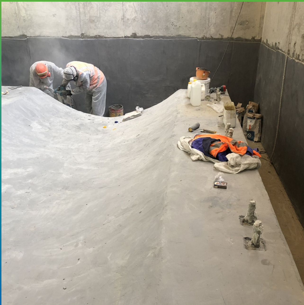
Приближенный вид процессов