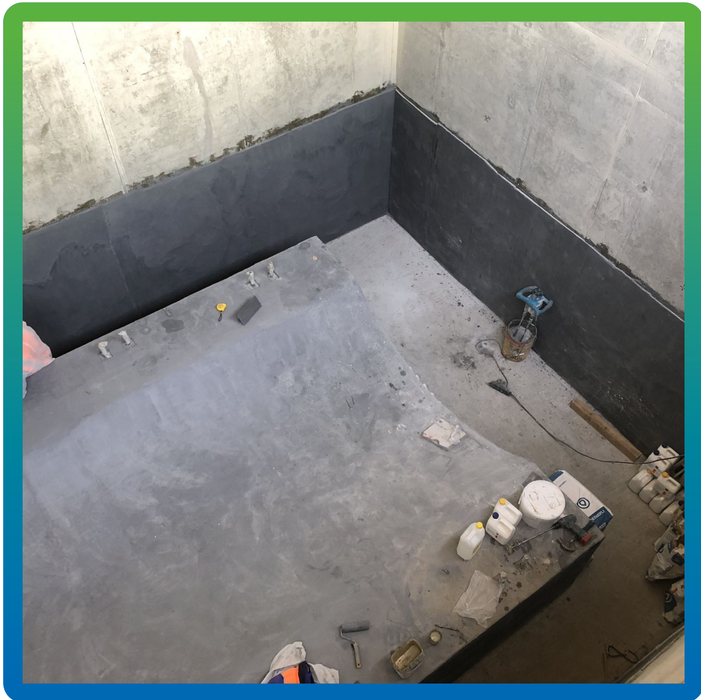
Общий вид нанесения