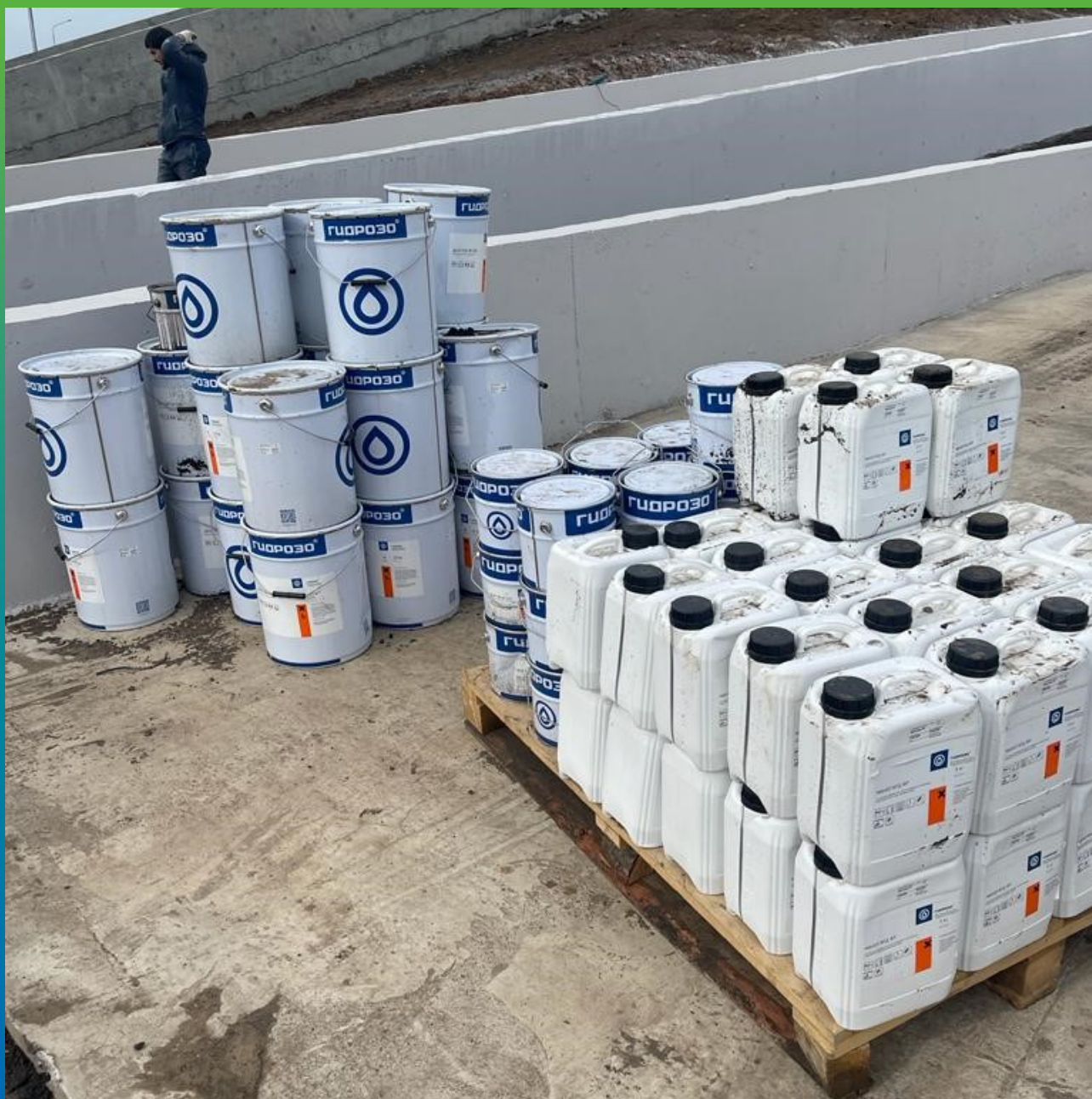
Маногард ФР, ДенТоп ЭП 205.