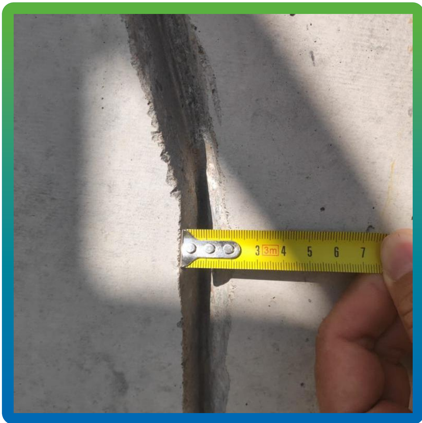
Замеры расшитой трещины