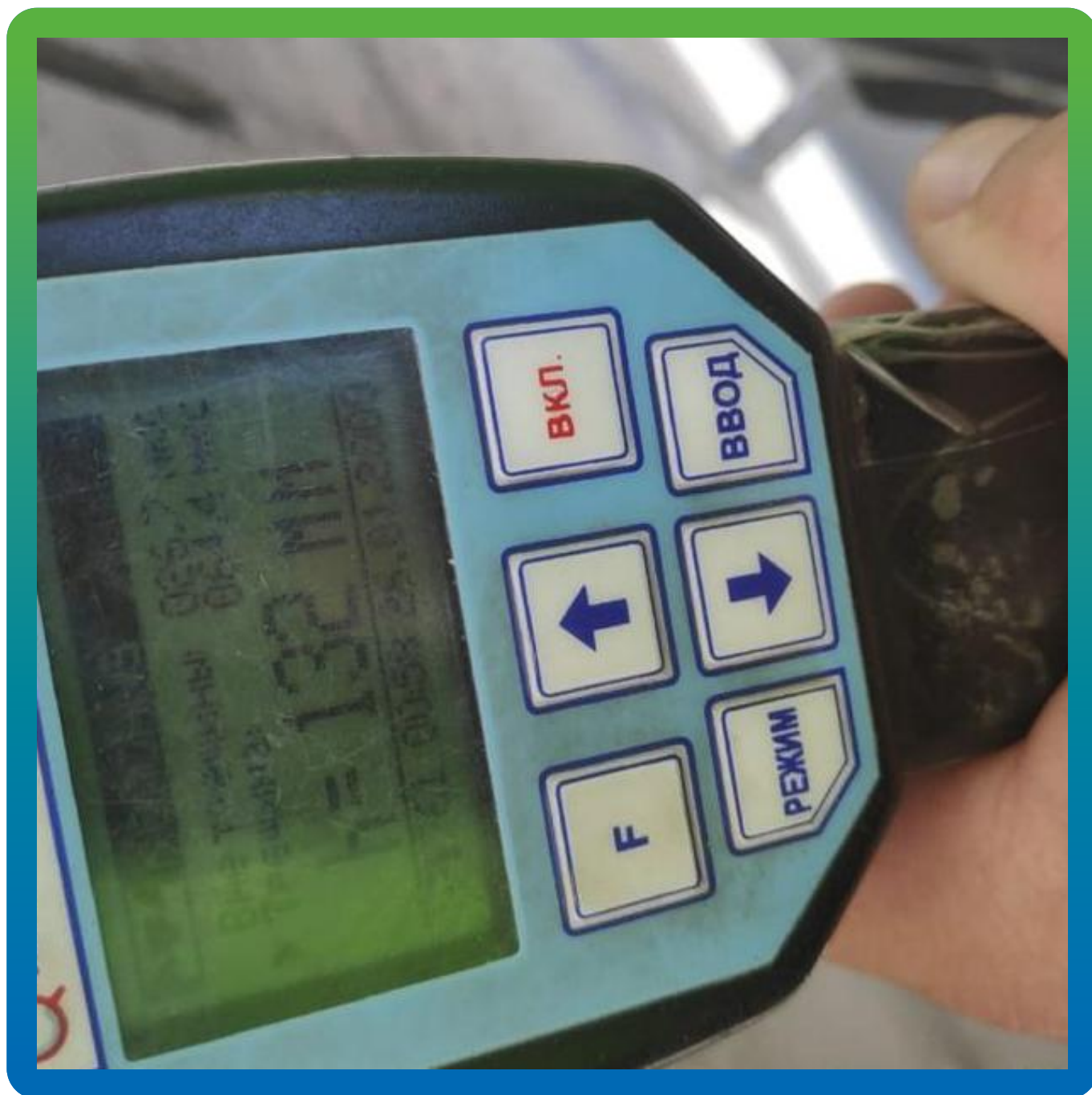
Замер глубины трещины