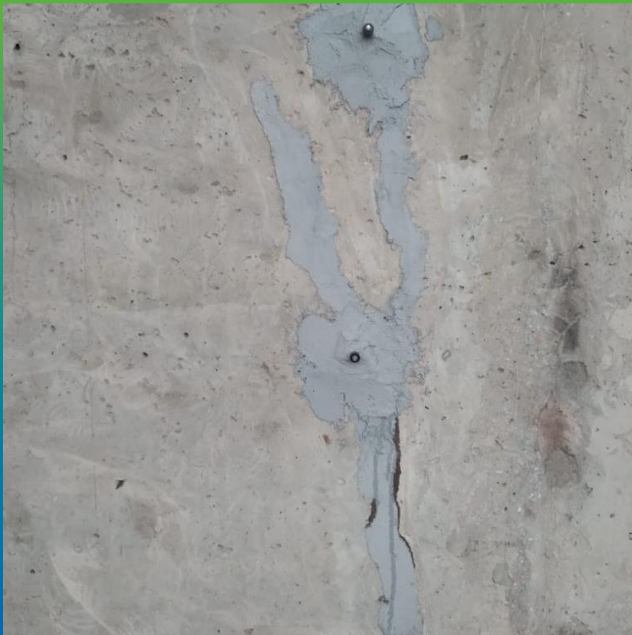
Трещины, инъецированные составом Манопокс 352ЛВ