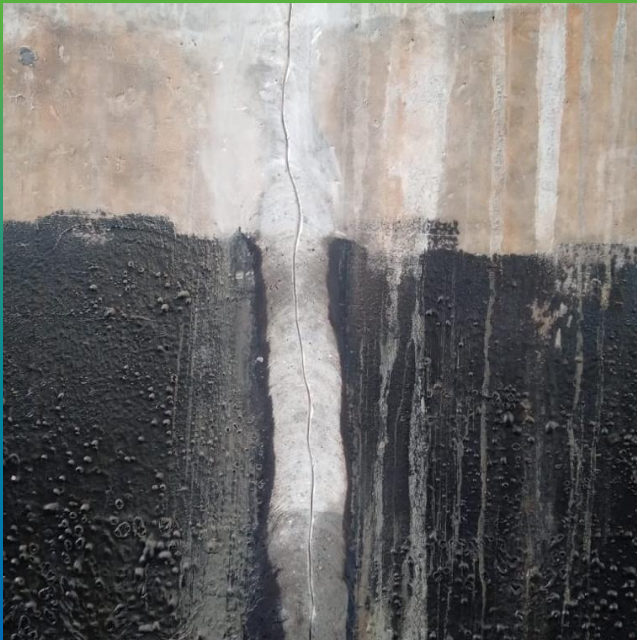
Очистка трещины от битума