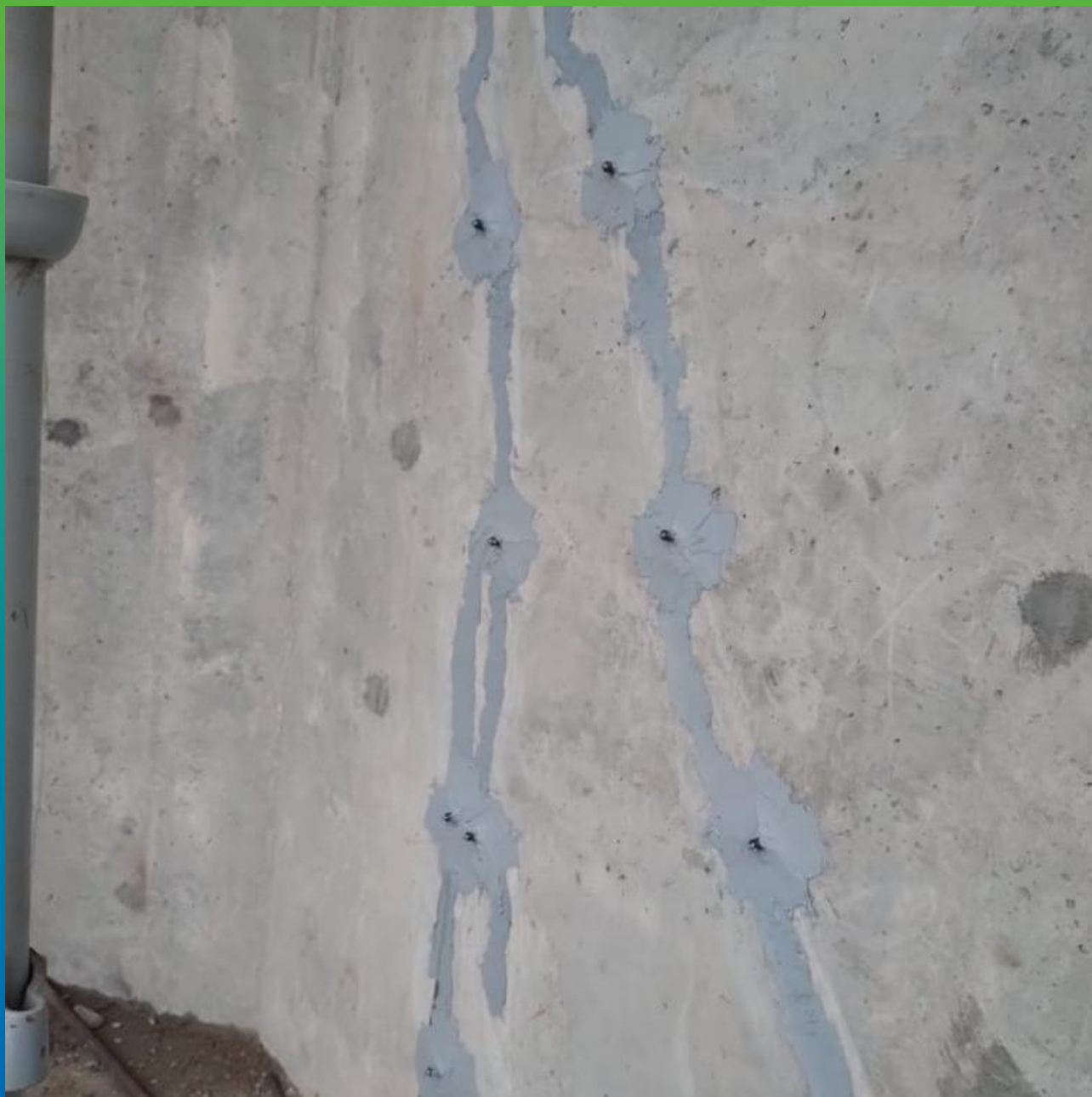
Трещины, инъецированные составом Манопокс 352ЛВ