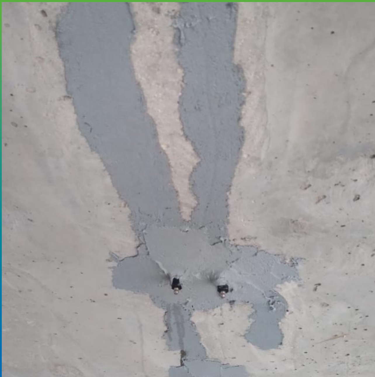
Трещины, инъецированные составом Манопокс 352ЛВ