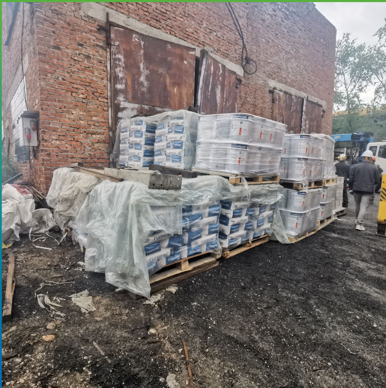
Материалы производства "Гидрозо" подготовленные для транспортировки к объекту