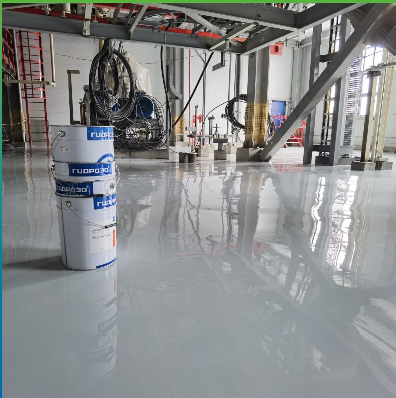
Вид покрытия после полимеризации покрытия и проведения всех сопутствующих работ