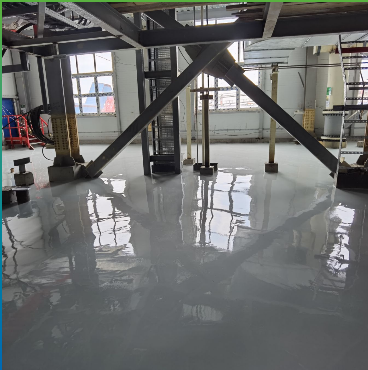
Вид покрытия после заливки всей площади