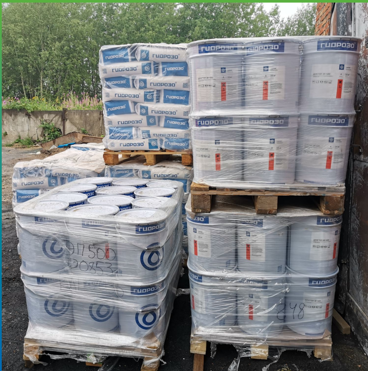
Материалы производства "Гидрозо" после выгрузки на объекте