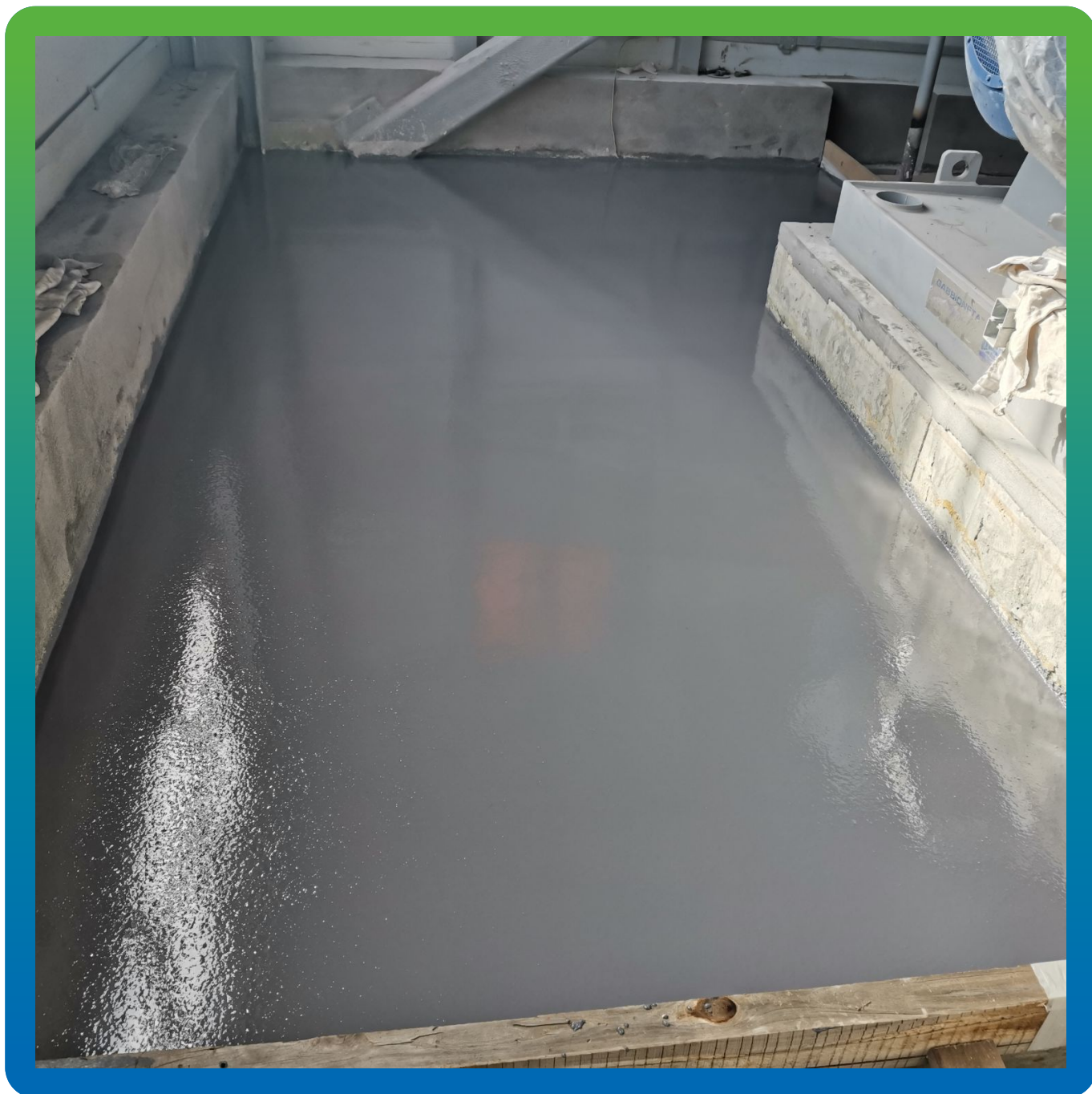
Вид покрытия после укладки на объекте