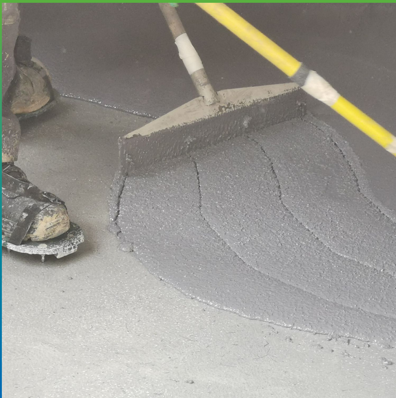
Распределение состава по площади толщиной 10 мм.