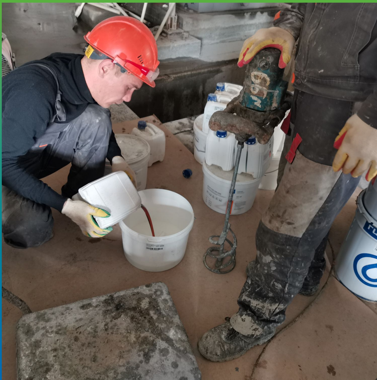
Перемешивание компонентов грунтовочного состава ДенТоп ПМ 600