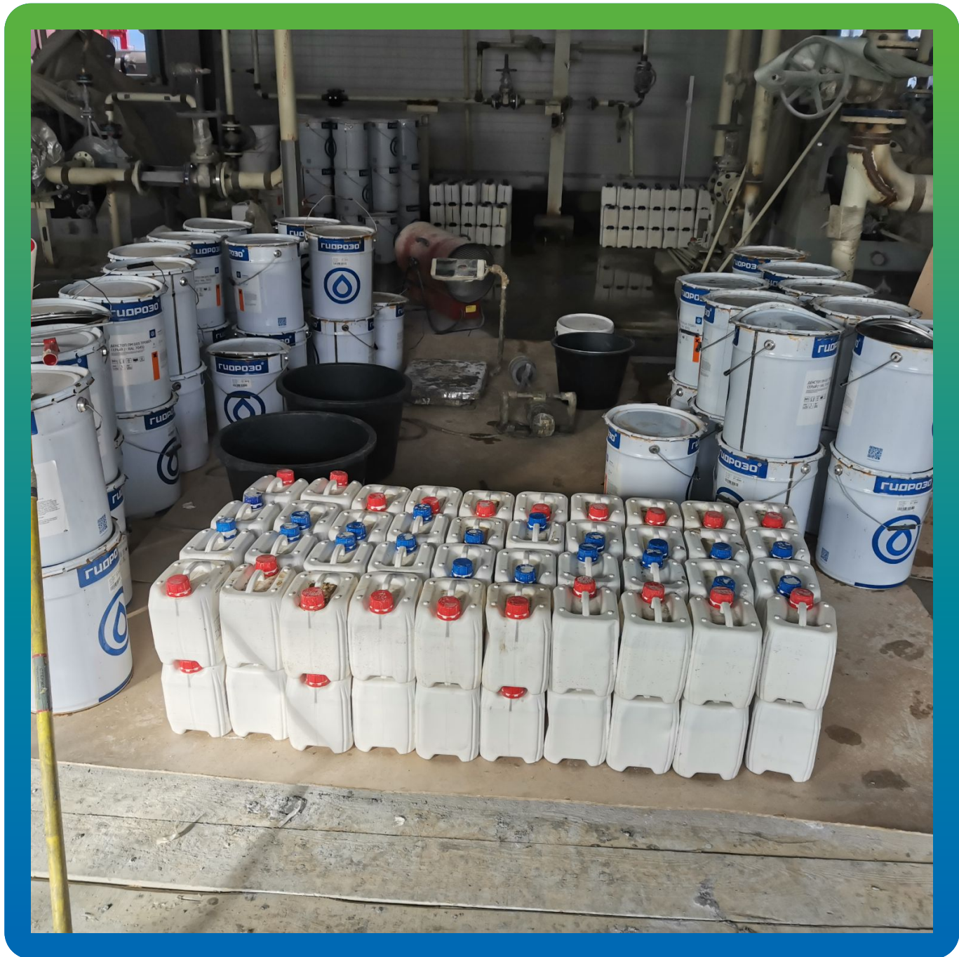
Сортировка материалов перед укладкой покрытия