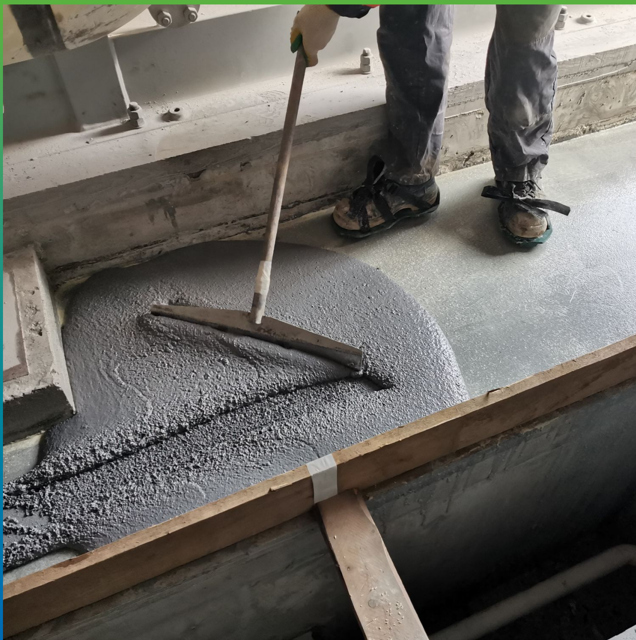
Распределение состава на определенную толщину 10 мм