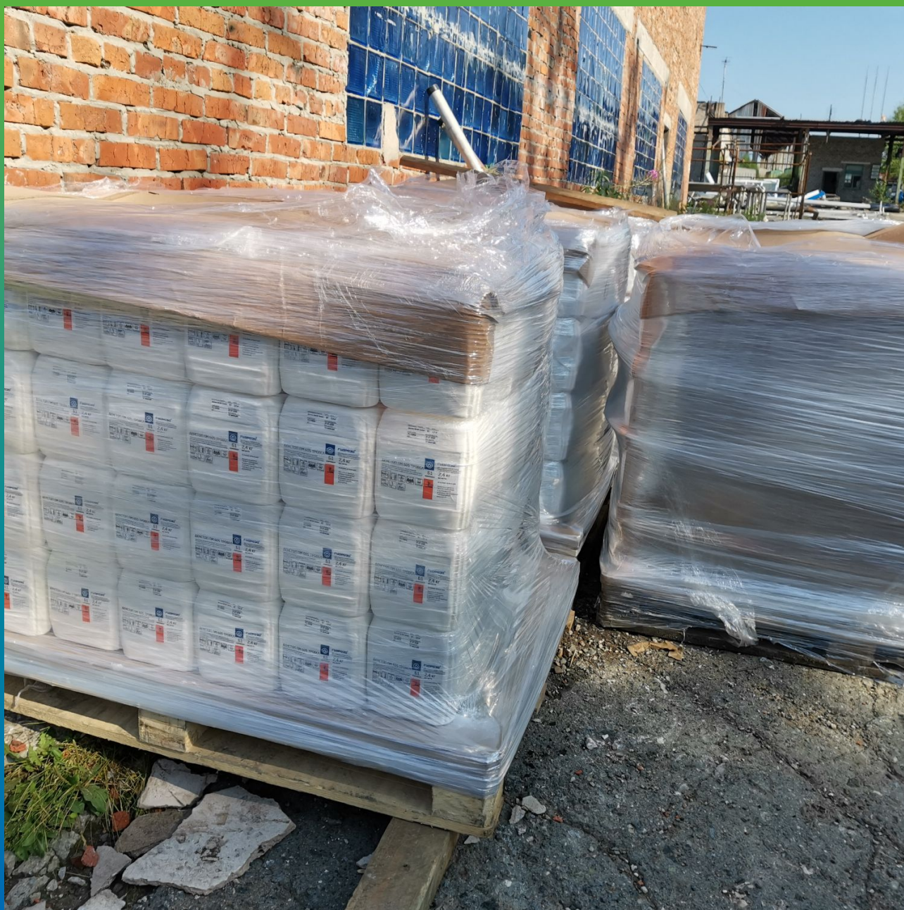
Материалы производства "Гидрозо" на объекте