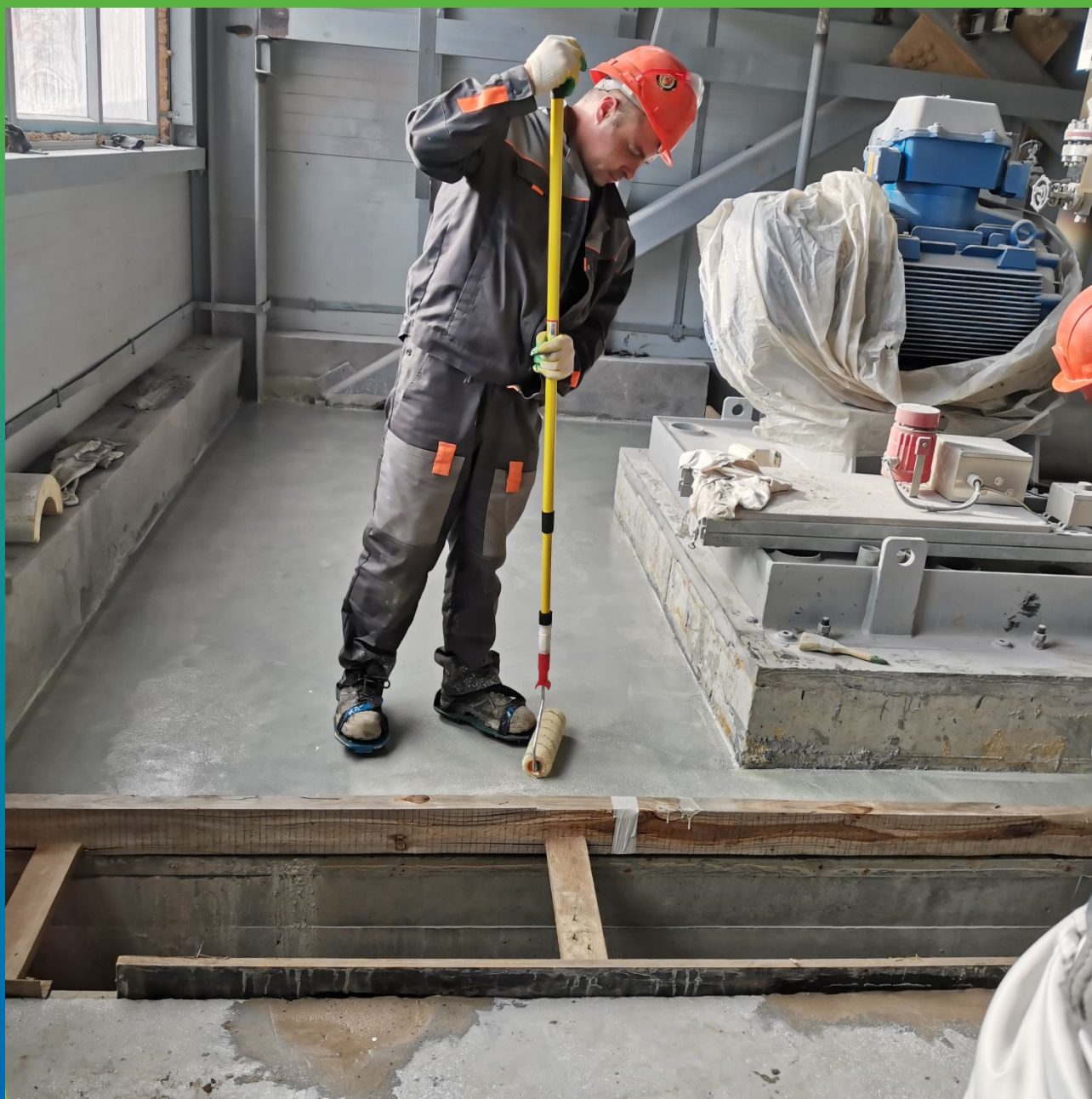
Грунтование поверхности на труднодоступных участках