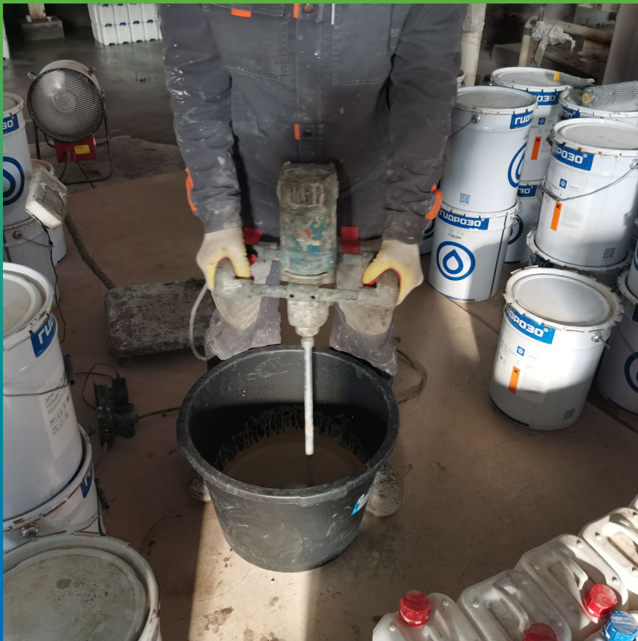
Перемешивание компонентов цемент-полиуретанового покрытия ДенТоп ПМ 605 Трвел