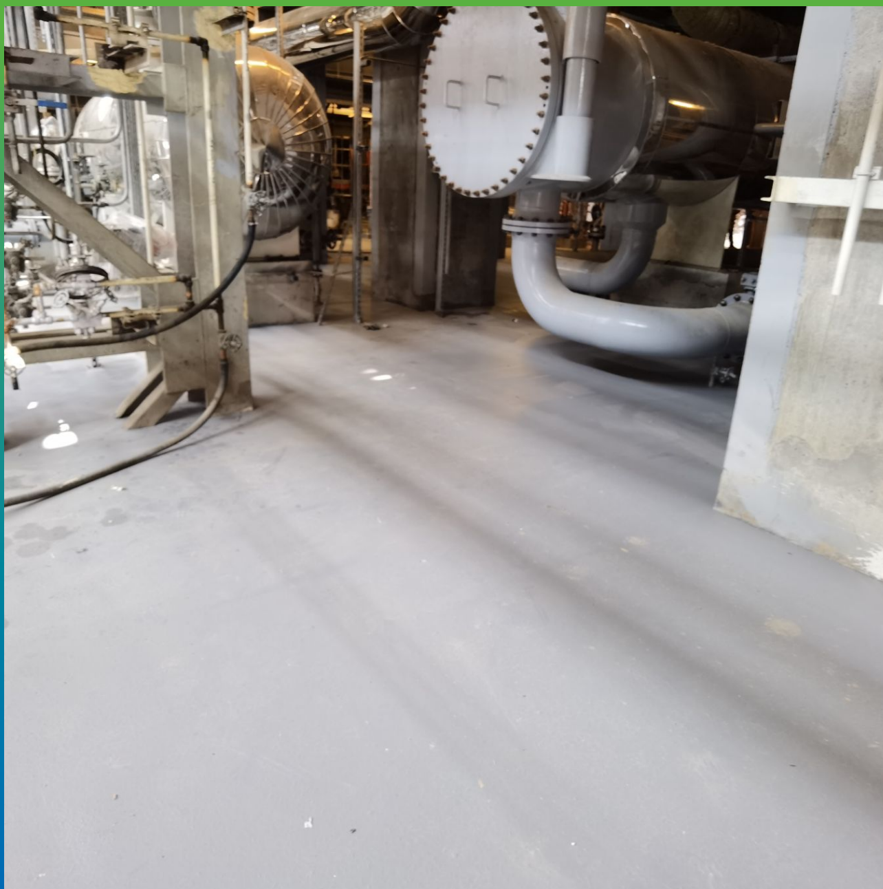
Вид покрытия после полимеризации