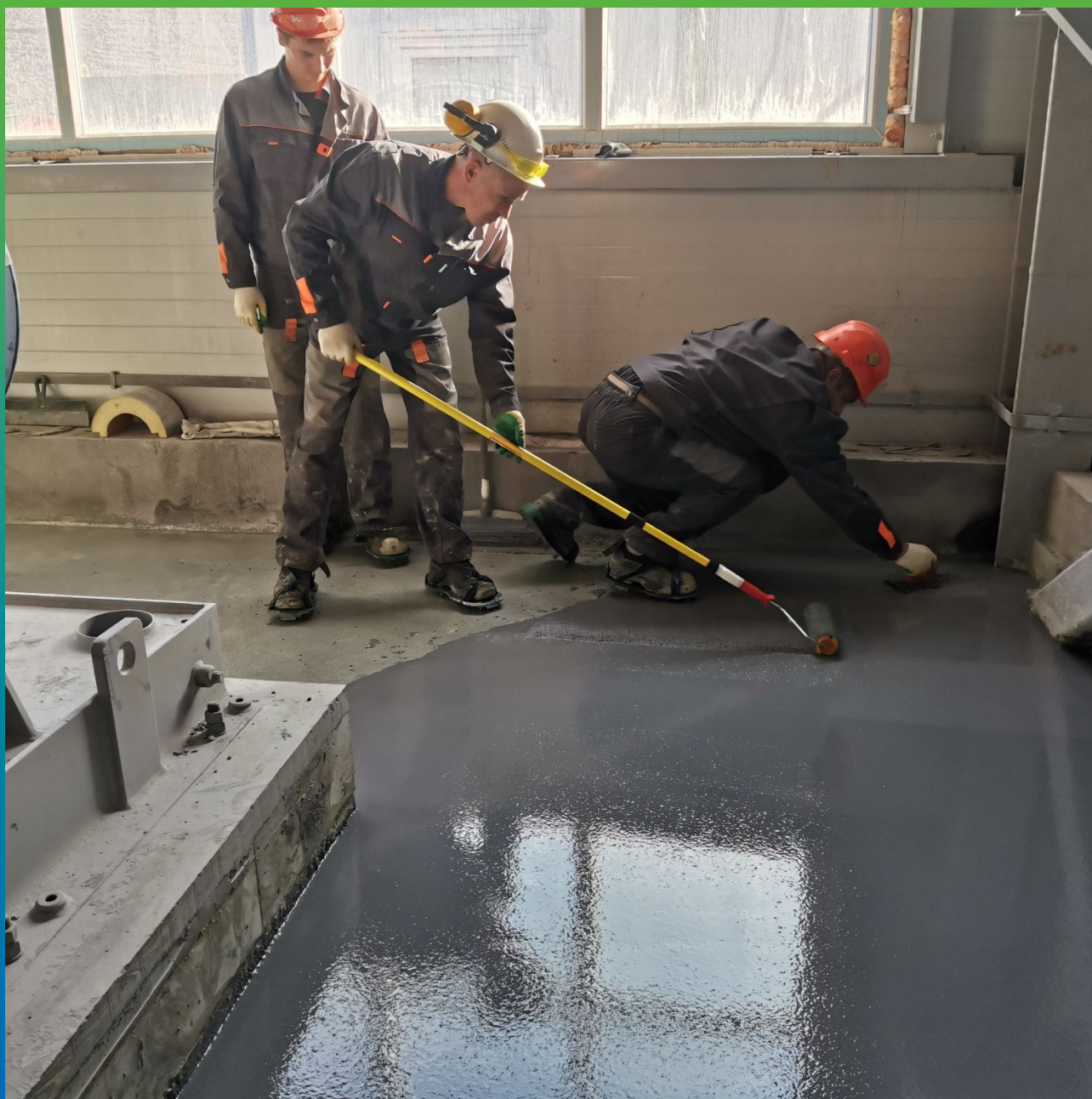
Прокатывание игольчатым валиком покрытия