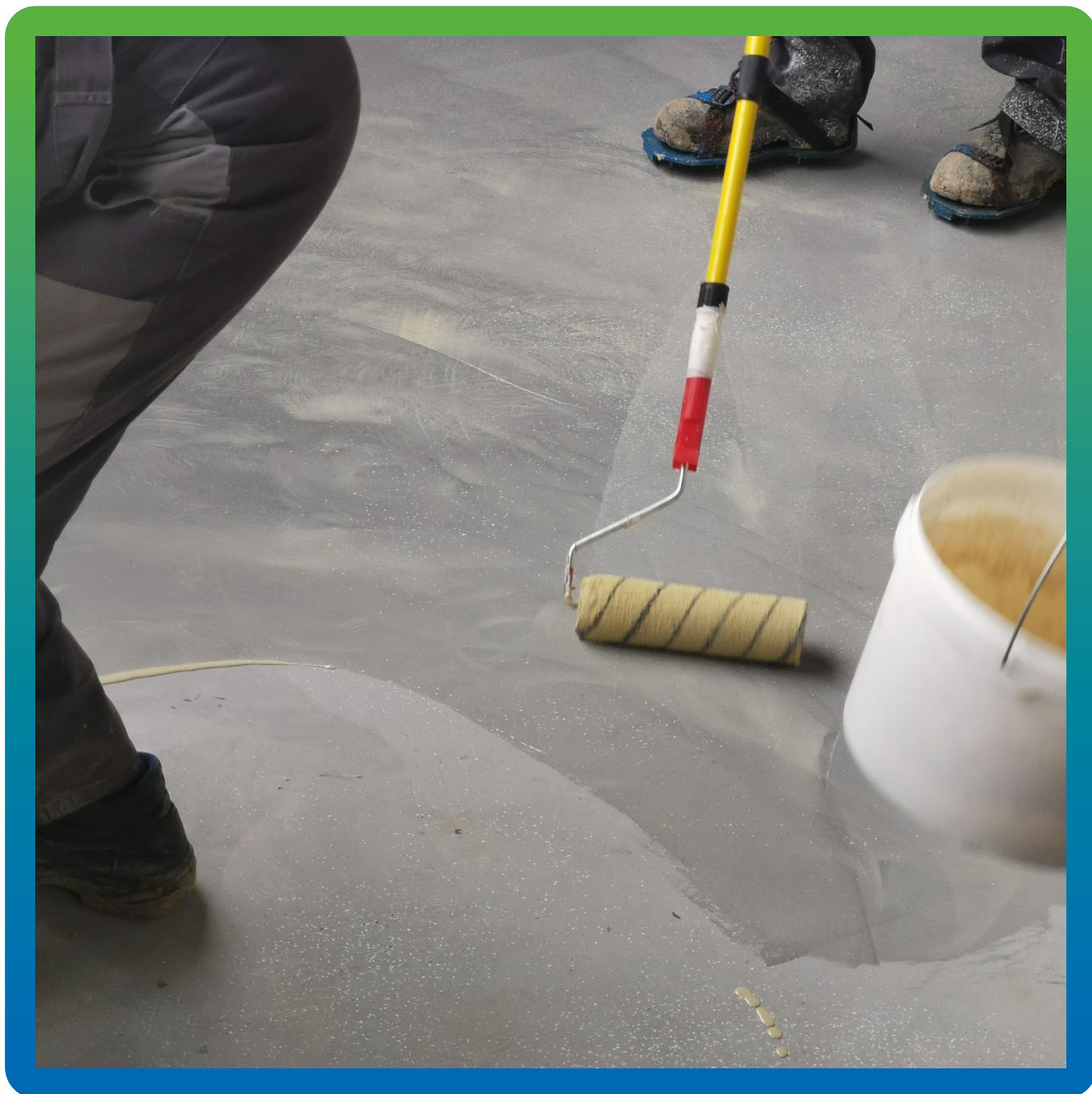
Грунтование поверхности по всей площади участка