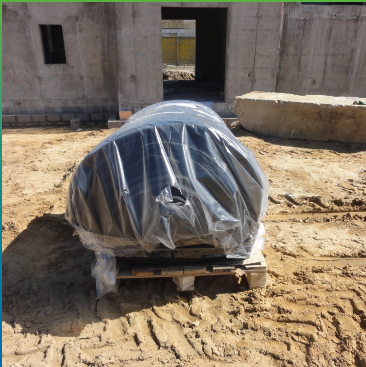
Готовое полотно на объекте Эластосил Т 1,2 мм