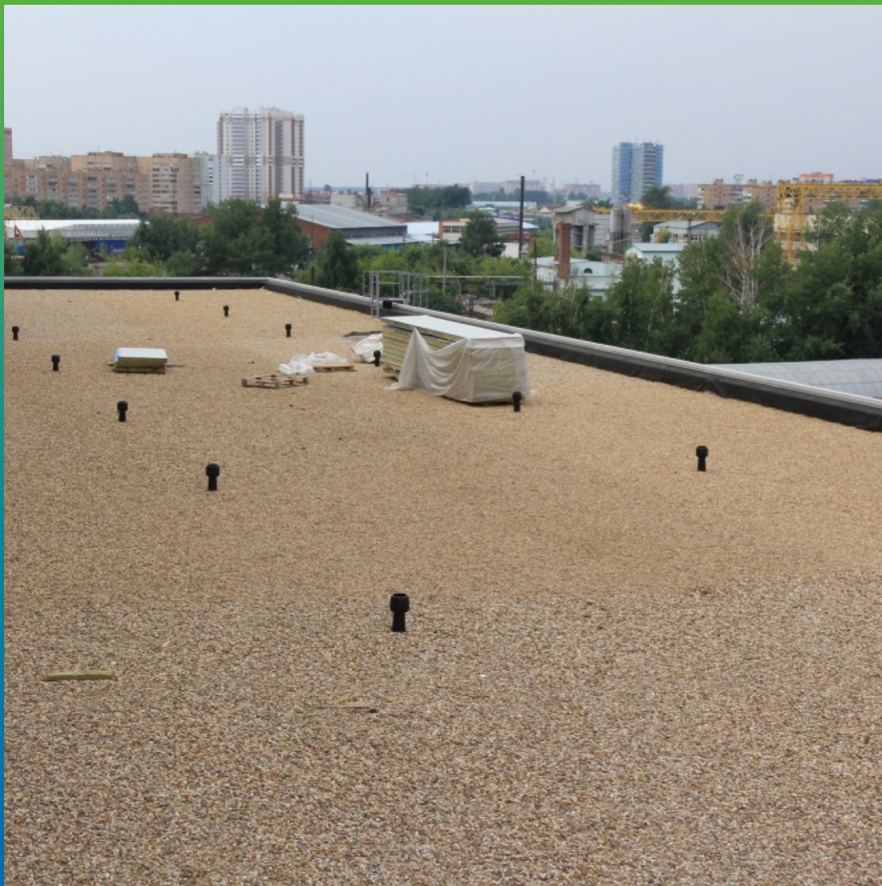
Вид готовой кровли