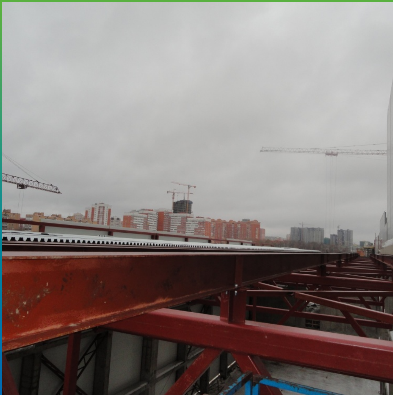
Монтаж сэндвич панелей