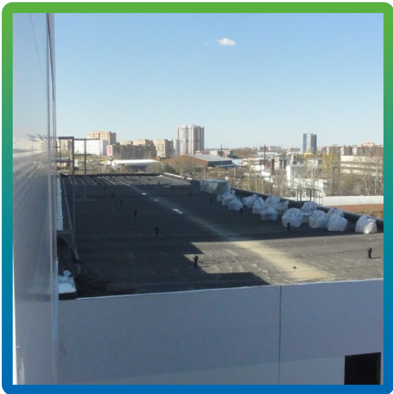
Гидроизоляционный ковер, Эластосил Т 1,2 мм