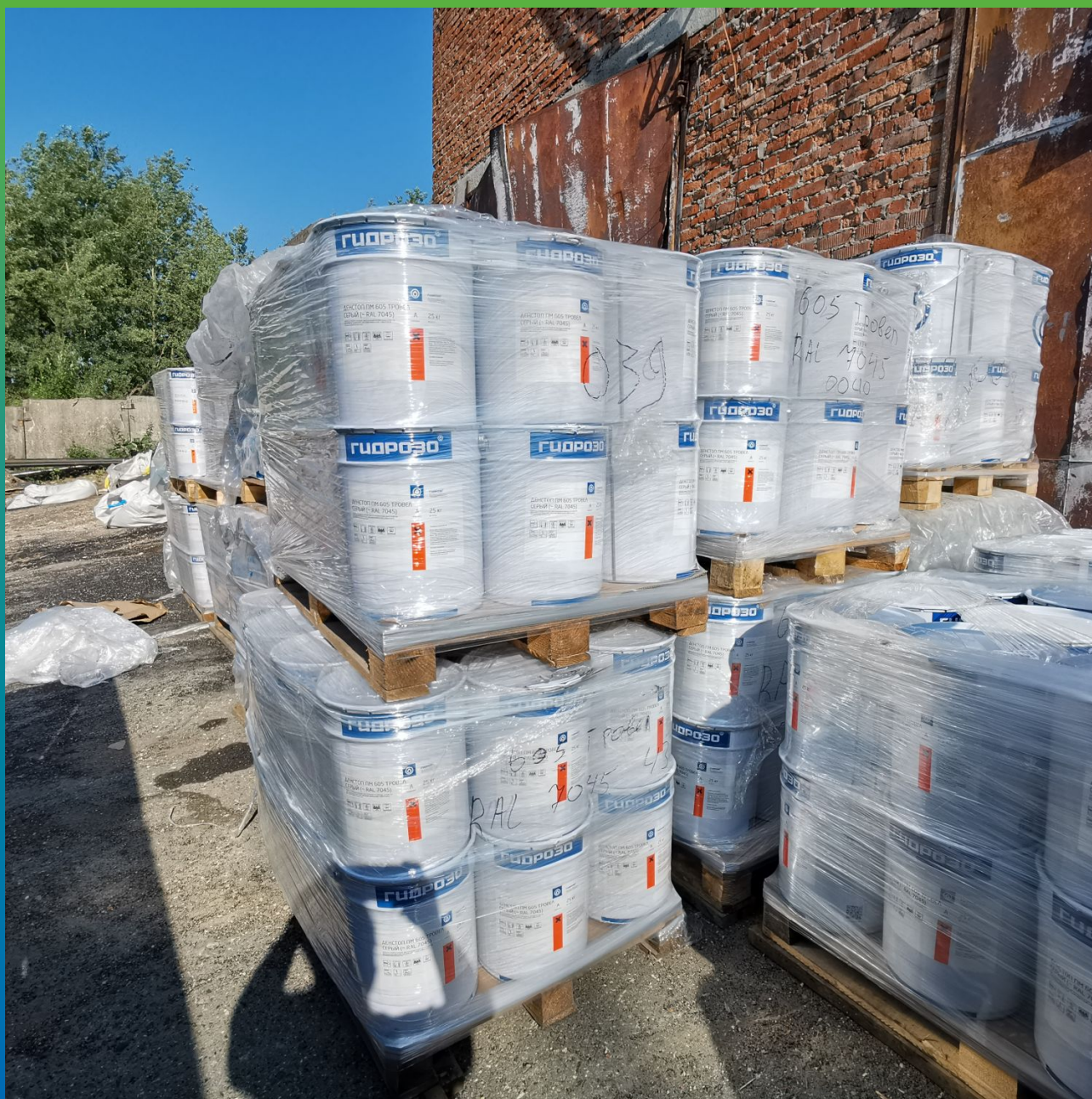
Материалы производства "Гидрозо" на объекте