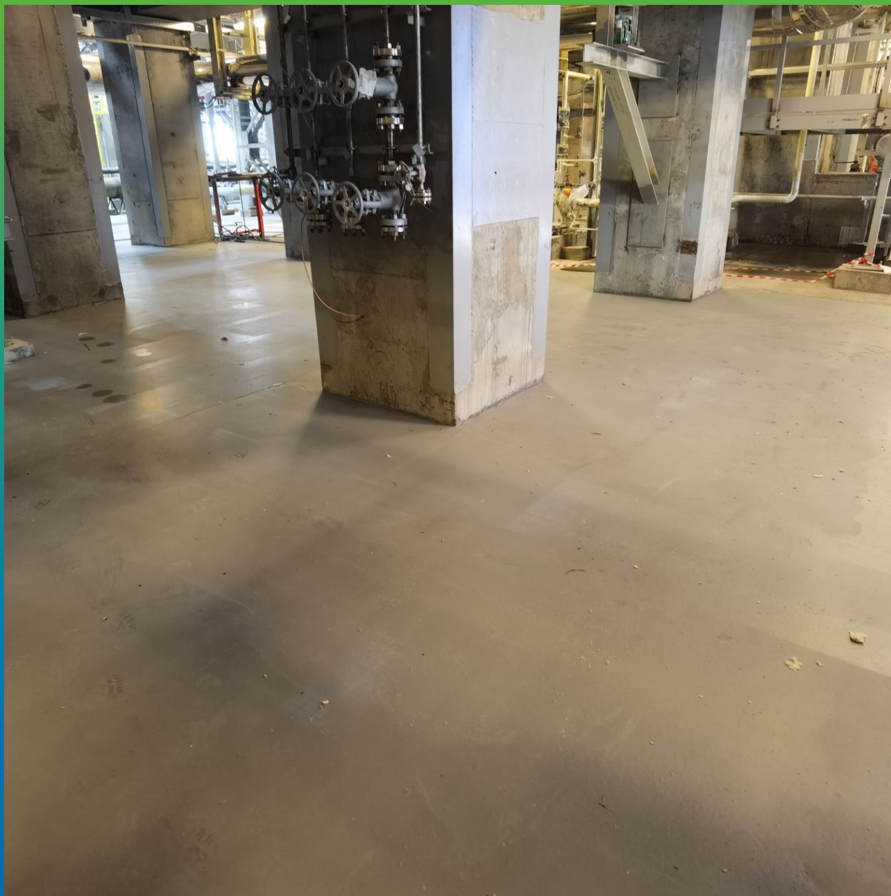
Вид покрытия после сдачи объекта