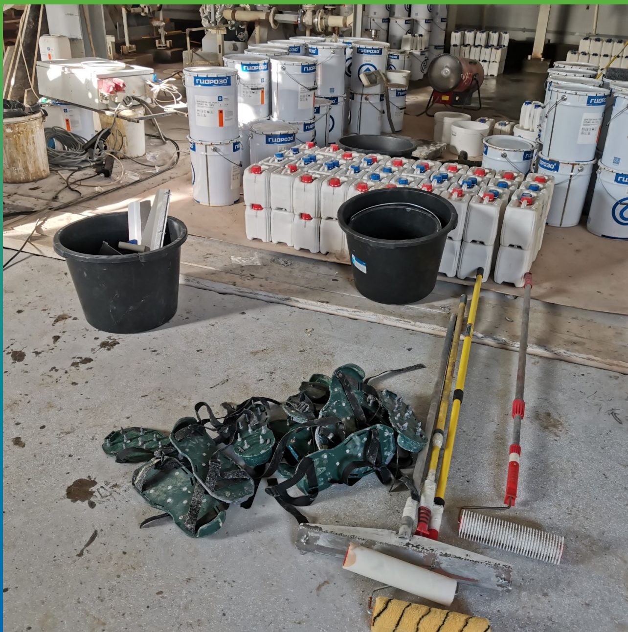
Подготовка поверхности перед укладкой покрытия