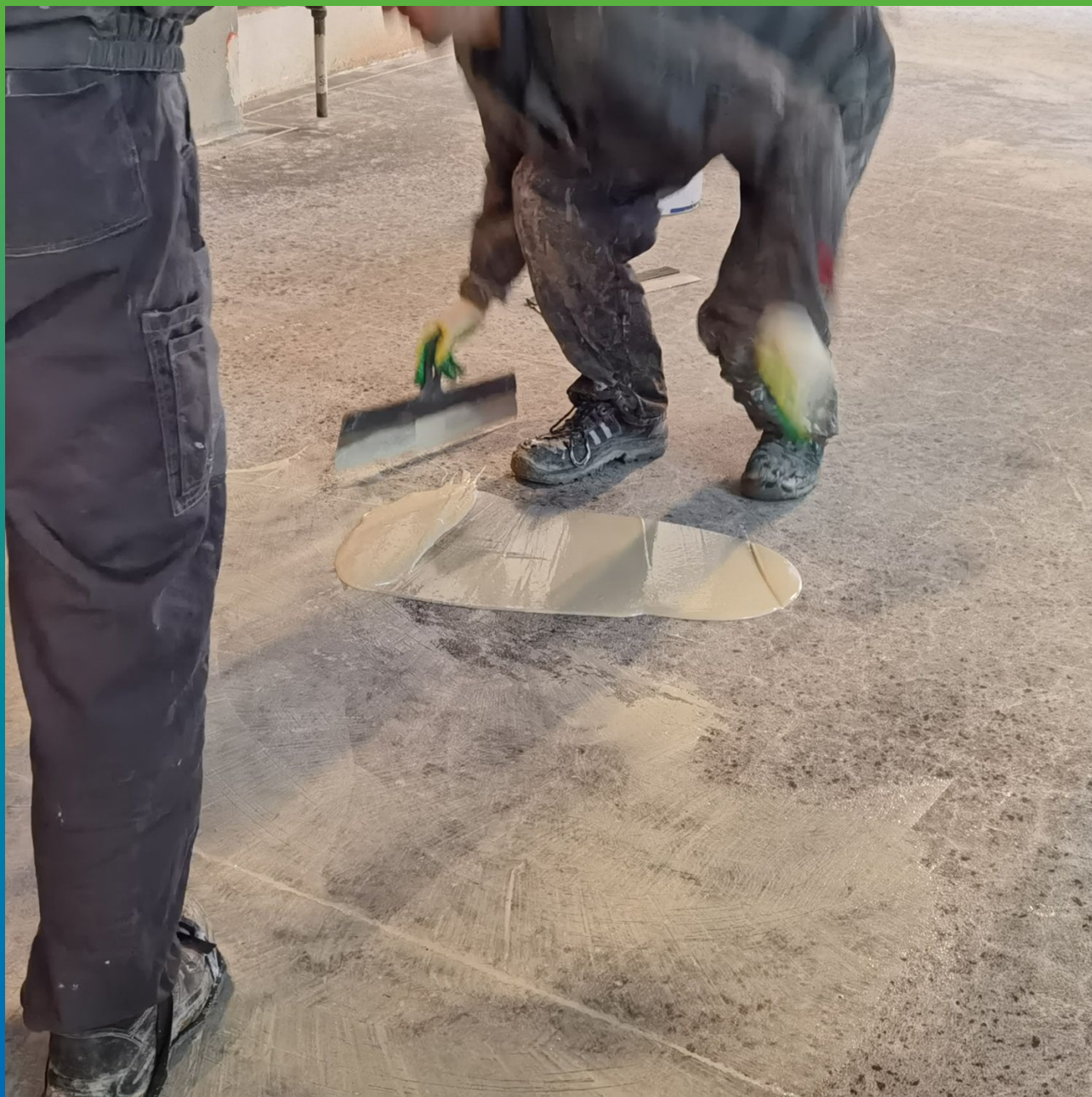
Грунтование поверхности ДенсТоп ПМ 600