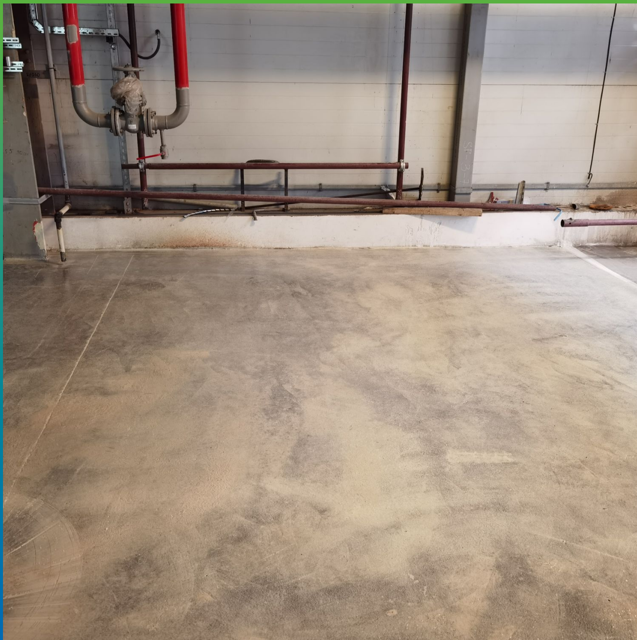
Вид загрунтованной поверхности составом ДенсТоп ПМ 600