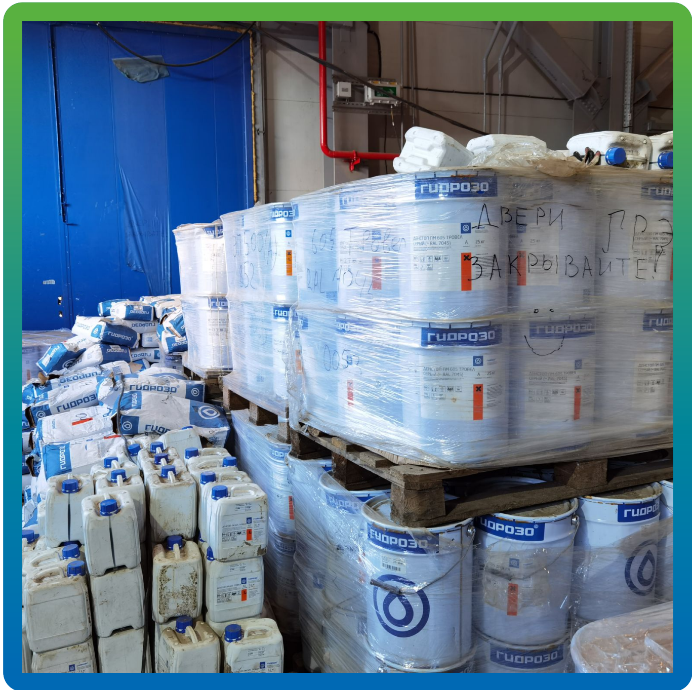
Сортировка по компонентам на площадке перед укладкой покрытия