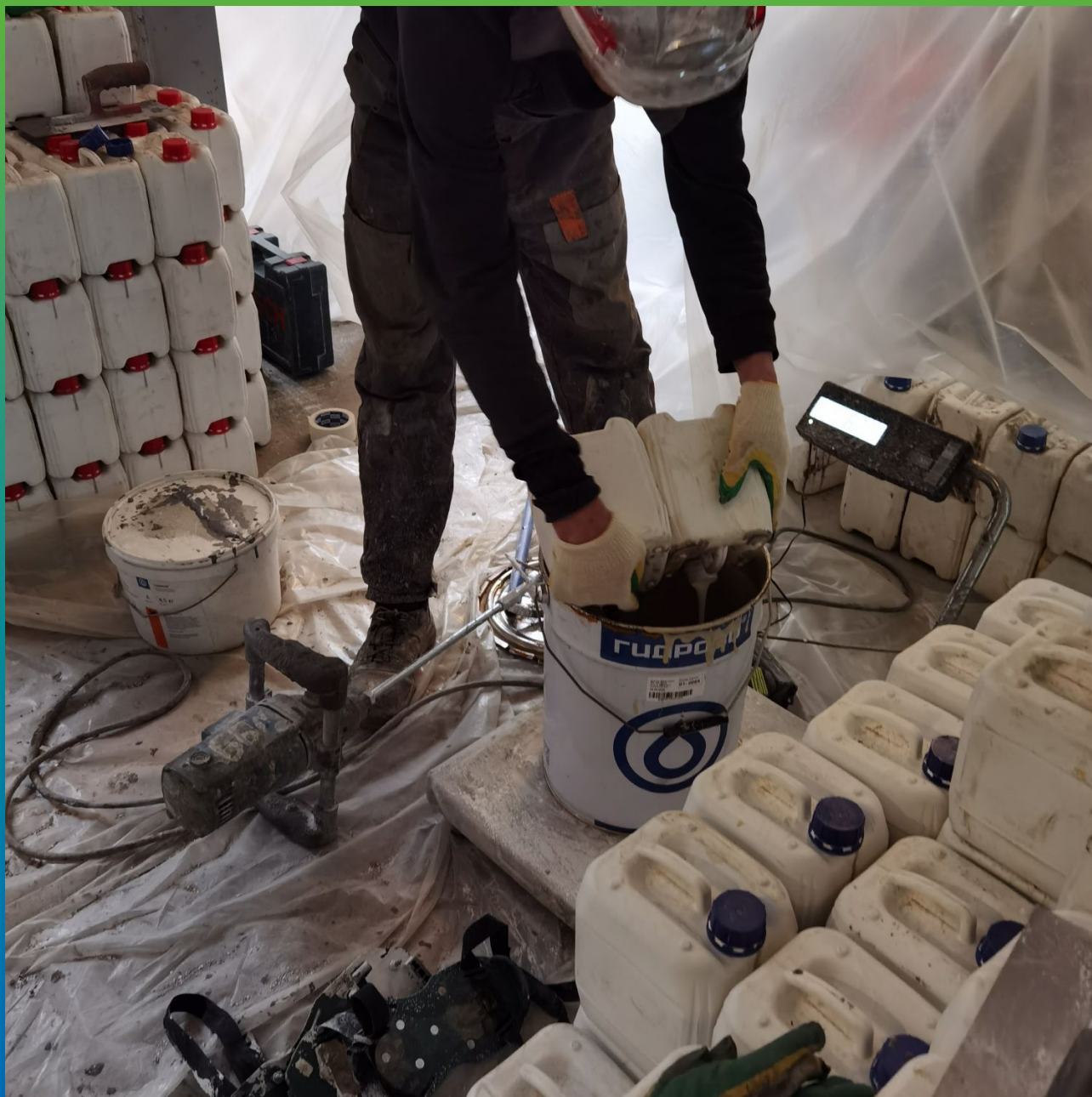
Приготовление к нанесению грунтовочного состава ДенТоп ПМ 600