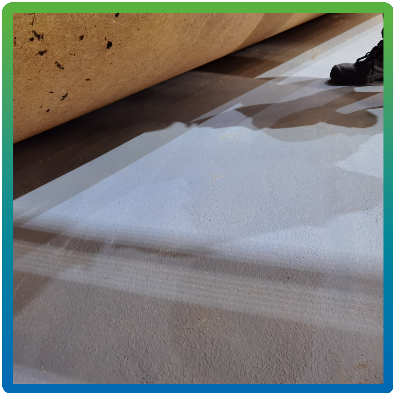
Вид покрытия спустя сутки