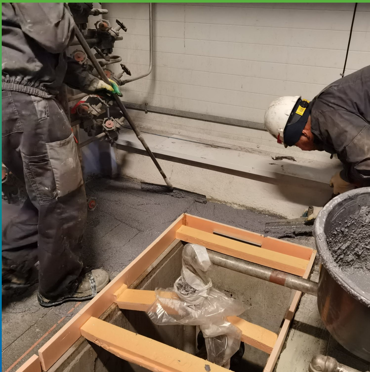
Распределение состава ДенТоп ПМ 605 Тровел на толщину 10 мм