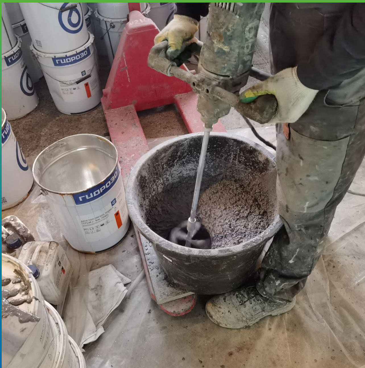
Приготовление цемент-полиуретанового ЗК состава ДенсТоп ПМ 605 Трвел