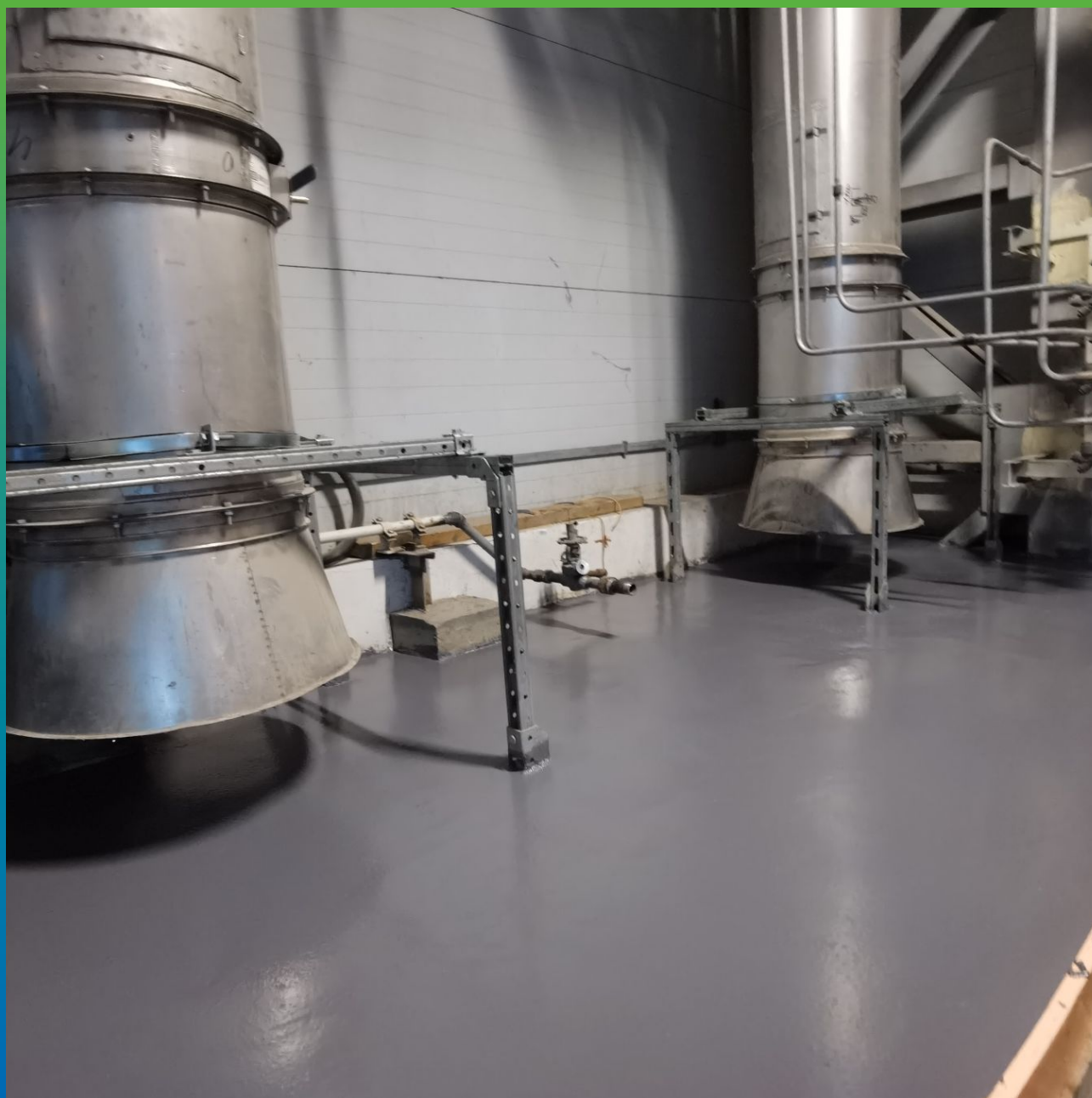
Вид покрытия после проведения работ