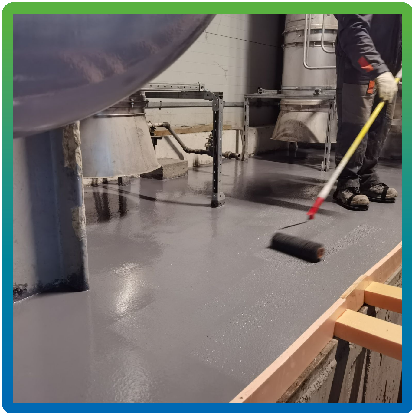
Прокатывание валиком уложенного покрытия