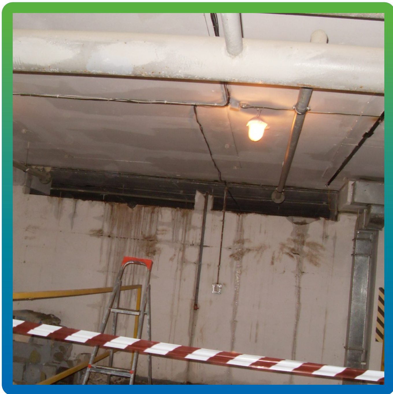
Демонтаж стеновых блоков для доступа к шву