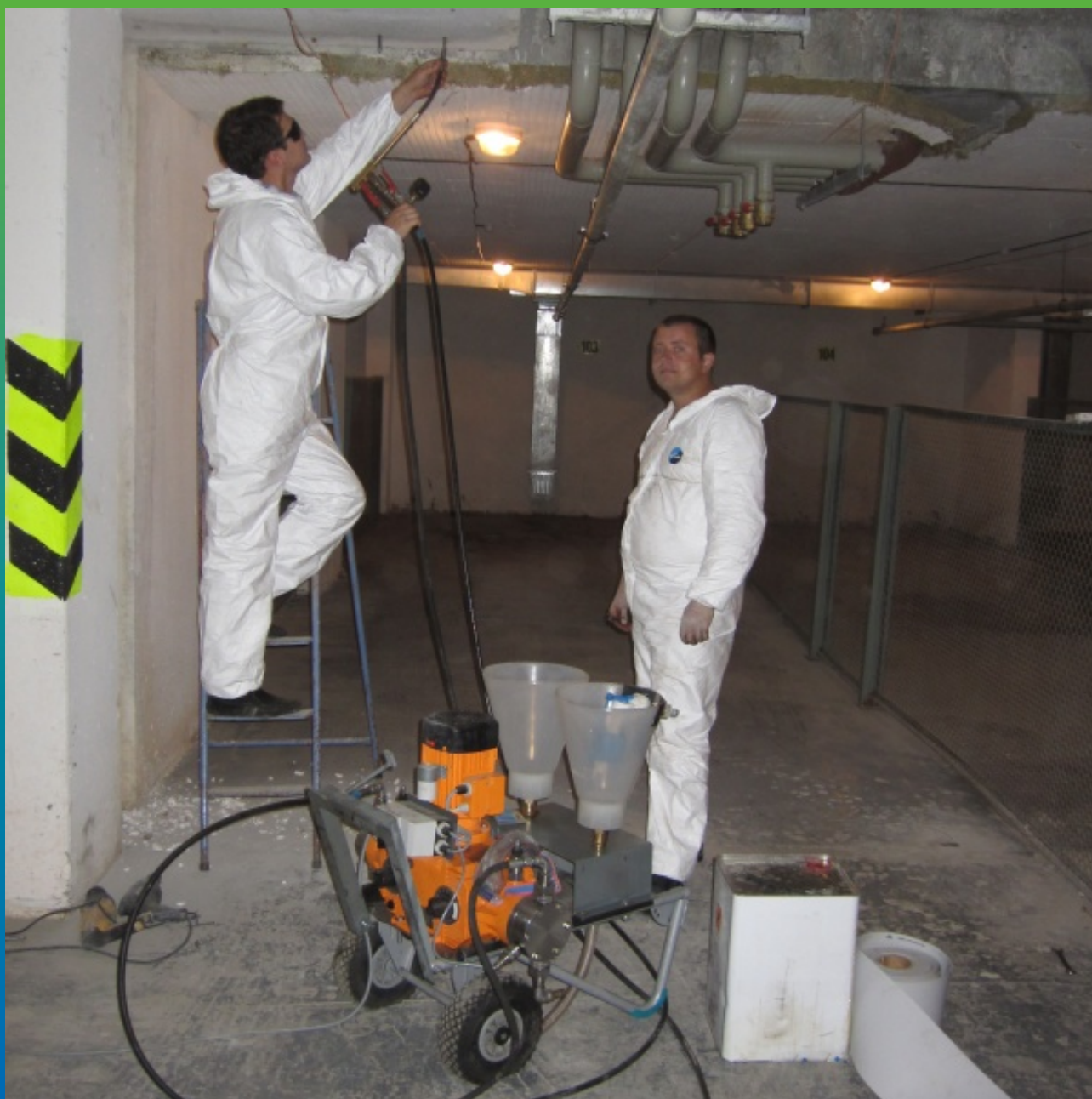
Производство работ по инъектированию Манопур Гель в деформационный шов шириной раскрытия более 50 мм