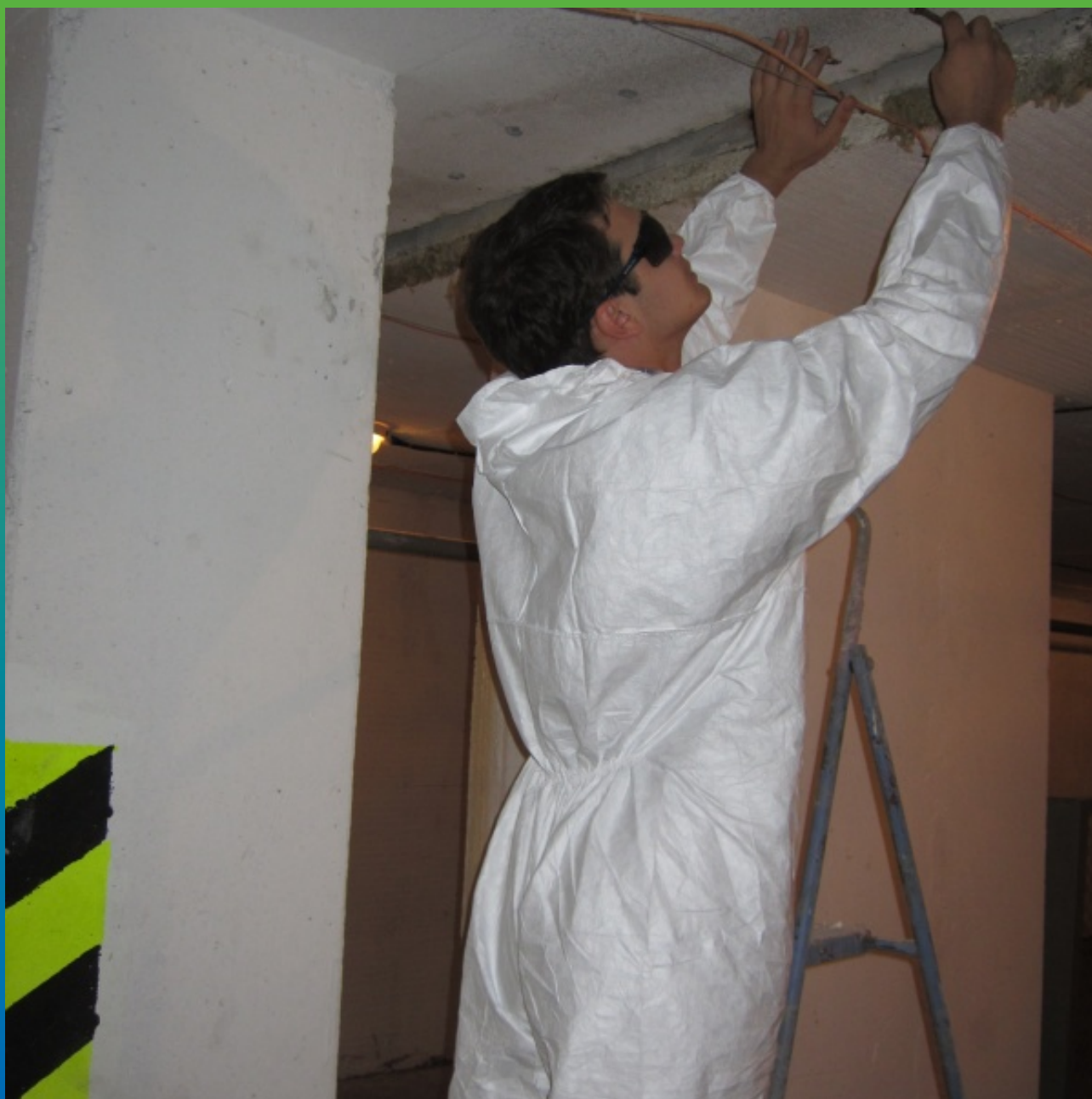
Монтаж инъекционных пакеров