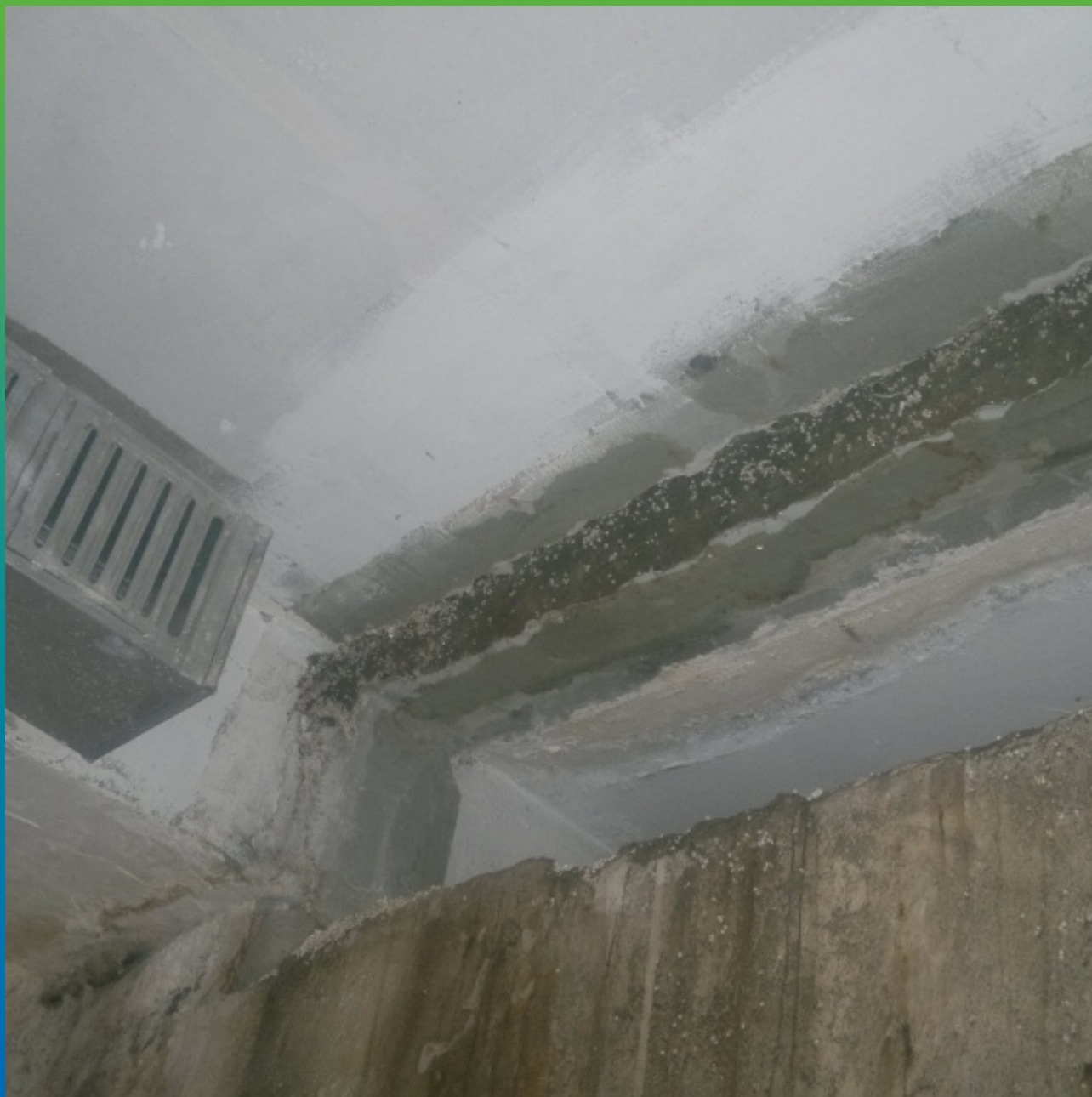
Чеканка шва перед установкой инъекционных пакеров