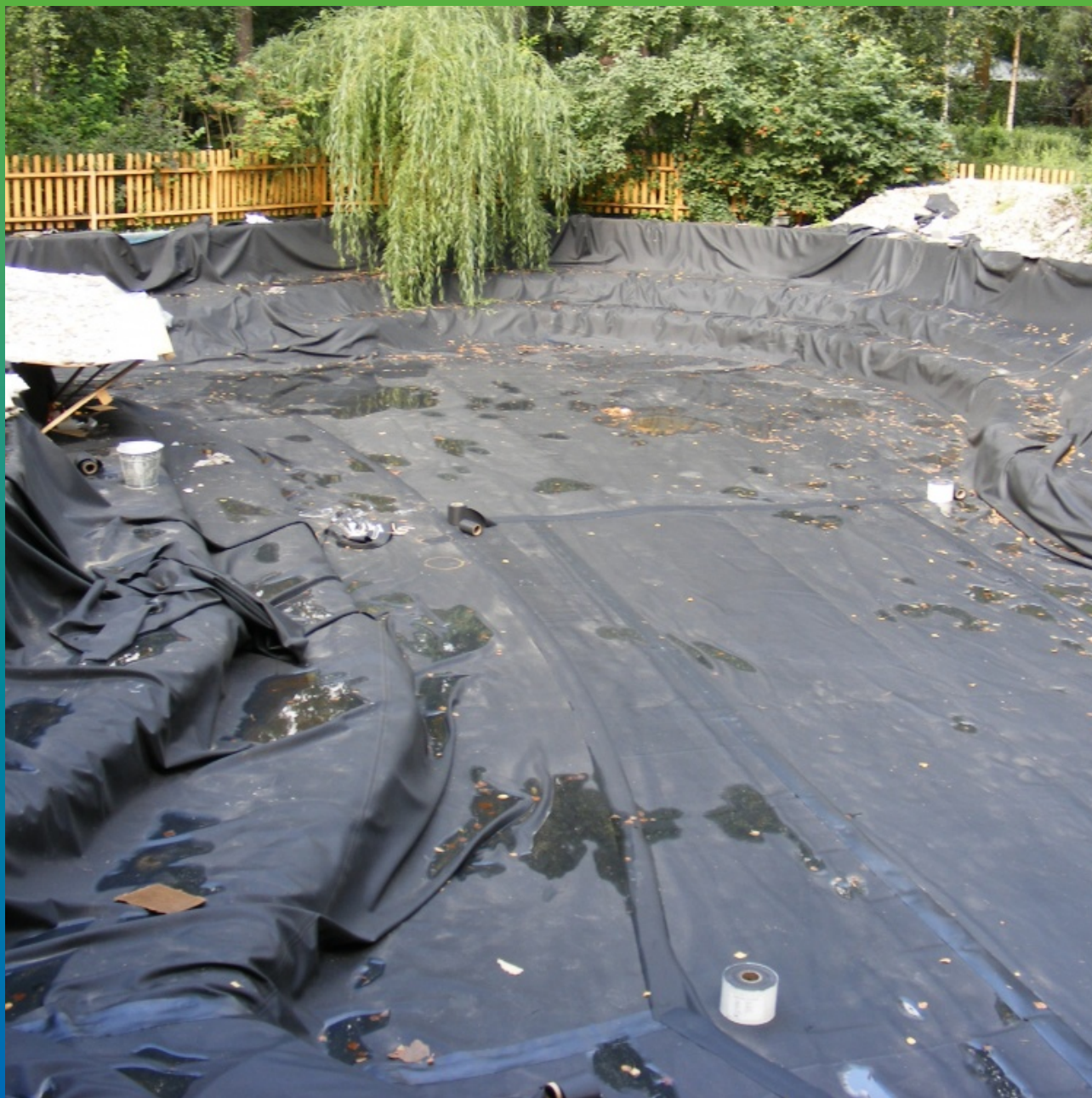
Мембрана после укладки