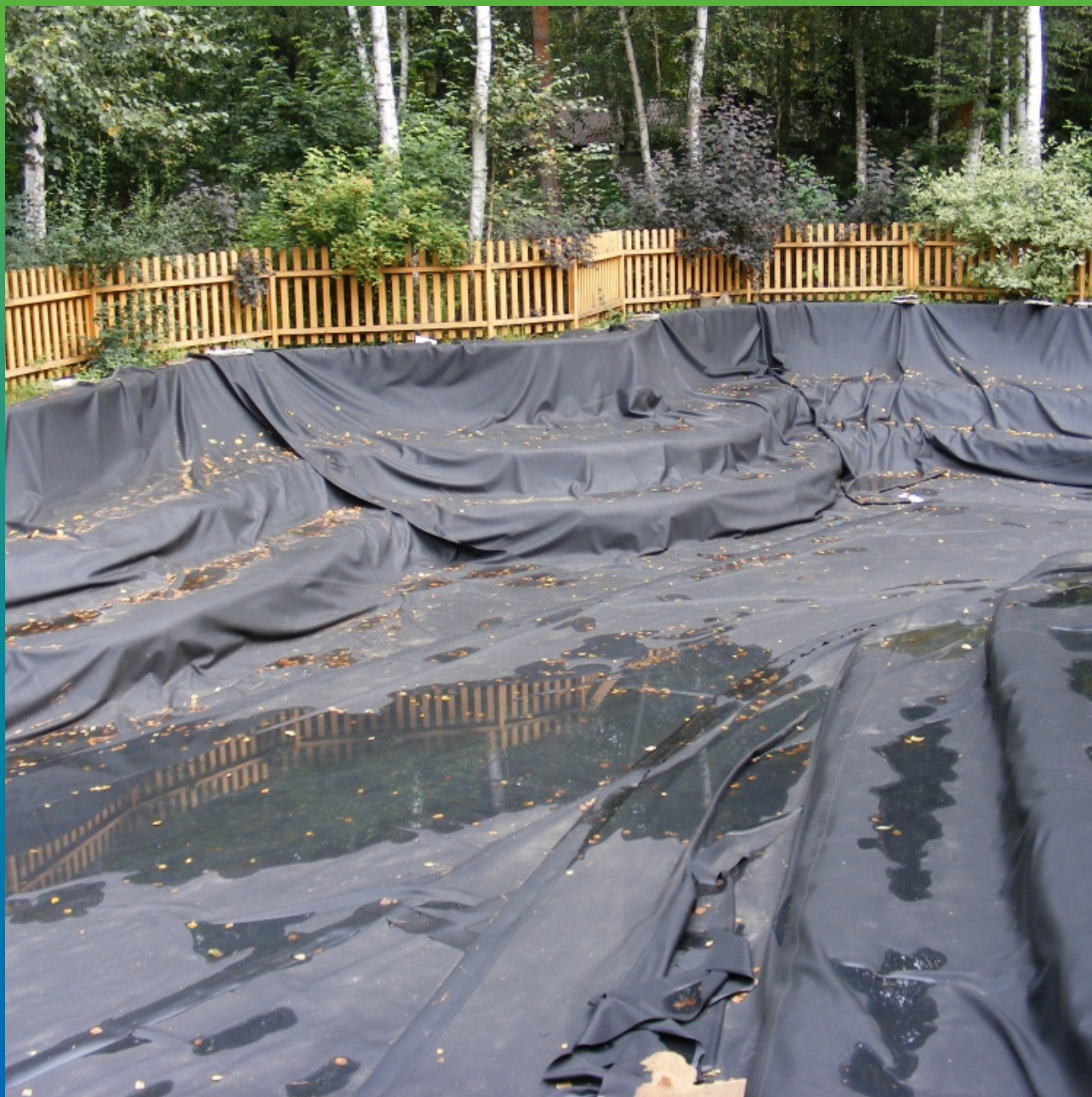
Мембрана после укладки