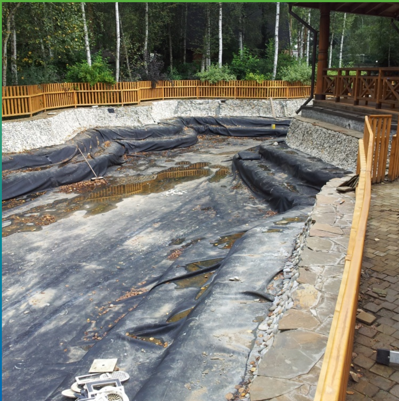
Конечный вид объекта, после декорирования береговой зоны