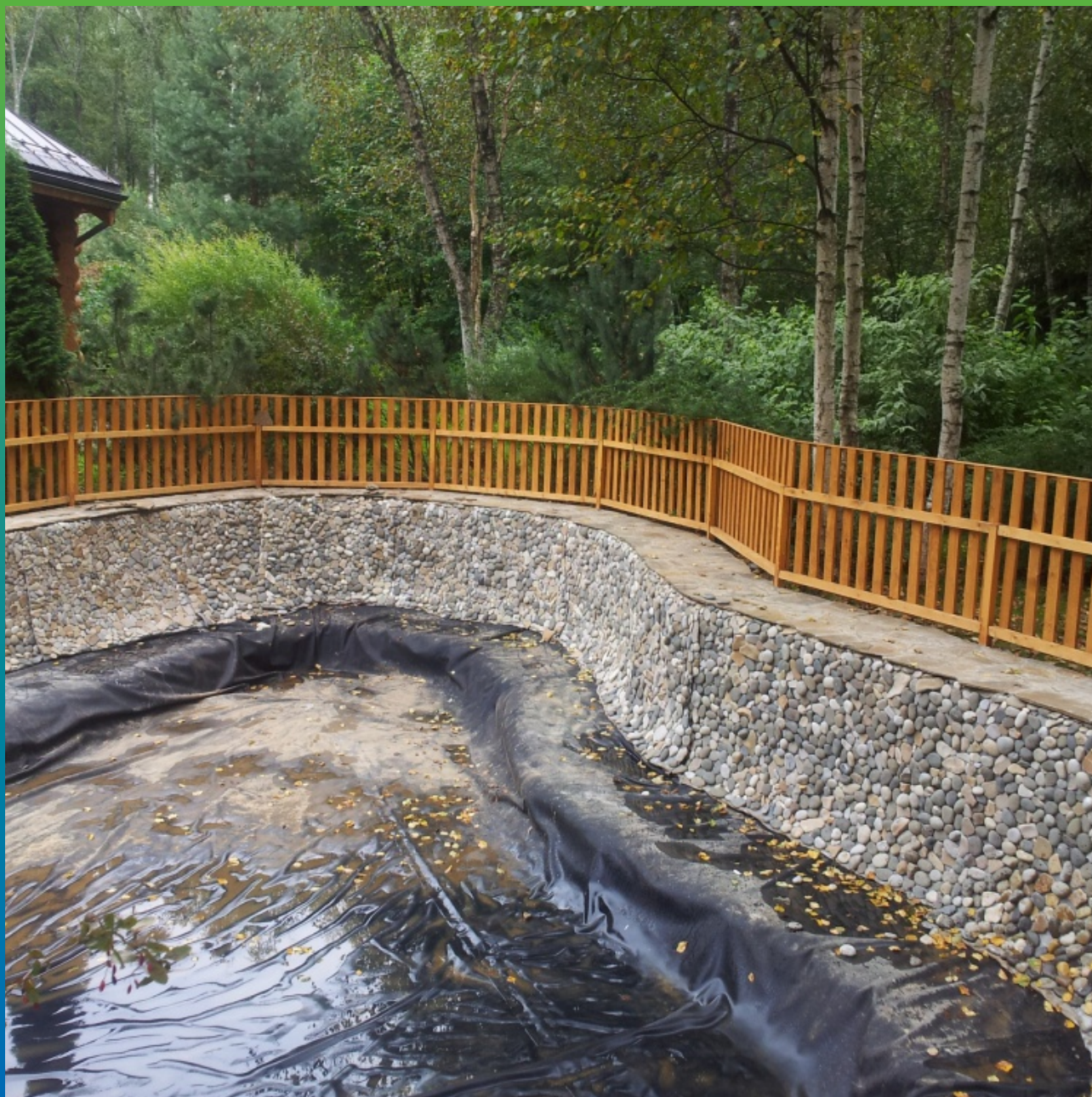
Конечный вид объекта, после декорирования береговой зоны