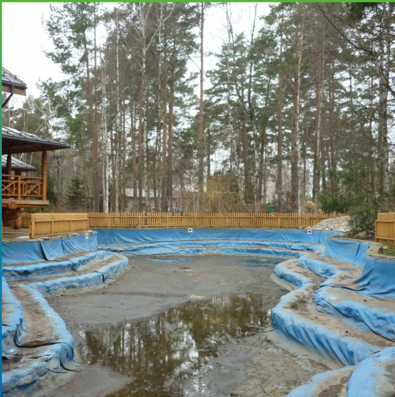
Общий вид объекта до укладки мембраны