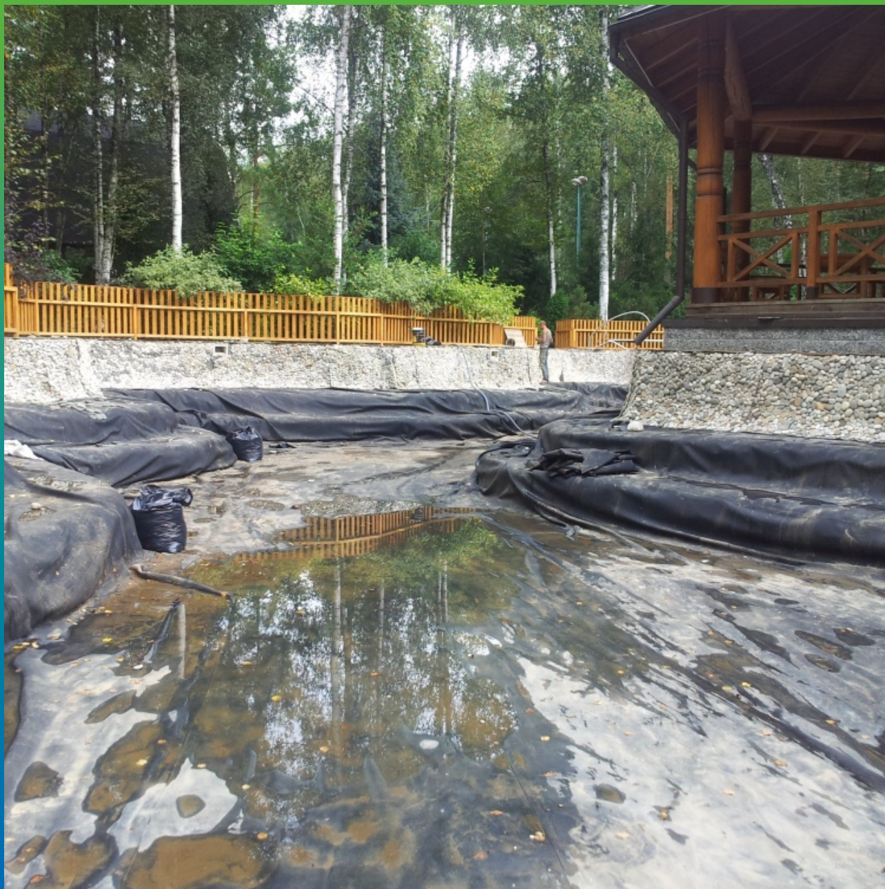
Конечный вид объекта, после декорирования береговой зоны