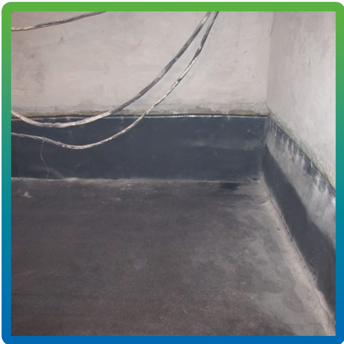
Монтаж мембраны на вертикальную часть с применением перфоленты