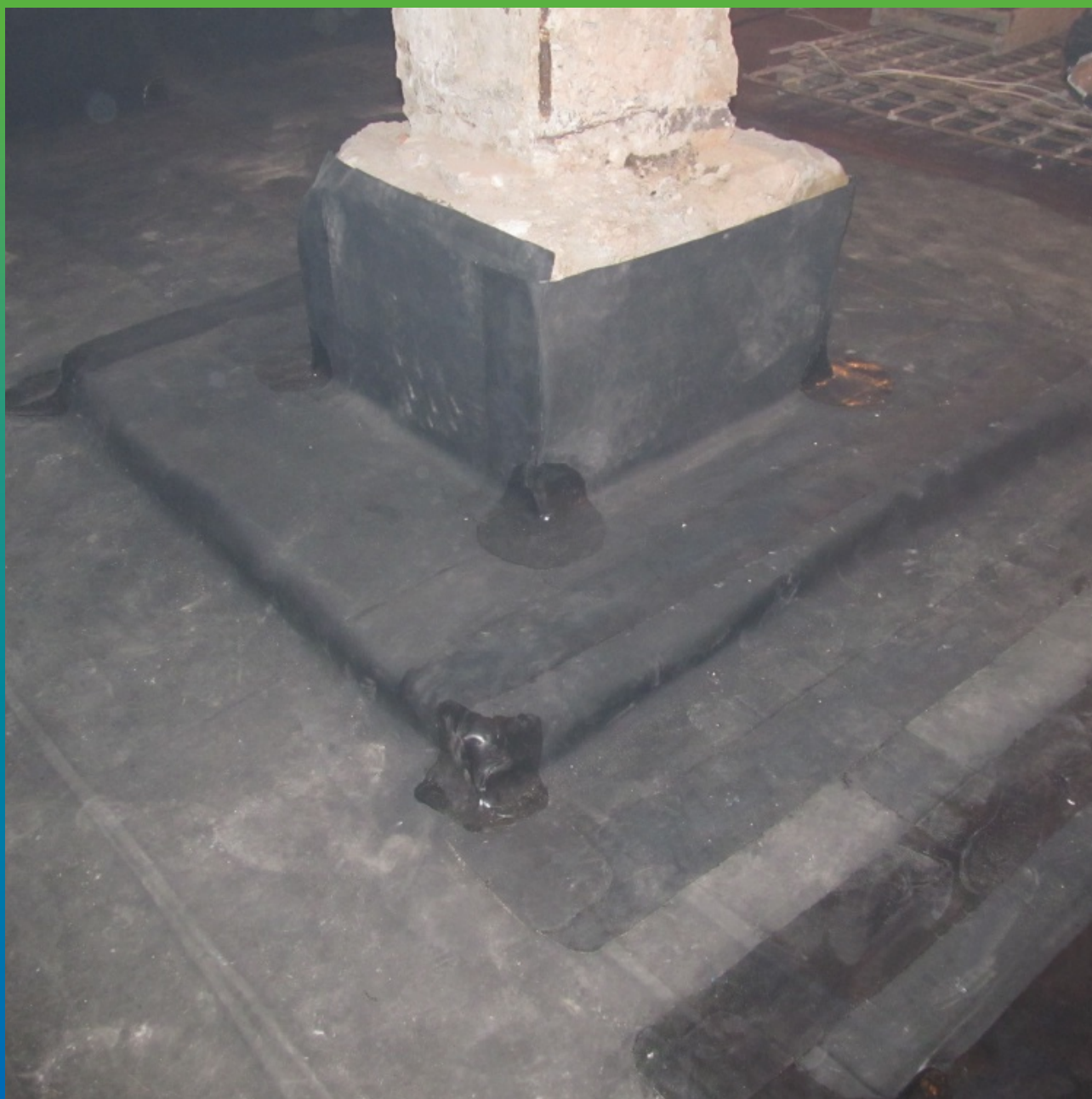
Итоговый вид после проведения работ по гидроизоляции