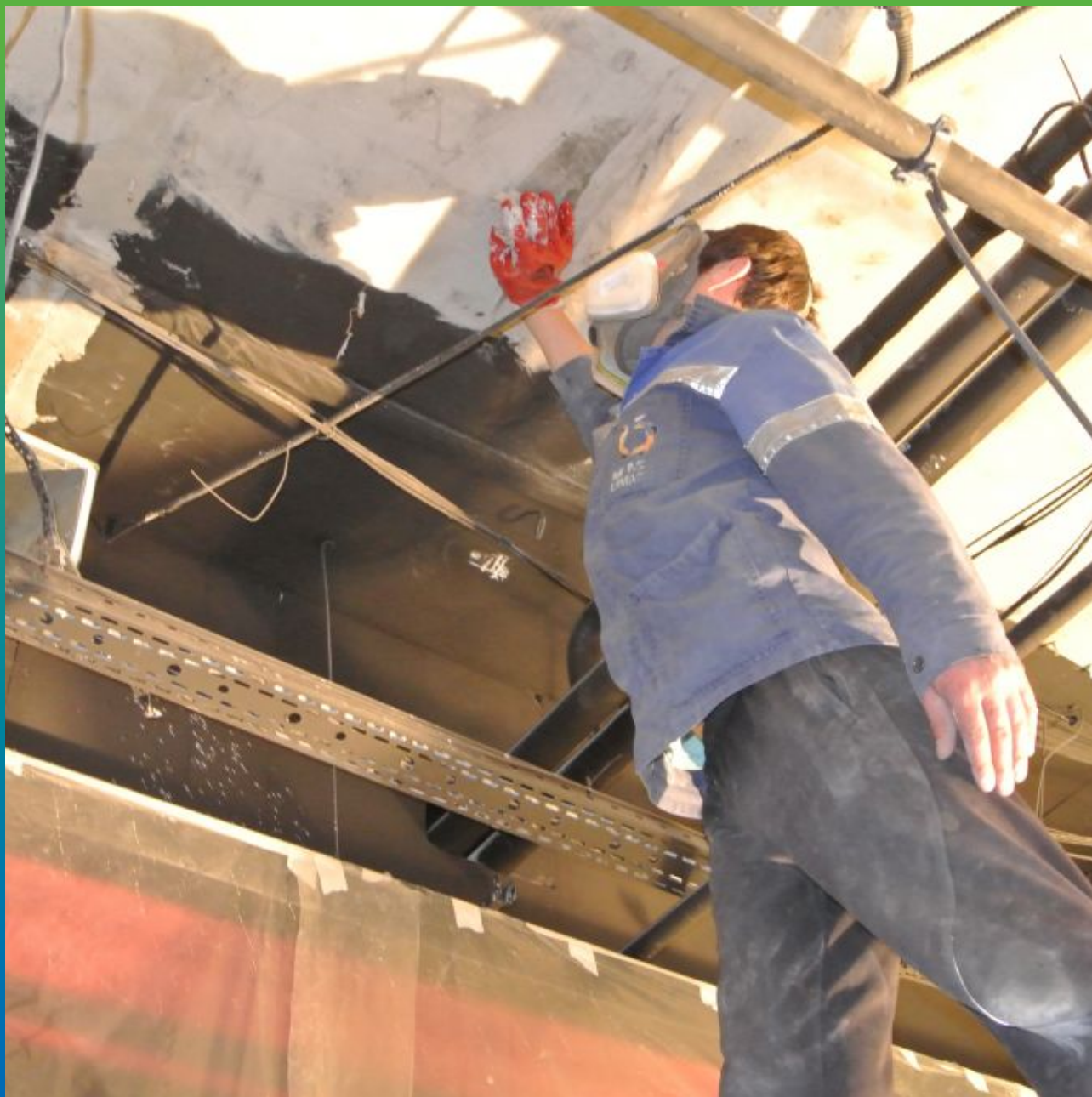
Обезжиривание и обеспыливание поверхности