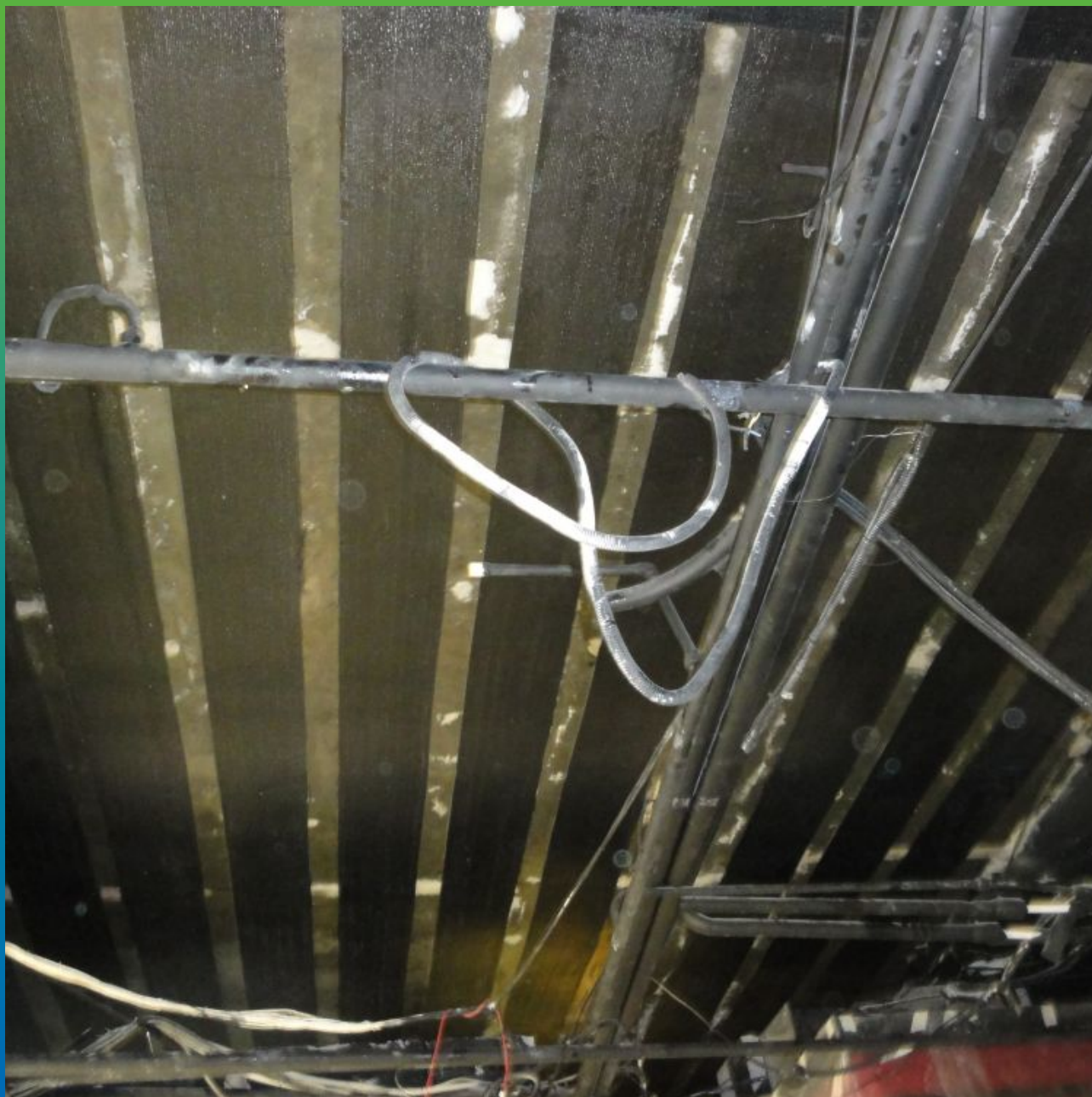
Финальный вид объекта