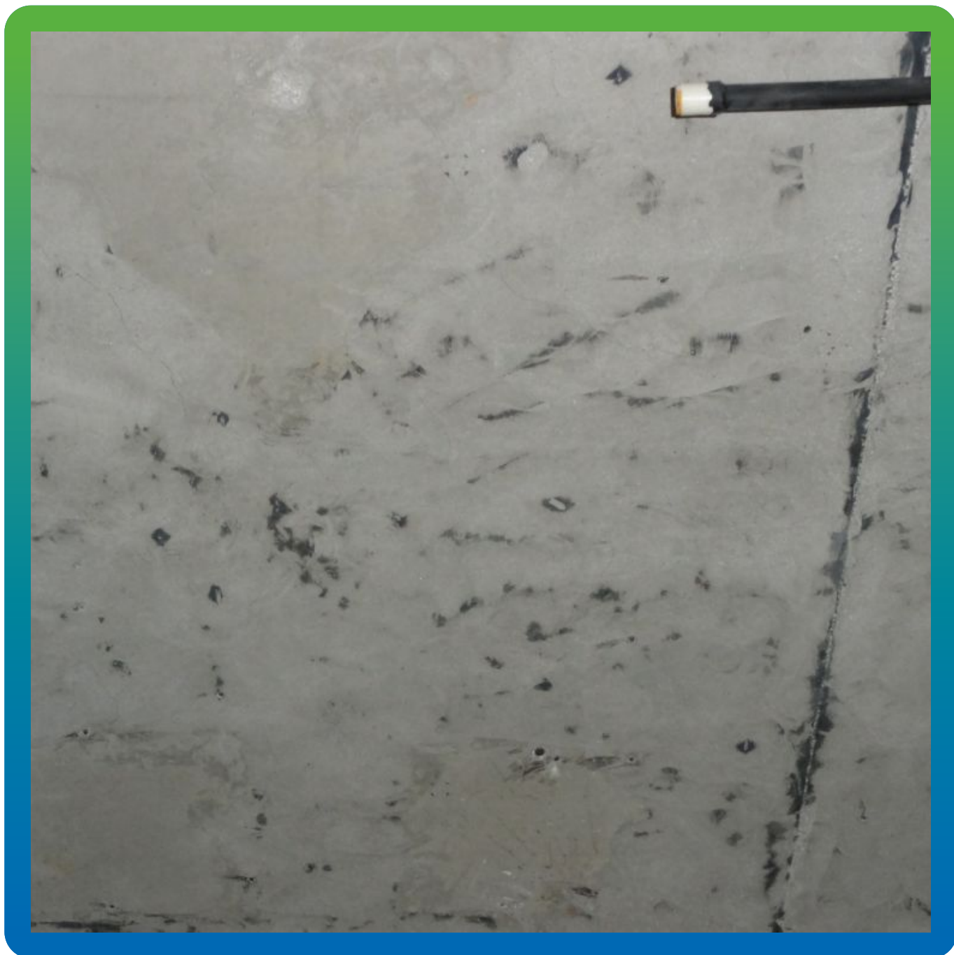
Вид подготовленной поверхности