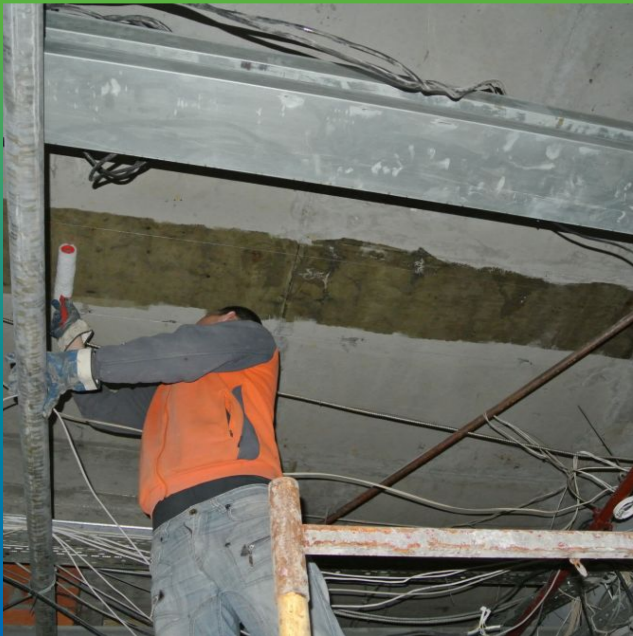
Грунтовка поверхности с помощью Тайфо С