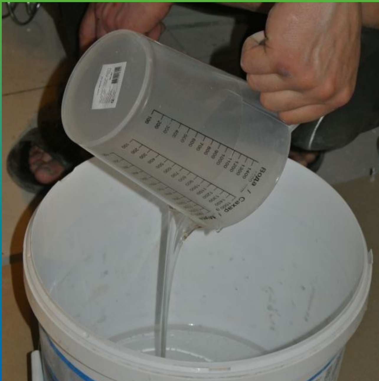
Затворение Тайфо С