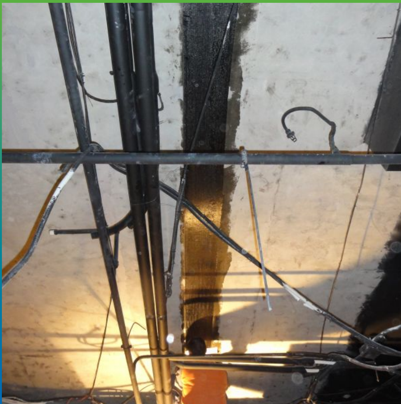
Монтаж холста Тайфо СЦХ-11АП-Н