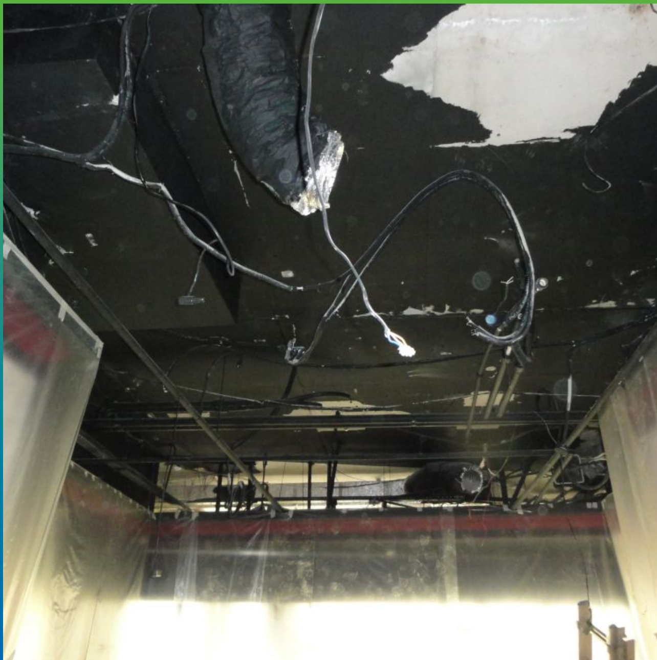
Вид до начала работ