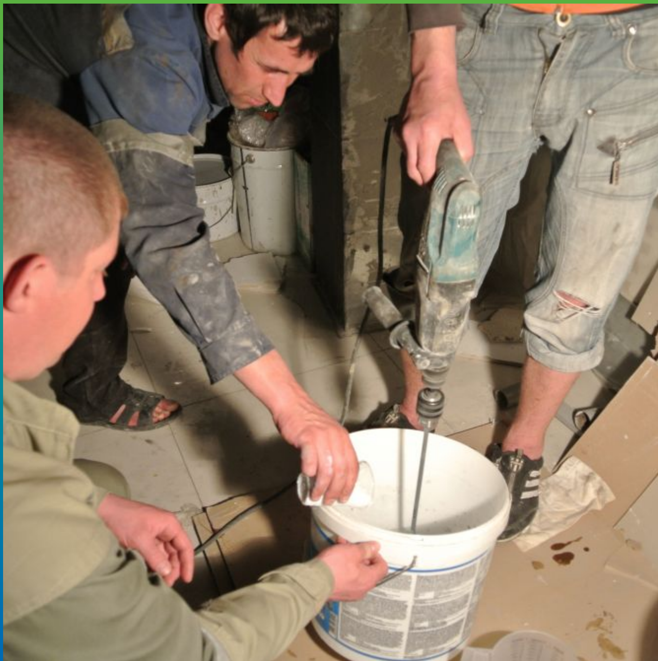
Загущение Тайфо С с помощью Тайфо Тикс для нанесения основного адгезионного слоя