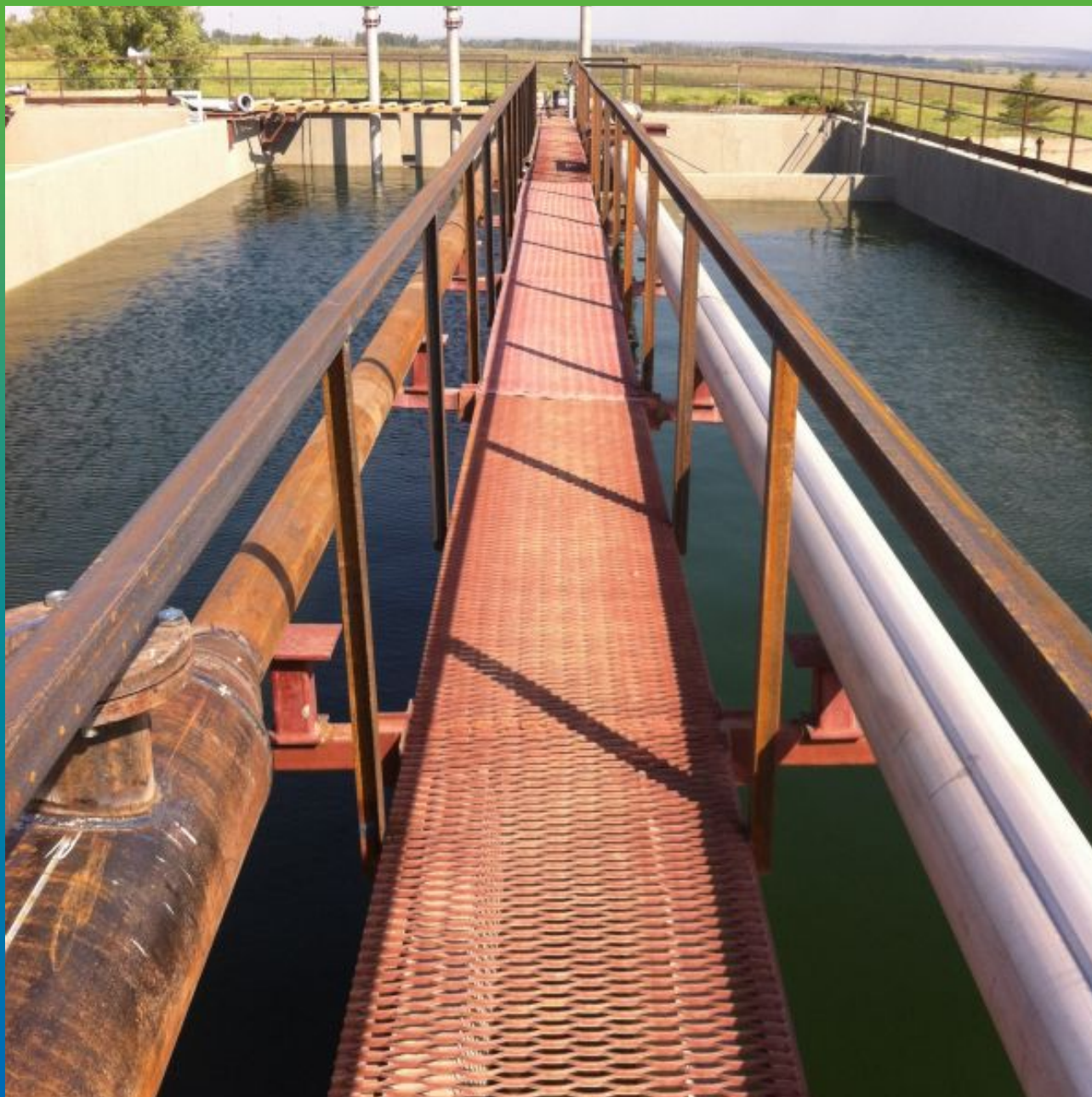
Наполненный водой аэротенк