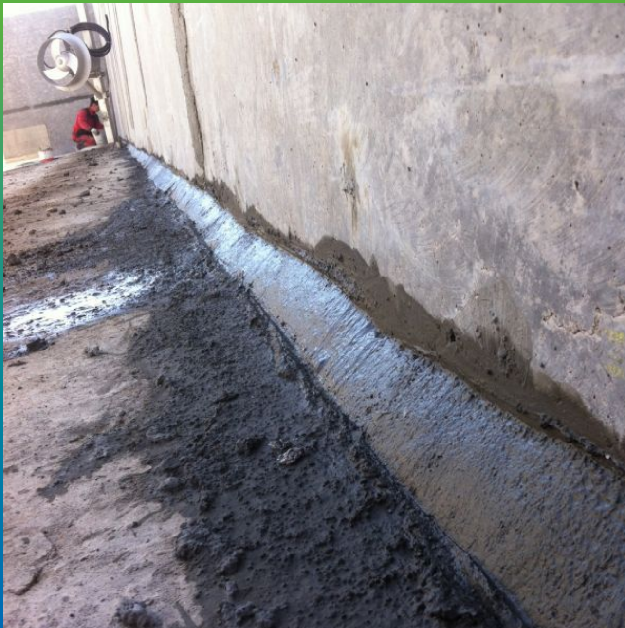
Зачеканка стыка "стена-пол"