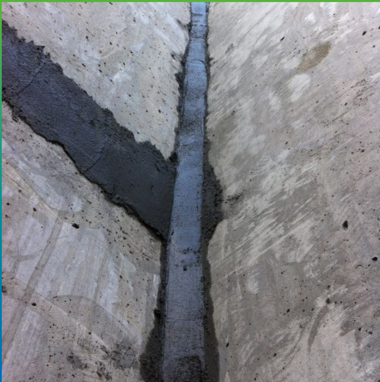
Устройство галтели по угловым стыкам