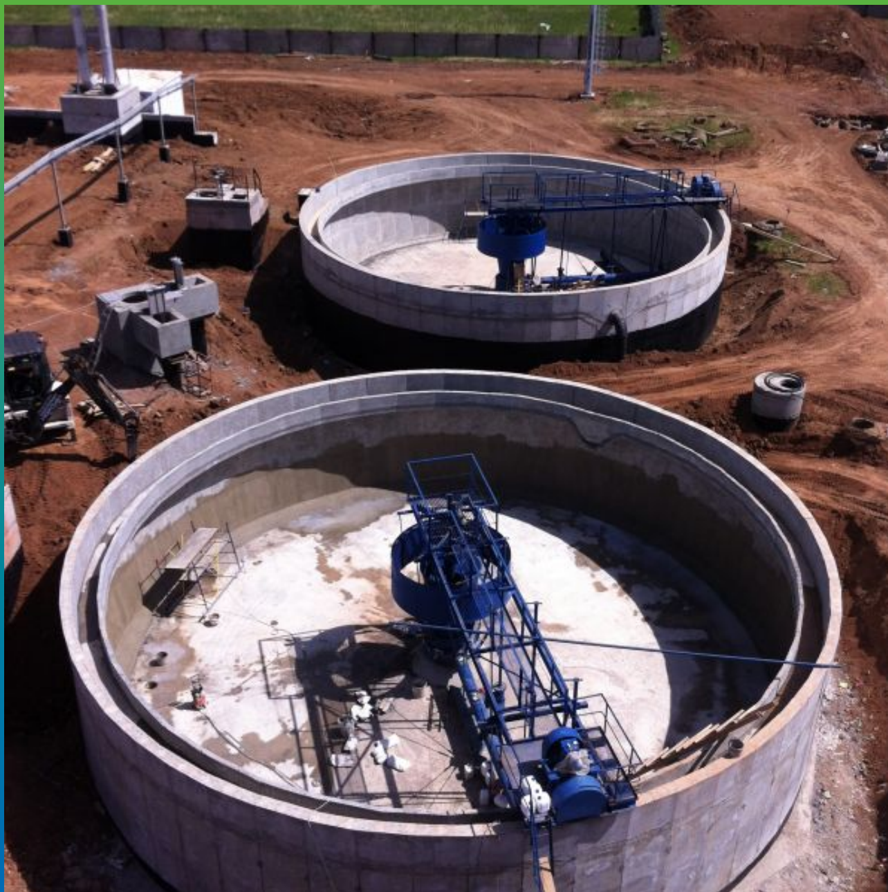
Общий вид вторичных отстойников