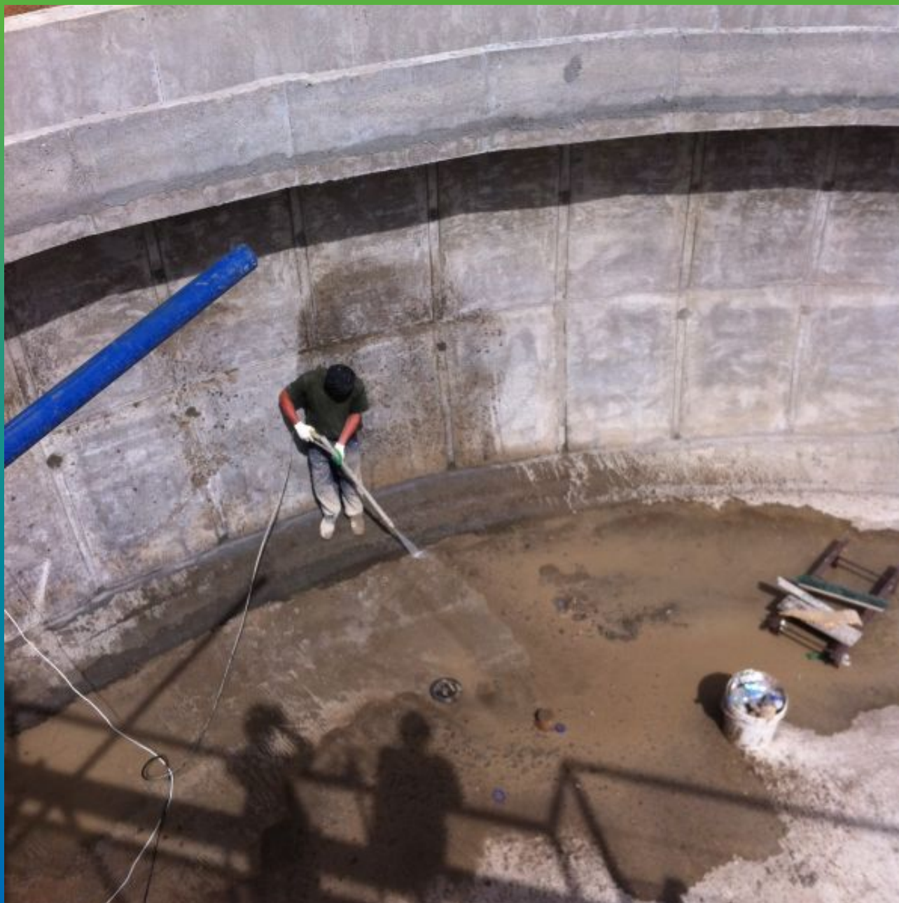
Очистка поверхности под давлением после шлифовки