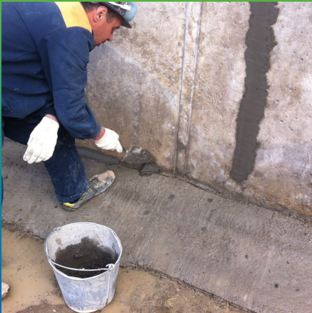
Зачеканка стыков ремонтным составом Маккрест