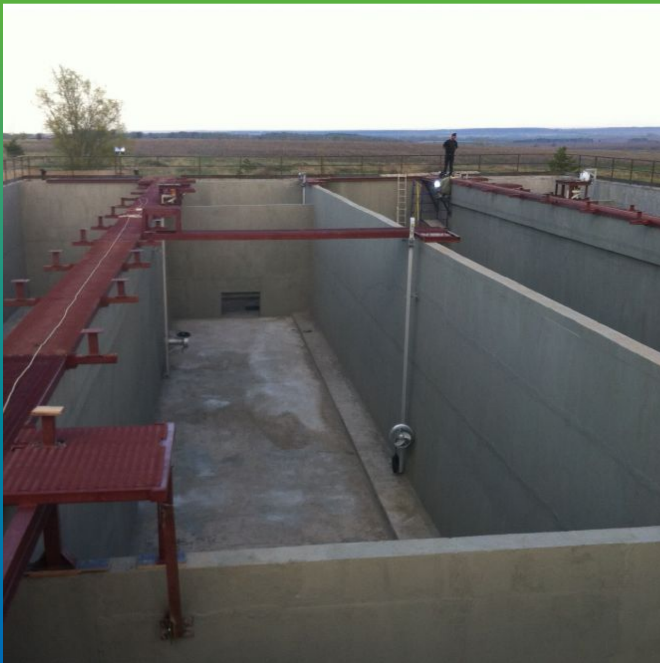
Отремонтированный и гидроизолированный аэротенк