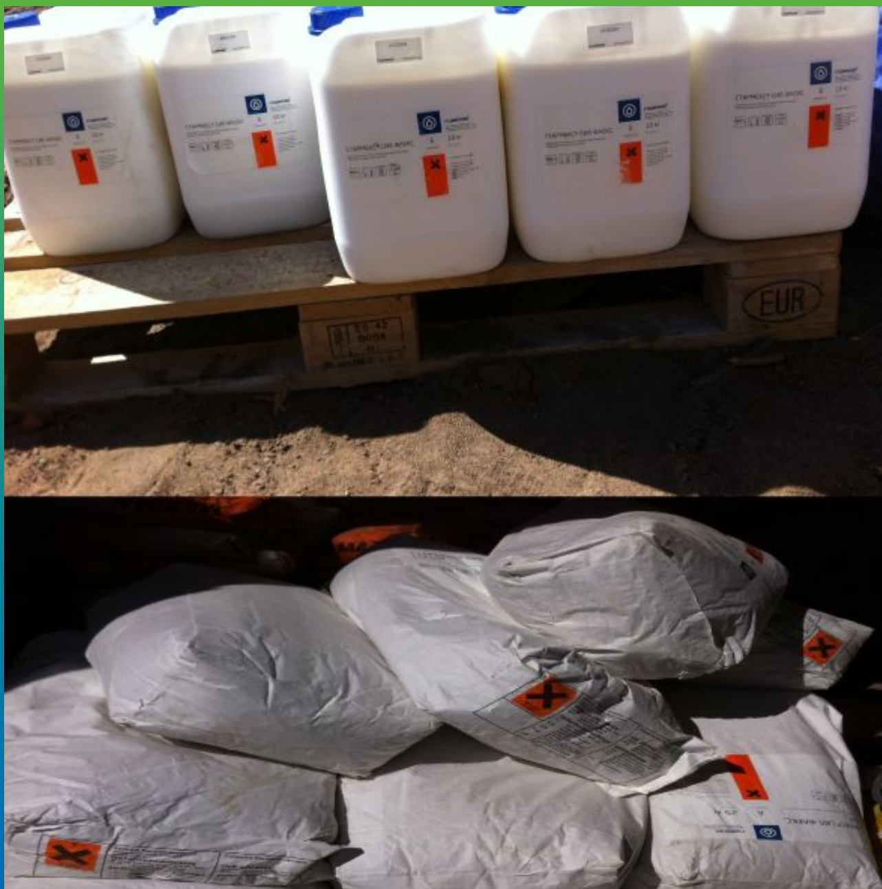
Материал Стармекс Сил Флекс на объекте