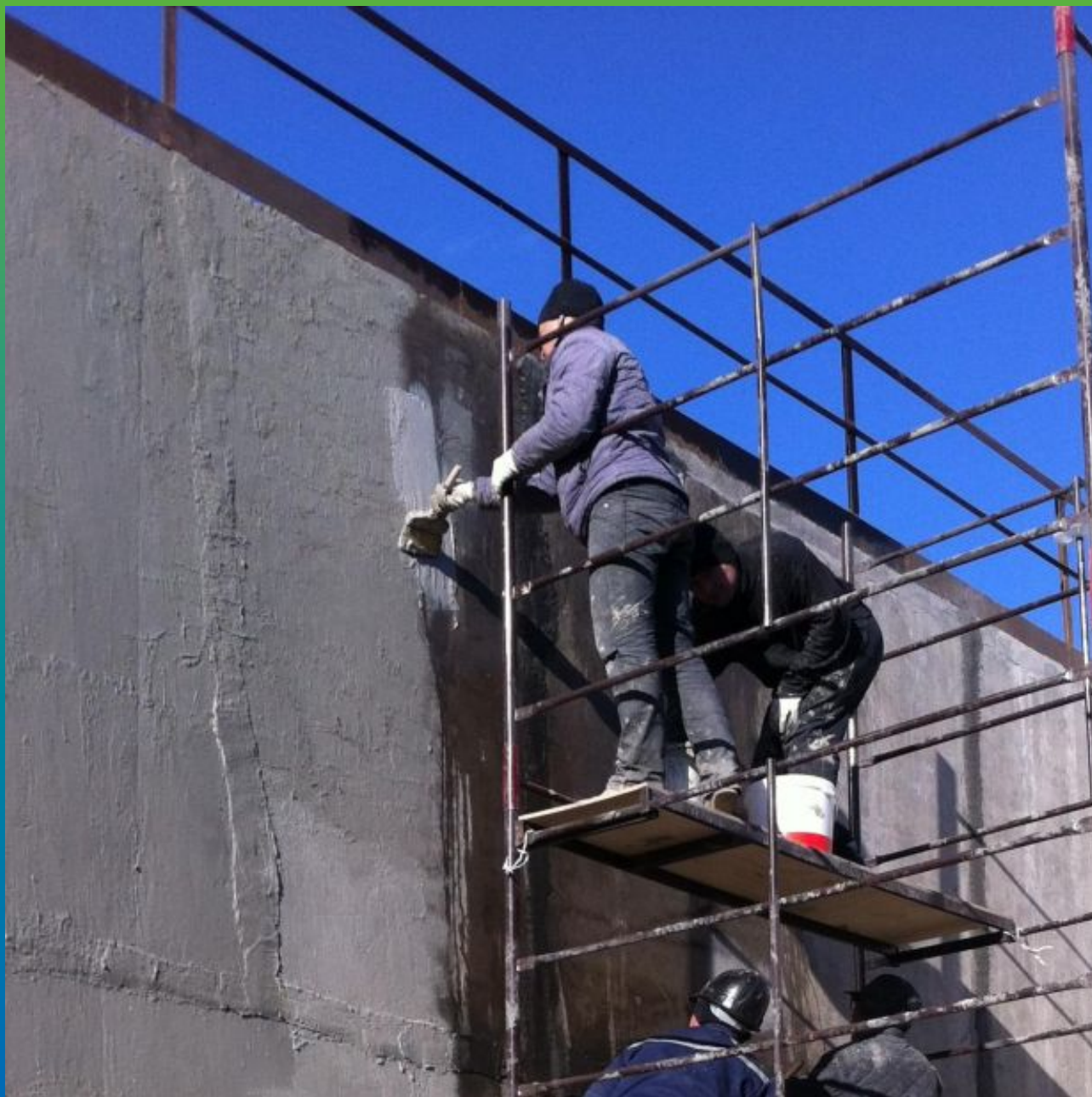
Нанесение гидроизоляционного состава Максил Флекс по стенам аэротенка