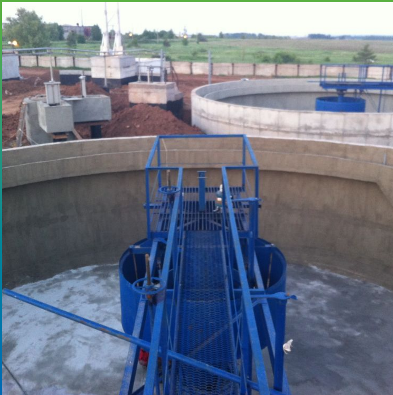
Вторичный отстойник (на стены нанесен состав Стармекс Сил Флекс)