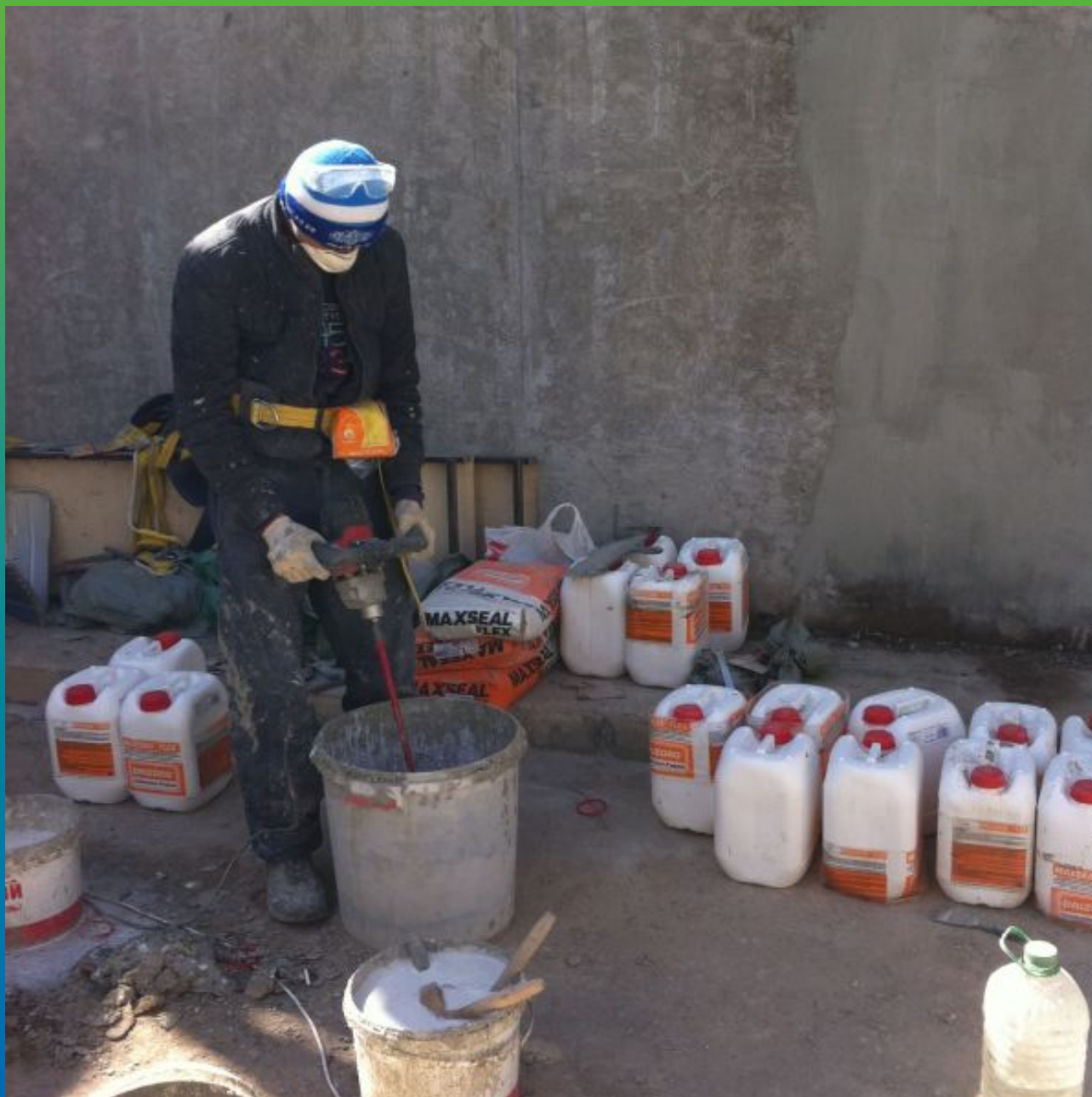
Приготовление гидроизоляционного состава Максил Флекс