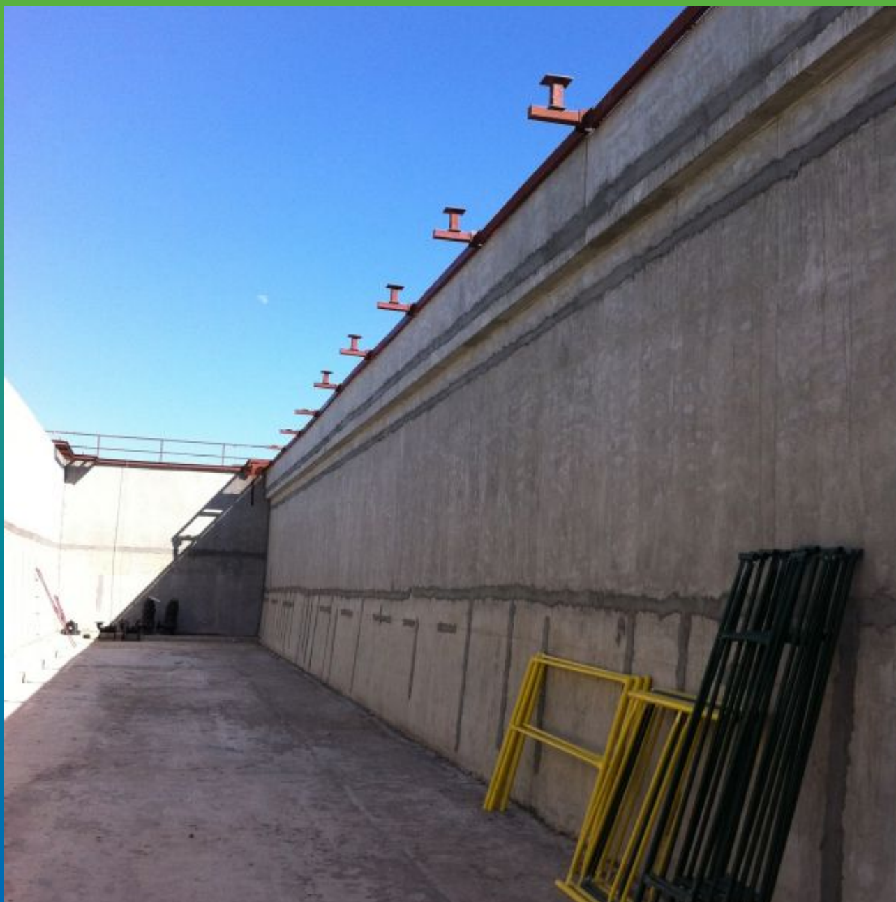
Стена аэротенка, отремонтированная ремонтным составом Максрест