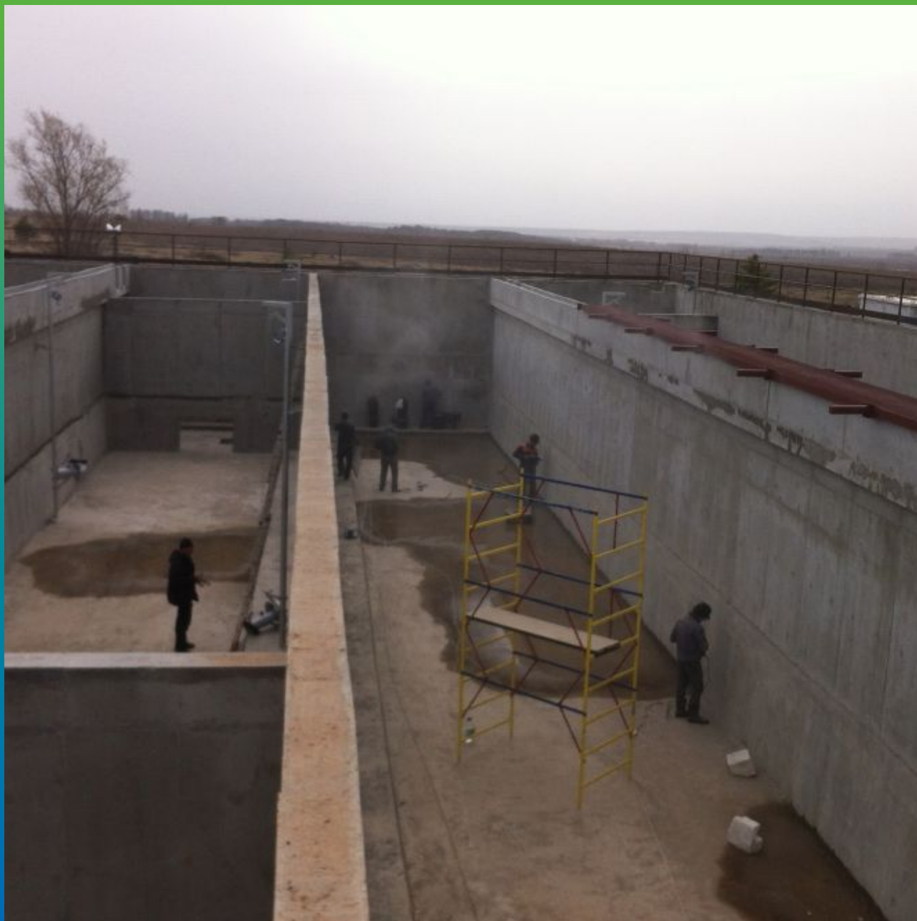
Аэротенк до начала выполнения работ по ремонту и гидроизоляции