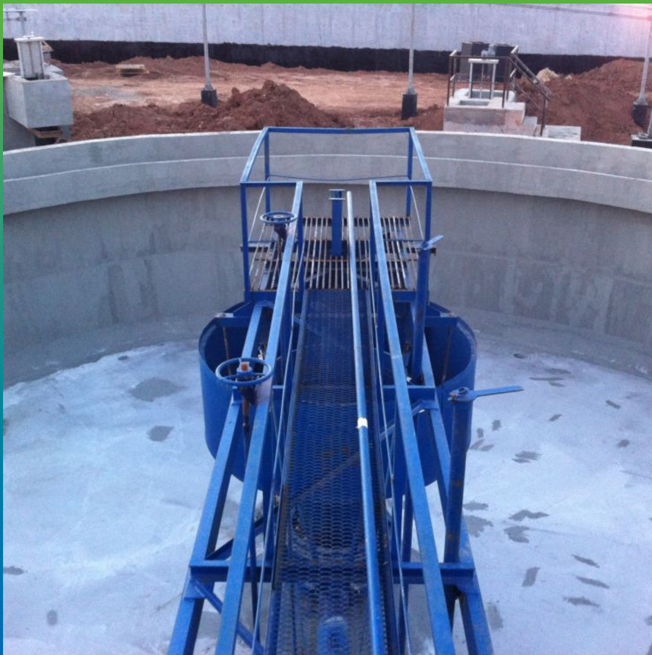
Вторичный отстойник (на стены нанесен состав Макссил Флекс)