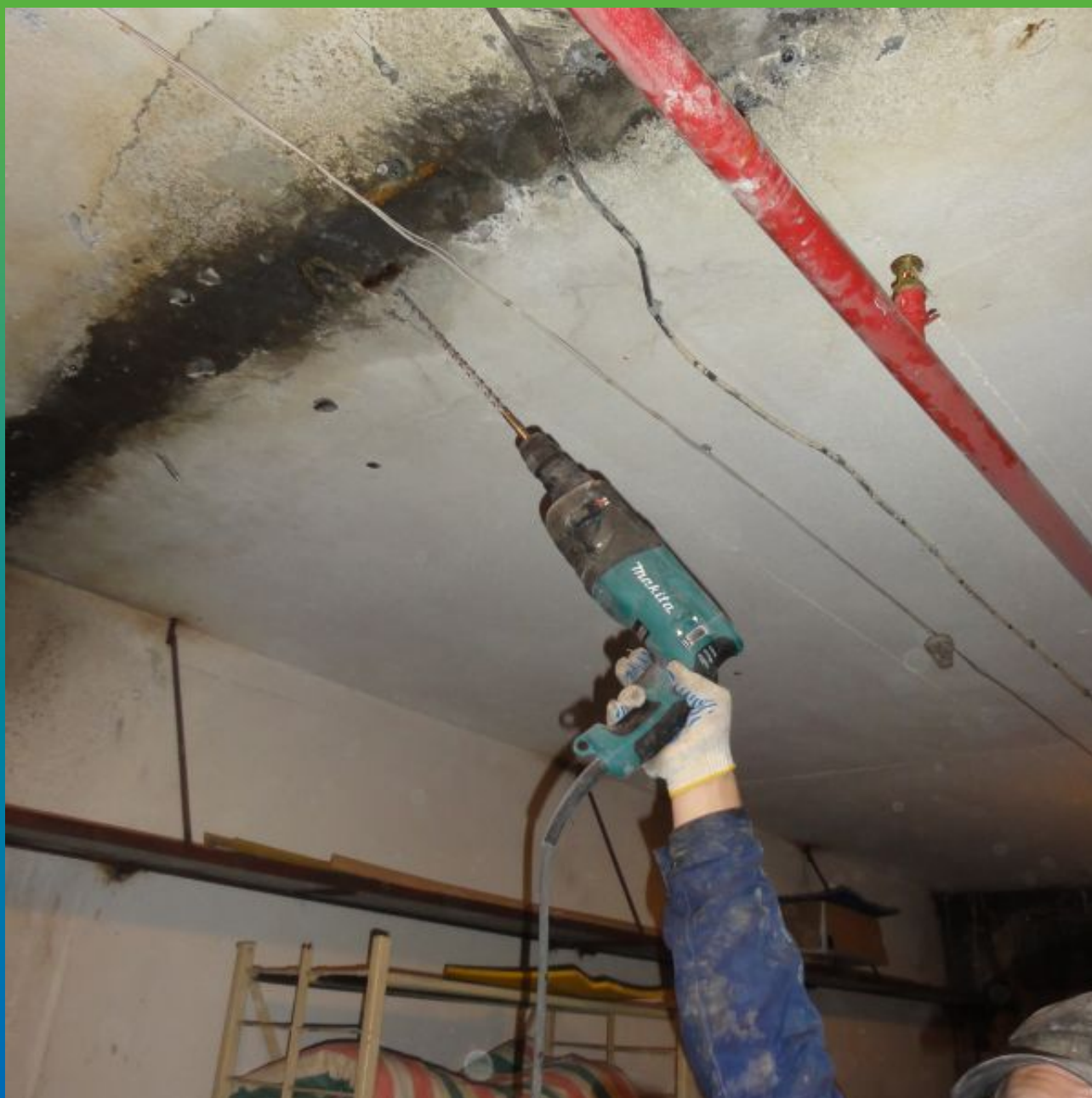
Сверление шпуров пересекающих швы и сетки возможных трещин