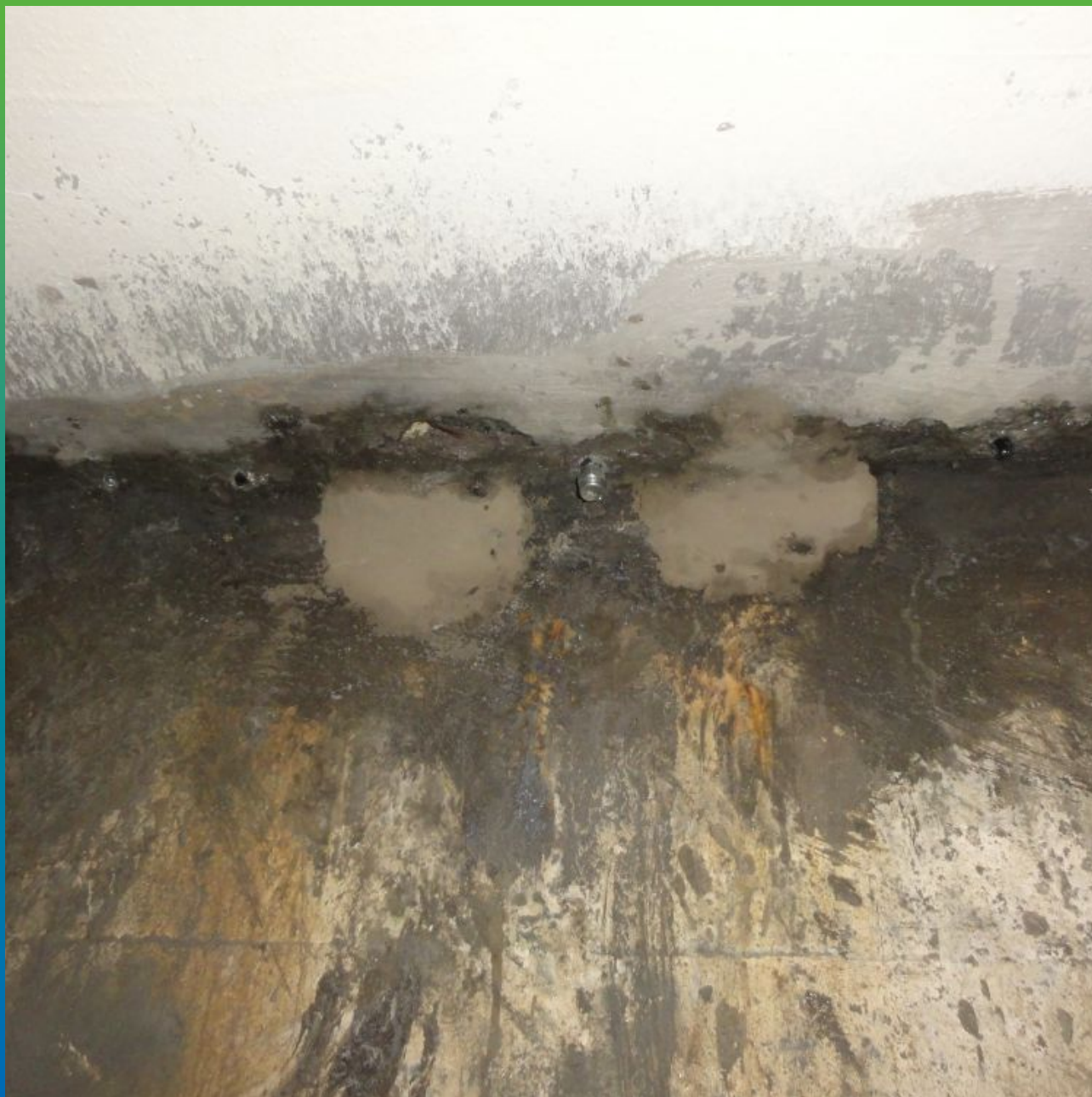
Установка инъекционных пакеров