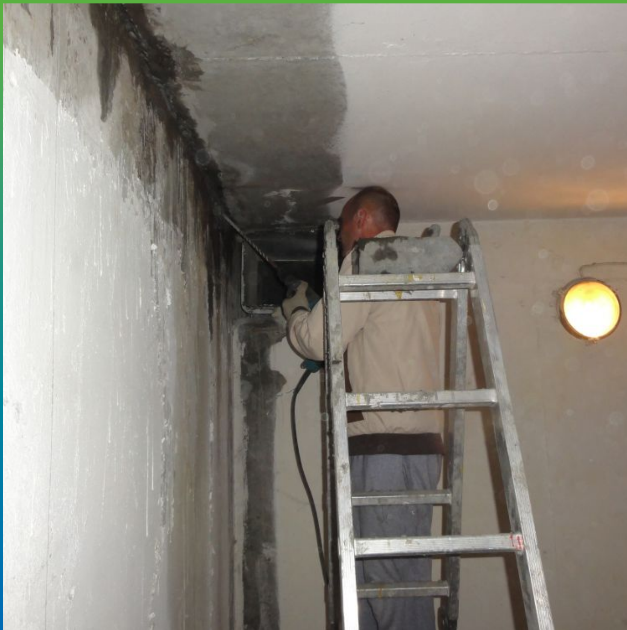
Расшивка швов и их подготовка