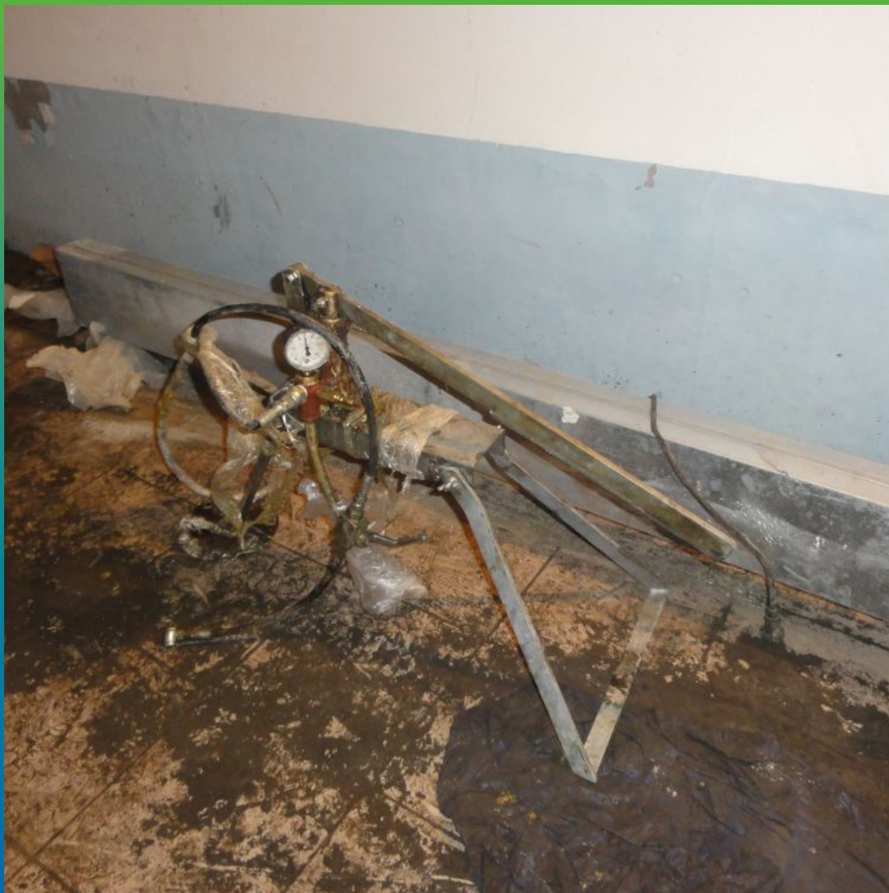
Проверка оборудования перед началом инъецирования