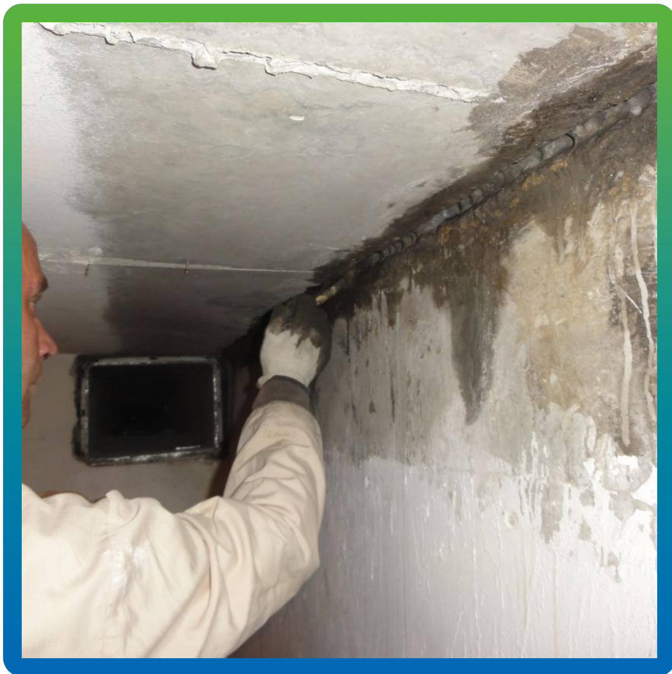
Грунтовка швов раствором Максрест