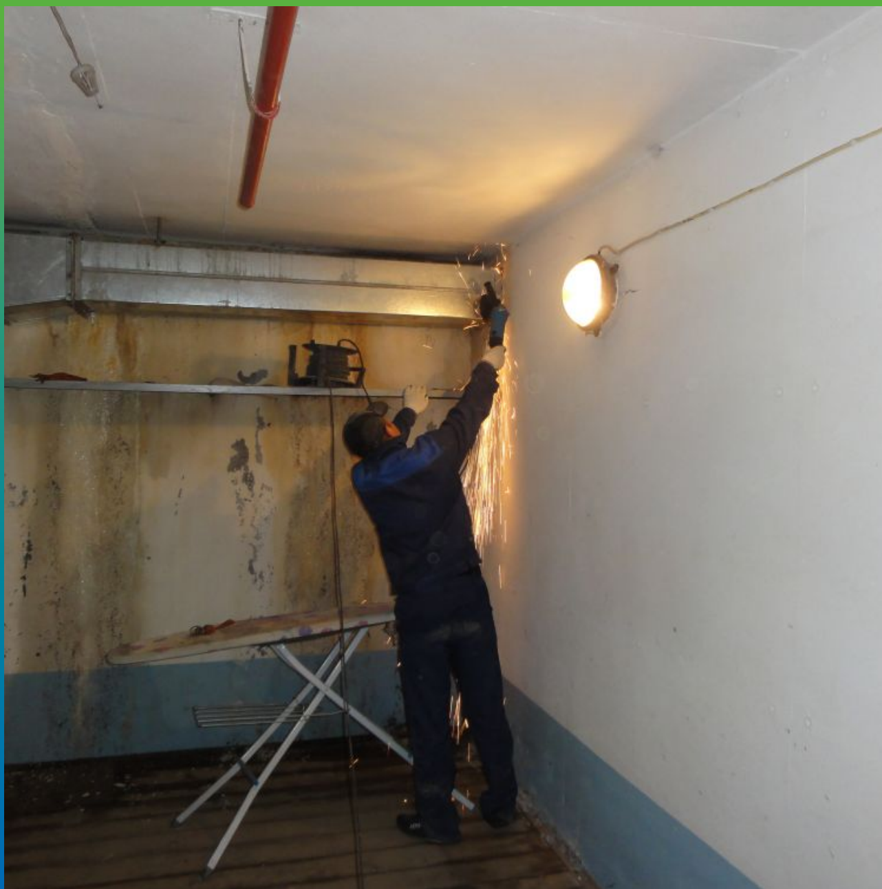
Демонтаж конструкций для подступа ко шву