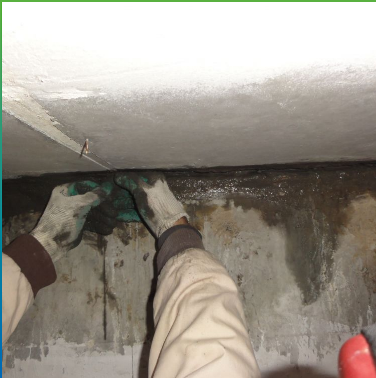
Чеканка швов ремонтным составом Максрест, водонасыщенных швов гидравлическим полимер-цементом Максплаг