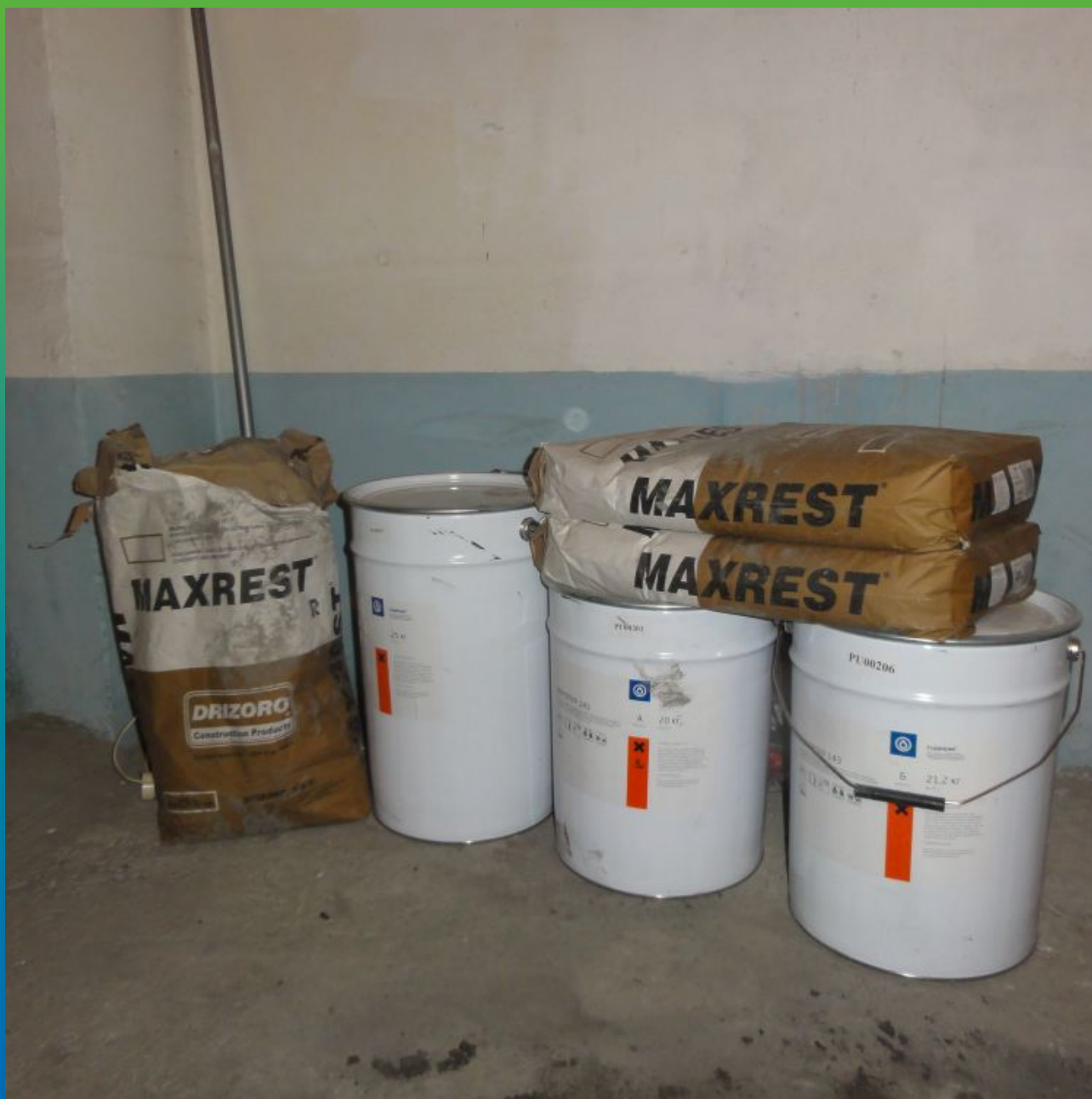
Поставка материала на объект