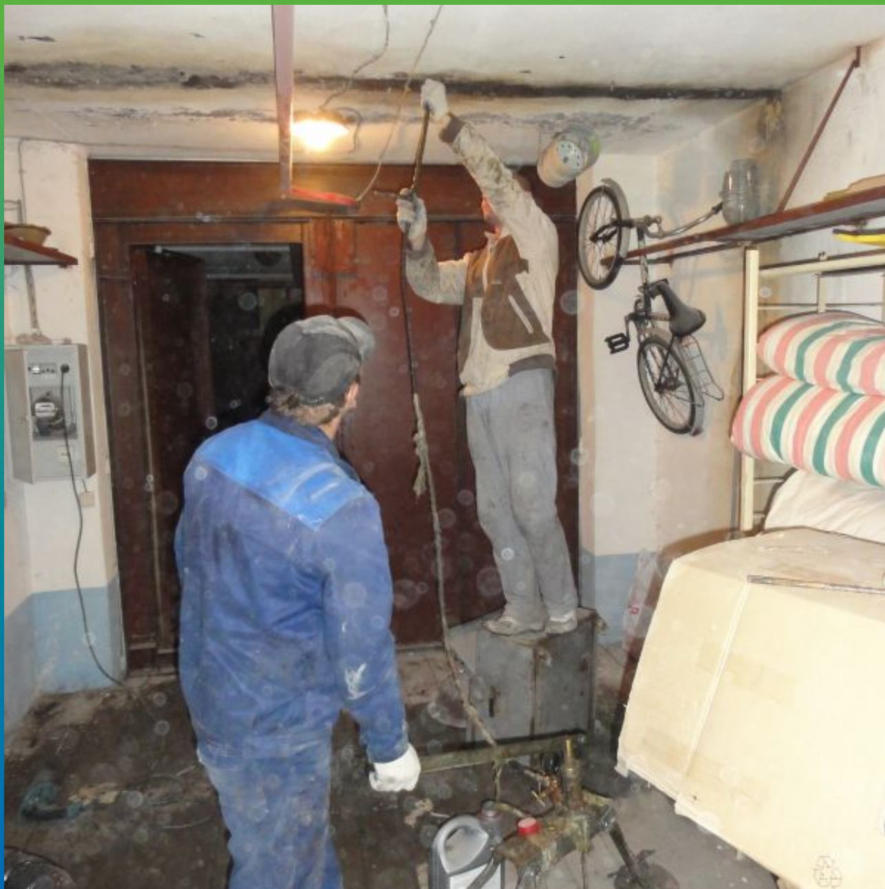
Процесс инъектирования первой стадии - остановка течи и гидроизоляция швов вспенивающейся полиуретановой смолой Манопур С