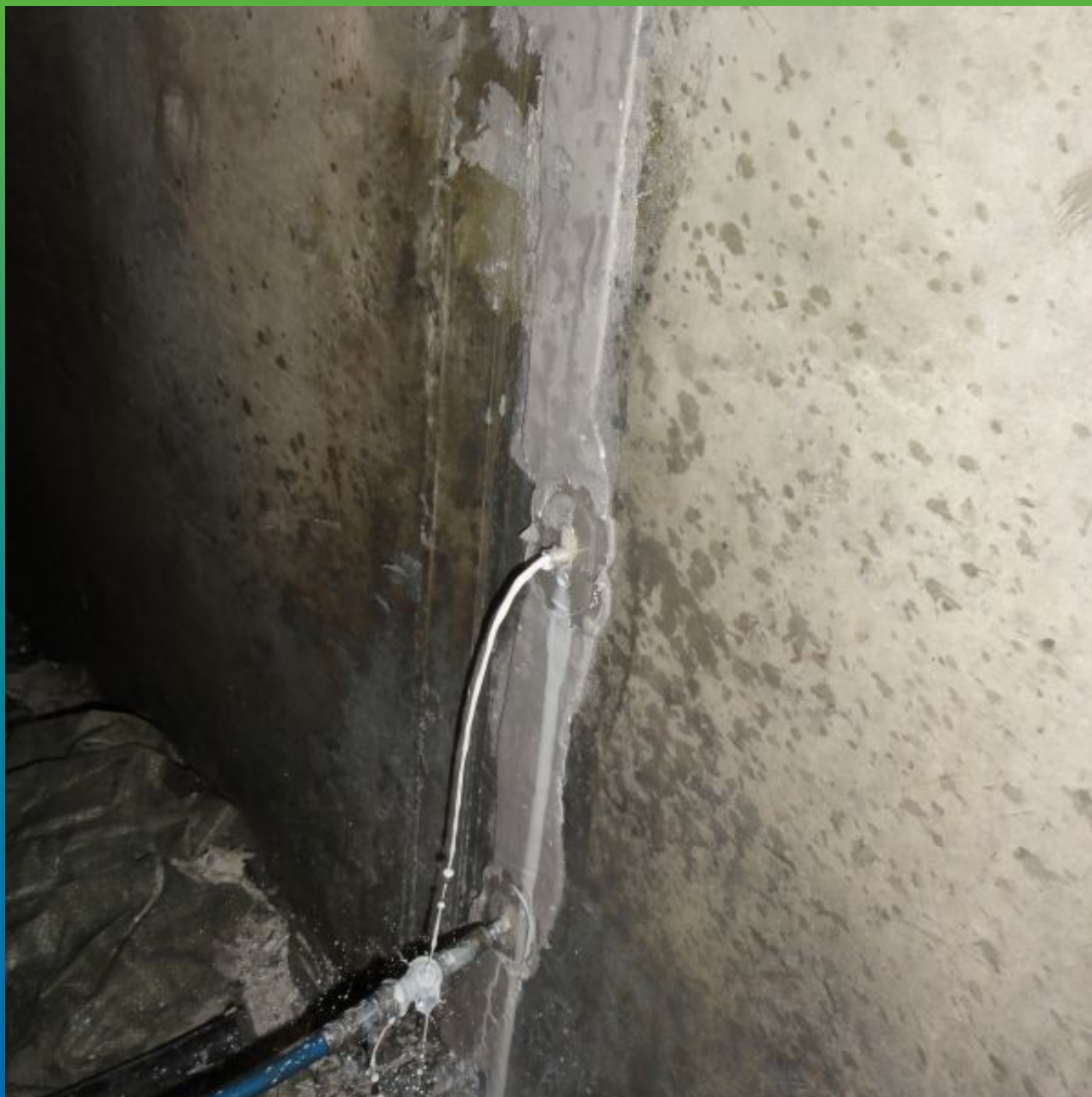
Контроль заполнения трещины составом Манокрил Гель Р