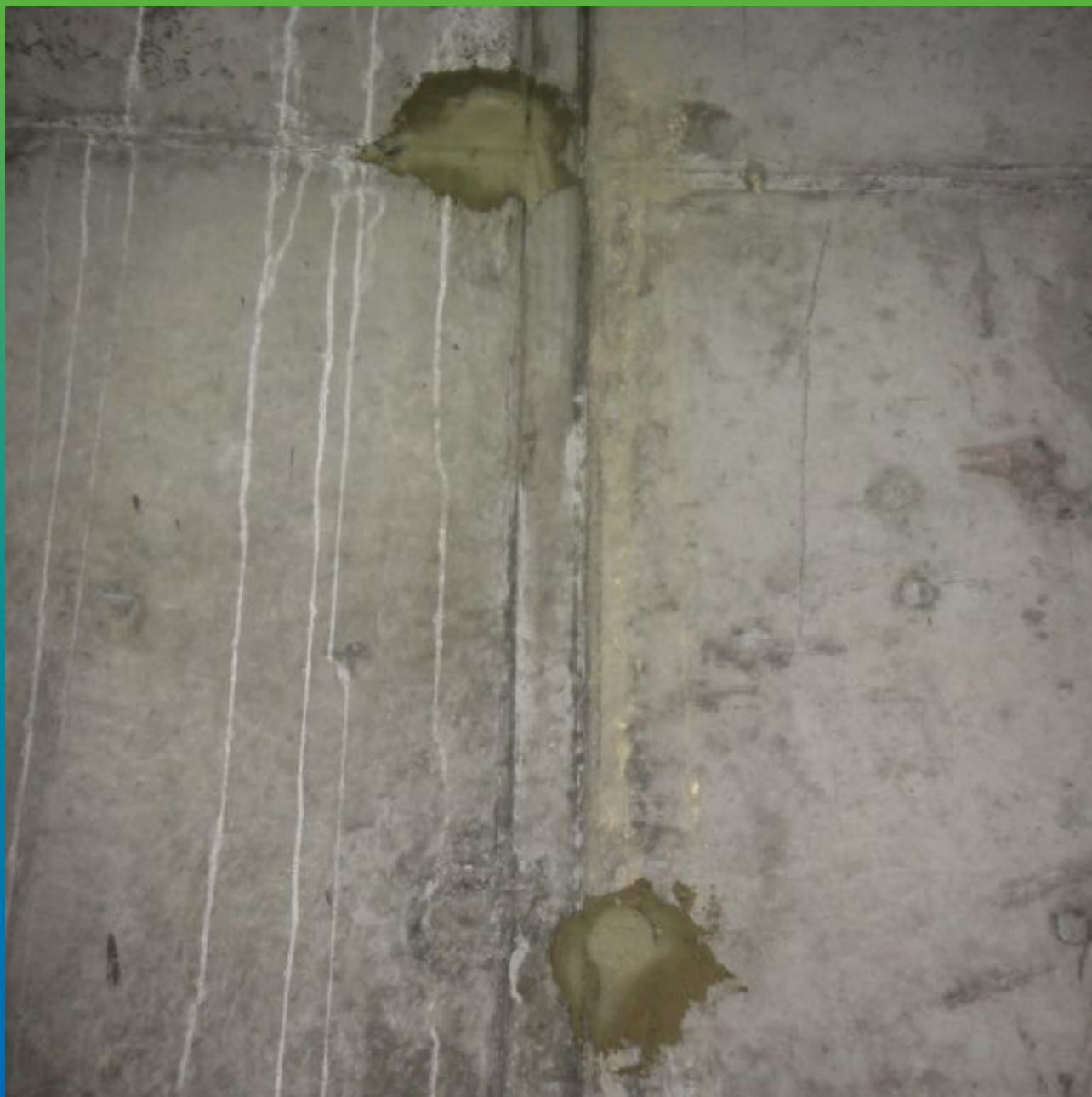
Вид зачеканенных отверстий с помощью Максджойнт Эластик