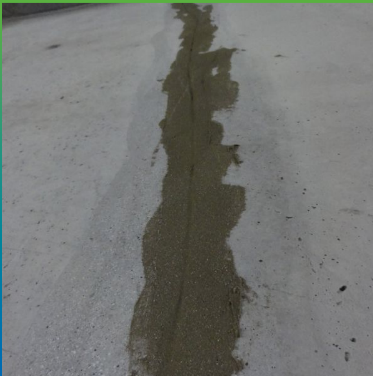
Трещина обработанная Максджойнт Эластик