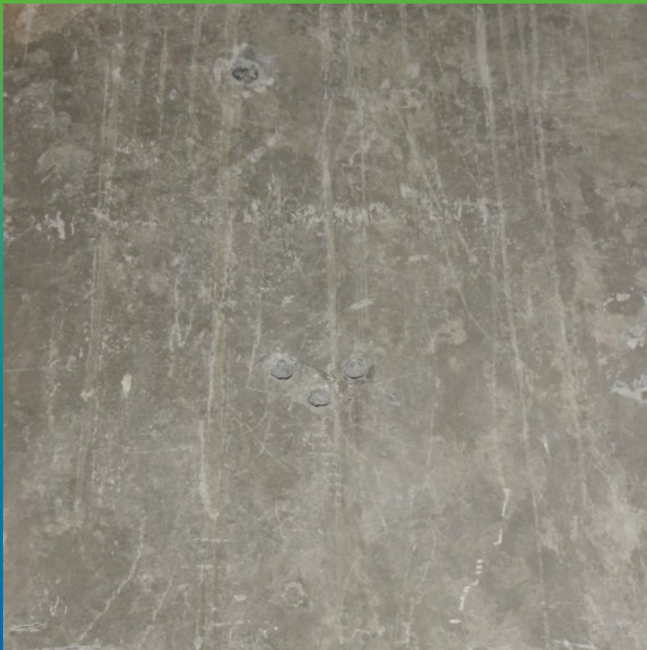
Вид отверстий от опалубочных тяжей