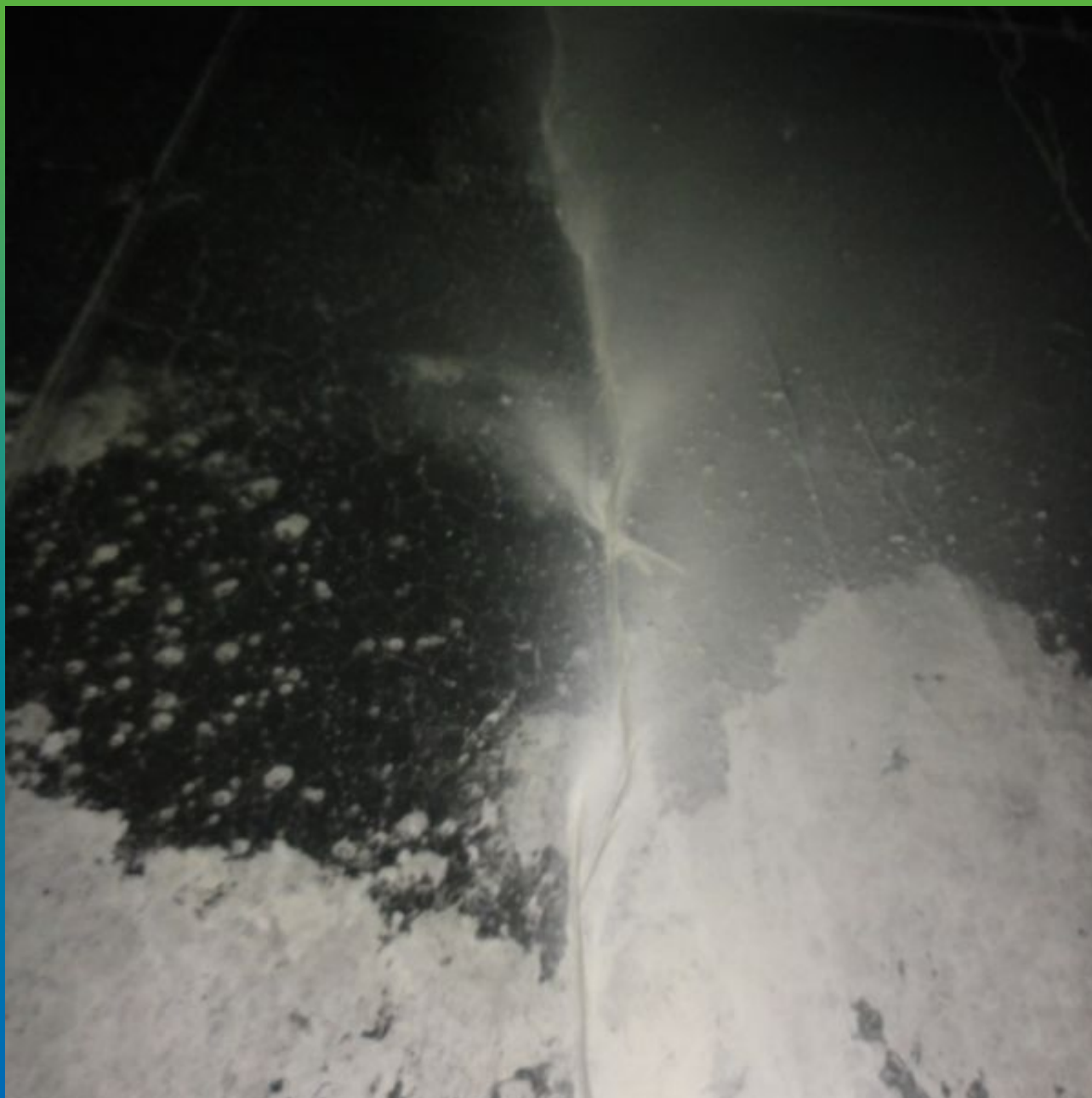
Вид прочищенной трещины