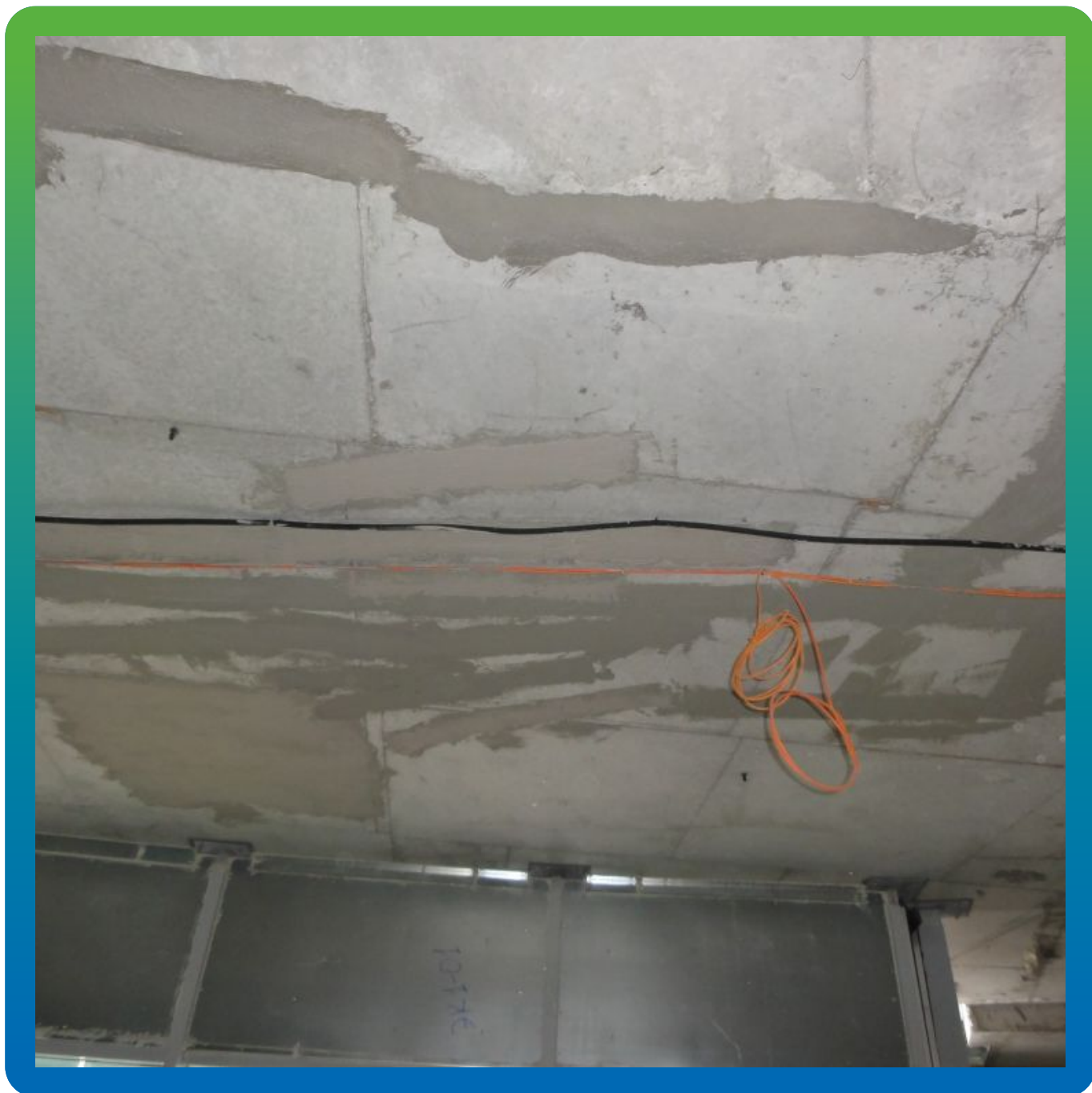
Трещины обработанные составом Макссил Флекс