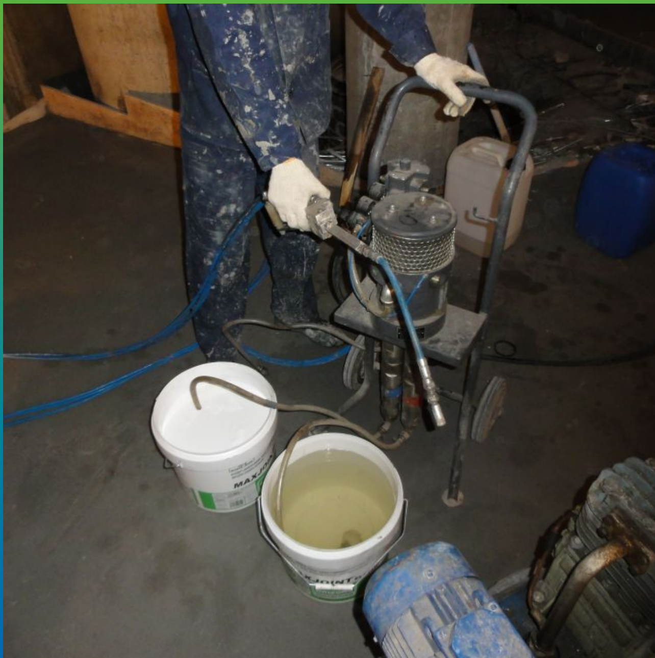
Оборудование на объекте - насос БМ 1425