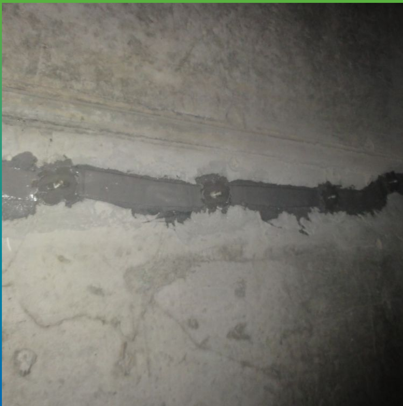
Пакера БМ 0187 на адгезив Манопокс 331