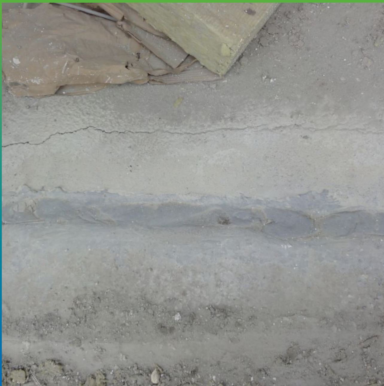
Первоначальный вид шва снаружи