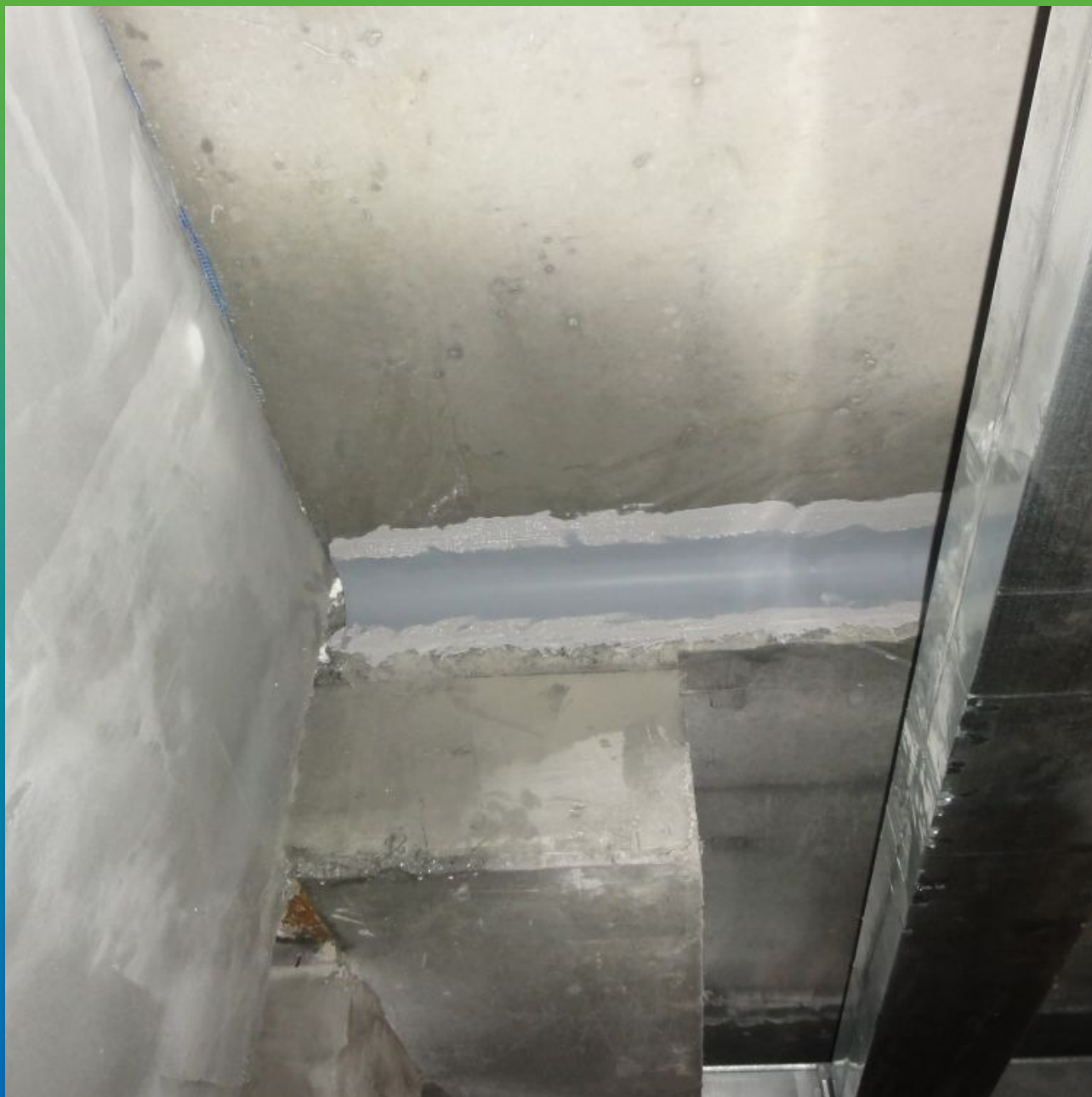
Финальный вид шва