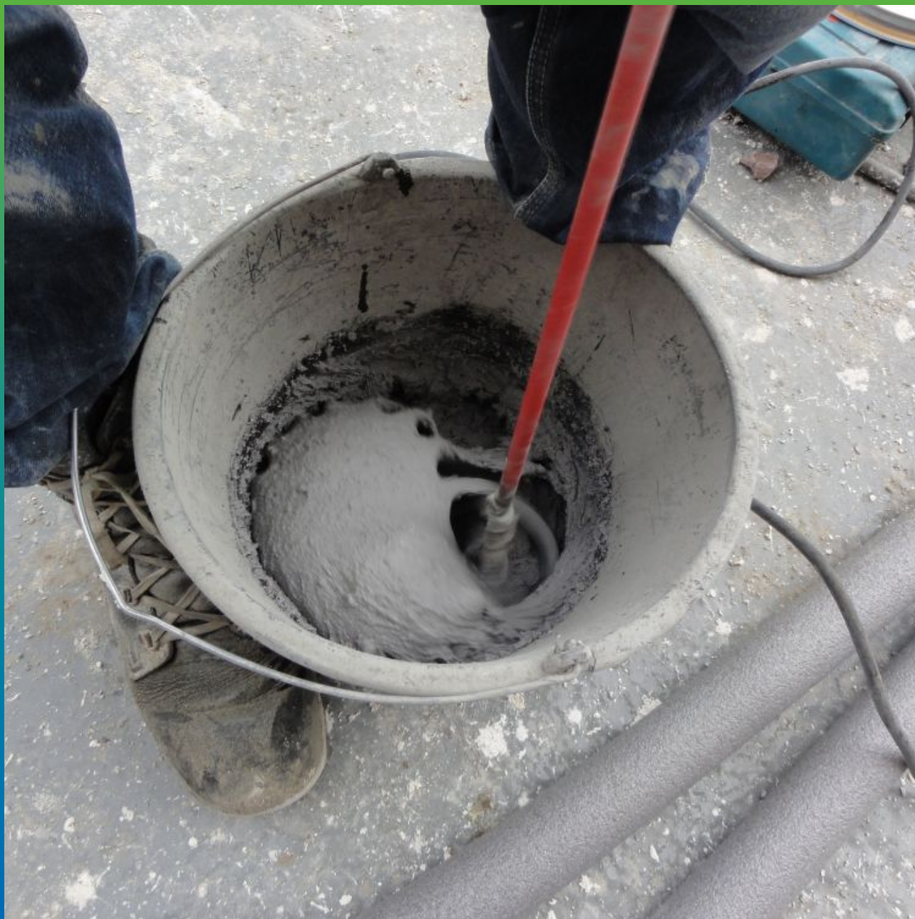
Затворение Манопокс 331