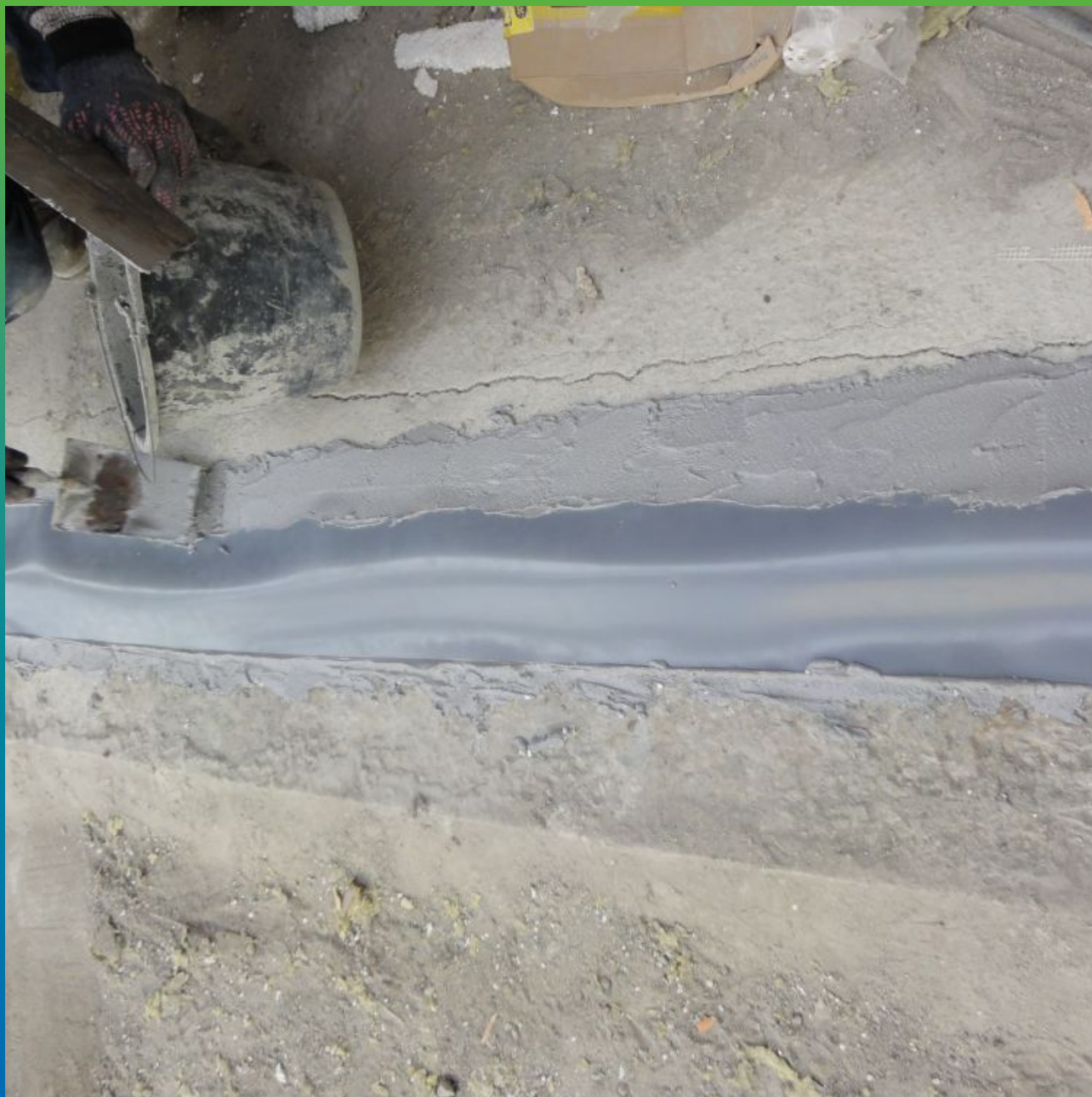
Нанесение второго слоя Манопокс 331