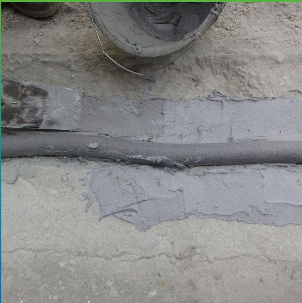
Нанесение Манопокс 331