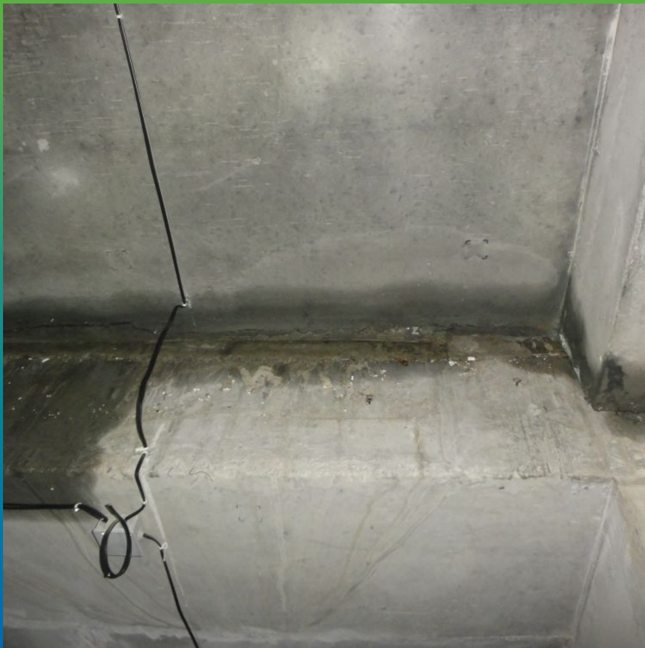
Первоначальный вид шва изнутри