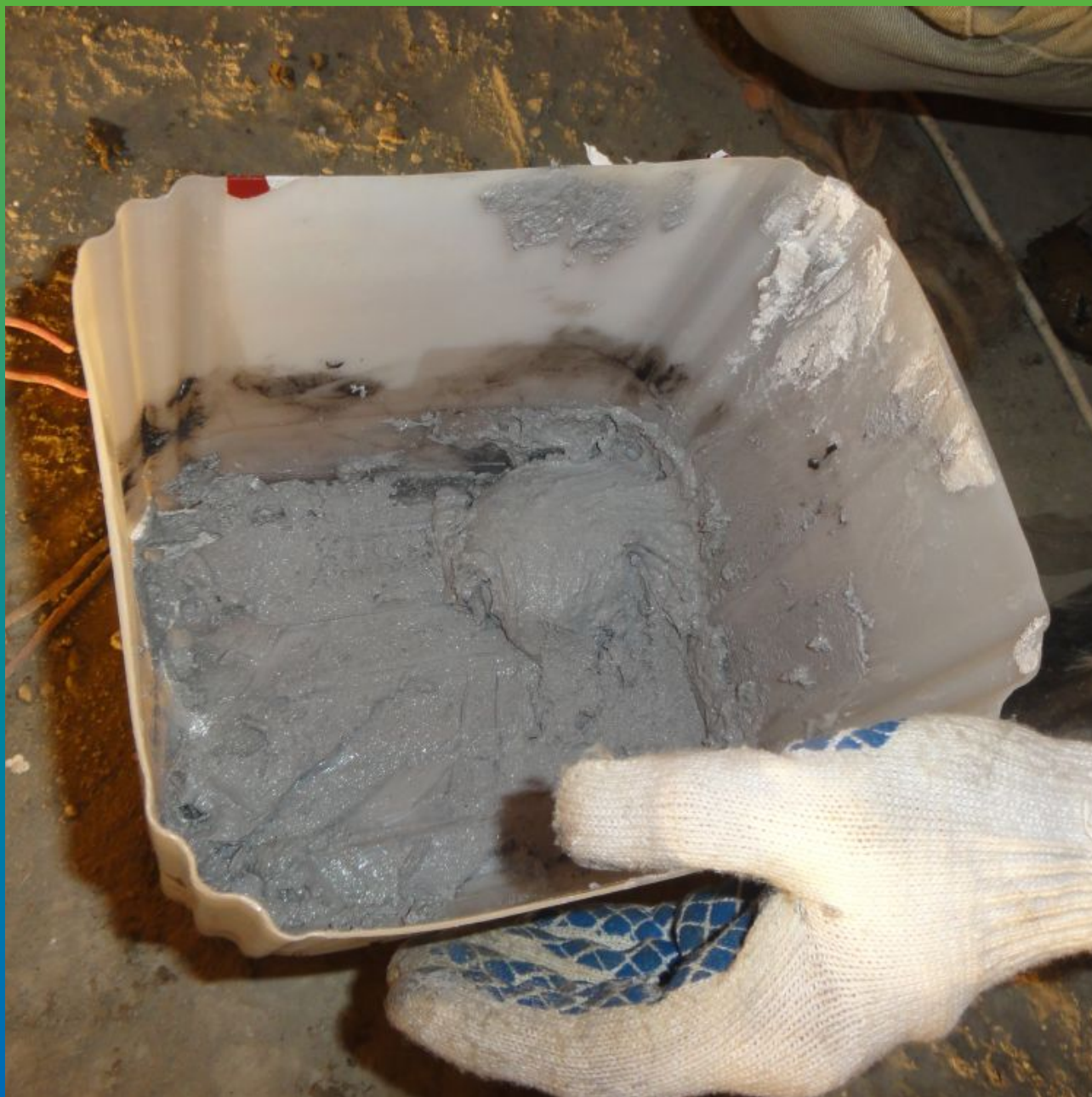
Затворение Манопокс 331