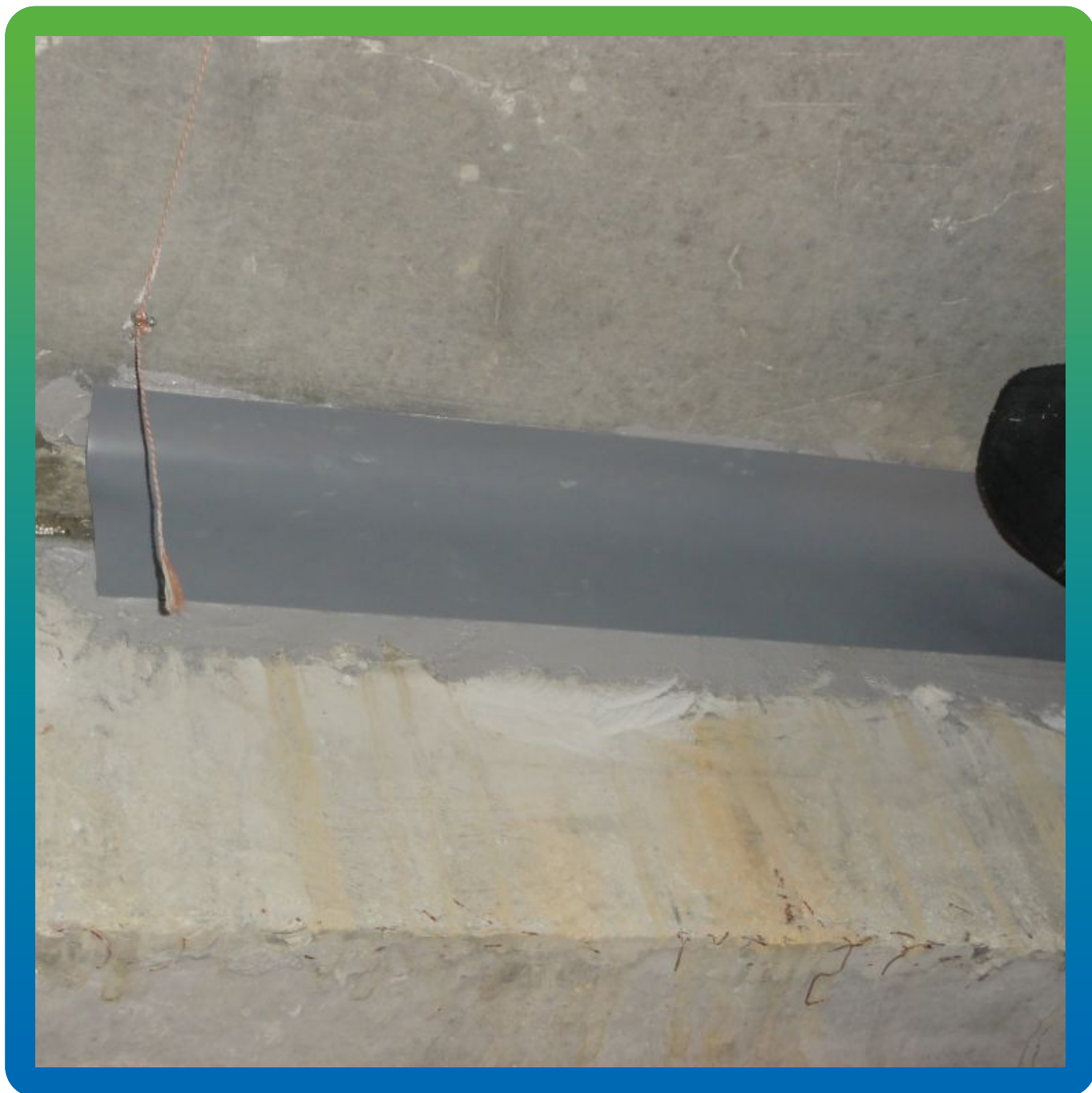
Приклейка Манодил Про на Манопокс 331