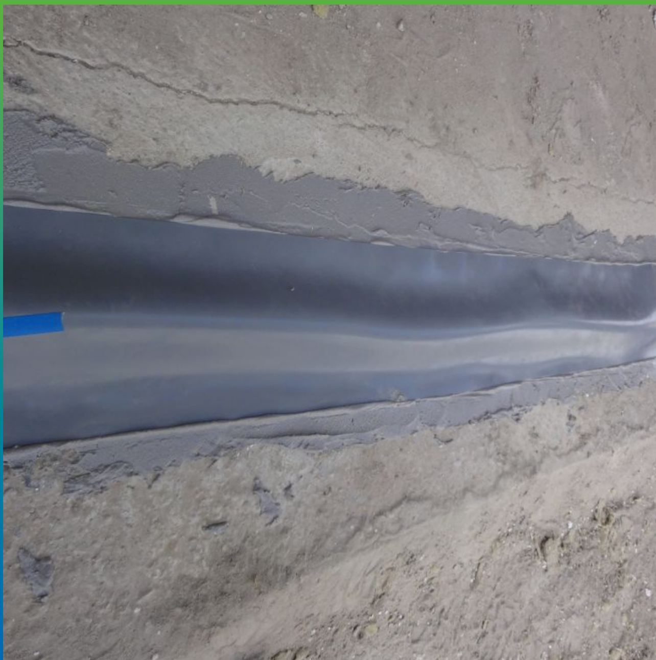
Укладка ленты Манодил Про