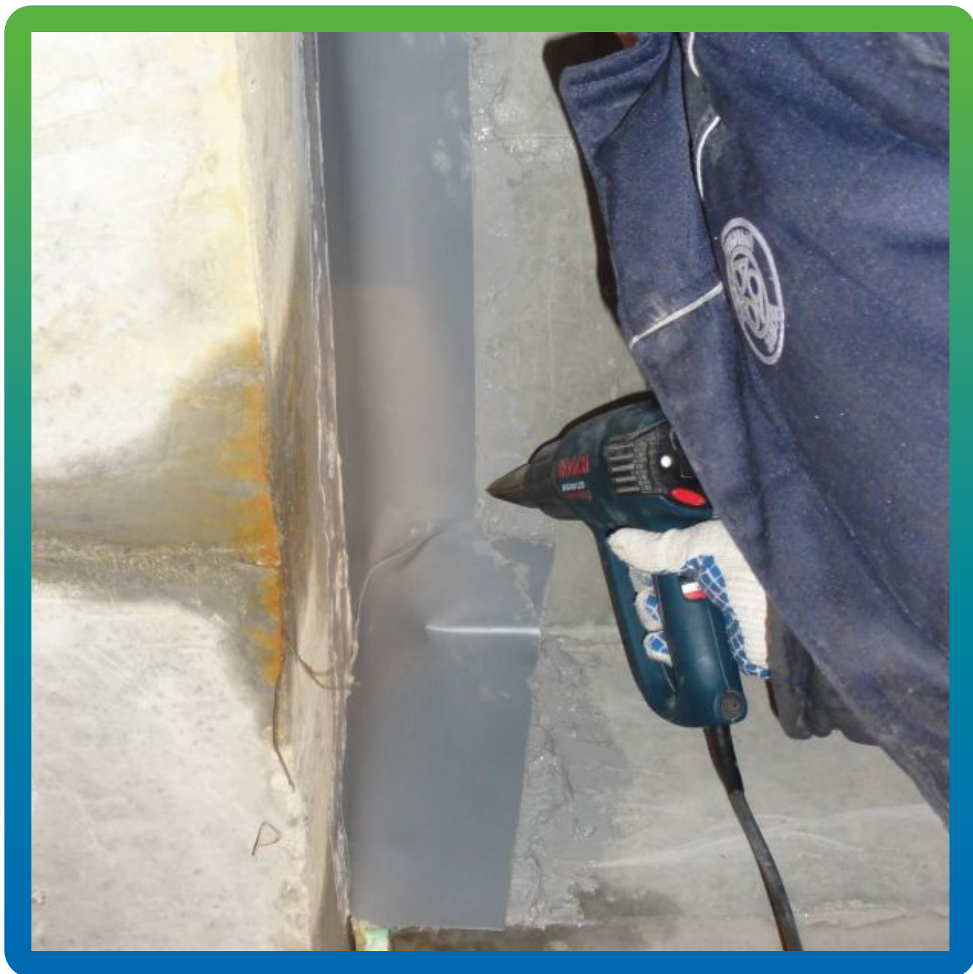
Стыковка Манодил Про с помощью горячего воздуха