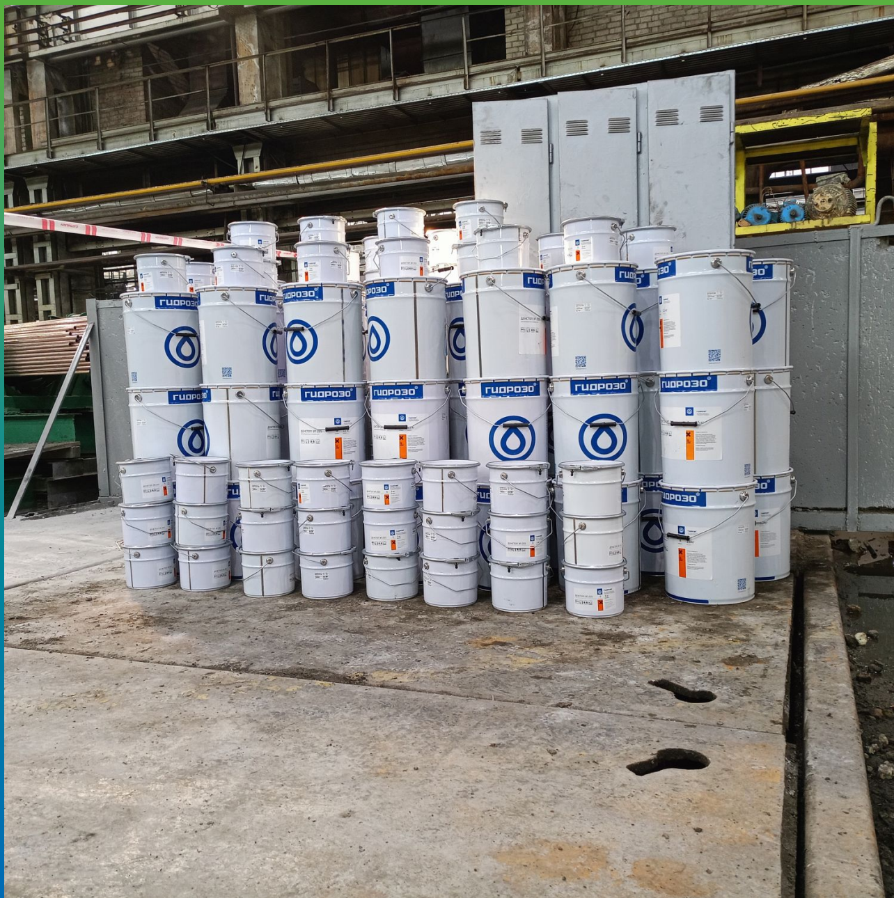
Двухкомпонентная водоразбавляемая эпоксидная краска ДенТоп ЭП 205 на объекте