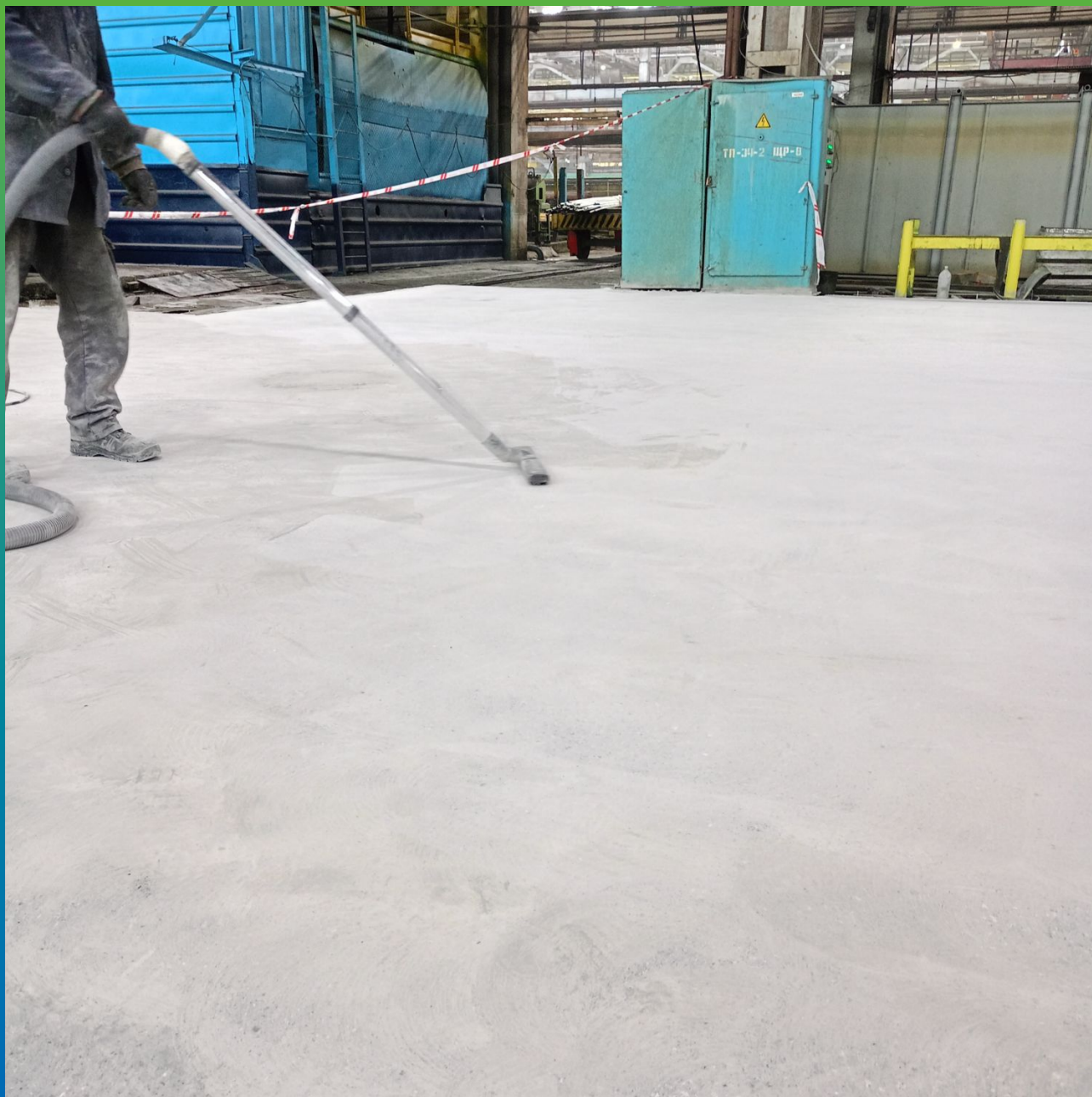
Обеспылевание бетонного основания