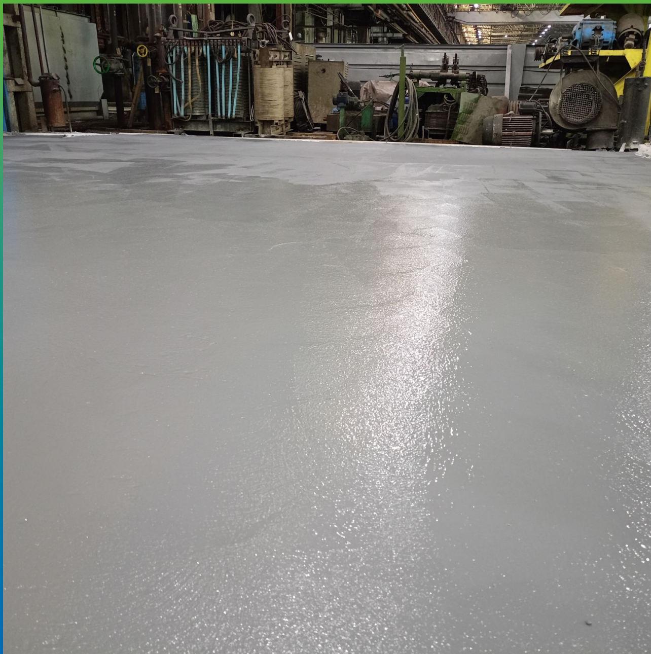
Внешний вид нанесенного покрытия ДенТоп ЭП 205