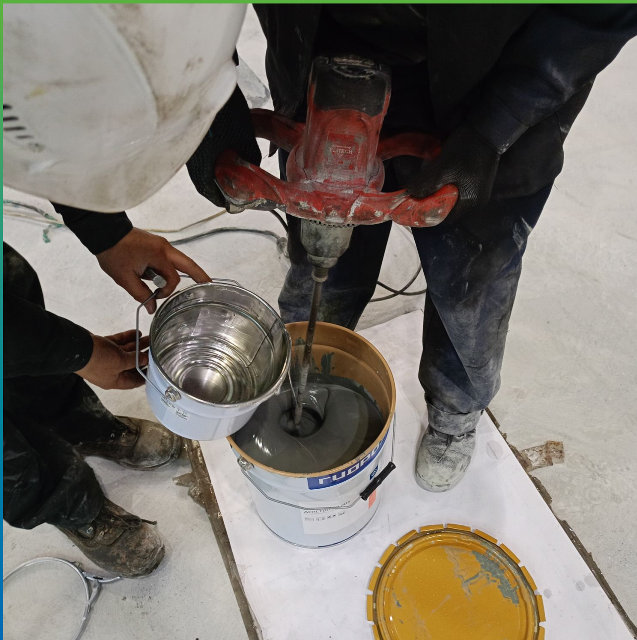
Смешивание компонентов ДенсТоп ЭП 205