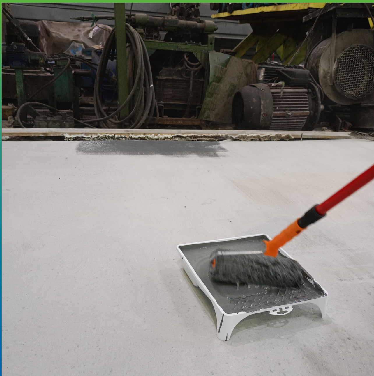
Ручное нанесение 1 слоя состава ДенсТоп ЭП 205