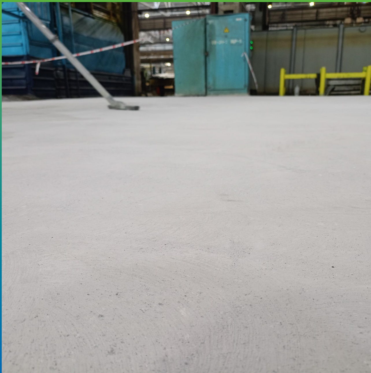
Вид шлифованного и обеспыленного основания перед нанесением водоразбавляемой эпоксидной краски ДенсТоп ЭП 205