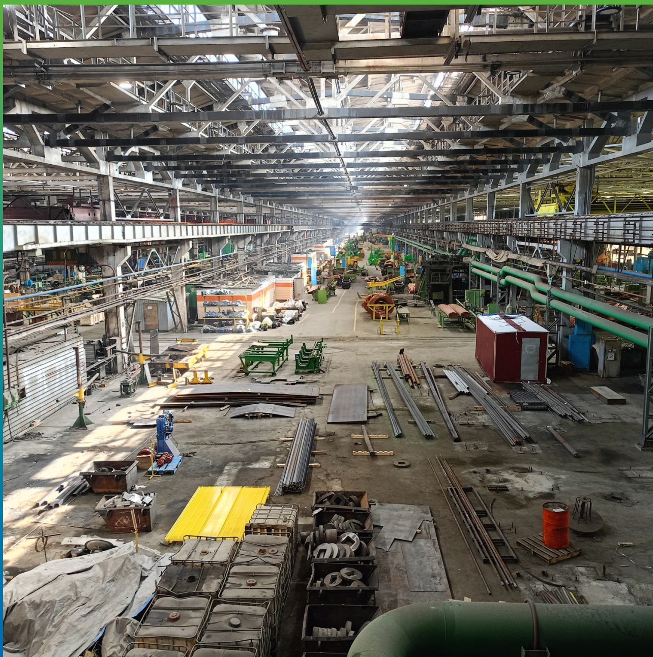
Основание перед началом работ по устройству защитного покрытия пола