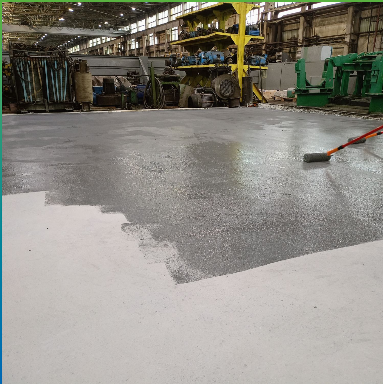
Ручное нанесение 1 слоя состава ДенсТоп ЭП 205