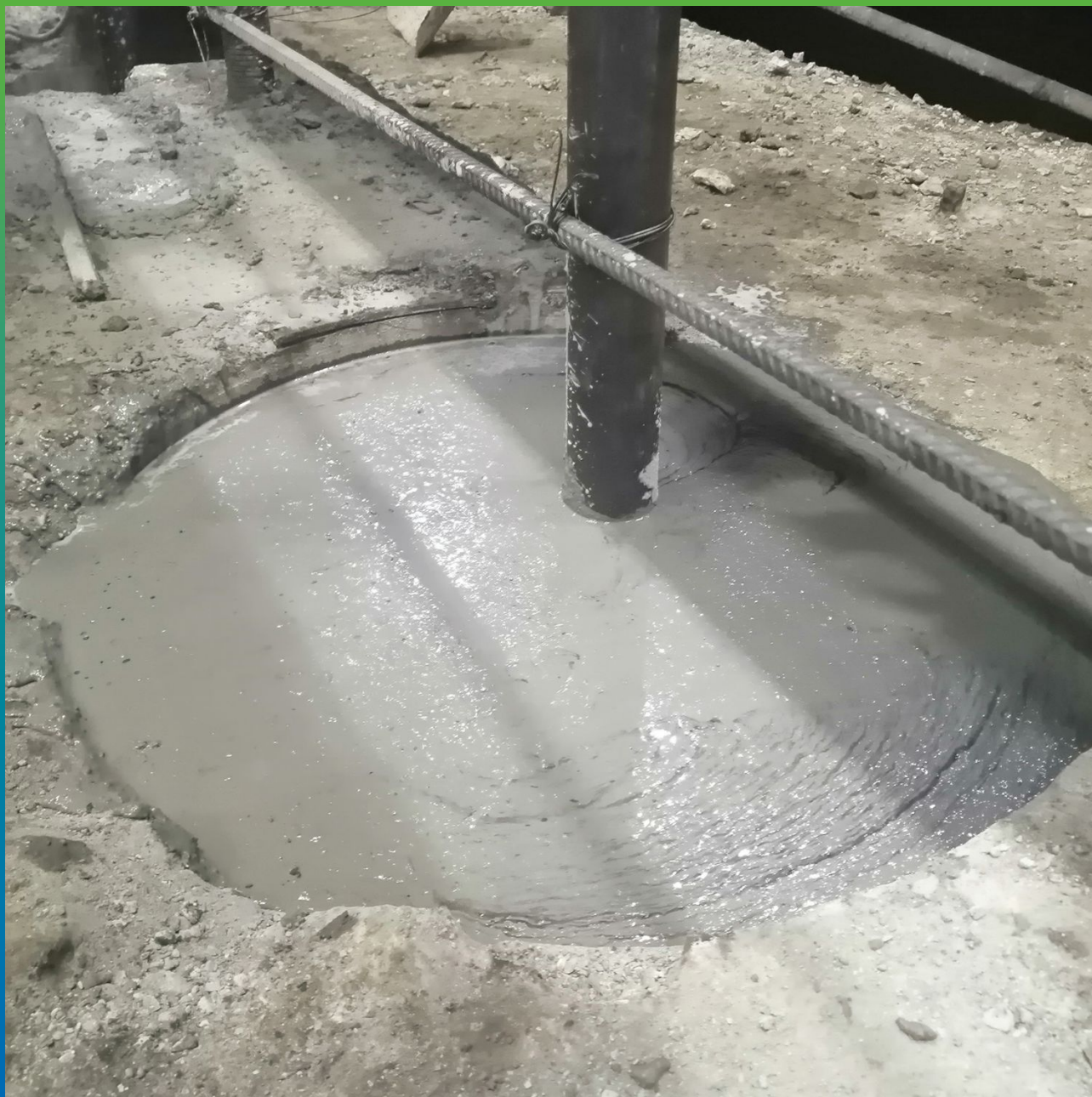
Закрепление анкерных болтов составом Стармекс ФМ7