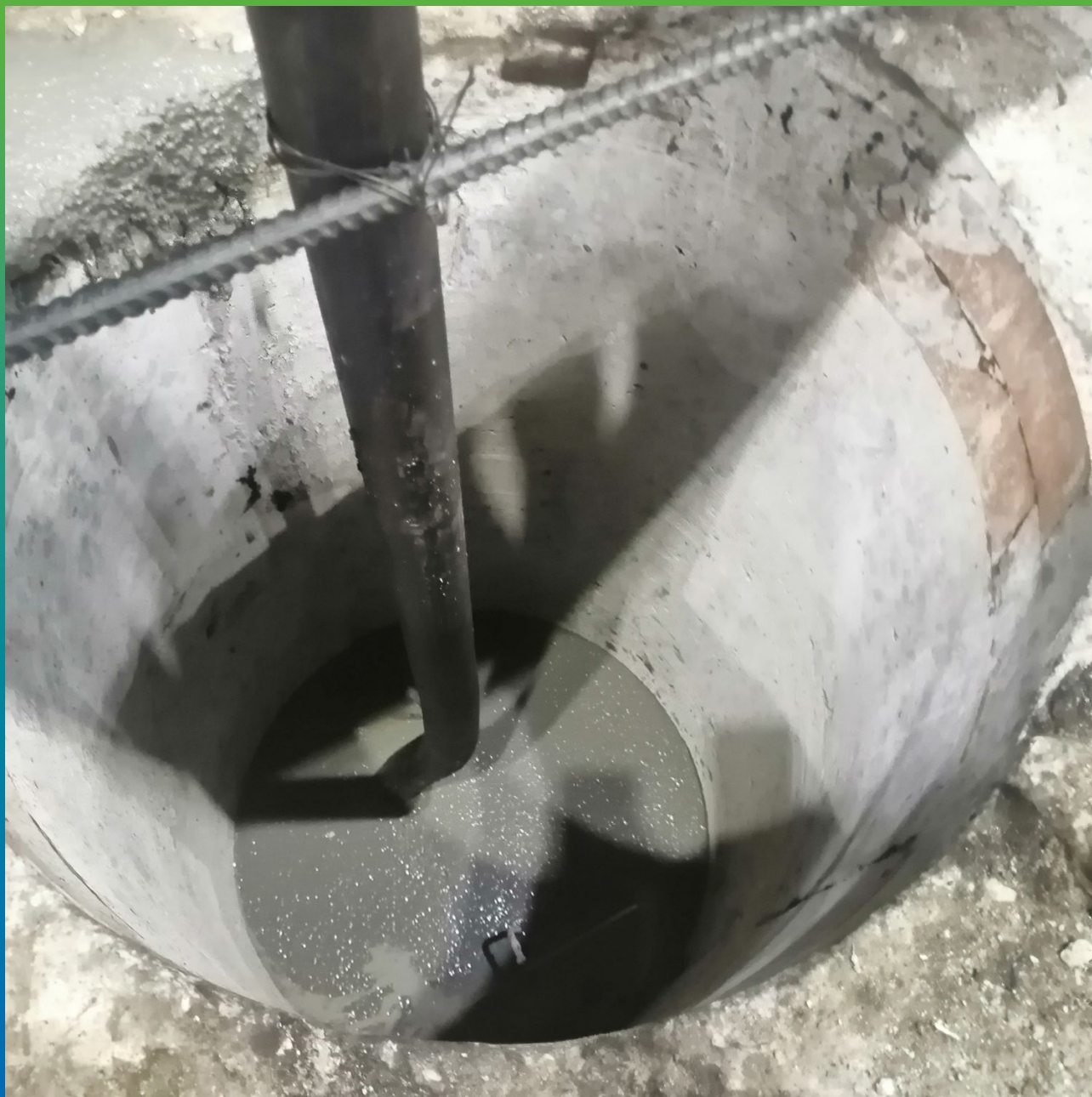
Закрепление анкерных болтов составом Стармекс ФМ7