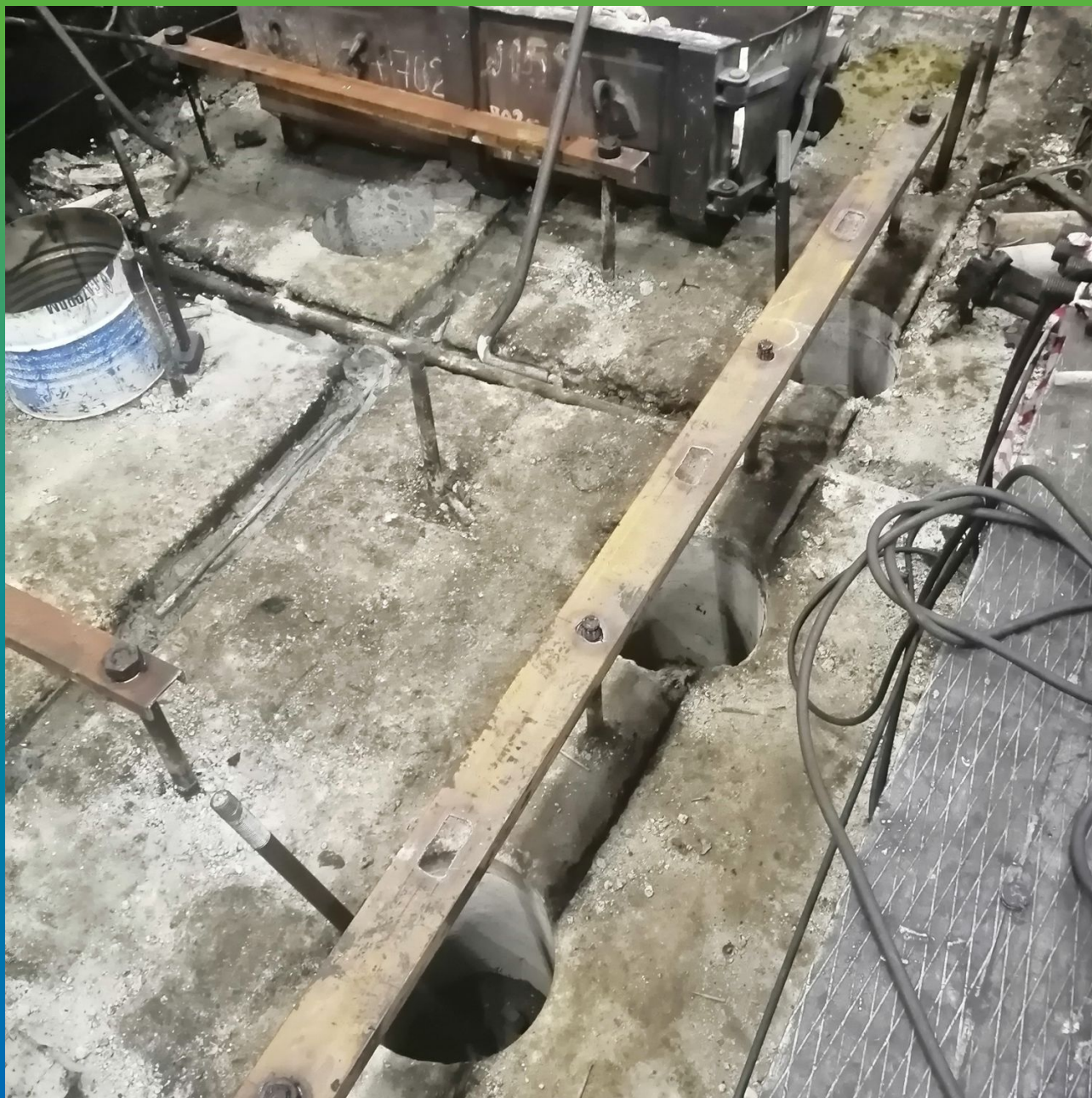
Подготовительные работы с основание перед анкерровкой и монтажом оборудования