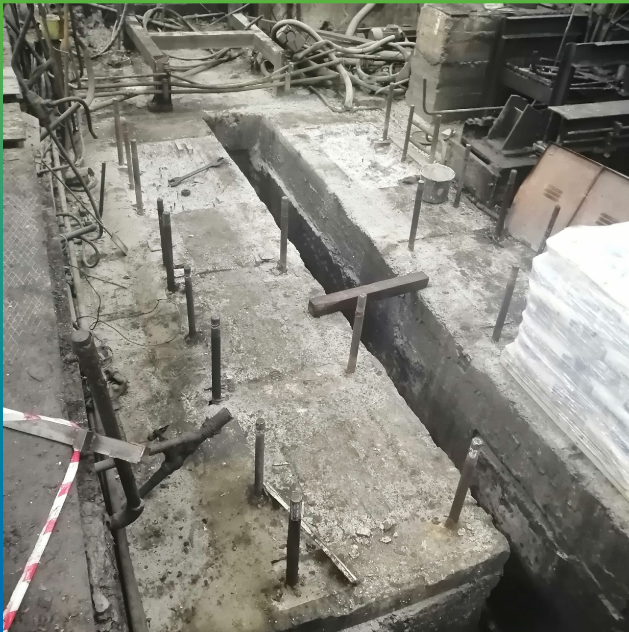
Подготовительные работы с основание перед анкерровкой и монтажом оборудования