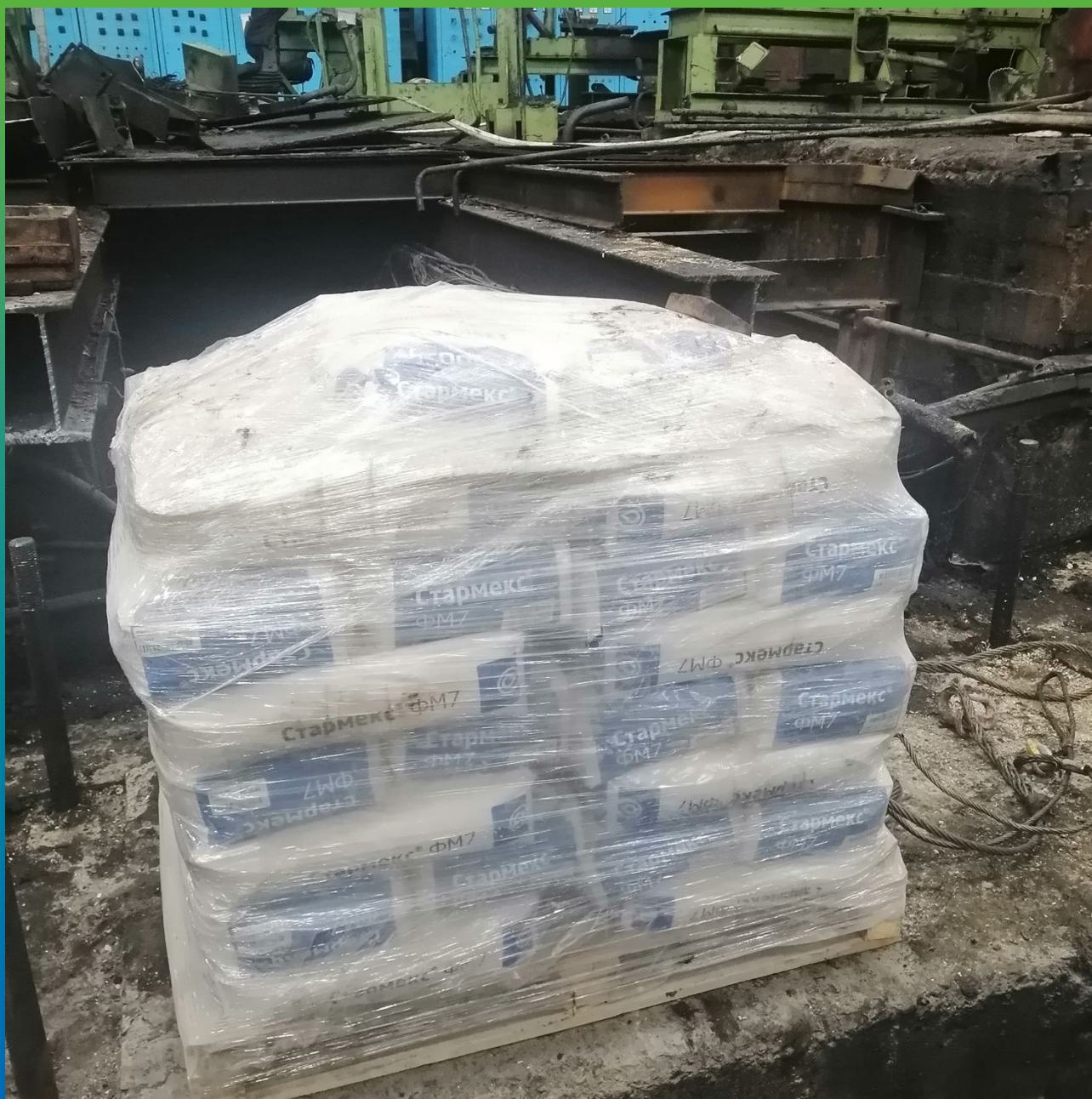
Стармекс ФМ7 – безусадочная полимермодифицированная ремонтная и анкерочная смесь подливочного типа на объекте