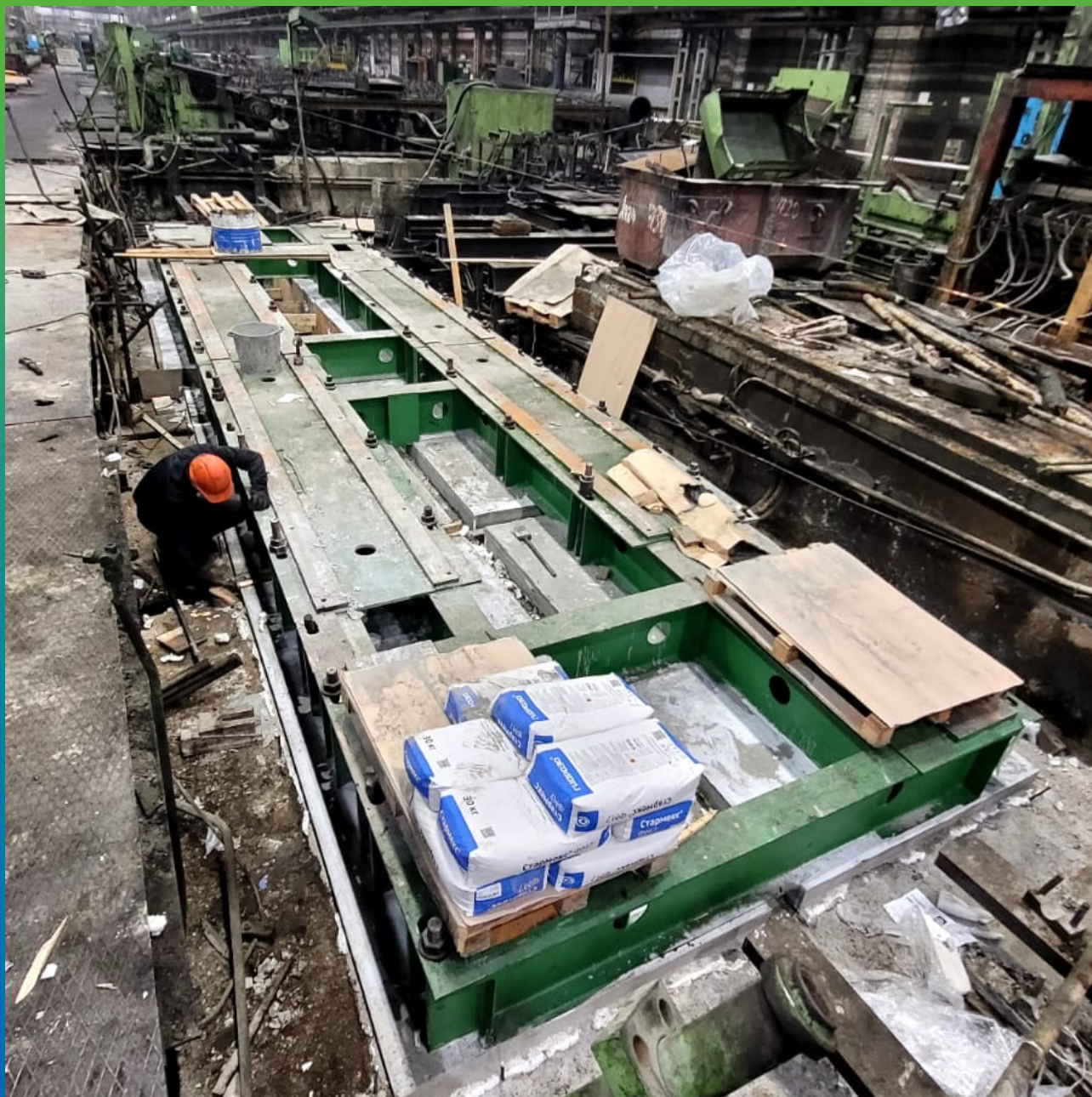
Финишный вид основания под оборудование, выполненного литьевым составом Стармекс ФМ7