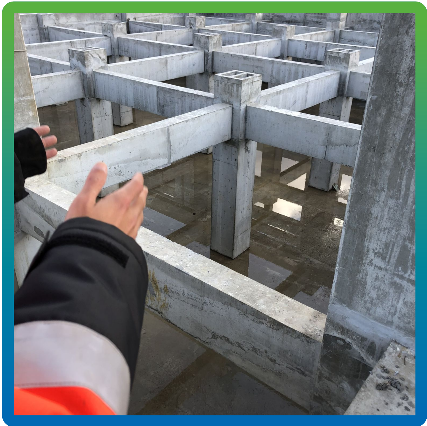
Общий вид конструкций резервуаров