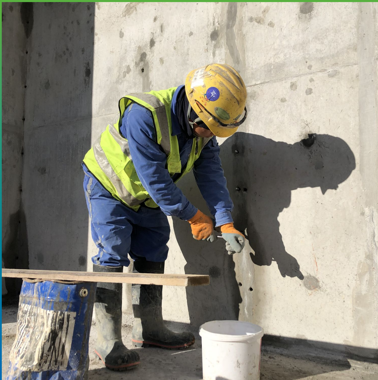
Подготовка трещин к инъектированию