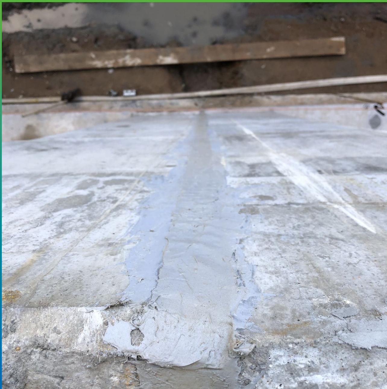
Частный вид герметизированного Манодил ПС 190