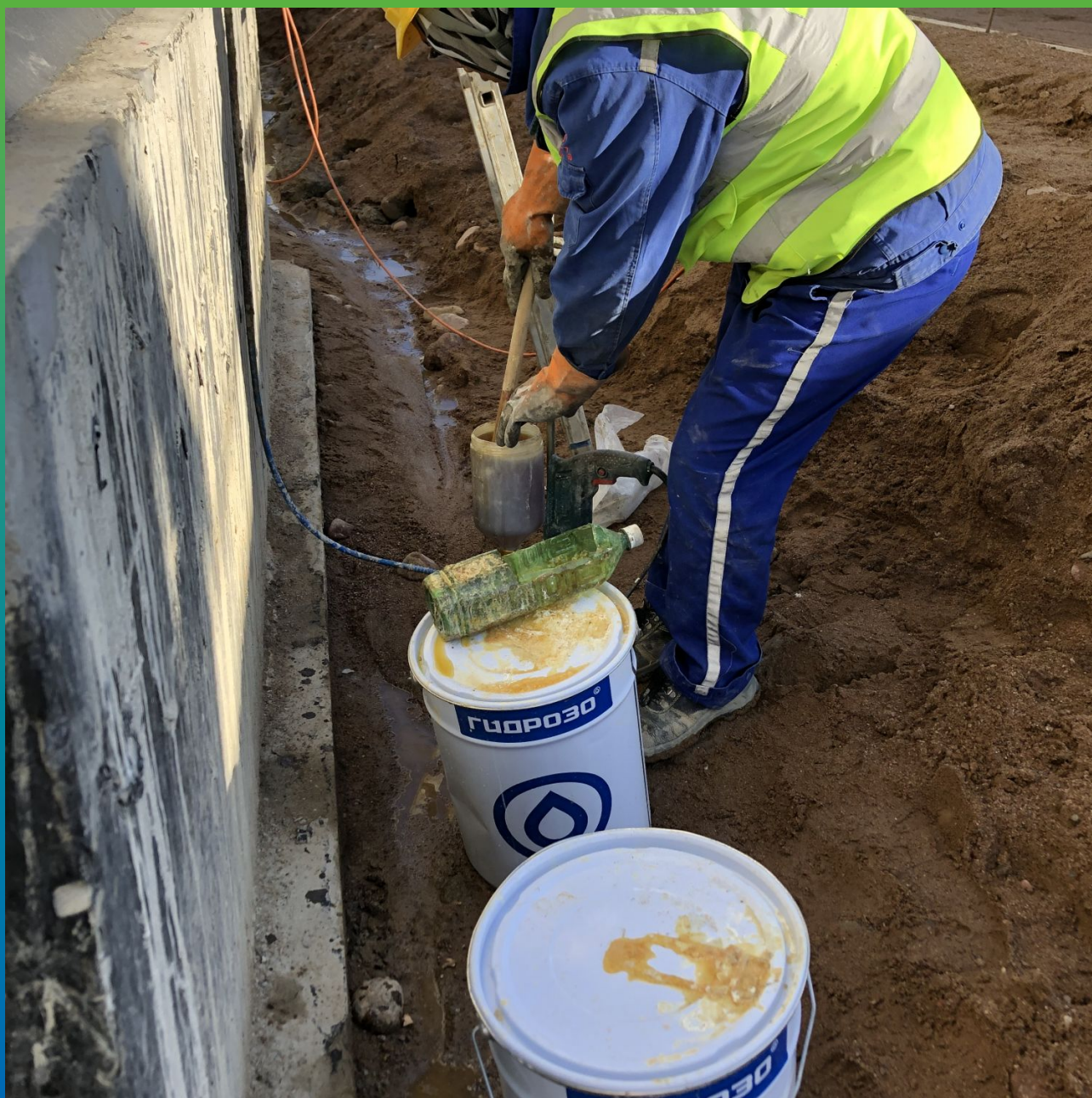
Процесс инъектирования Манопур 15 и Манопур 143