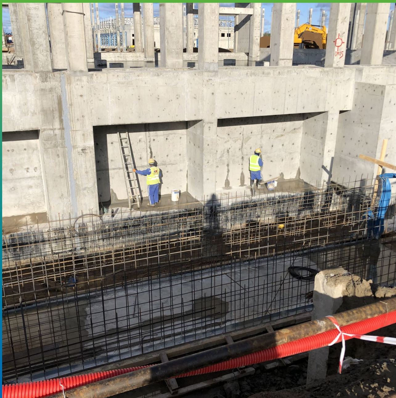
Общий вид шва конструкции герметизированного Манодил ПС 190