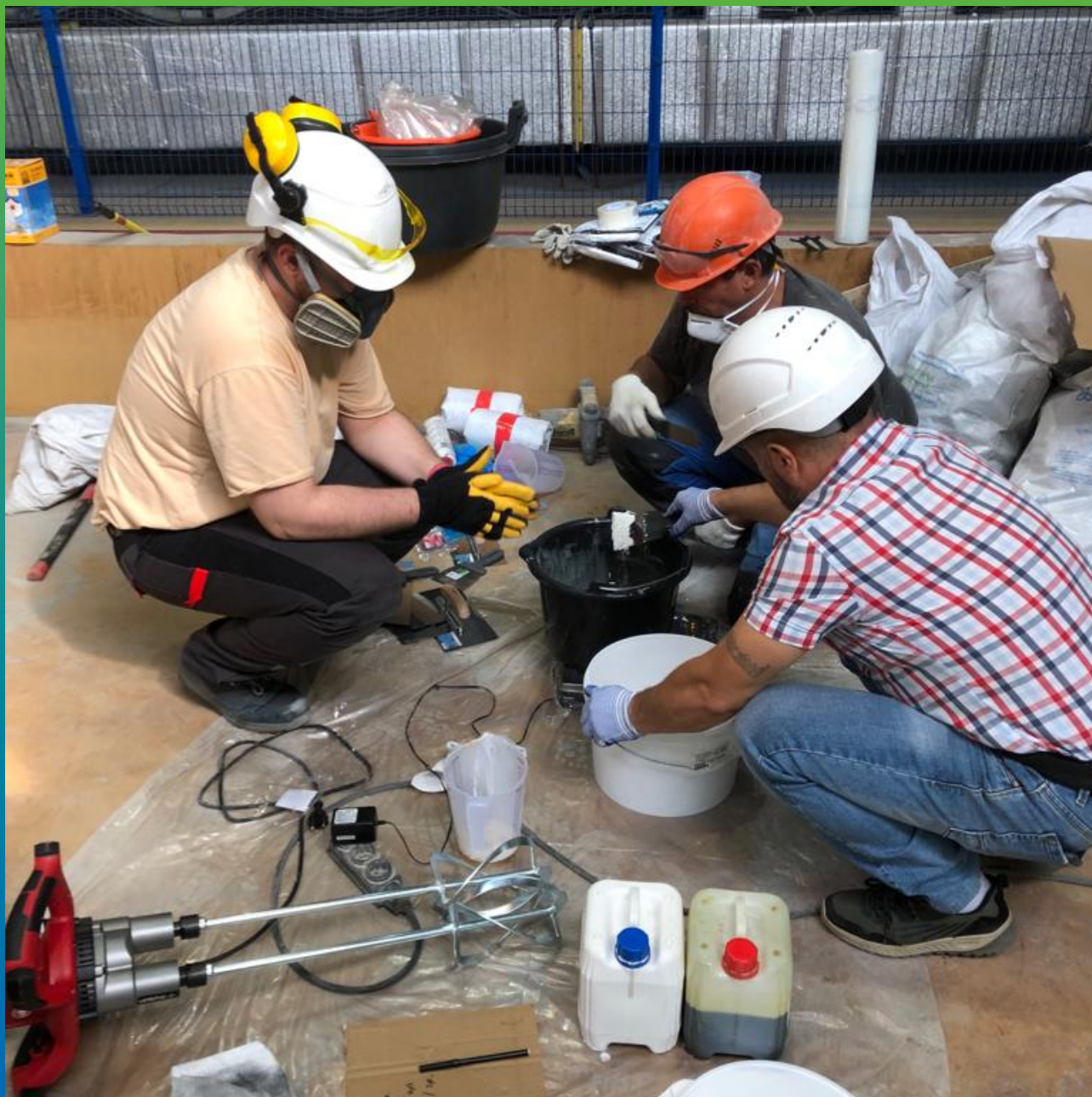
Смешивание компонентов защитного покрытия ДенТоп ПМ 605 ФК