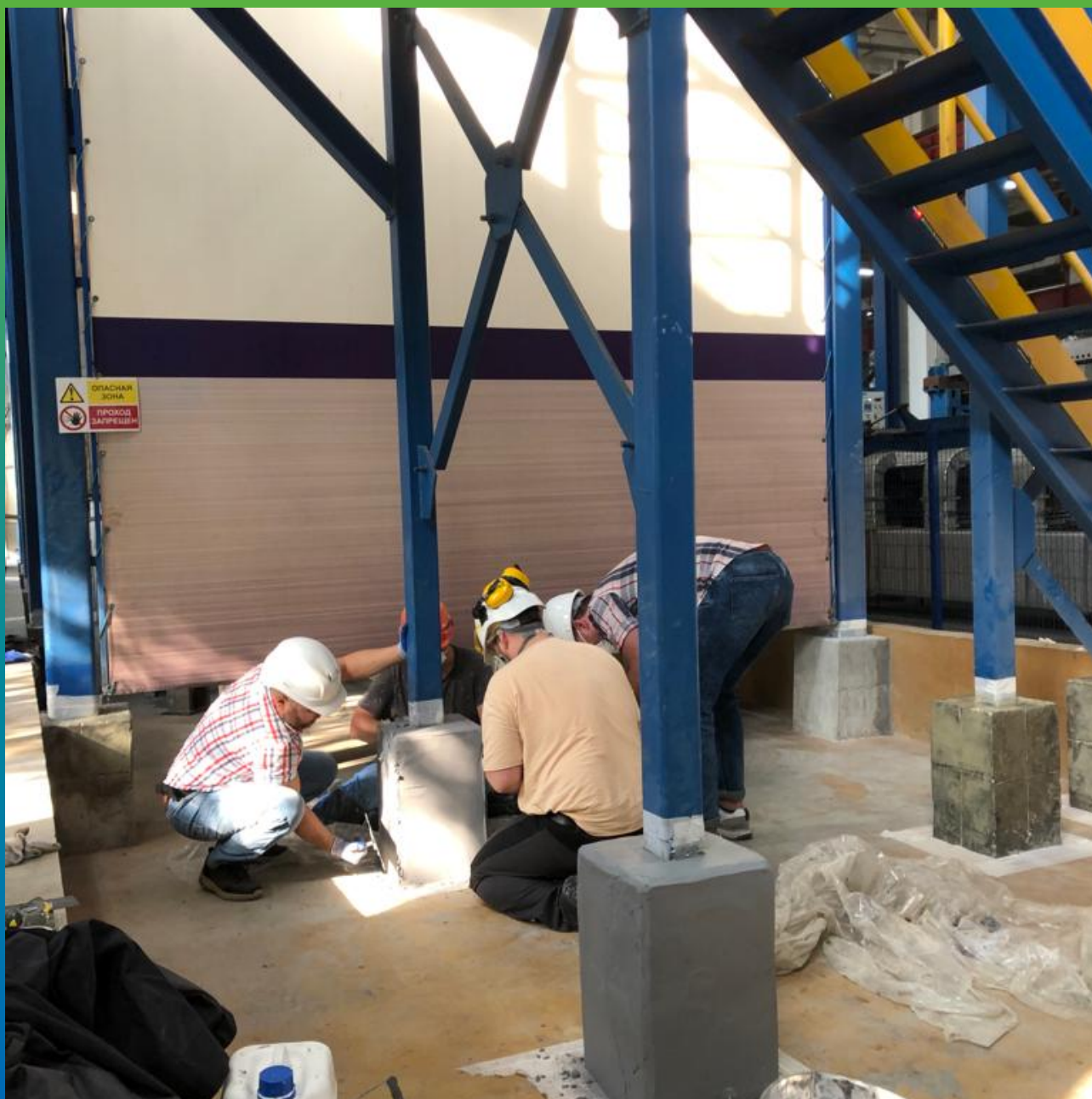
Нанесение защитного покрытия ДенТоп ПМ 605 ФК на конструкцию. Другой вид