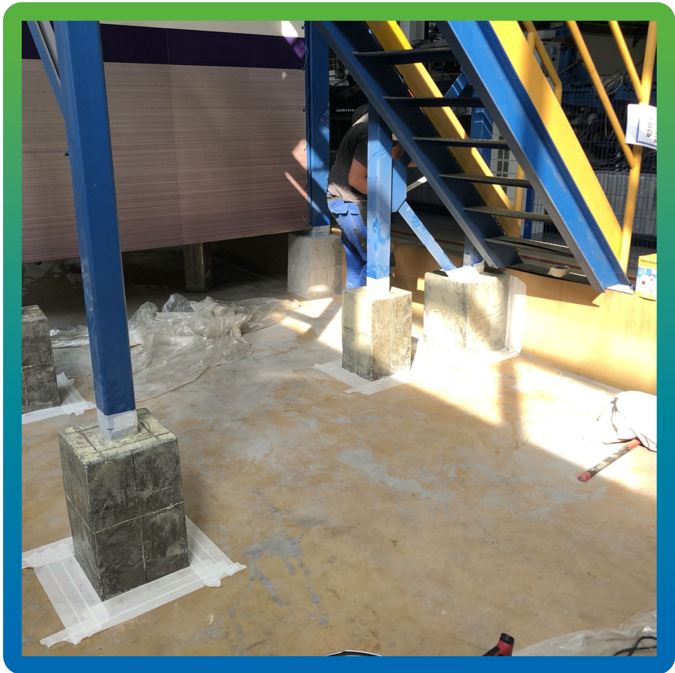
Общий вид участка работ