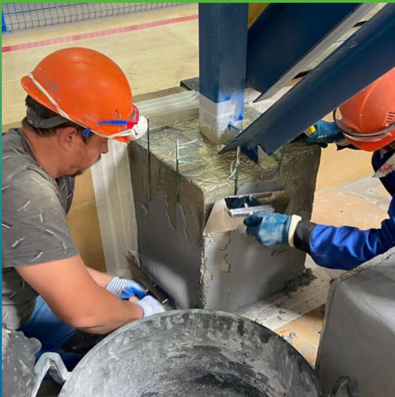
Нанесение защитного покрытия ДенсТоп ПМ 605 ФК на конструкцию