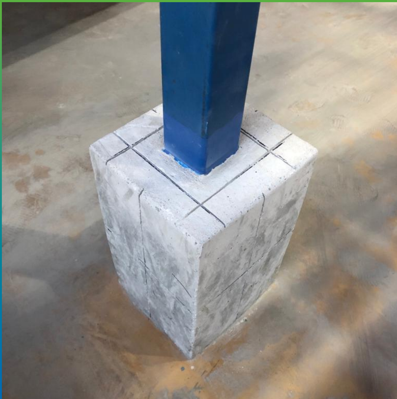
Типовая конструкция подвергаемая защите