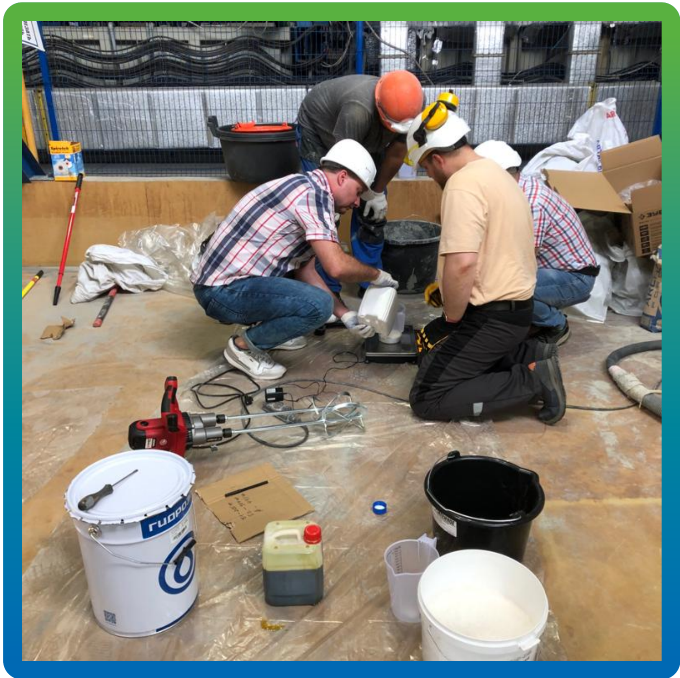
Смешивание компонентов грунтовки