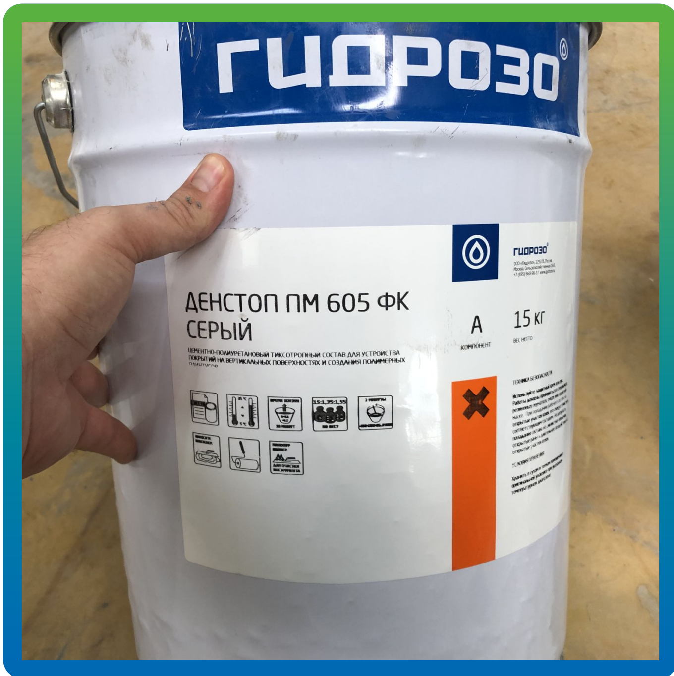
Материалы на объекте