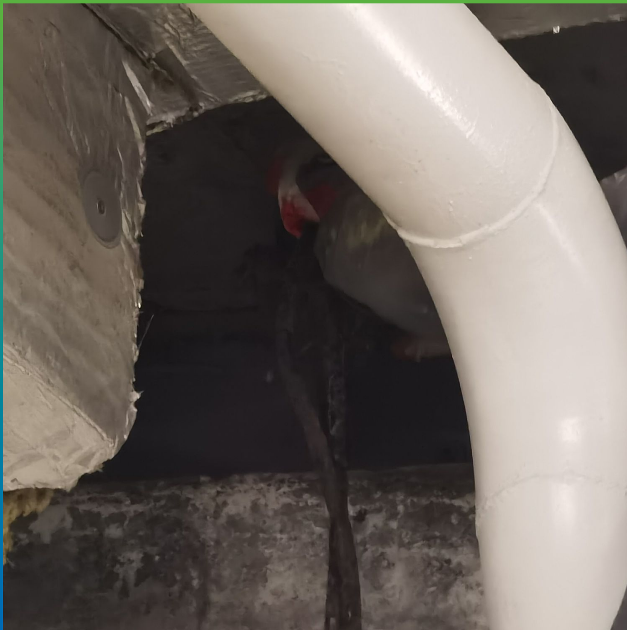
Контроль заполнения шва эластичным материалом Манокрил Гель