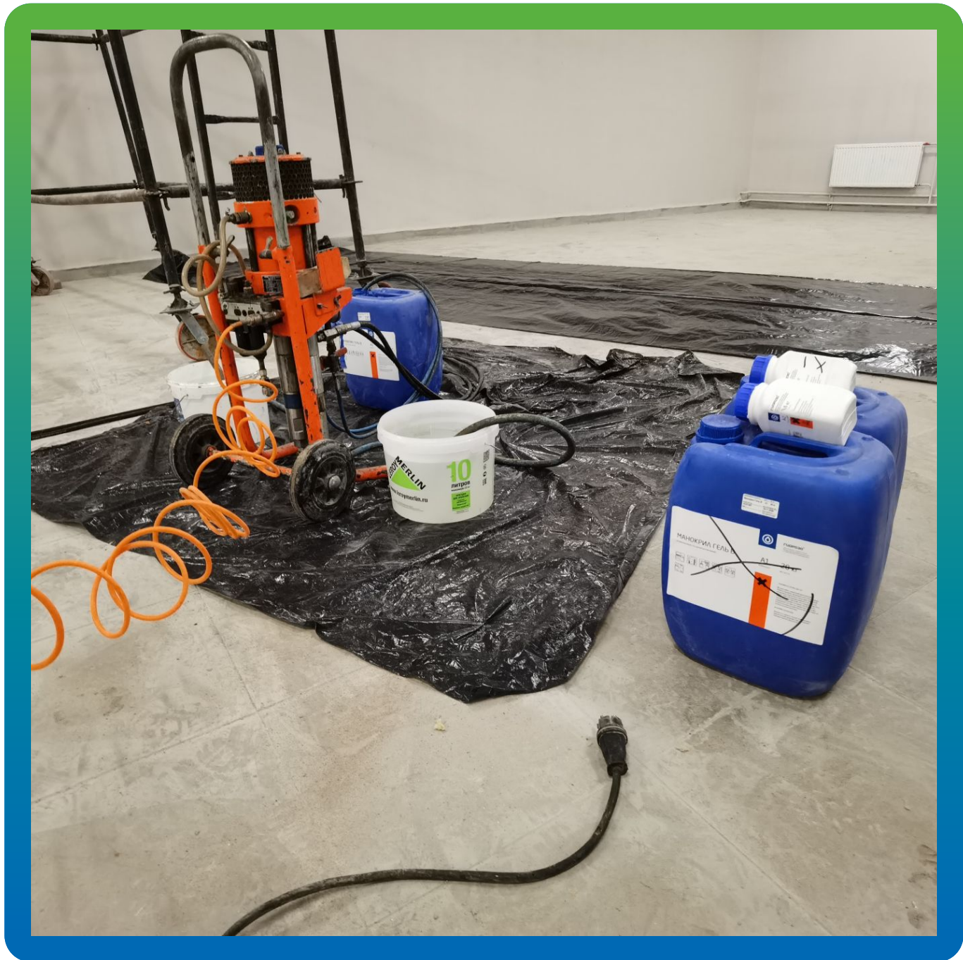
Подготовка материалов к работам