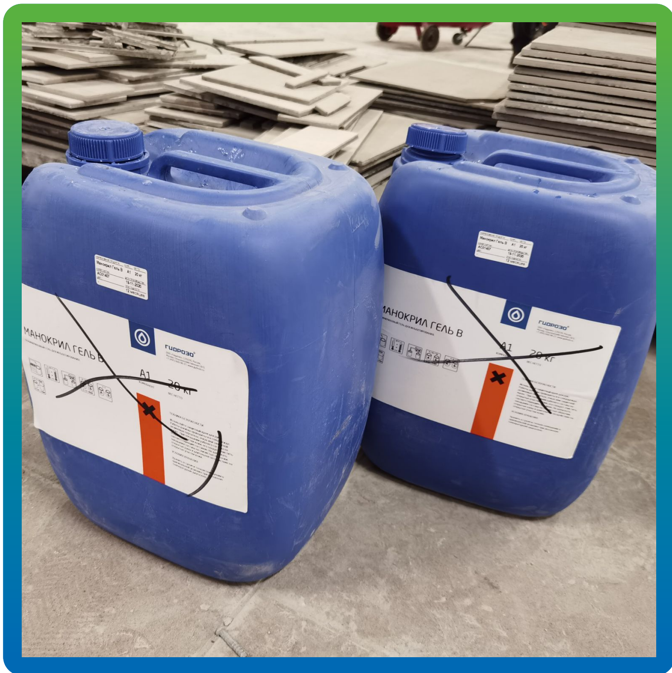
Материалы на объекте