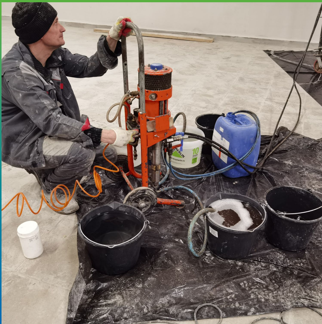
Проведение работ по заполнению деформационных швов