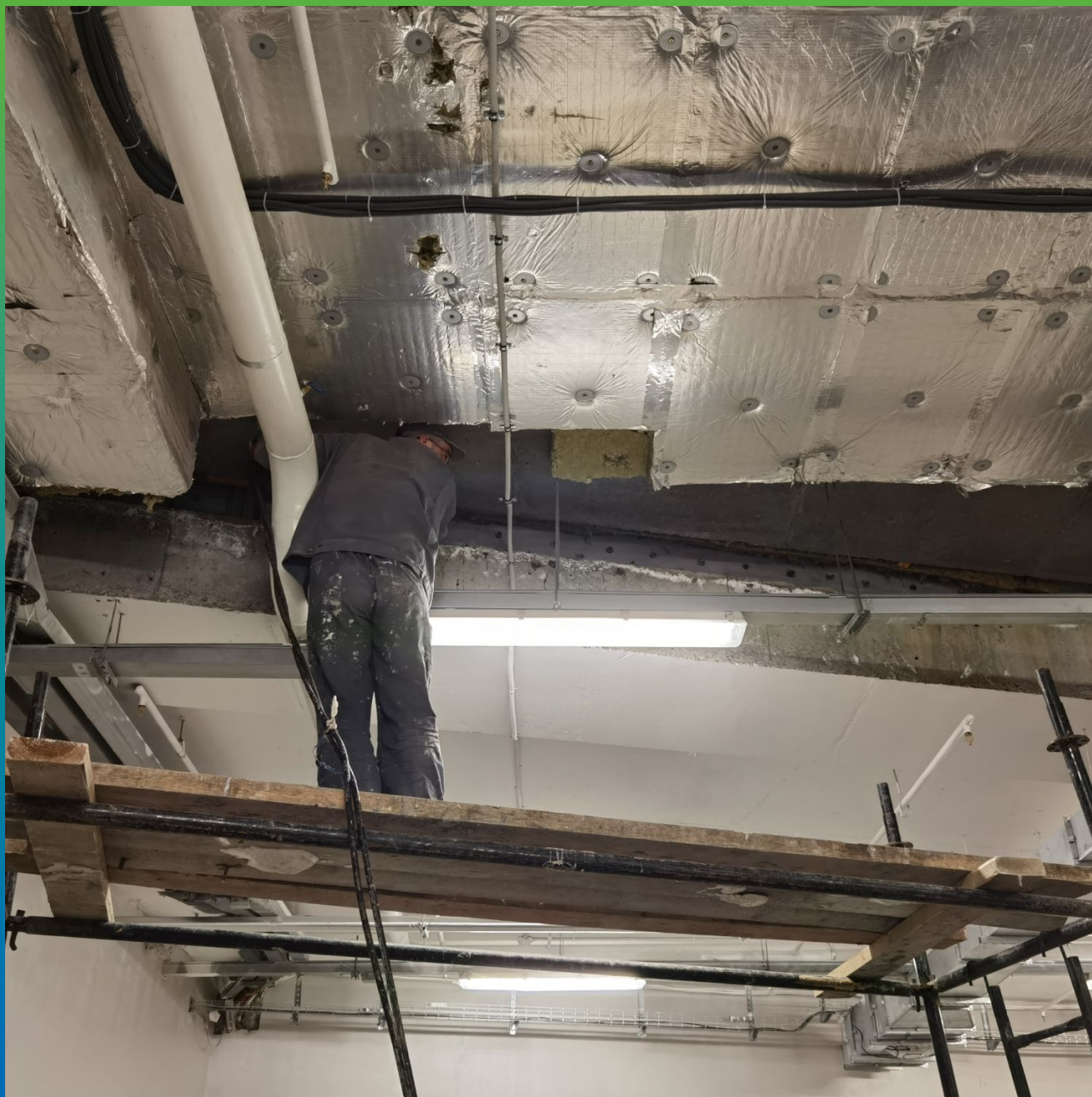
Работа на лесах