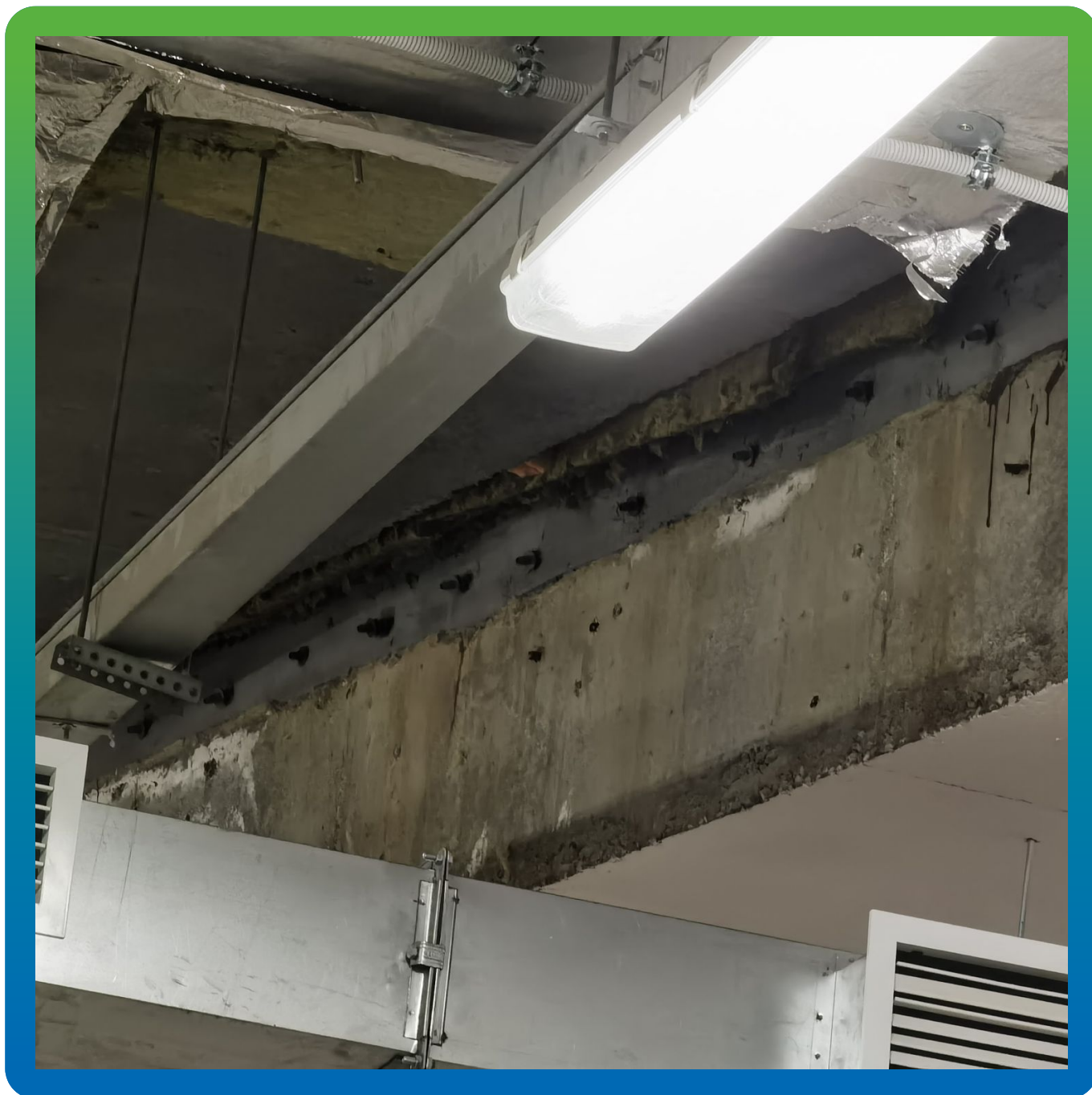
Участок после проведения работ