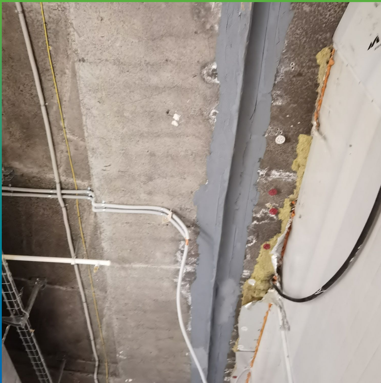
Объект после проведения работ