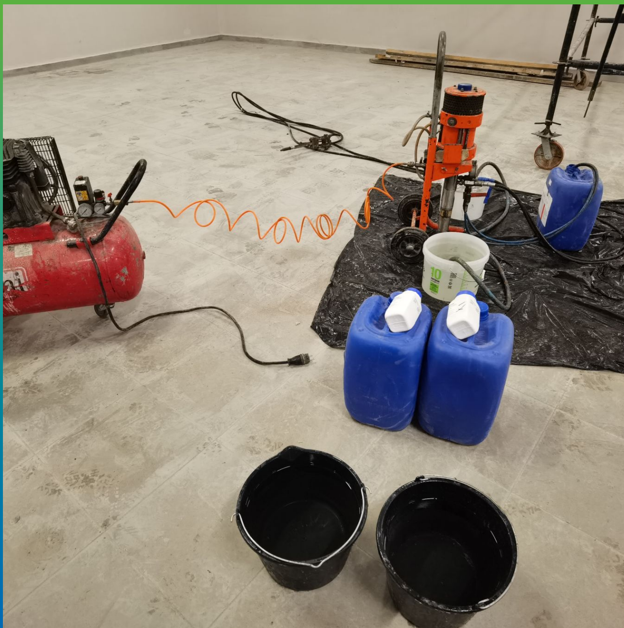
Подготовка оборудования к работам