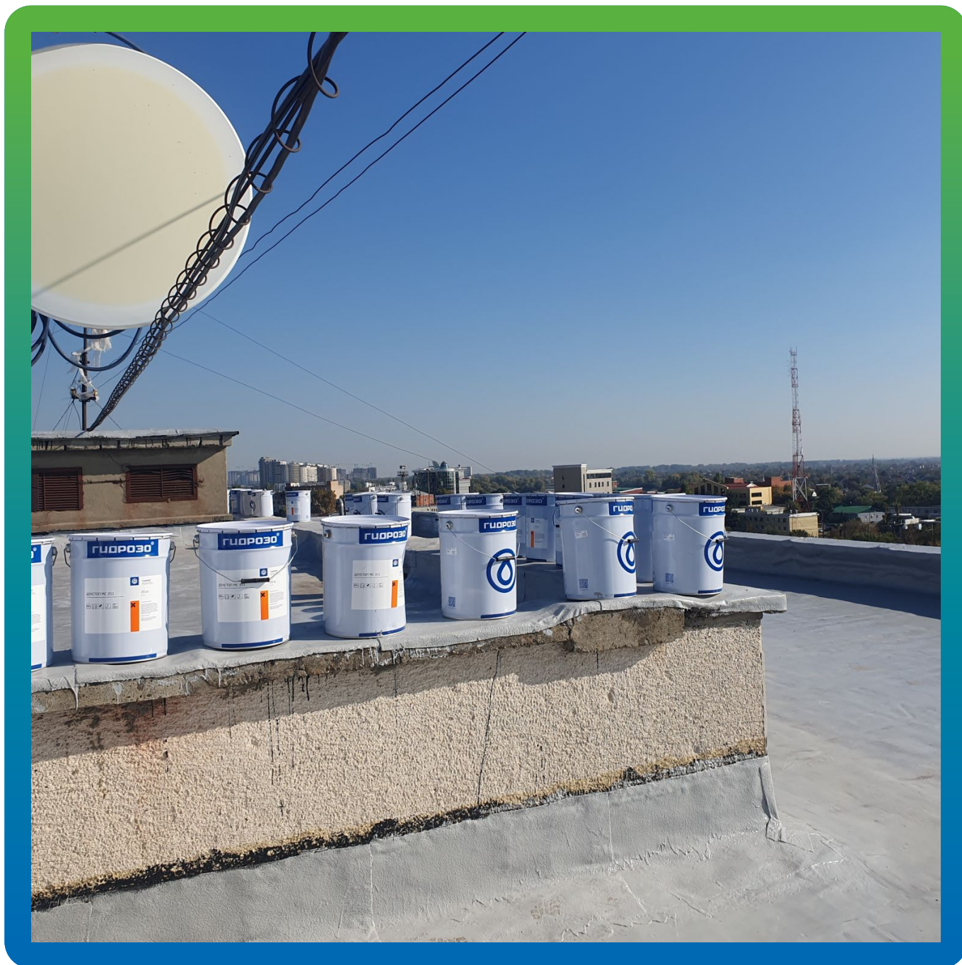
Материалы на объекте