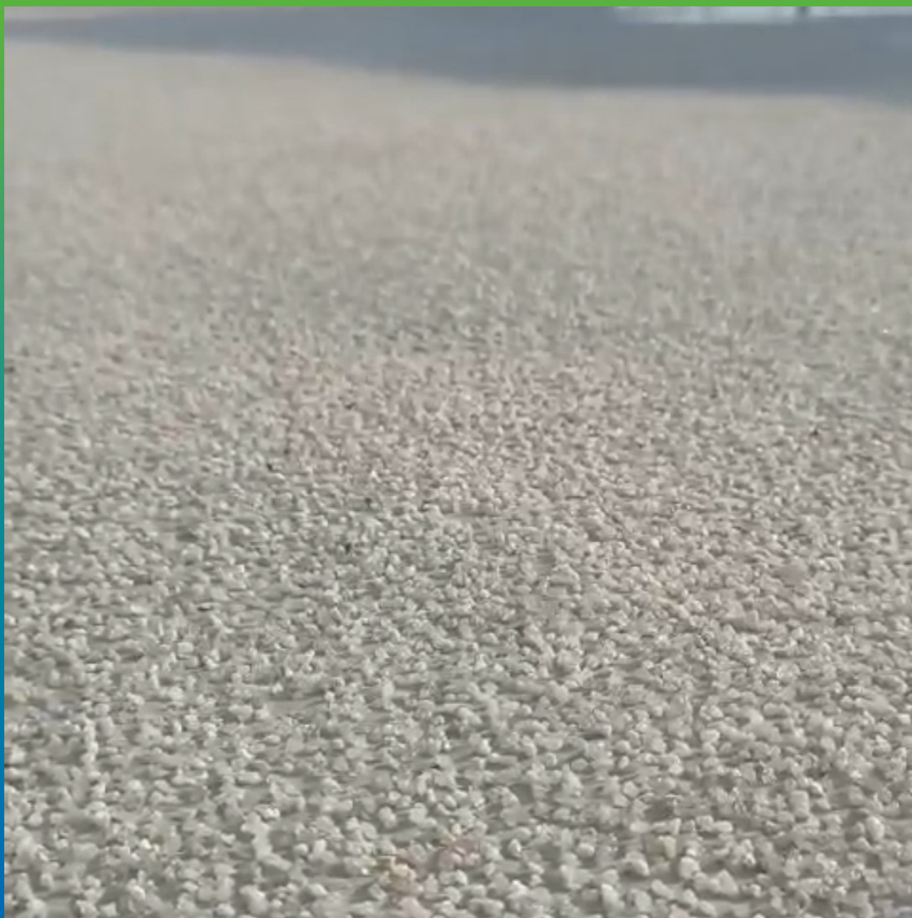
Вид финишного покрытия

Кубанский государственный медицинский университет