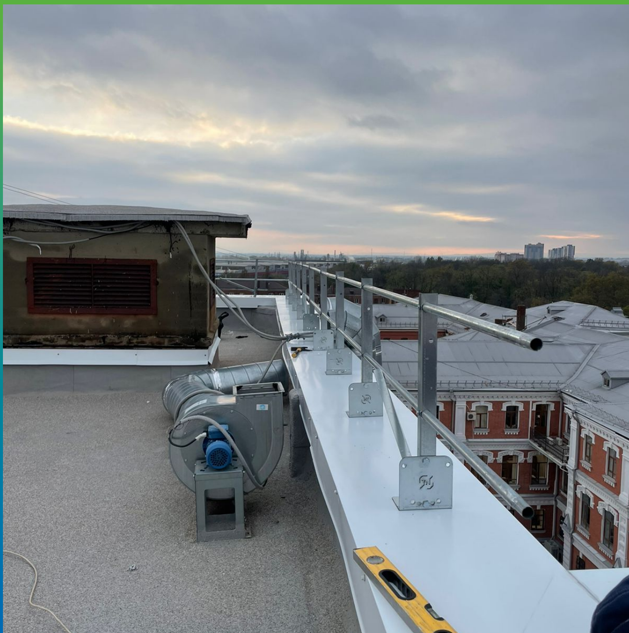
Установка наружных ограждений