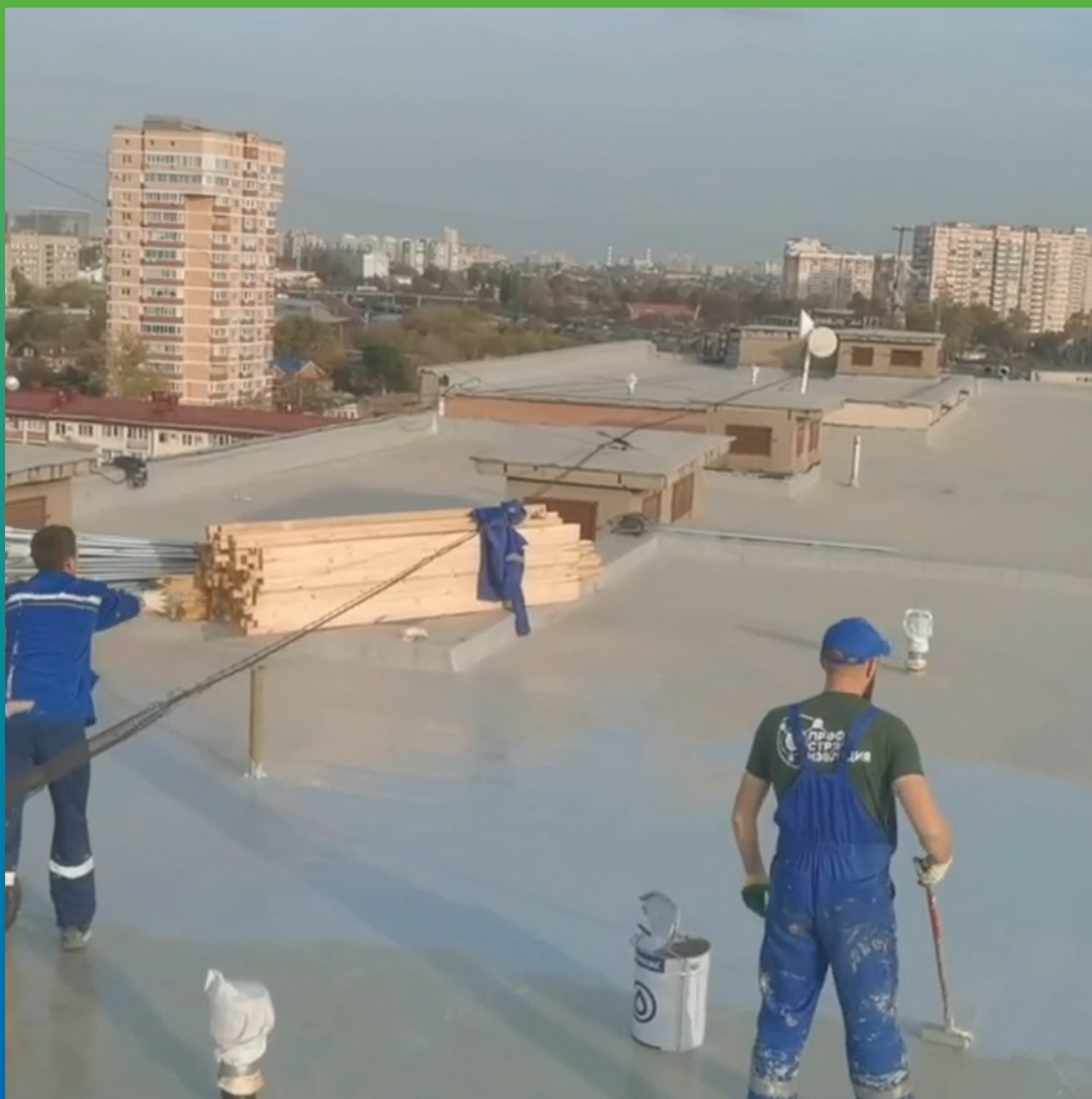
Нанесение финишного слоя ДенсТоп МС351 с присыпкой кварцевым песком