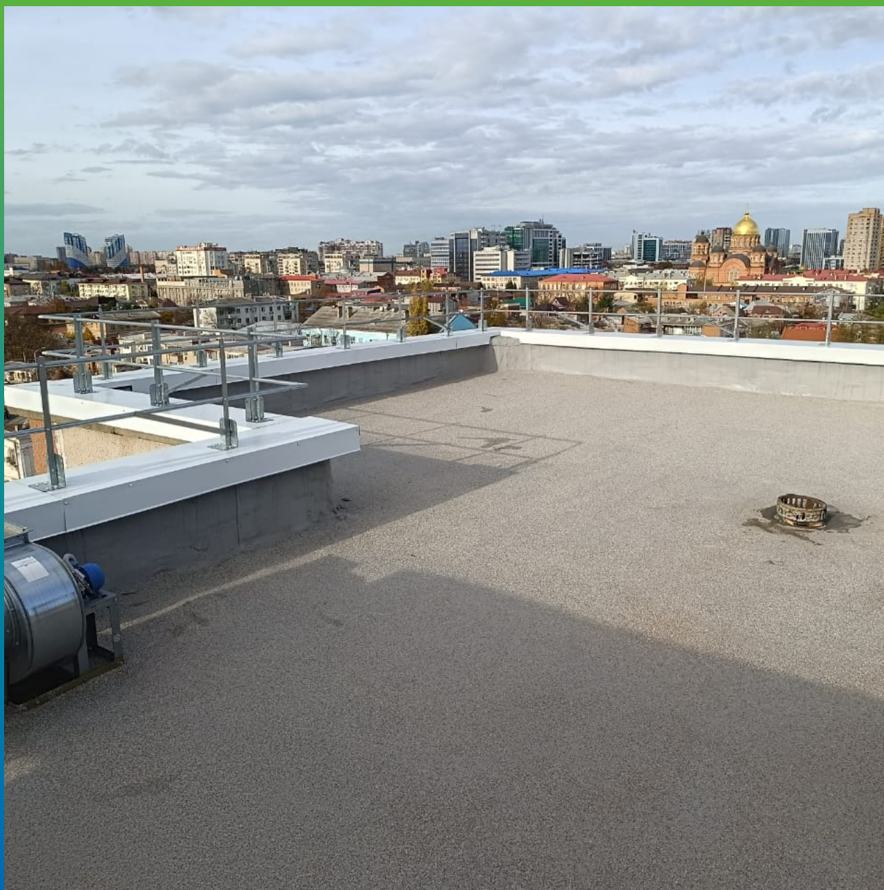
Вид готовой кровли