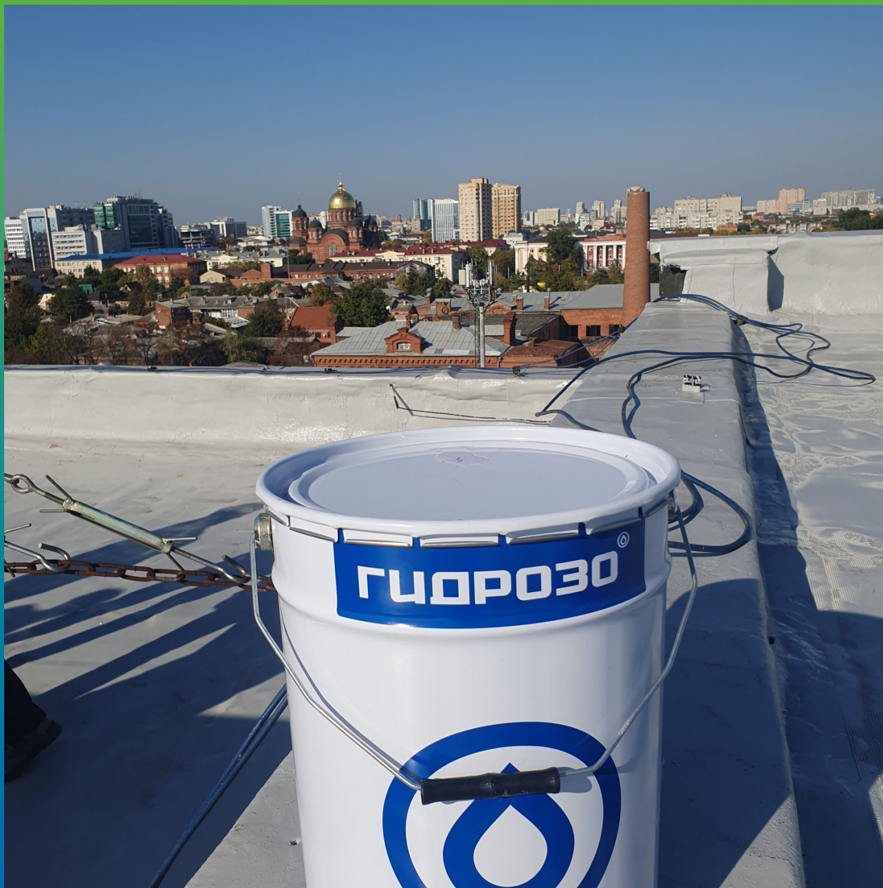
Материалы на объекте