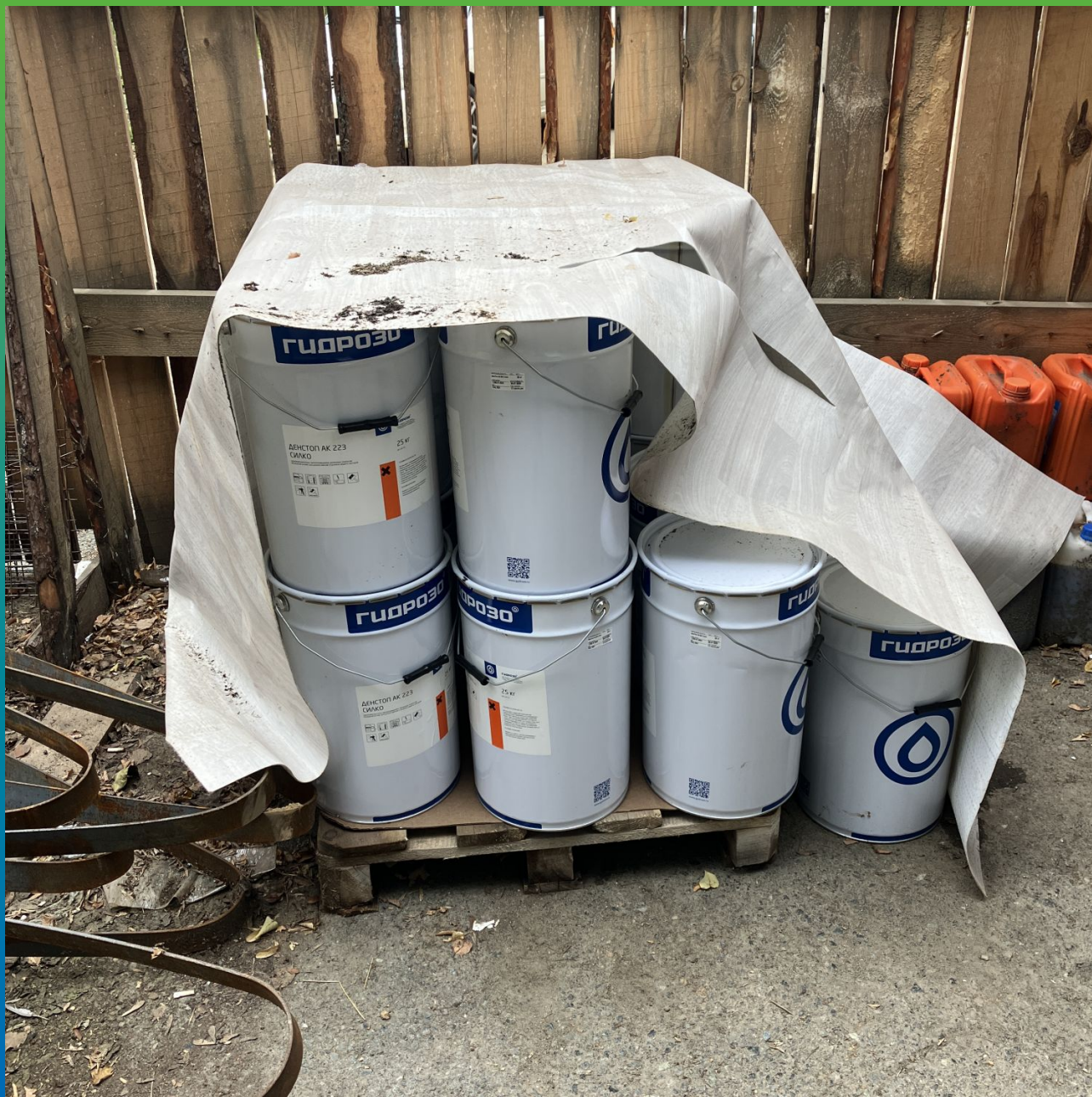
Денстоп АК 223 Силко на объекте