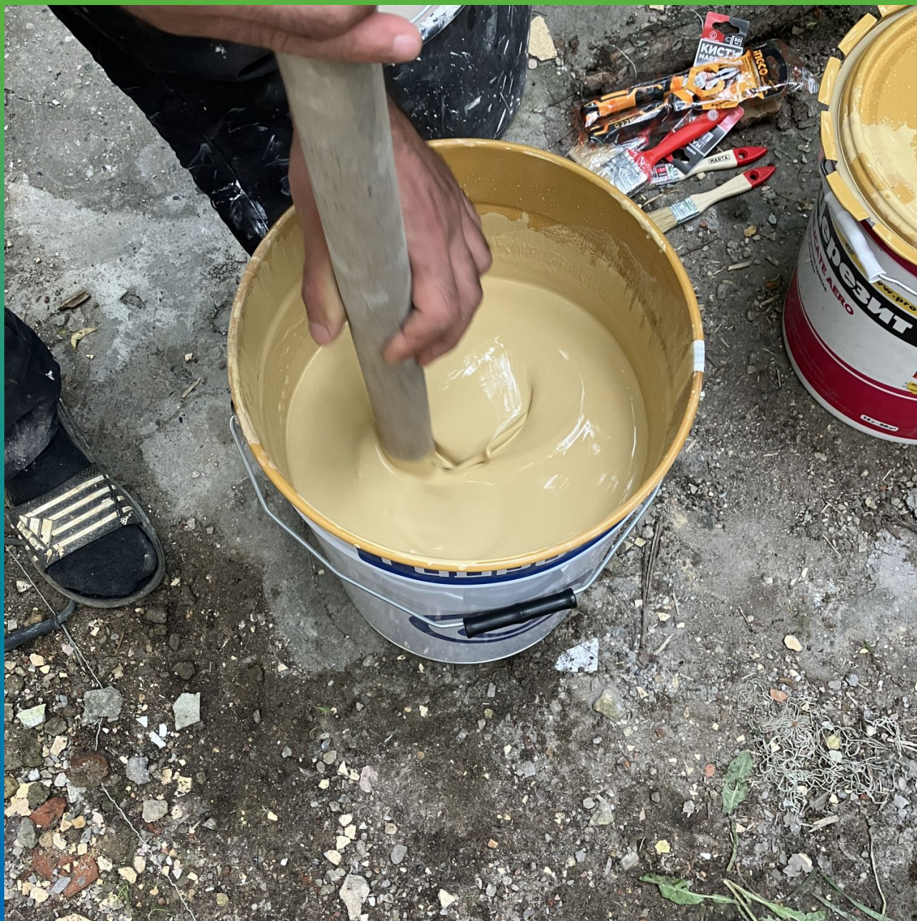
Подготовка к покраске