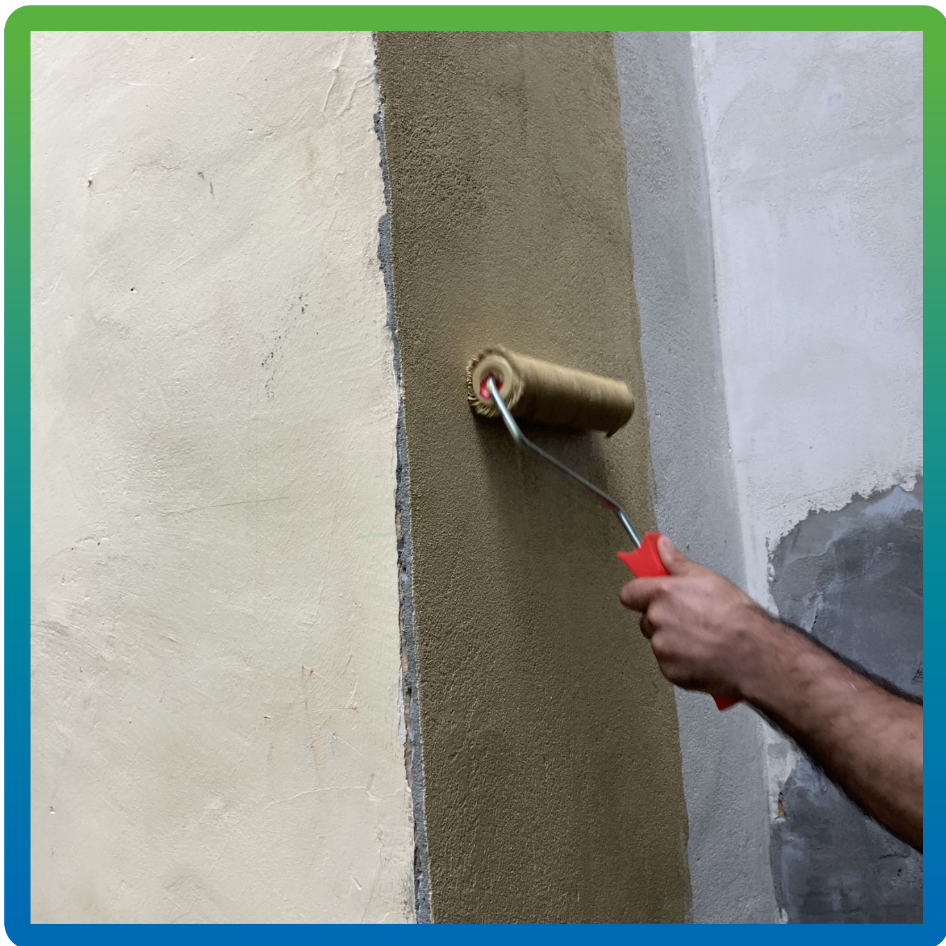
Нанесение Денстоп АК 223 Силко