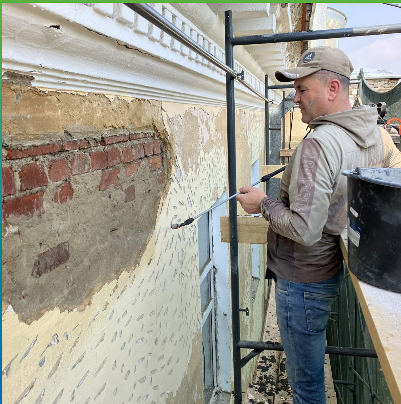
Грунтование поверхности Маногард ПСМ