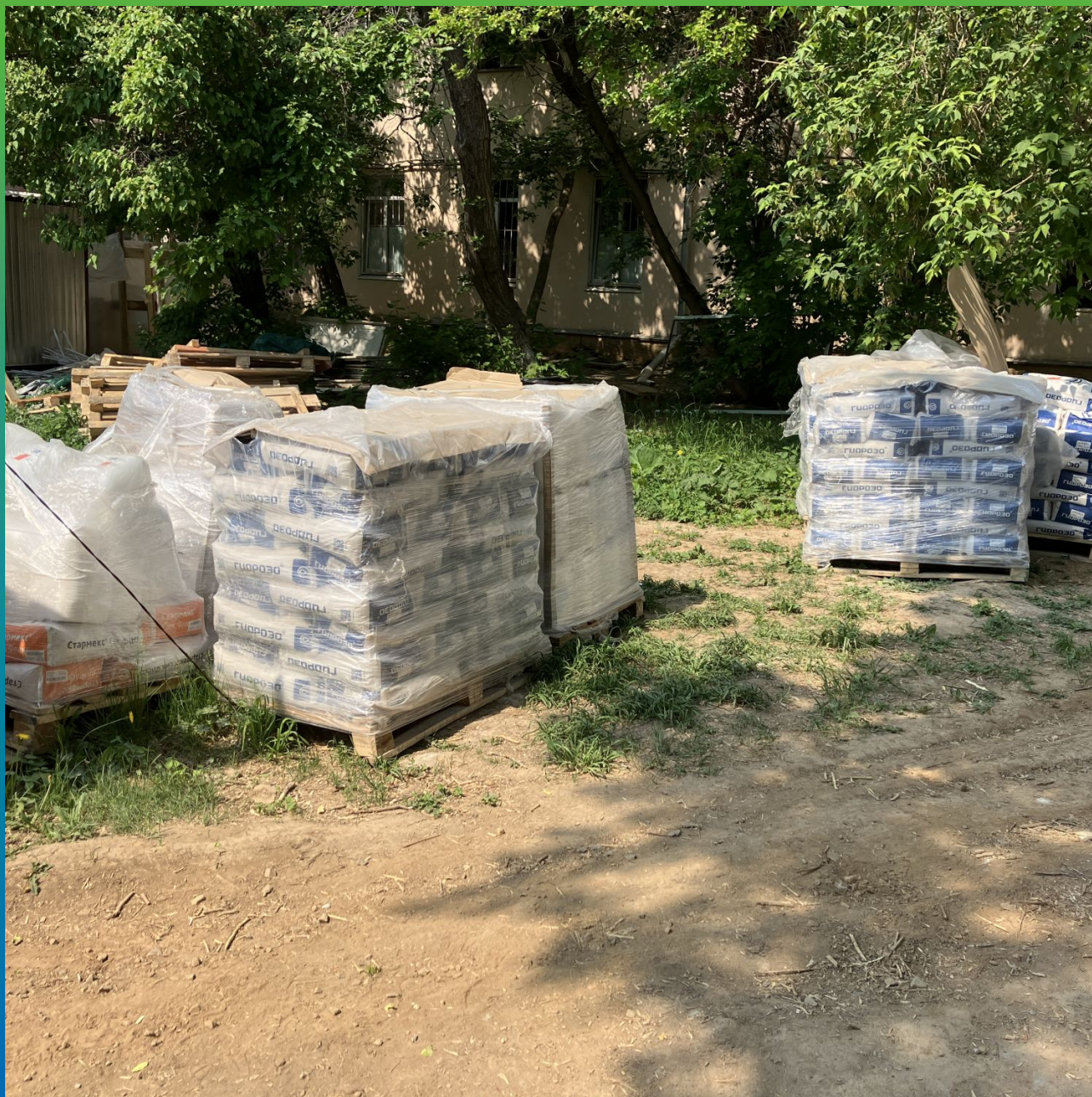
Материалы Гидрозо на объекте