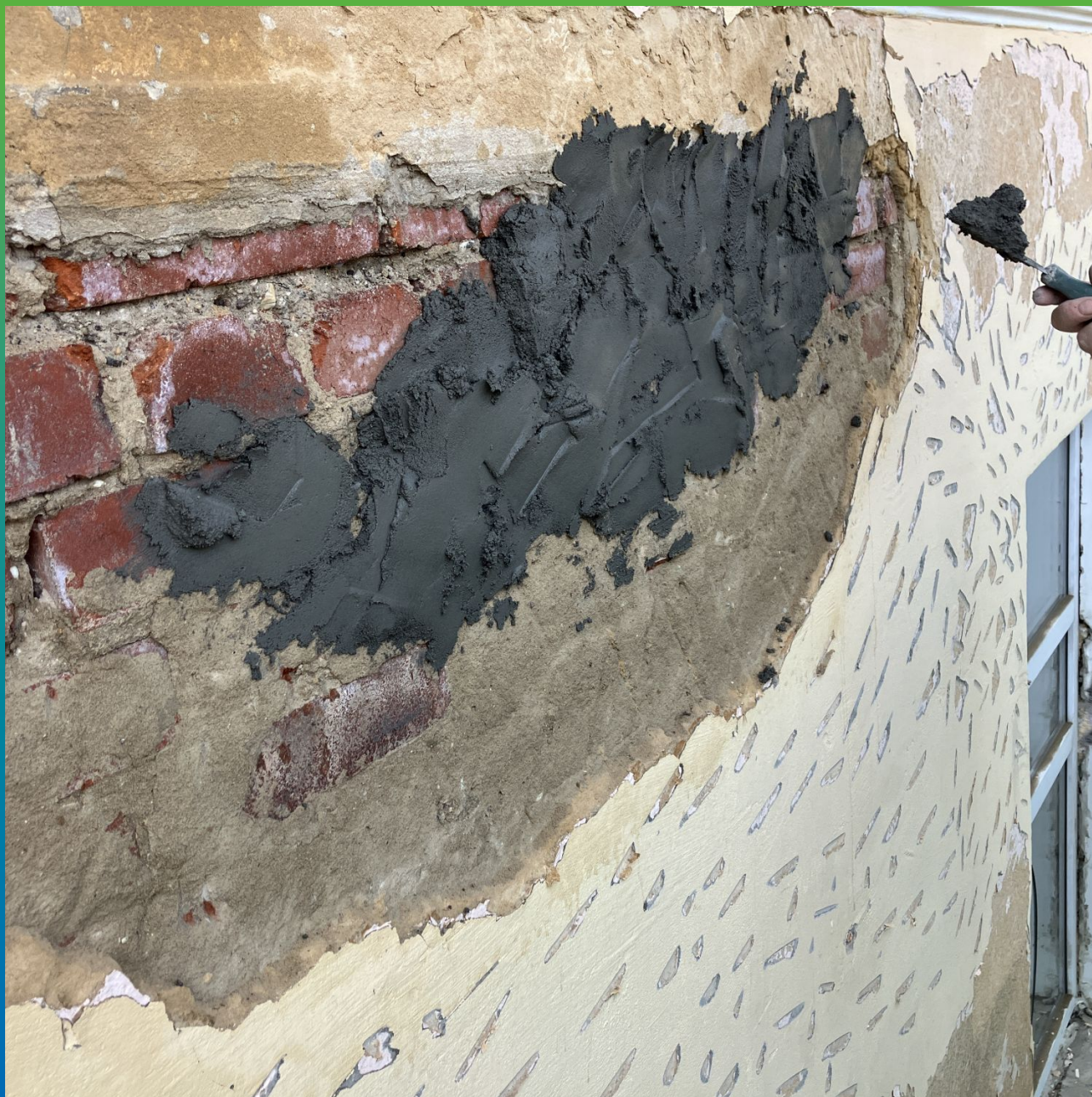
Нанесение Стармекс Лайм С