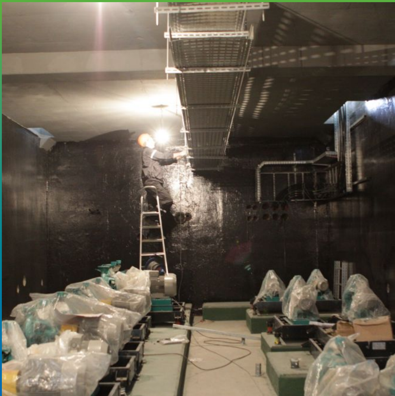
Вид стен с нанесённой гидроизоляцией