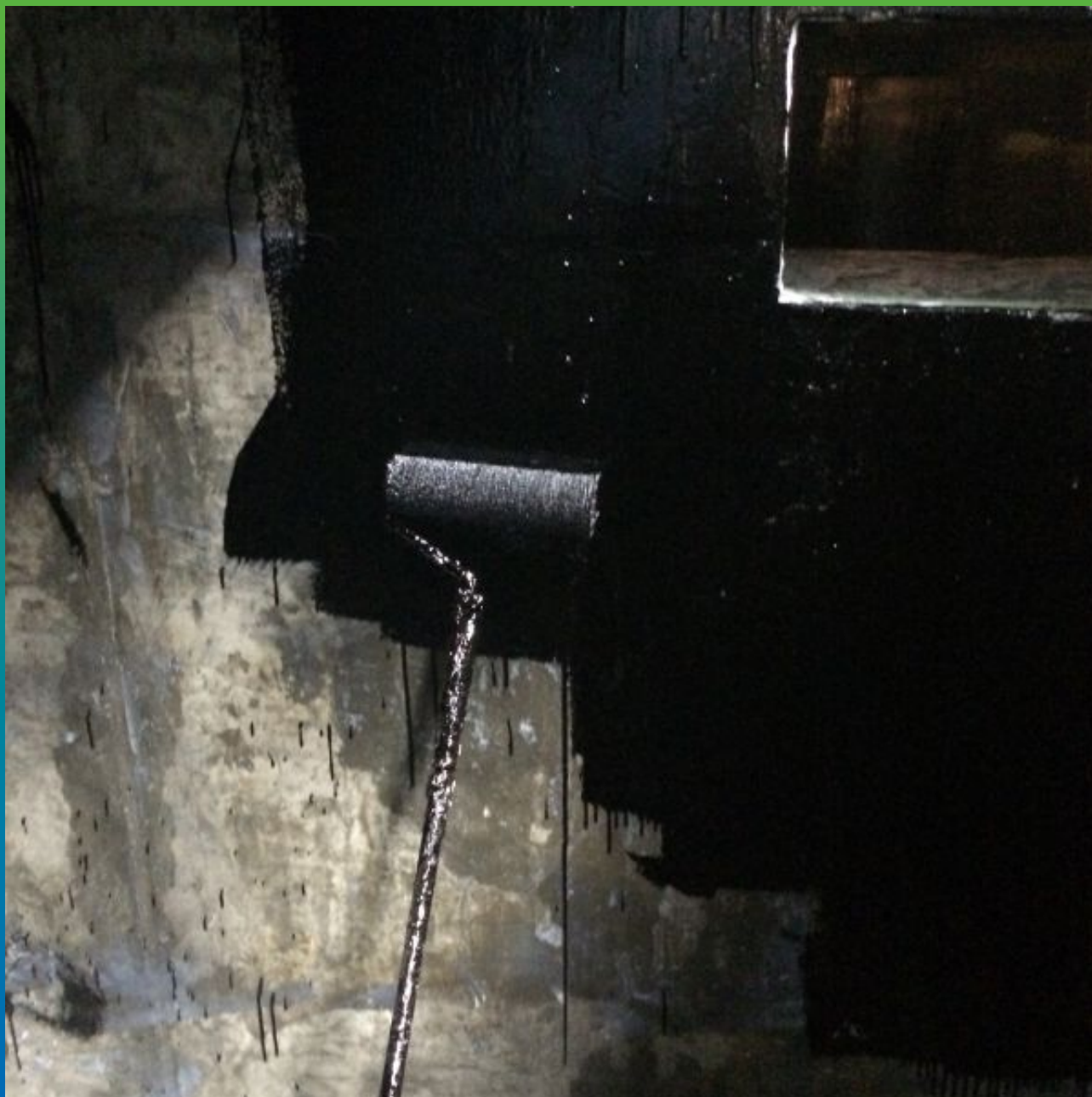
Нанесение грунтовочного слоя Максэпокс Тар