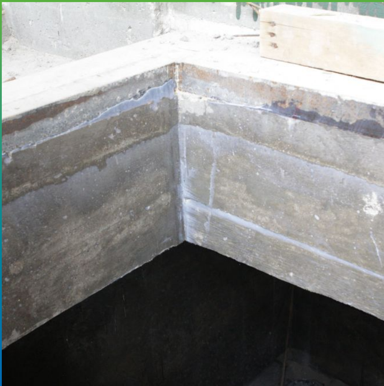
Вид подготовленной поверхности