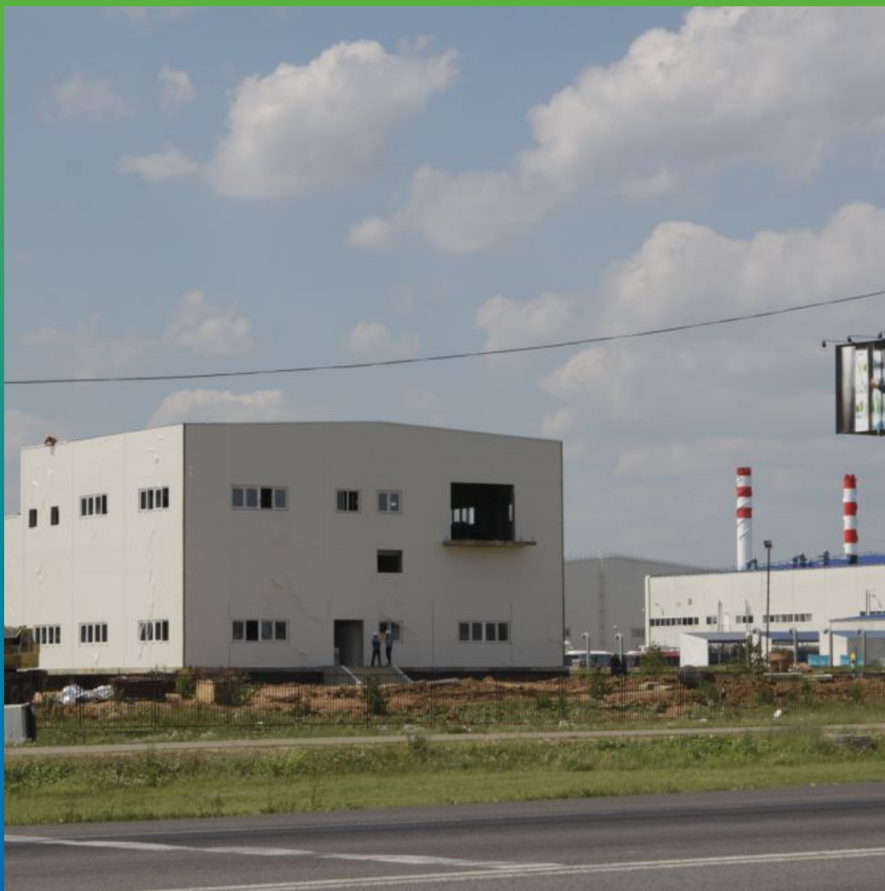
Общий вид очистных сооружений снаружи