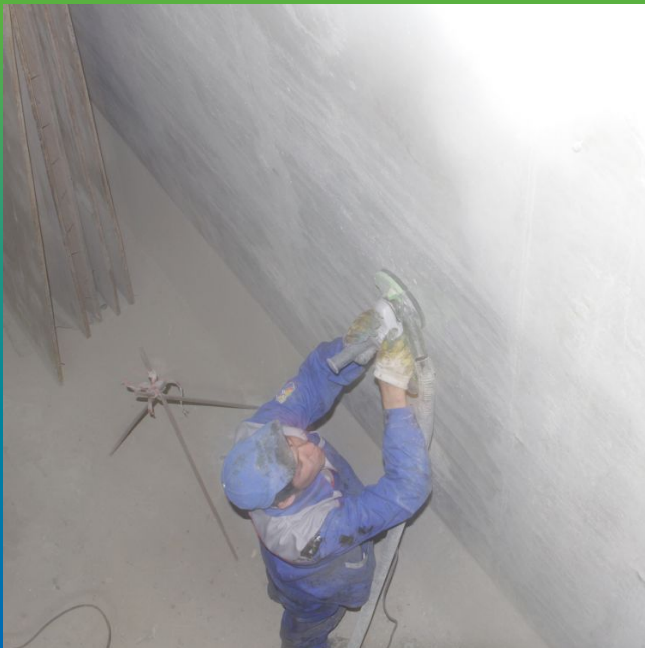
Подготовка поверхности (шлифование стен)