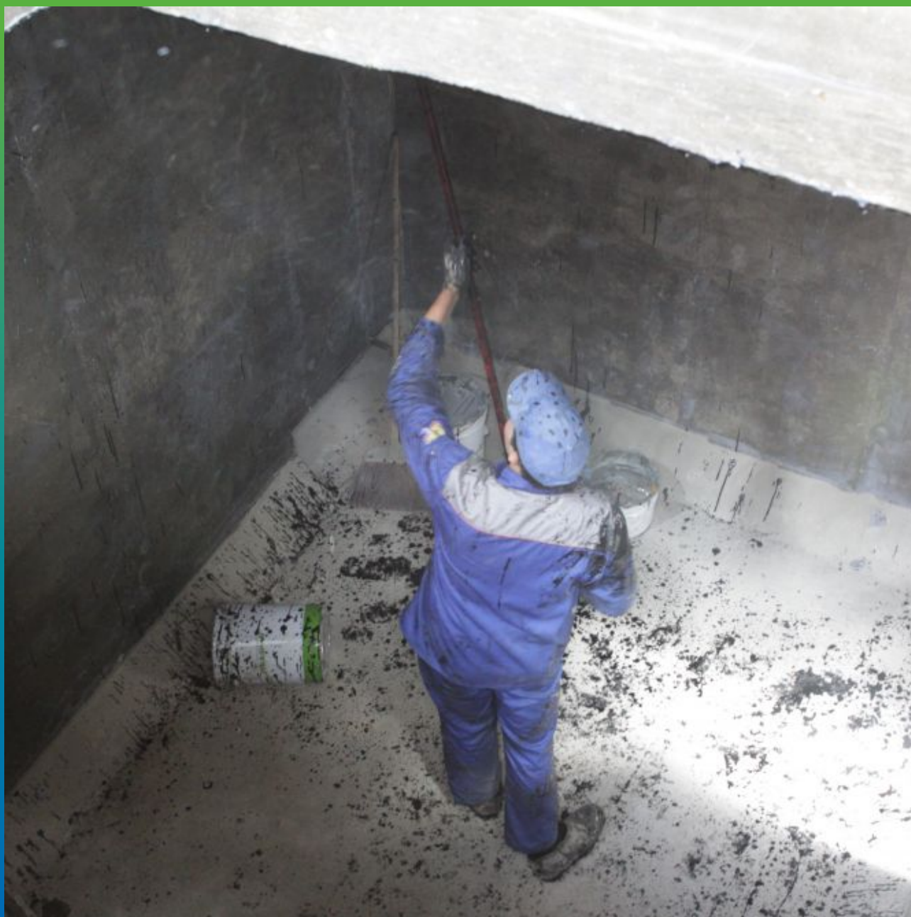
Подготовка поверхности (ремонт эпоксидным составом)