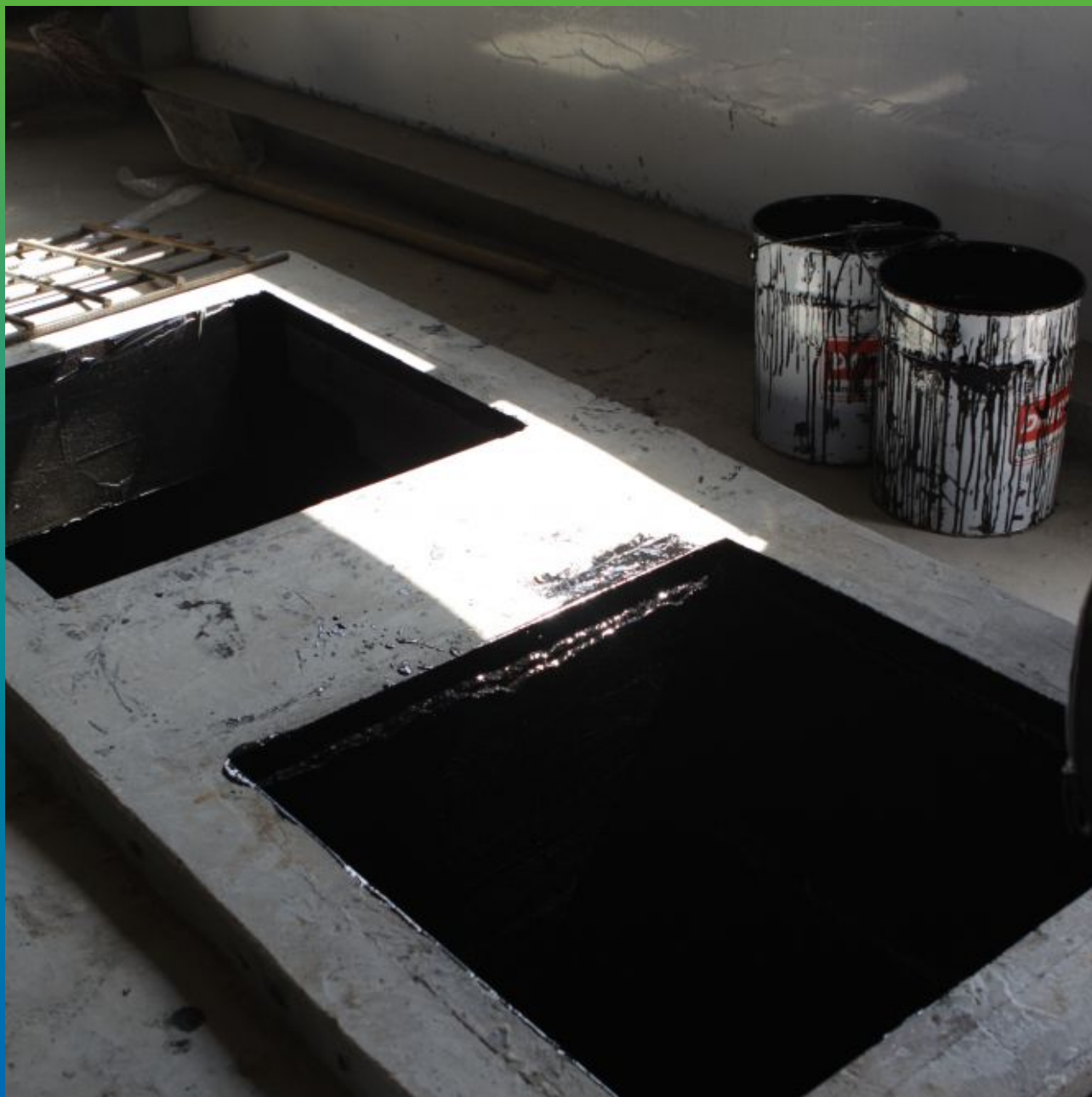
Вид выполненного объекта