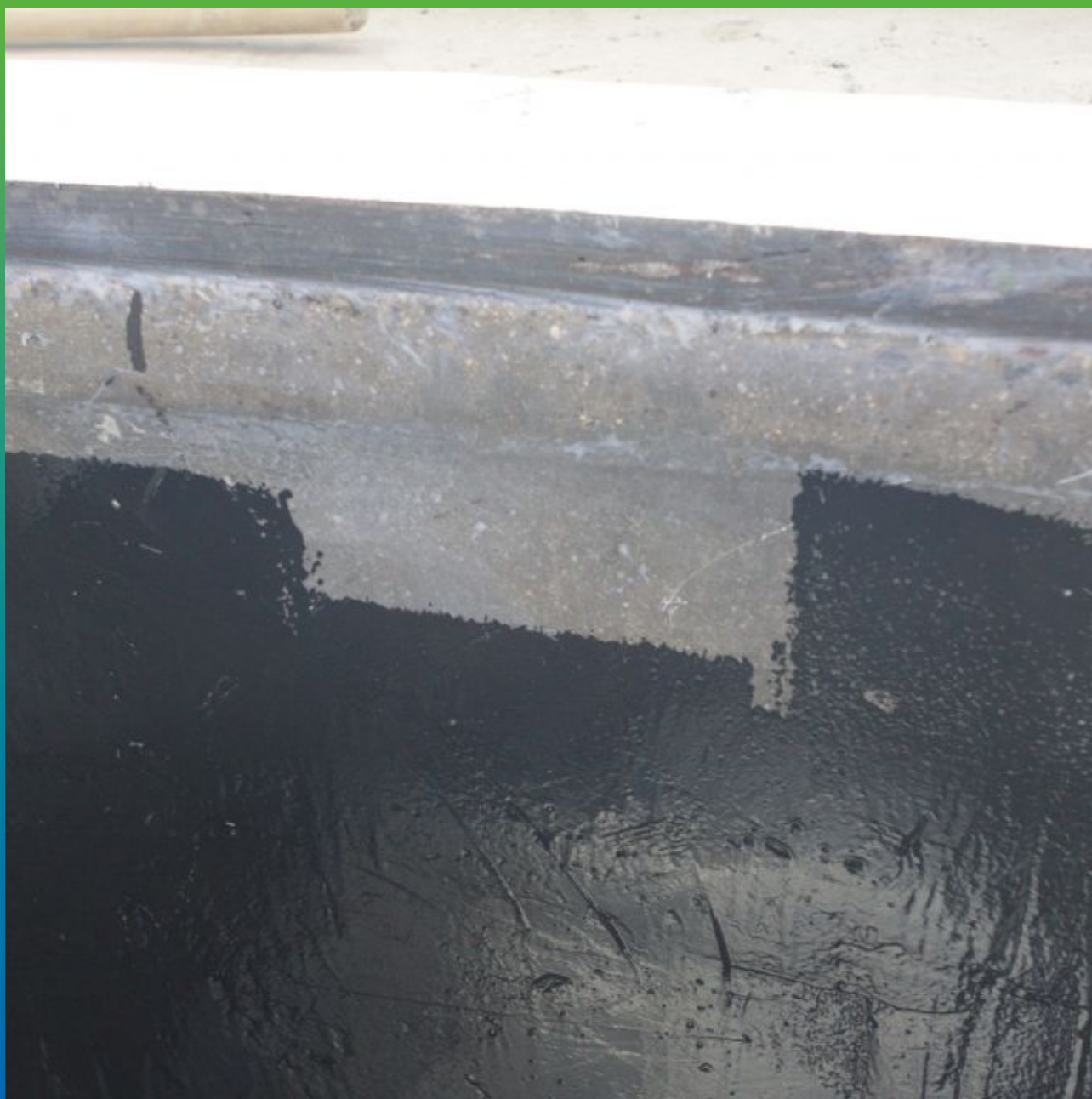
Вид нанесенного грунтовочного слоя Маэпокс Тар