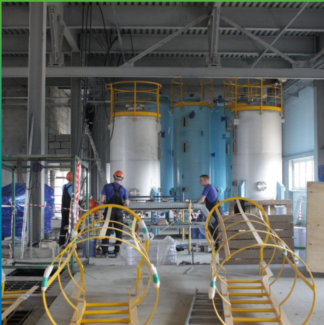
Общий вид очистных сооружений изнутри