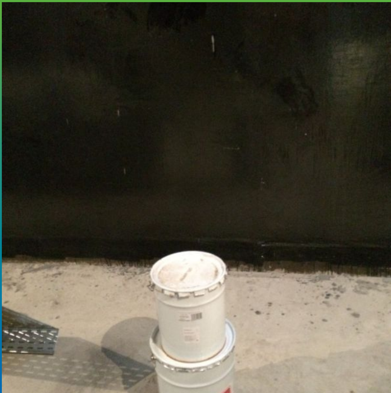
Вид стен с нанесённой гидроизоляцией