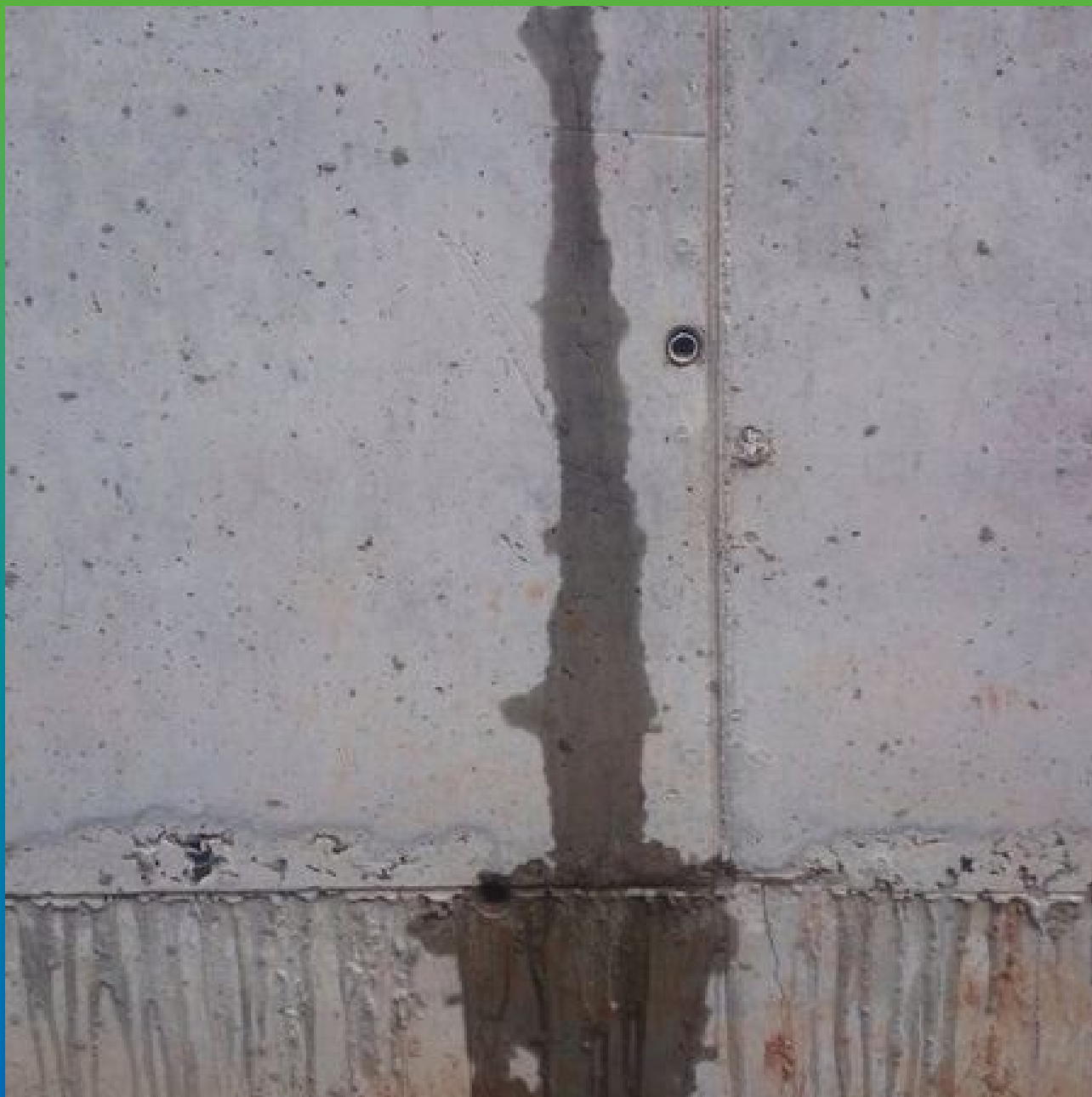
Активные протечки воды из трещин