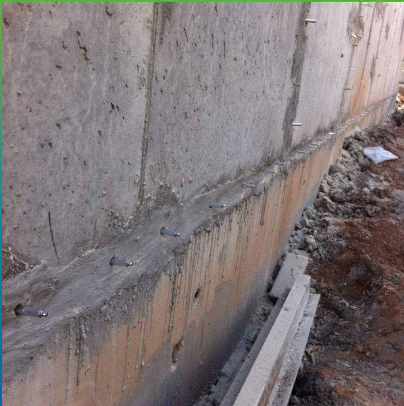
Подготовленный к инъектированию участок