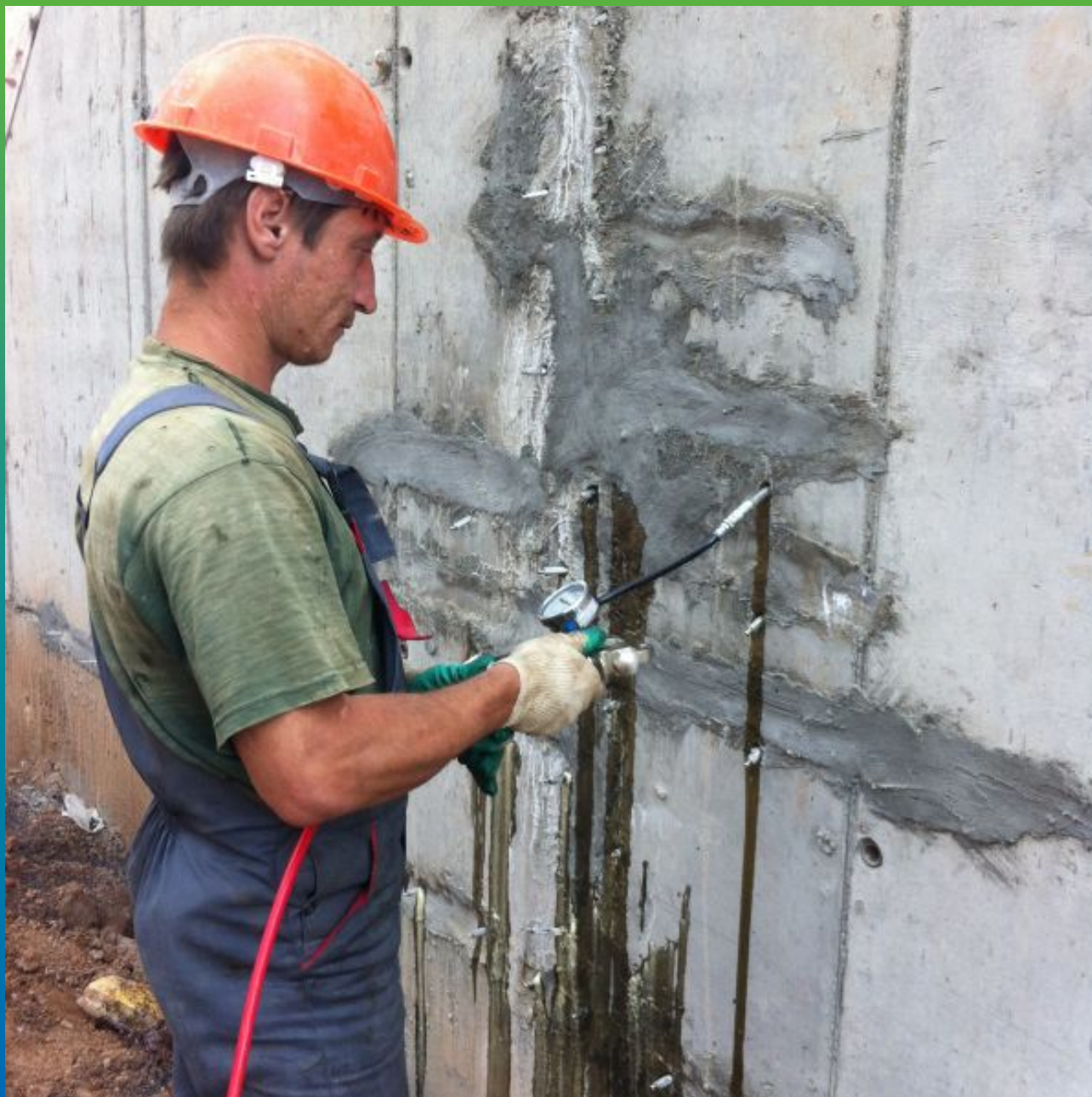
Инъектирование в швы и трещины