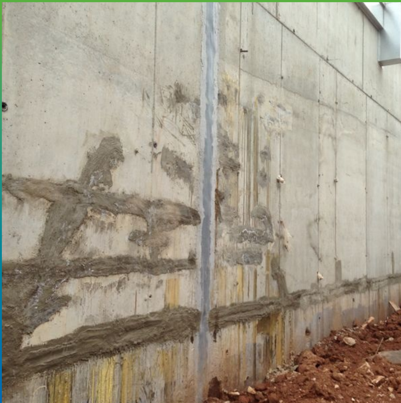
Деформационный шов, выполненный при помощи гидроизоляционной ленты Манодил Про